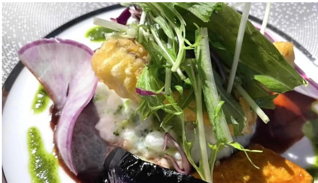
レストラン タガミ 電話