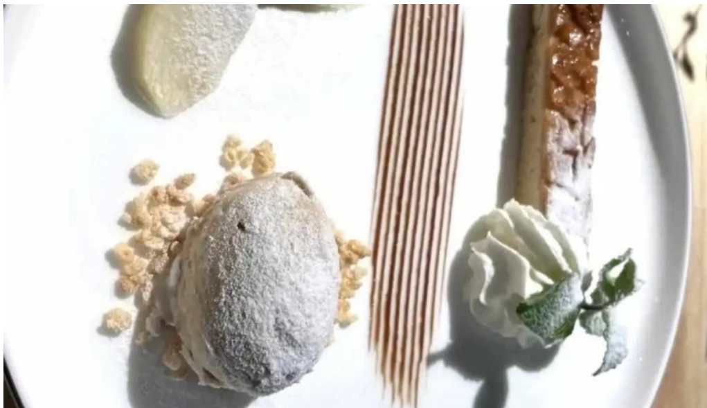
レストランタガミ 最新