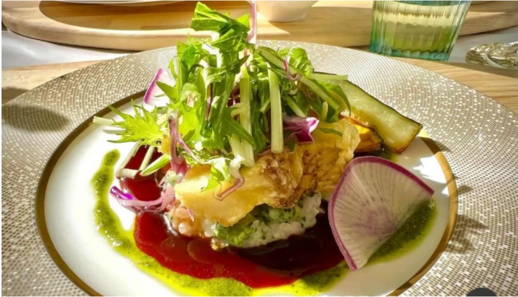
レストラン タガミ 料理飲み物