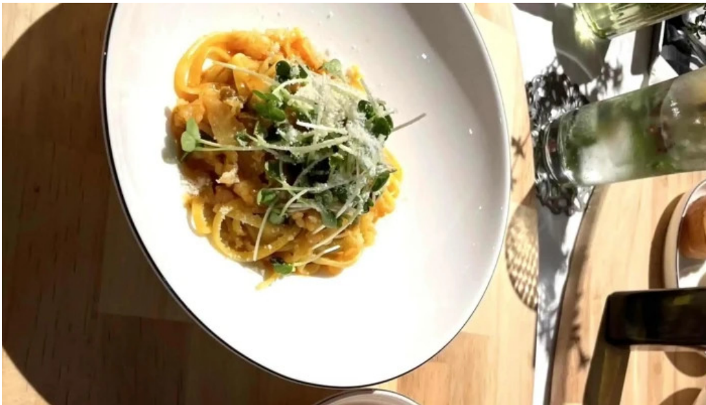
レストラン タガミ エリア