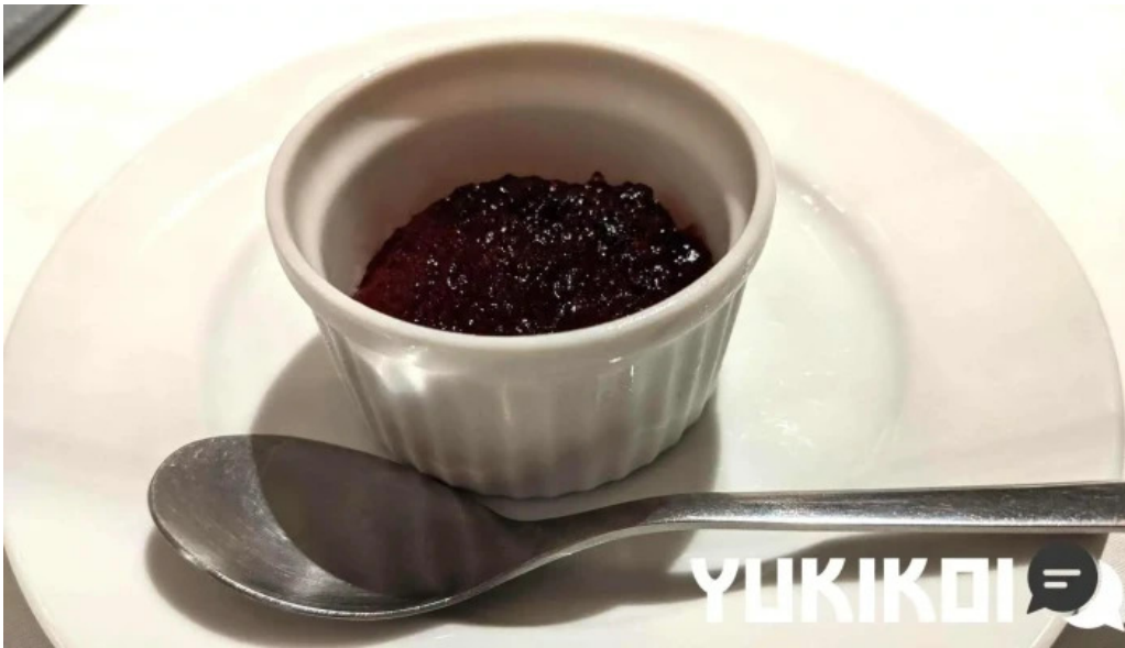
レストラン タガミ パンナコッタ