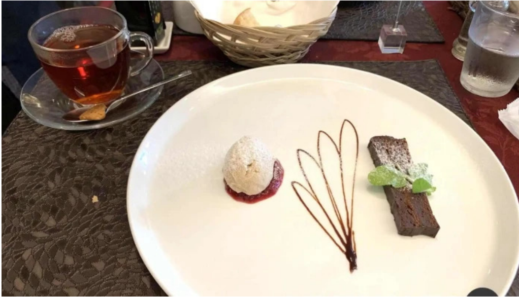
レストラン タガミ ブラウニー