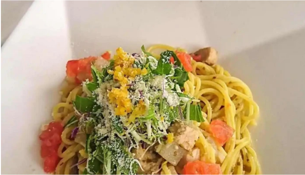
レストラン タガミ スパゲッティ