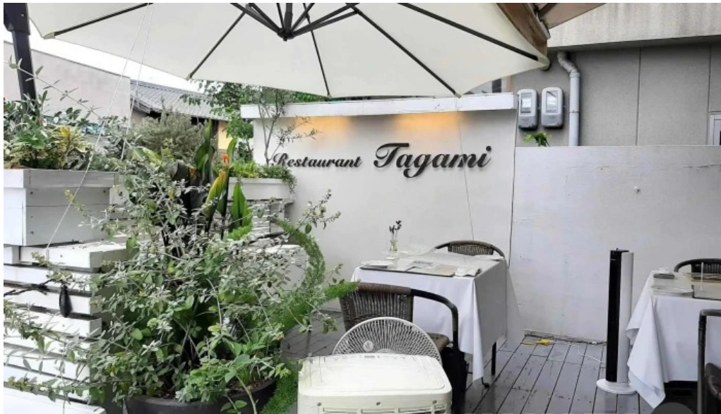
レストランタガミ 雰囲気