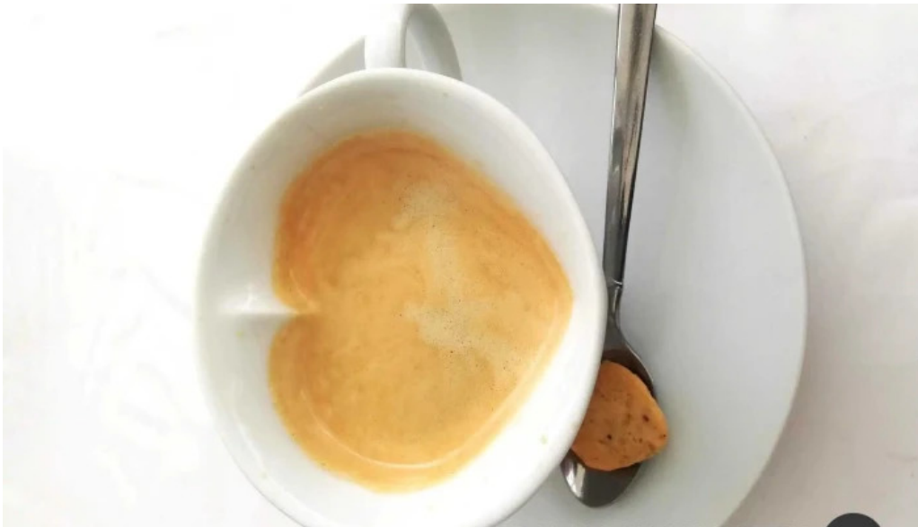
レストラン タガミ エスプレッソ