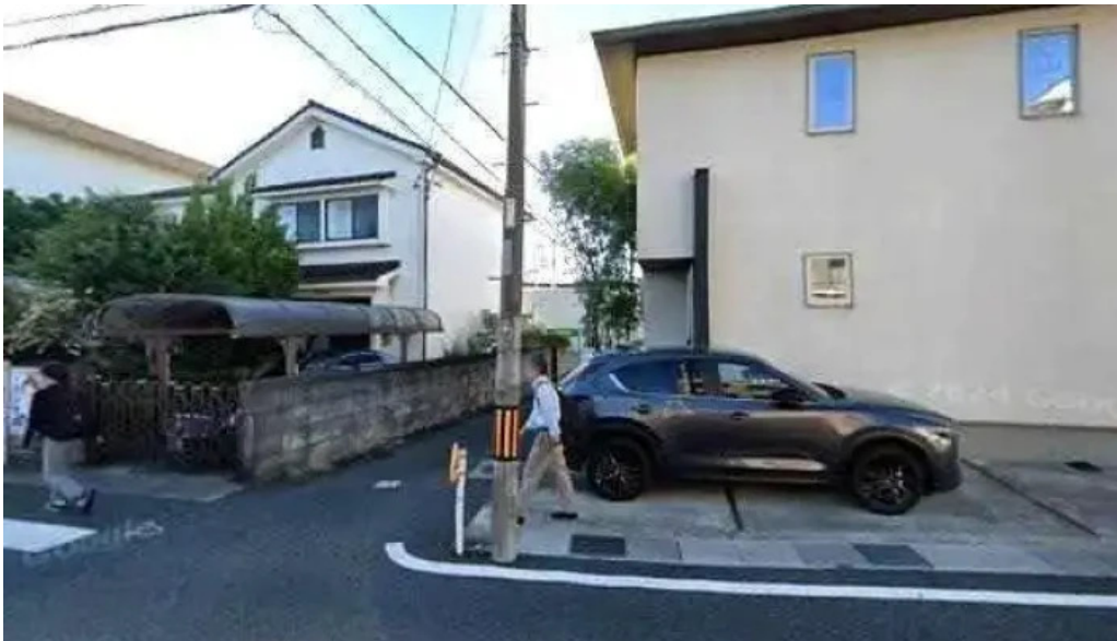
レストラン タガミ 大山崎町