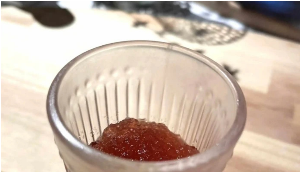
レストランタガミ ロコミ