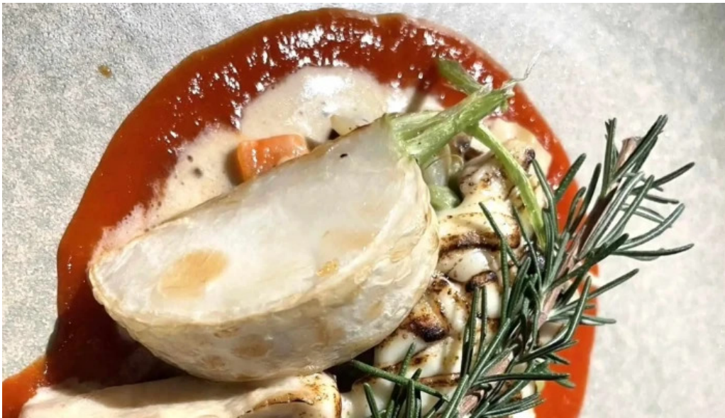
レストラン タガミ スコア