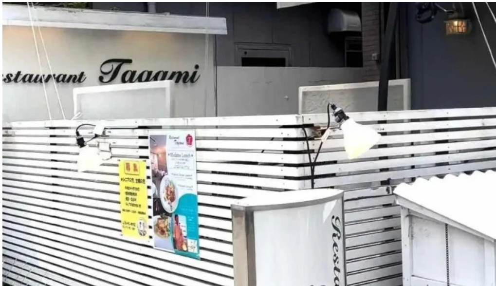
レストランタガミ 動画