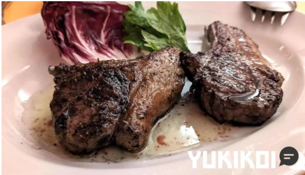
トラットリアデッラランテルナマジカ ステーキ