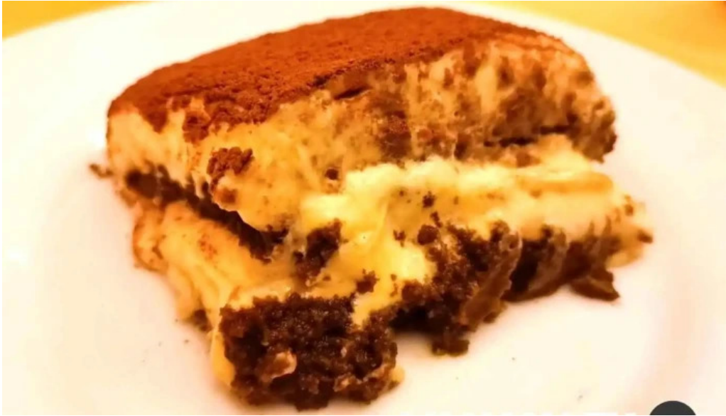
トラットリアデッラランテルナマジカ ティラミス