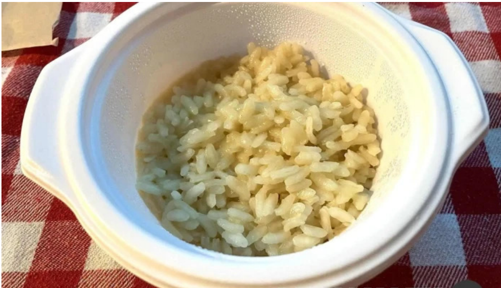
トラットリアデッラランテルナマジカ リゾット