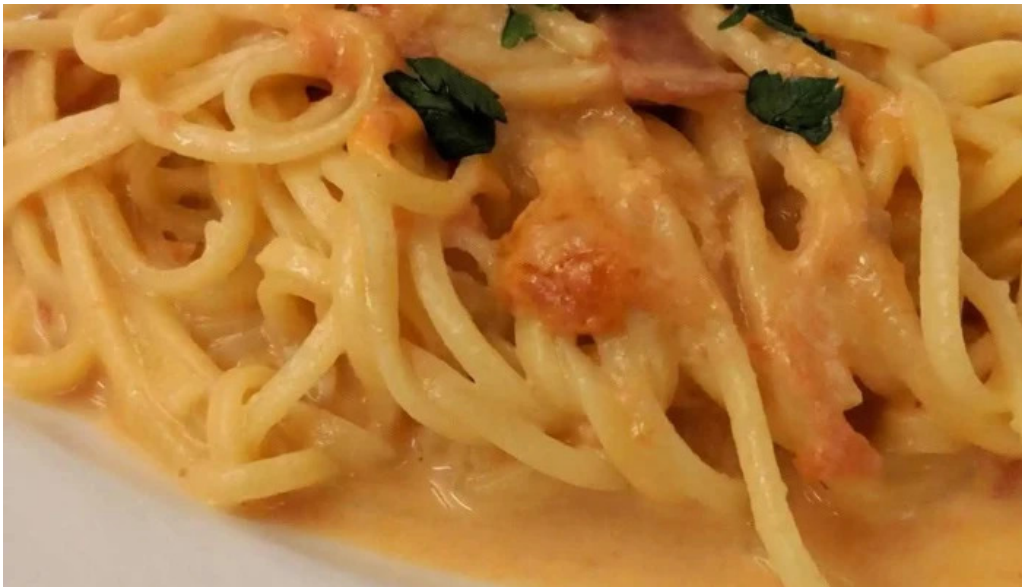
トラットリアデッラランテルナマジカ スパゲッティ