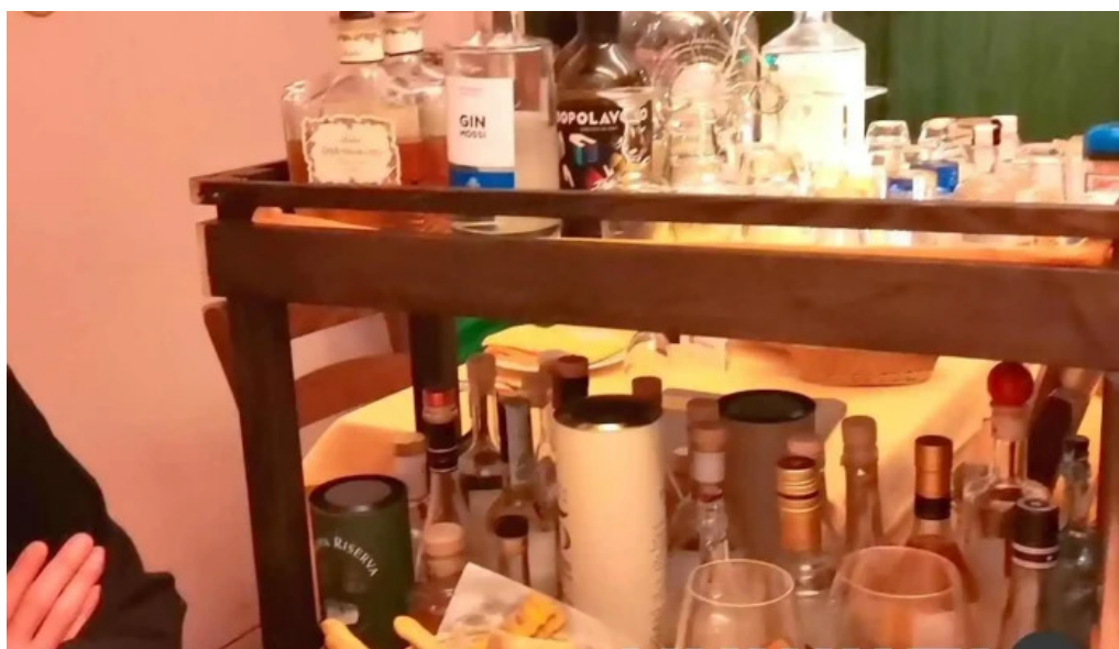
トラットリアデッラランテルナマジカ 雰囲気