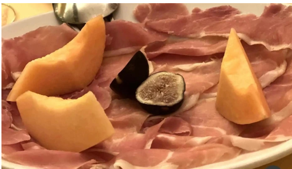
トラットリアデッラランテルナマジカ アンティパスト