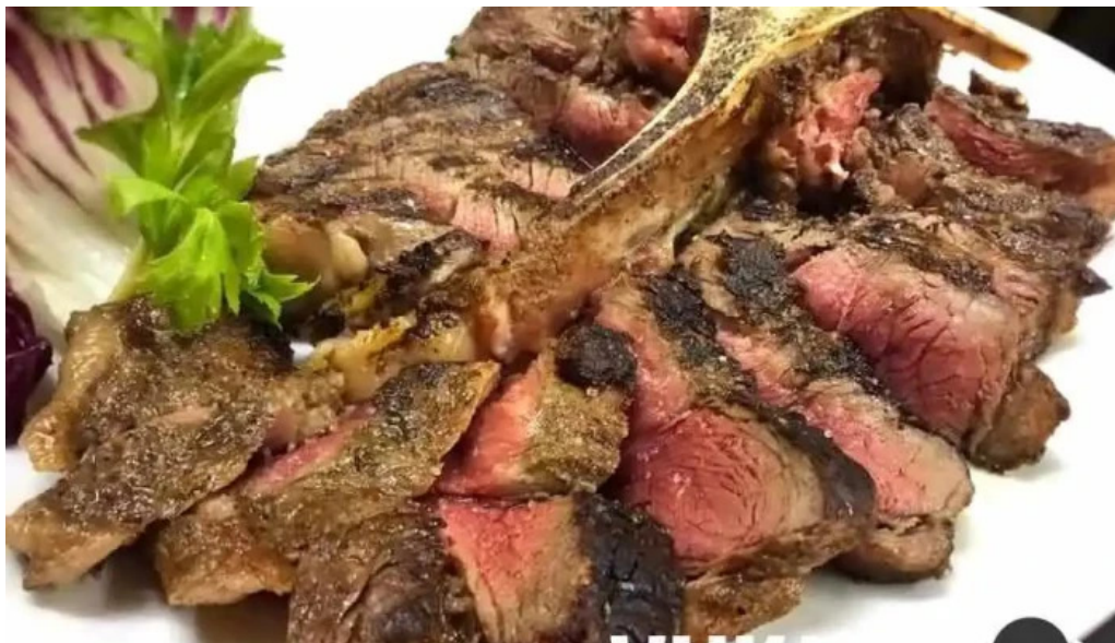
トラットリアデッラランテルナマジカ 料理飲み物