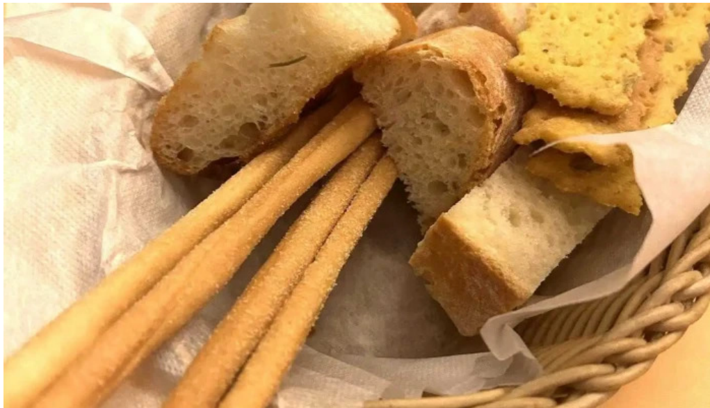
トラットリアデッラランテルナマジカ ガーリックトースト