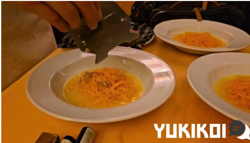
トラットリアデッラランテルナマジカ 最新