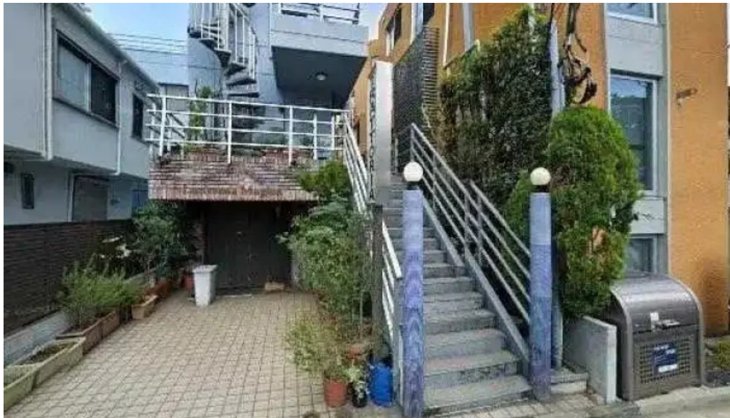
トラットリアデッラランテルナマジカ 品川区