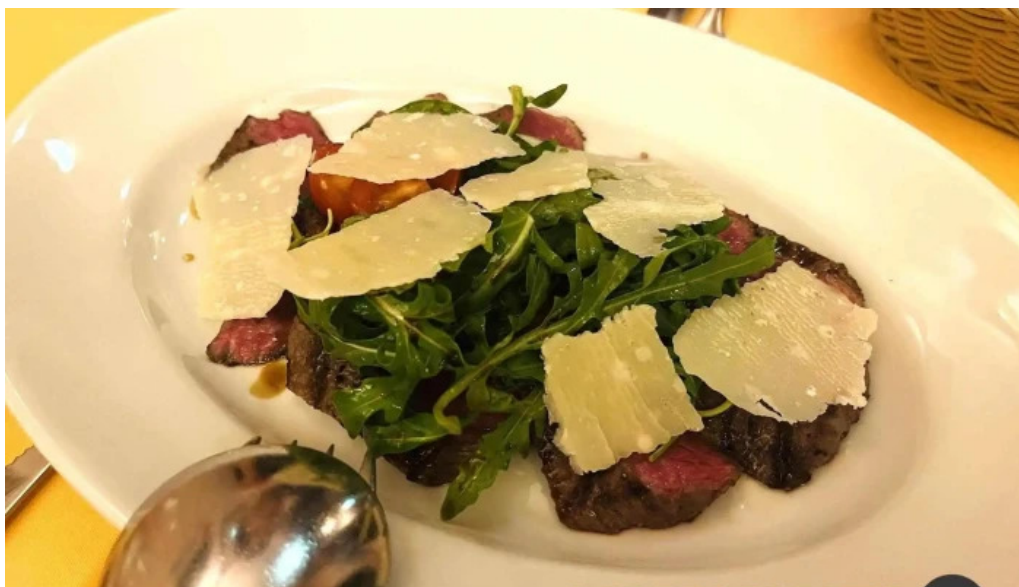
トラットリアデッラランテルナマジカ カルパッチョ