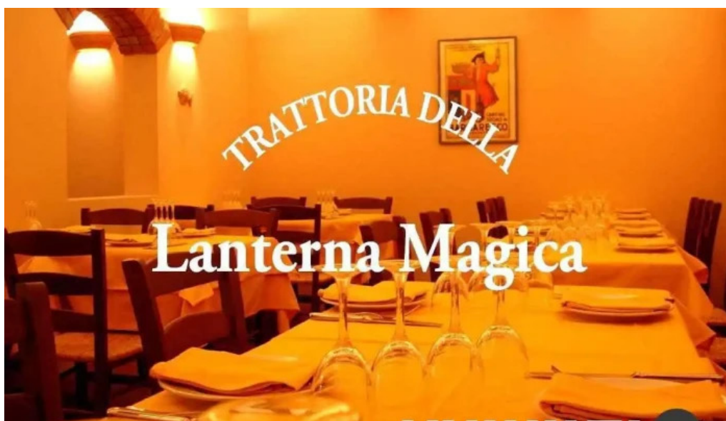
トラットリア・デッラ・ランテルナ・マジカ 品川区