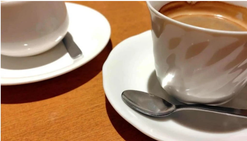
スパゲッティ壁の穴 浦和店 動画