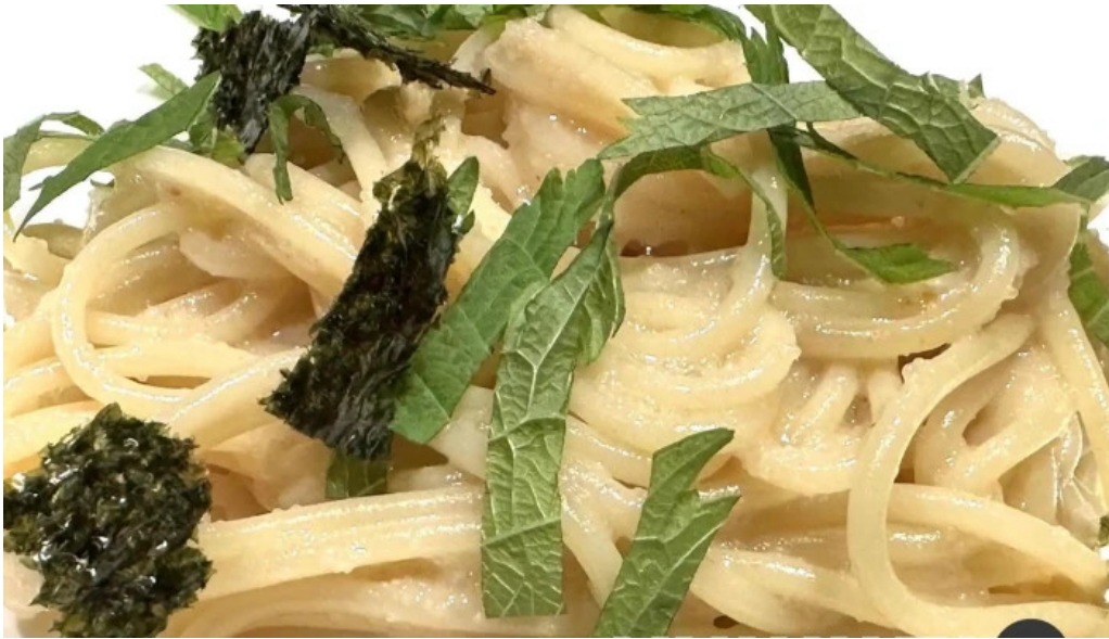
スパゲッティ壁の穴 浦和店 スパゲッティ