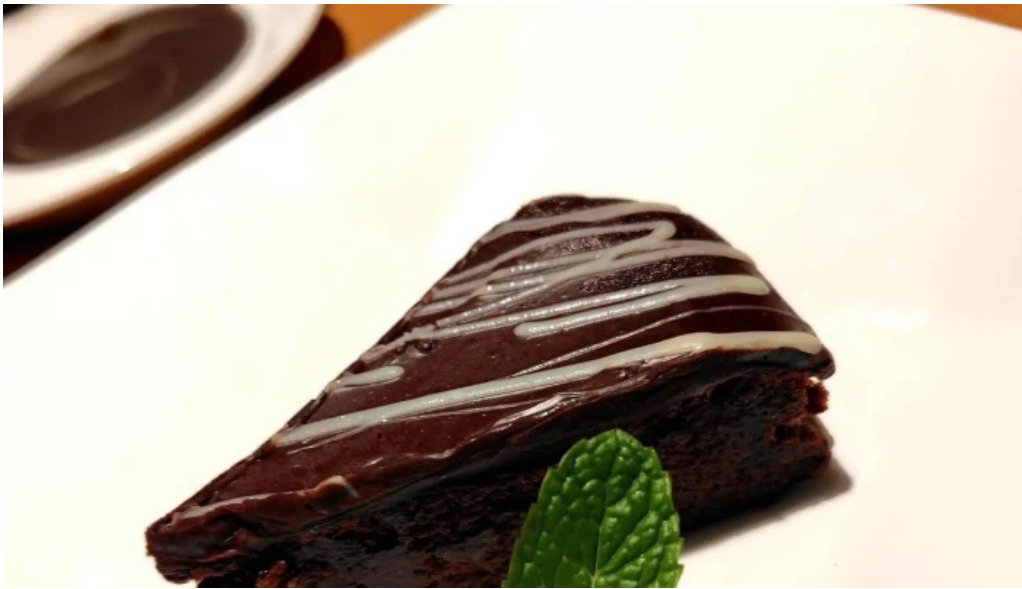
スパゲッティ壁の穴 浦和店 ウェブサイト