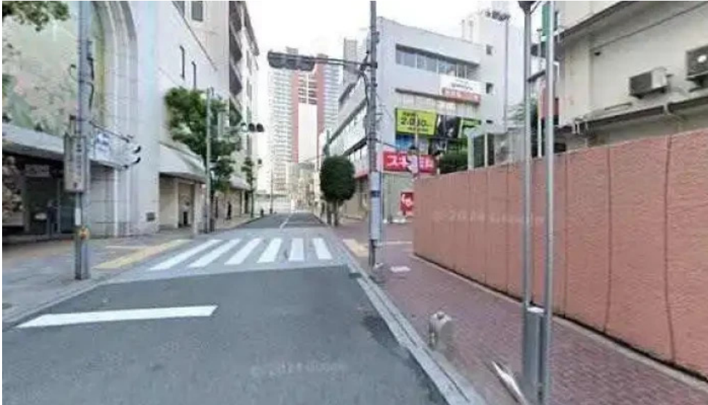
スパゲッティ壁の穴 浦和店 さいたま市