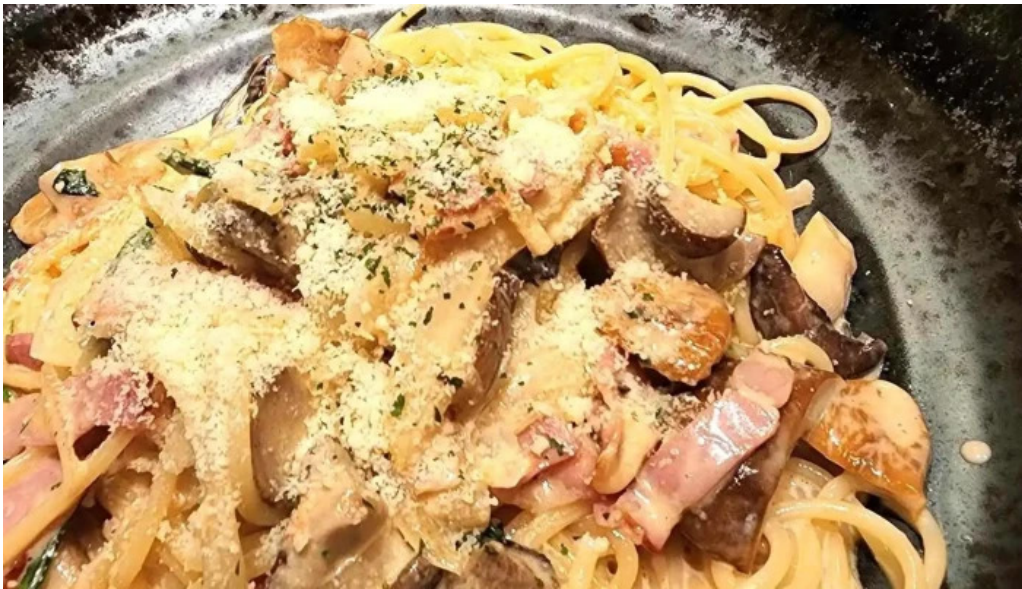
スパゲッティ壁の穴 浦和店 カルボナーラ