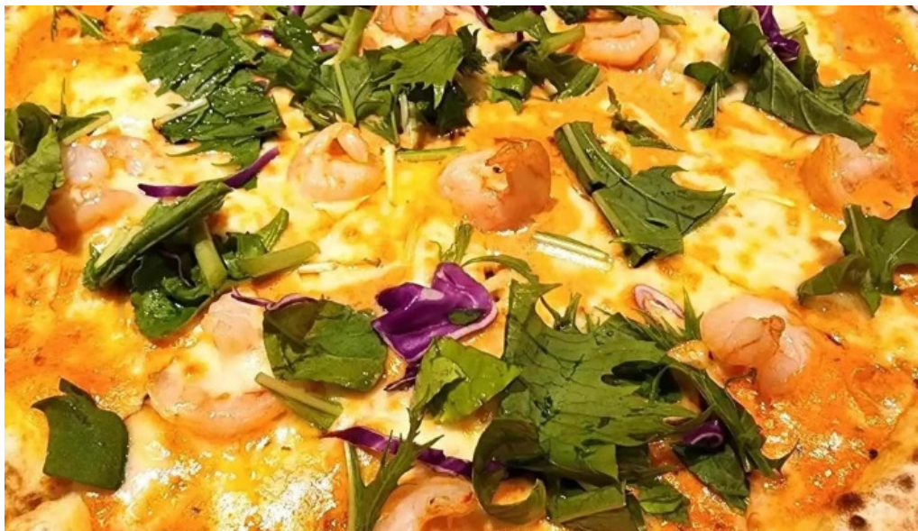
スパゲッティ壁の穴 浦和店 ピザ