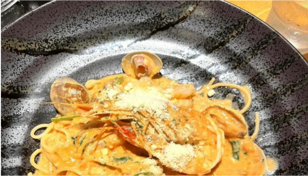
スパゲッティ壁の穴 浦和店 番号