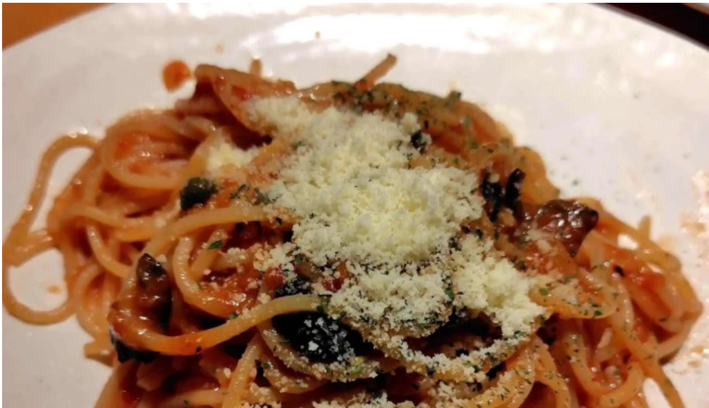
スパゲッティ壁の穴 浦和店 どこ