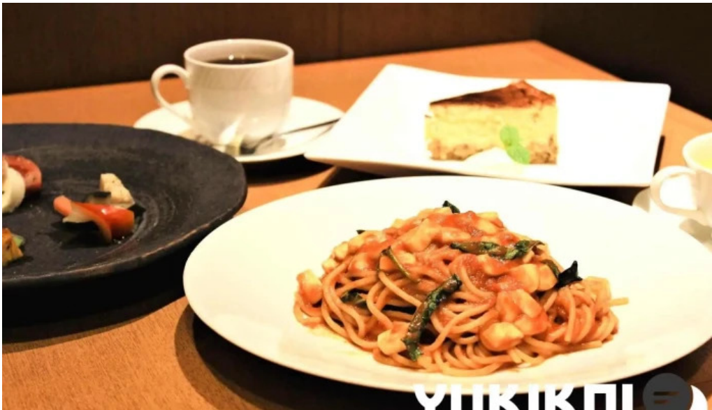
スパゲッティ壁の穴 浦和店 料理飲み物