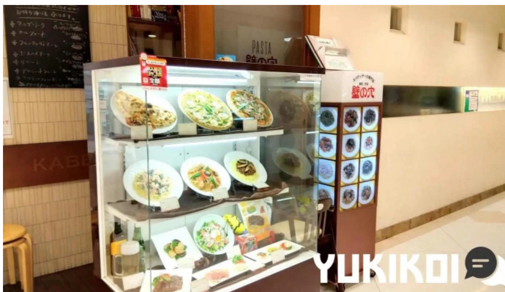
スパゲッティ壁の穴 浦和店 雰囲気