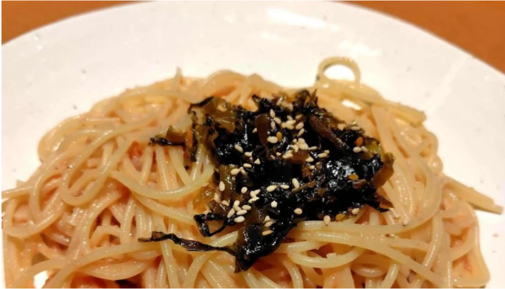
スパゲッティ壁の穴 浦和店 営業中