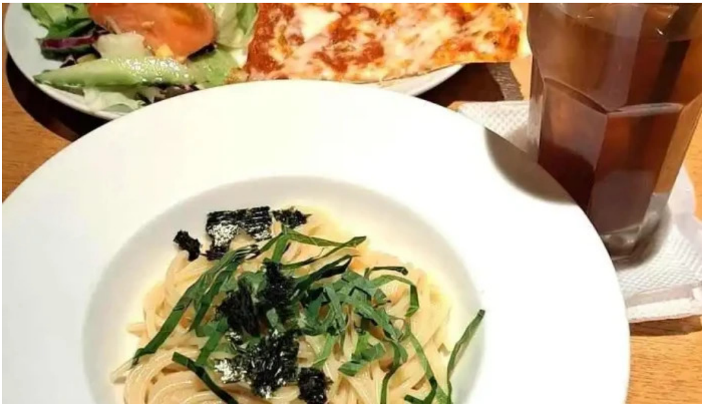
スパゲッティ壁の穴 浦和店 最新