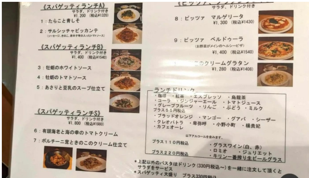
スパゲッティ壁の穴 浦和店 メニュー