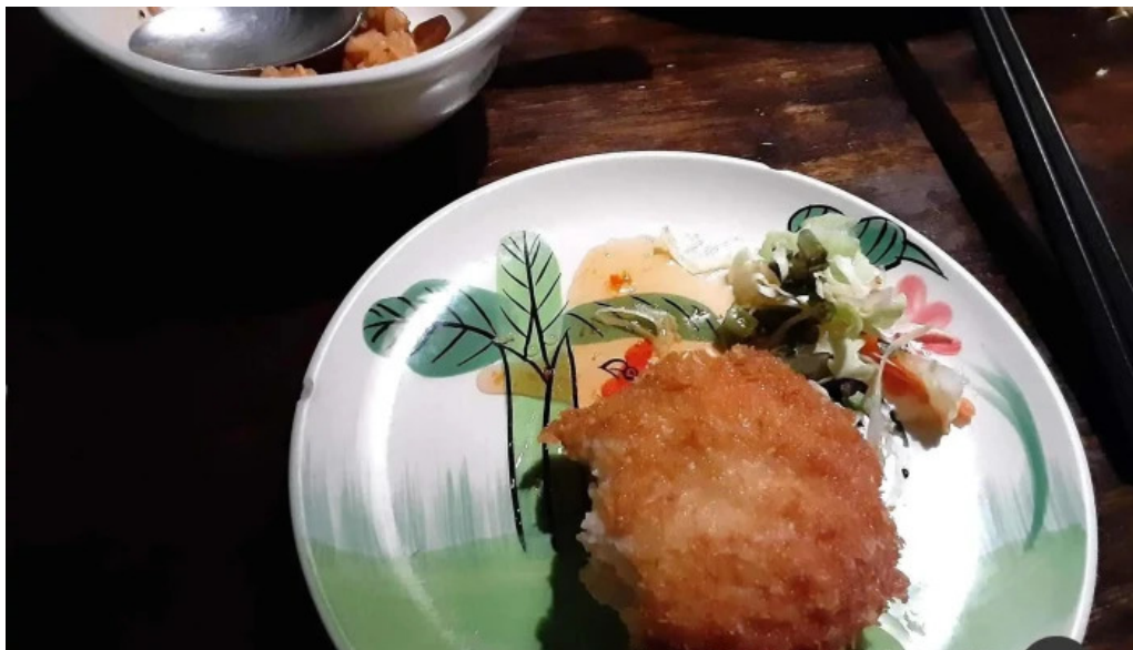
タイのごはんバリのごはん 熱帯食堂 枚方店 コロッケ