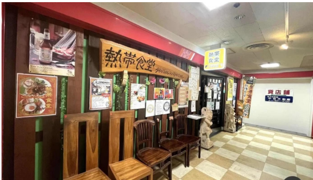
タイのごはんバリのごはん 熱帯食堂 枚方店 雰囲気