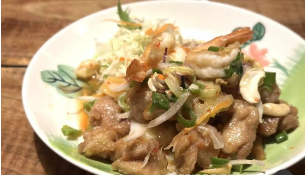
タイのごはんバリのごはん 熱帯食堂 枚方店 パッキーマオ