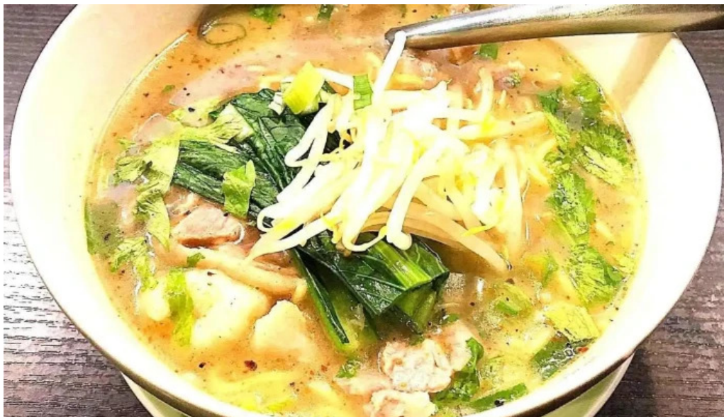
タイのごはんバリのごはん 熱帯食堂 枚方店 ラーメン