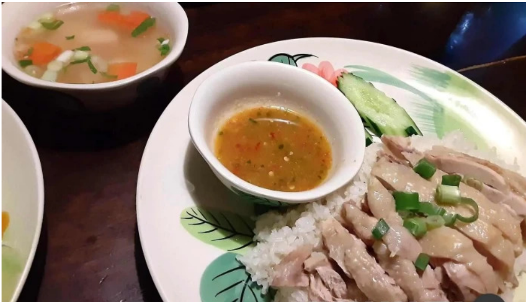
タイのごはんバリのごはん 熱帯食堂 枚方店 海南鶏飯