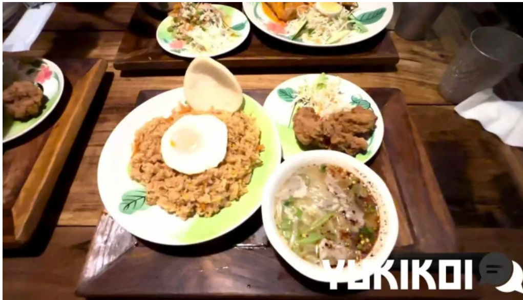
タイのごはんバリのごはん 熱帯食堂 枚方店 動画