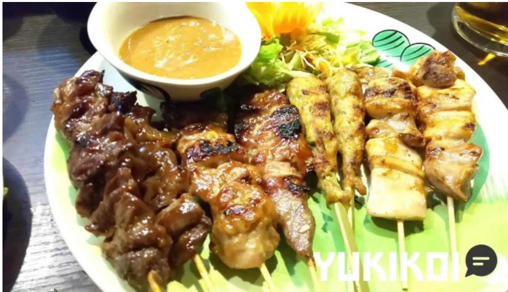
タイのごはんバリのごはん 熱帯食堂 枚方店 サテ