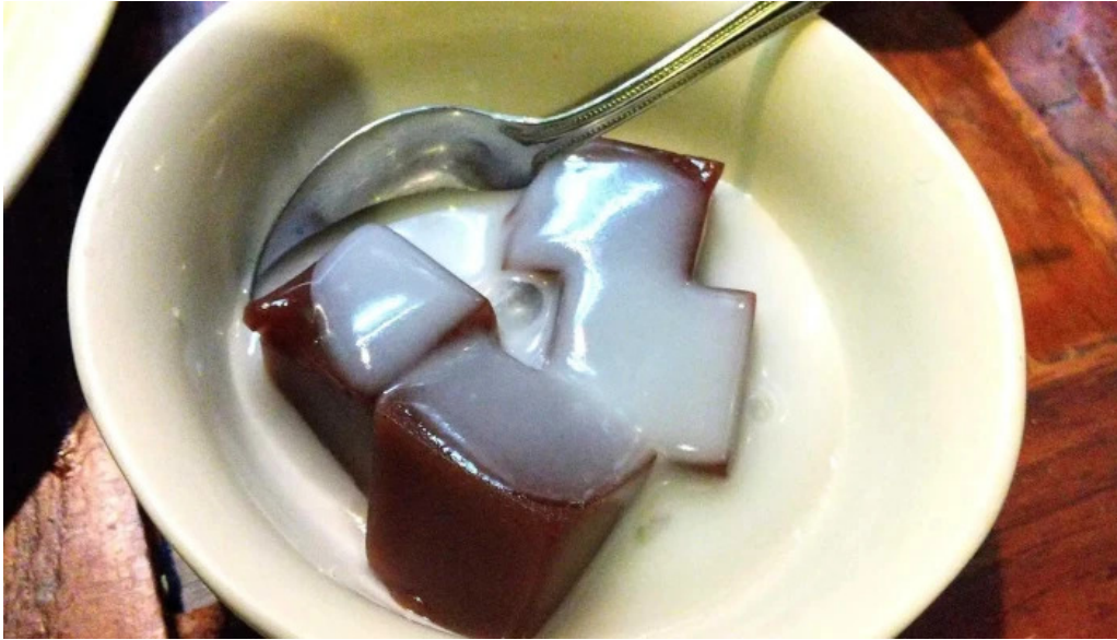
タイのごはんバリのごはん 熱帯食堂 枚方店 最新