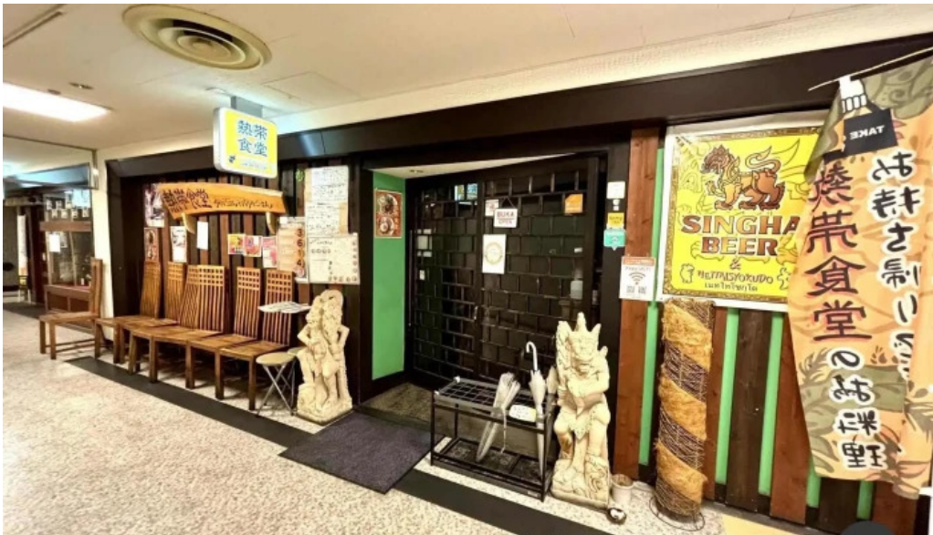
タイのごはんバリのごはん 熱帯食堂 枚方店 枚方市