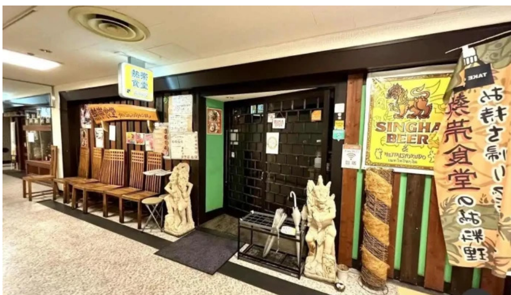
タイのごはんバリのごはん 熱帯食堂 枚方店 枚方市