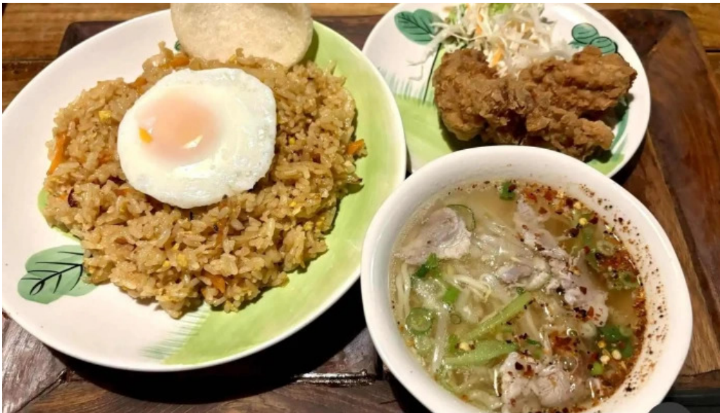
タイのごはんバリのごはん 熱帯食堂 枚方店 ナシゴレン