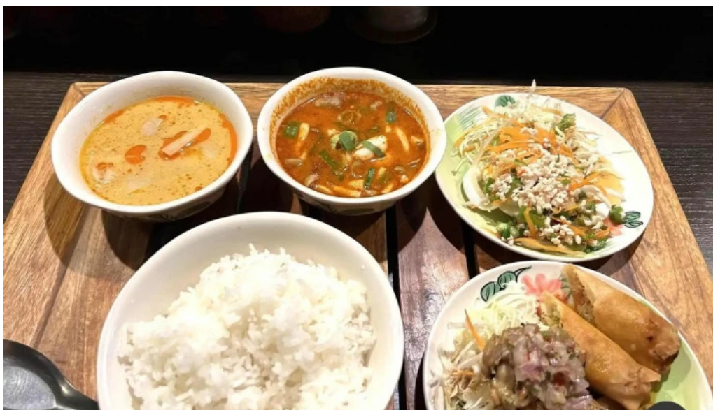
タイのごはんバリのごはん 熱帯食堂 枚方店 カレー