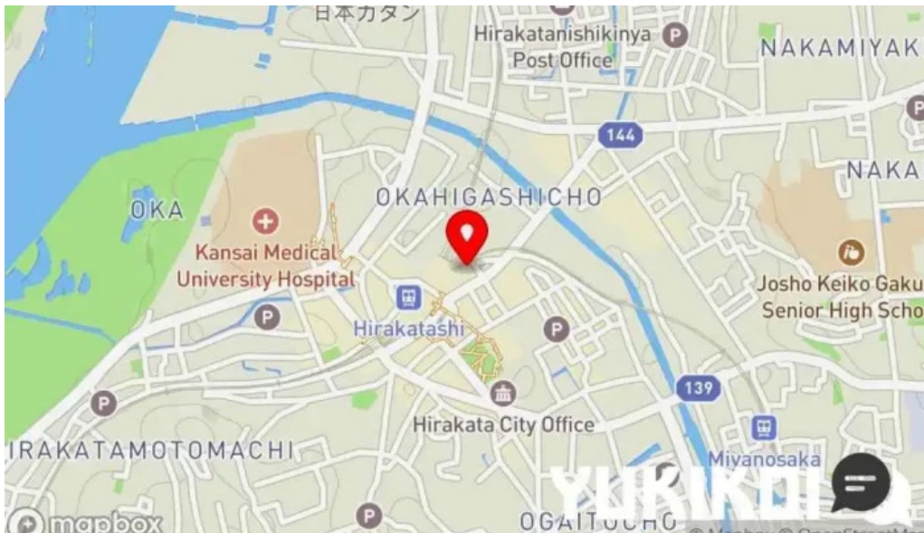
タイのごはんバリのごはん 熱帯食堂 枚方店 地図