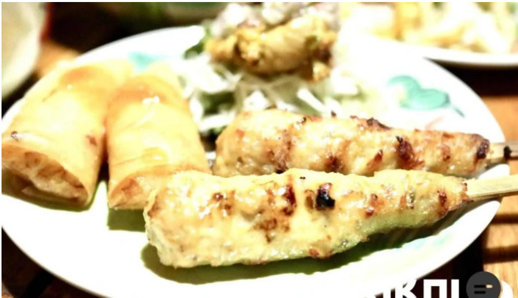
タイのごはんバリのごはん 熱帯食堂 枚方店 春巻き