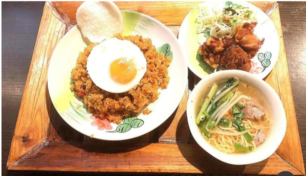
タイのごはんバリのごはん 熱帯食堂 枚方店 料理飲み物