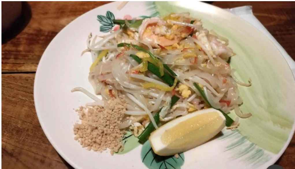
タイのごはんバリのごはん 熱帯食堂 枚方店 パットアイ