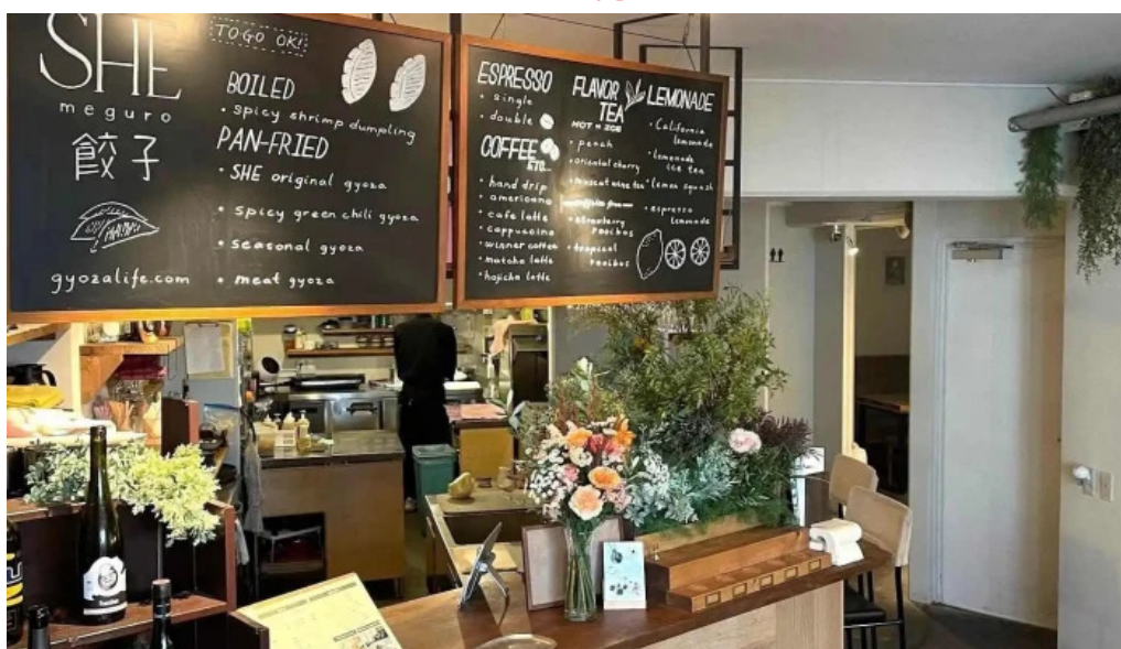
She meguro 雰囲気