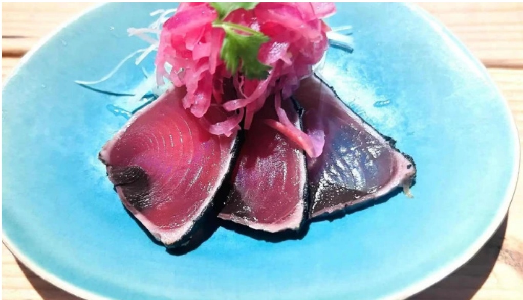
She meguro カタログ