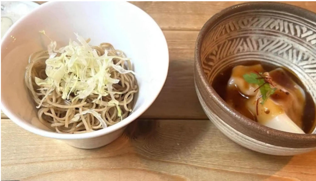
She meguro コメント