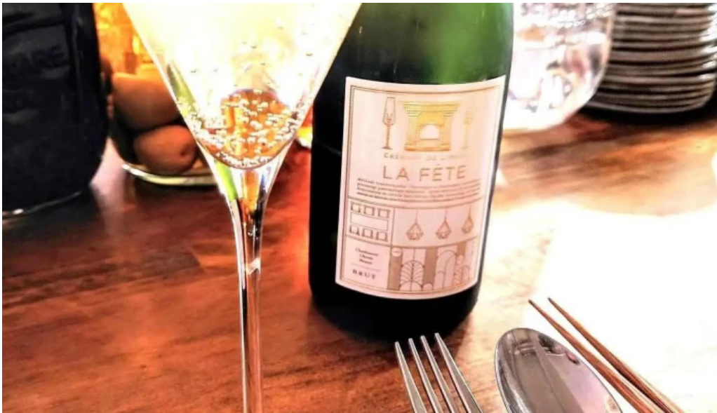
She meguro ワイン