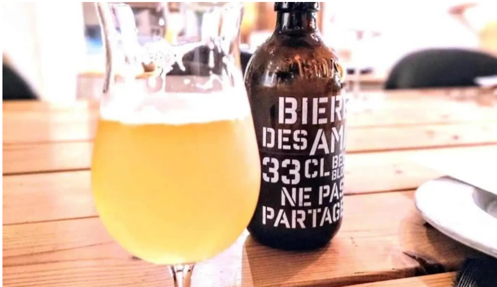
She meguro ビール