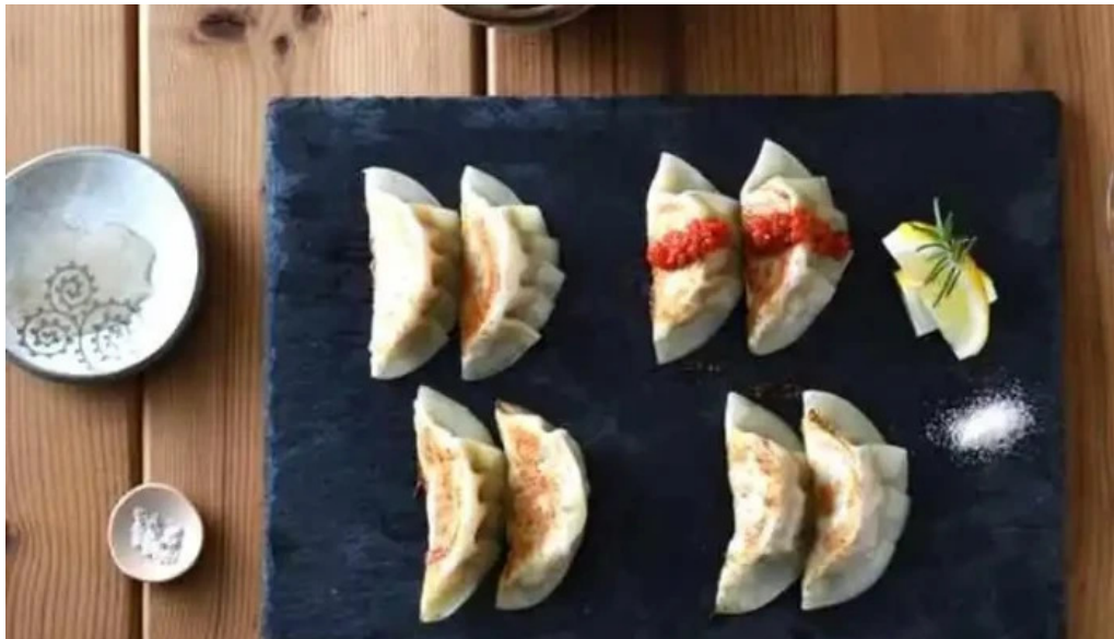
She meguro オーナー提供