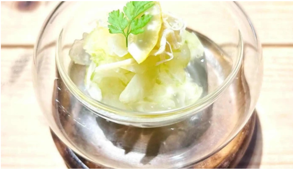
She meguro 住所