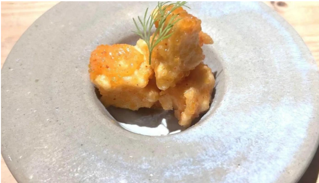
She meguro 營業中