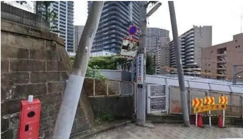
She meguro 品川区