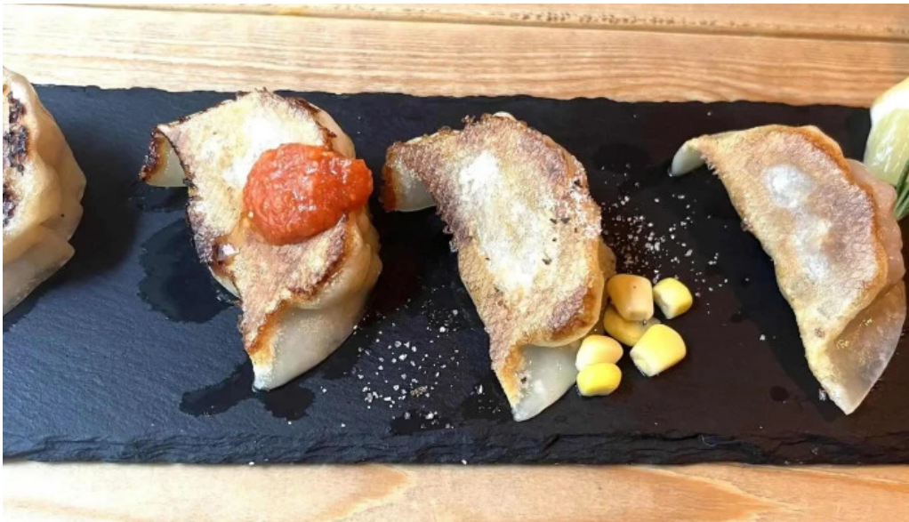
She meguro 營業時間