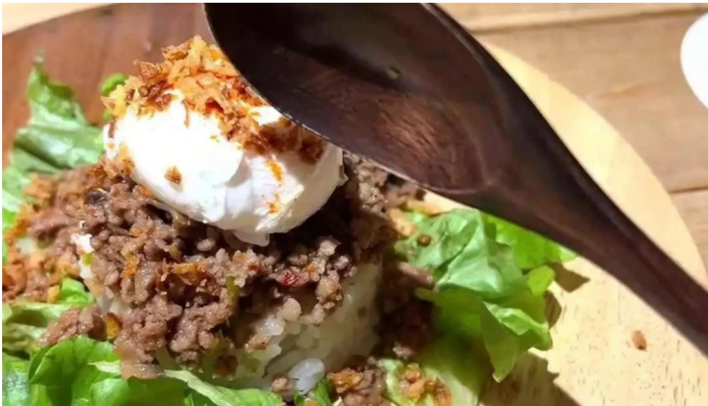
She meguro 動画