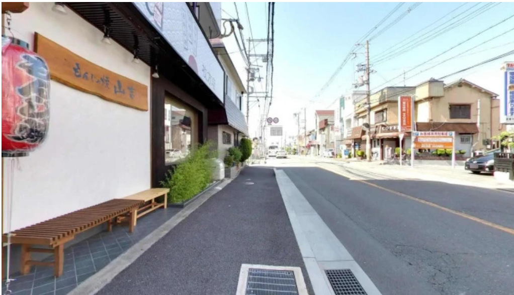
もんじゃ焼 山吉 枚方店 枚方市