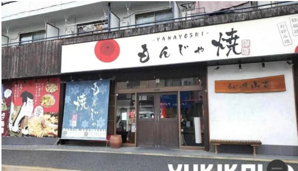
もんじゃ焼 山吉 枚方店 最新