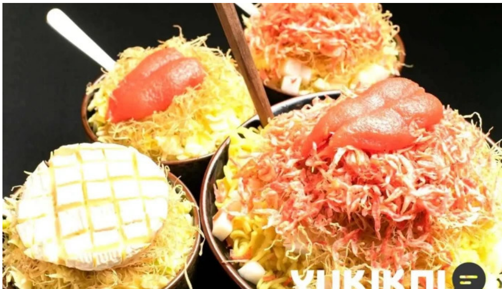
もんじゃ焼 山吉 枚方店 料理飲み物