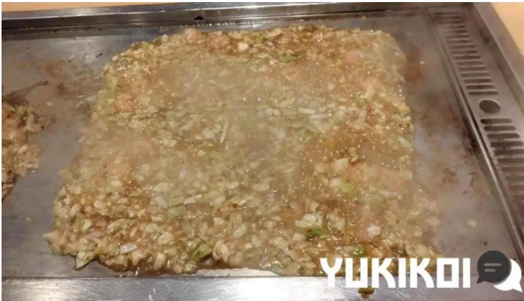
もんじゃ焼 山吉 枚方店 もんじゃ焼き