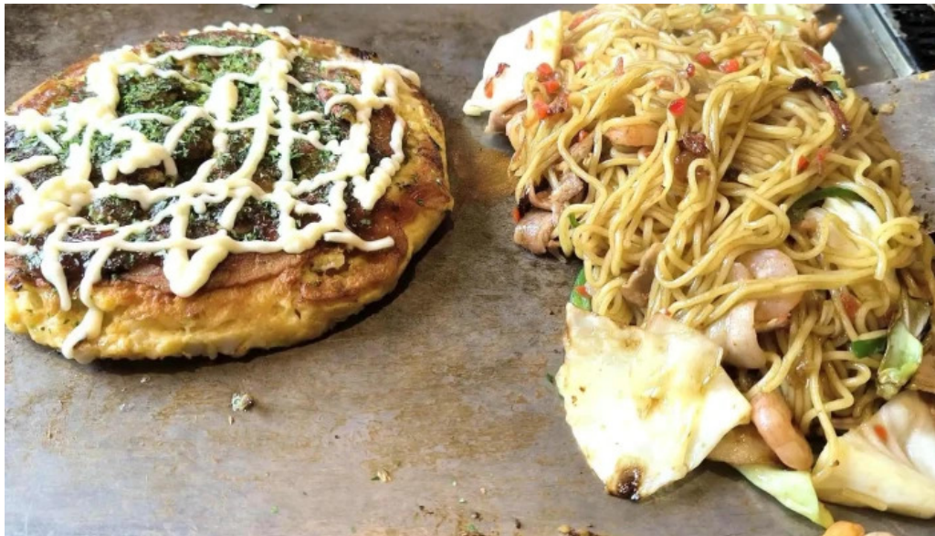
もんじゃ焼 山吉 枚方店 割引