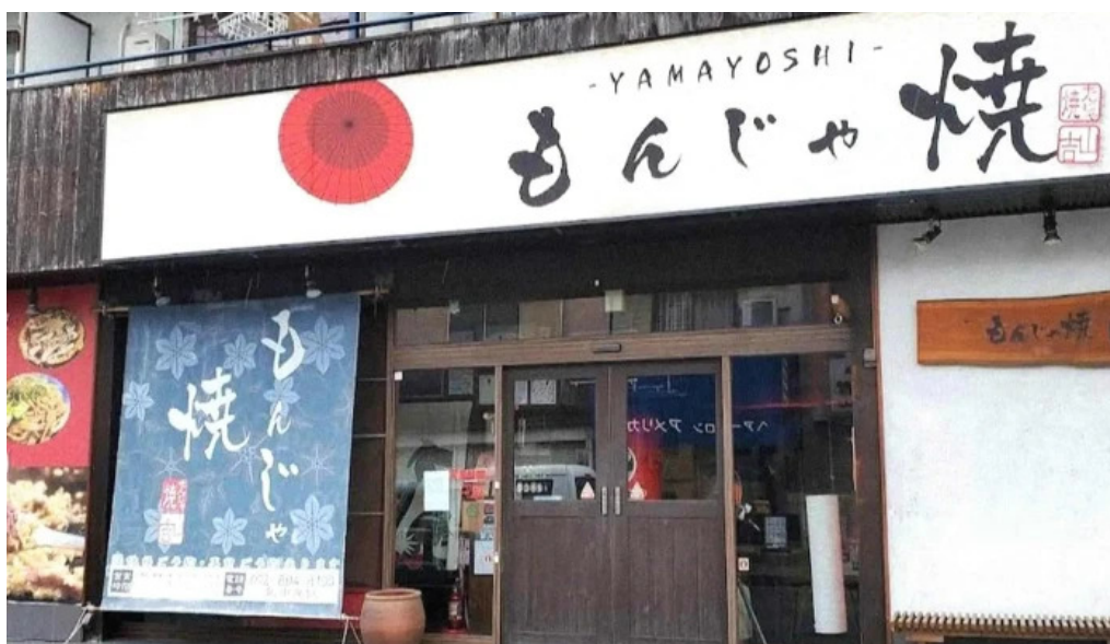
もんじゃ焼 山吉 枚方店 カタログ