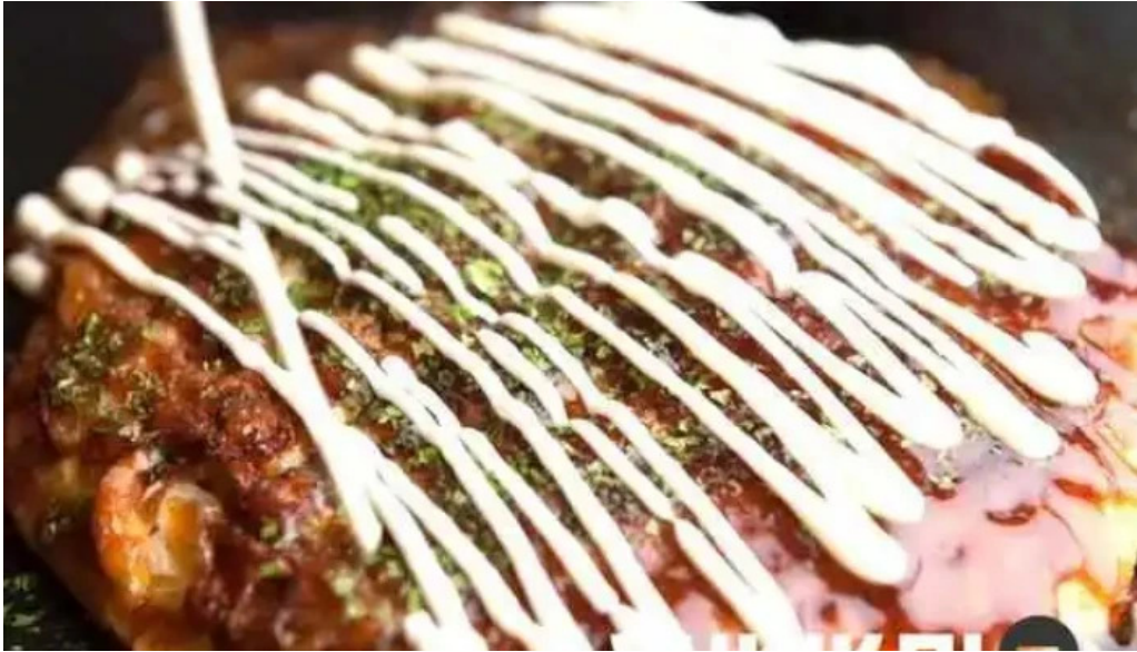
もんじゃ焼 山吉 枚方店 お好み焼き