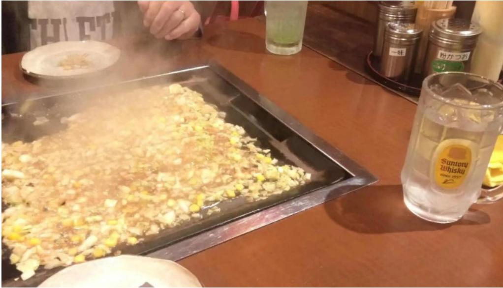
もんじゃ焼 山吉 枚方店 所在地