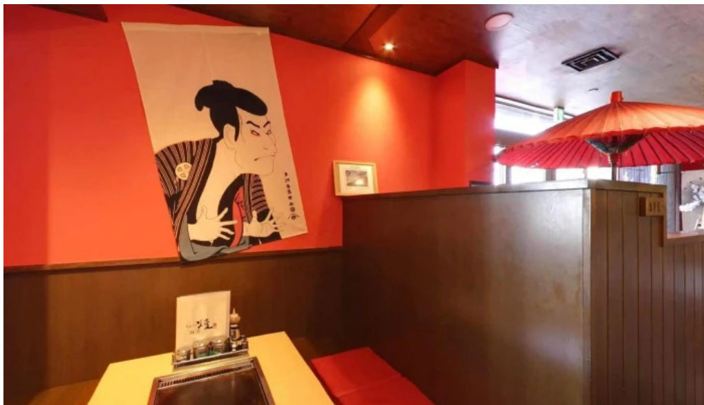
もんじゃ焼 山吉 枚方店 雰囲気