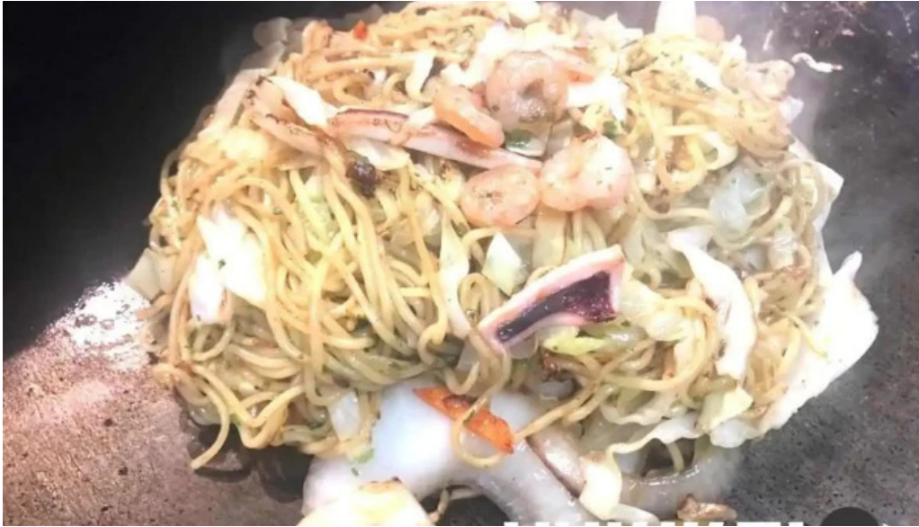
もんじゃ焼 山吉 枚方店 焼きそば