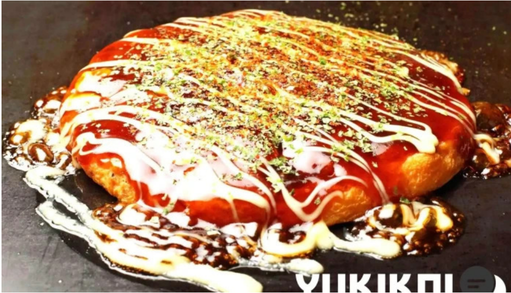
もんじゃ焼 山吉 枚方店