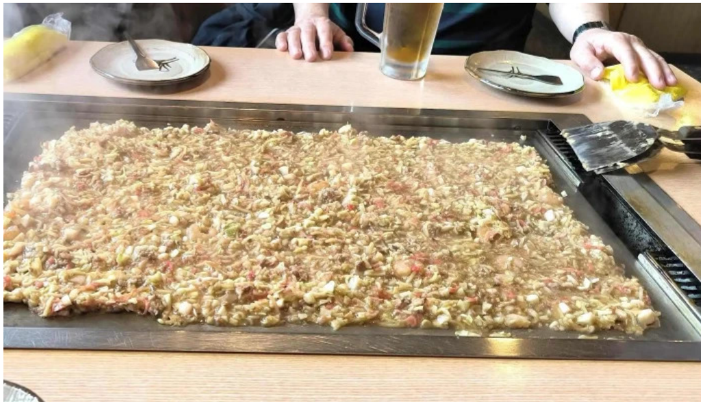
もんじゃ焼 山吉 枚方店 動画