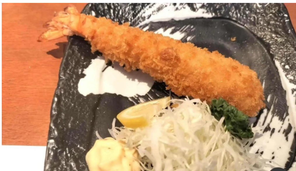
ふく丸 料理飲み物