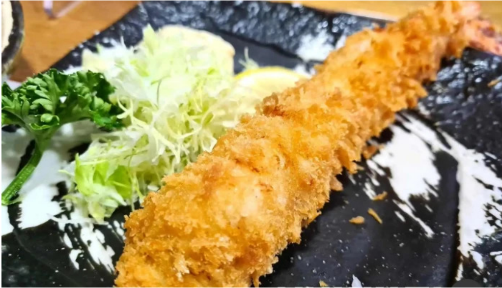
ふく丸 エビフライ