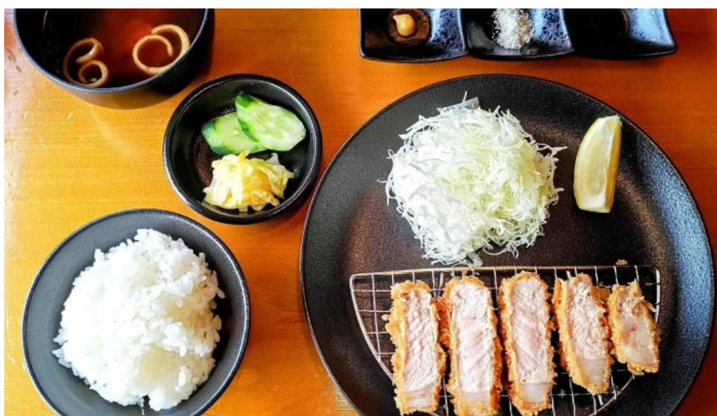
とんかつ 行天 豚カツ