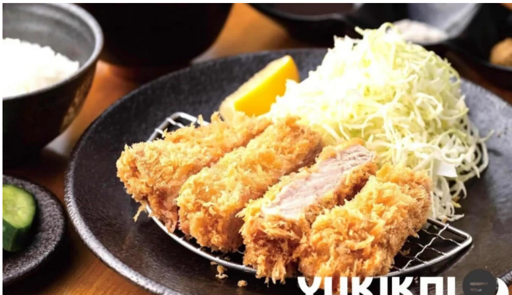
とんかつ行天 料理飲み物