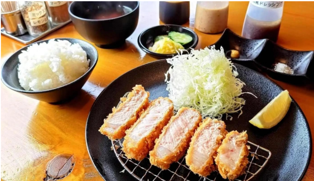
とんかつ 行天 番号