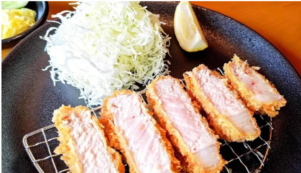
とんかつ 行天 住所