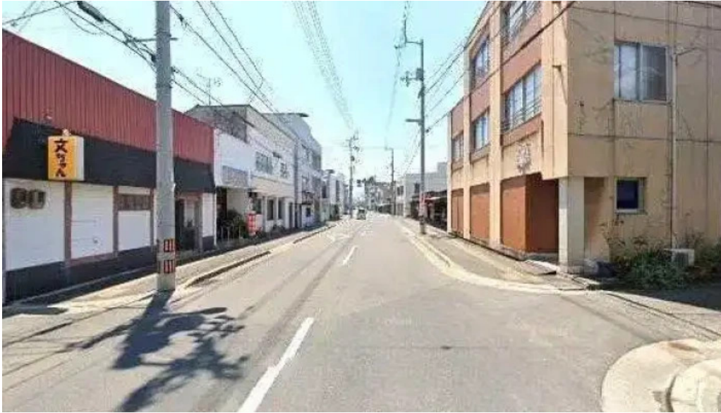
とんかつ 行天 観音寺市