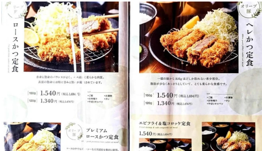
とんかつ 行天 メニュー