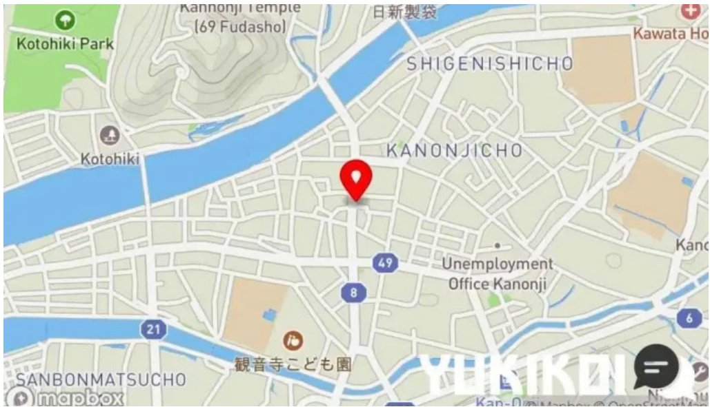
とんかつ行天 地図