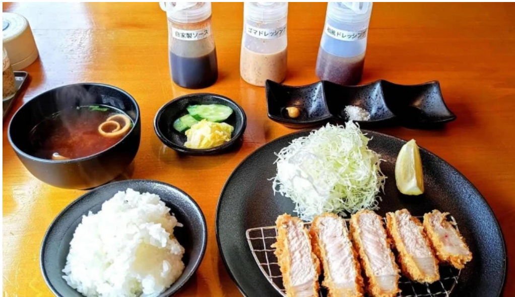
とんかつ行天 動画