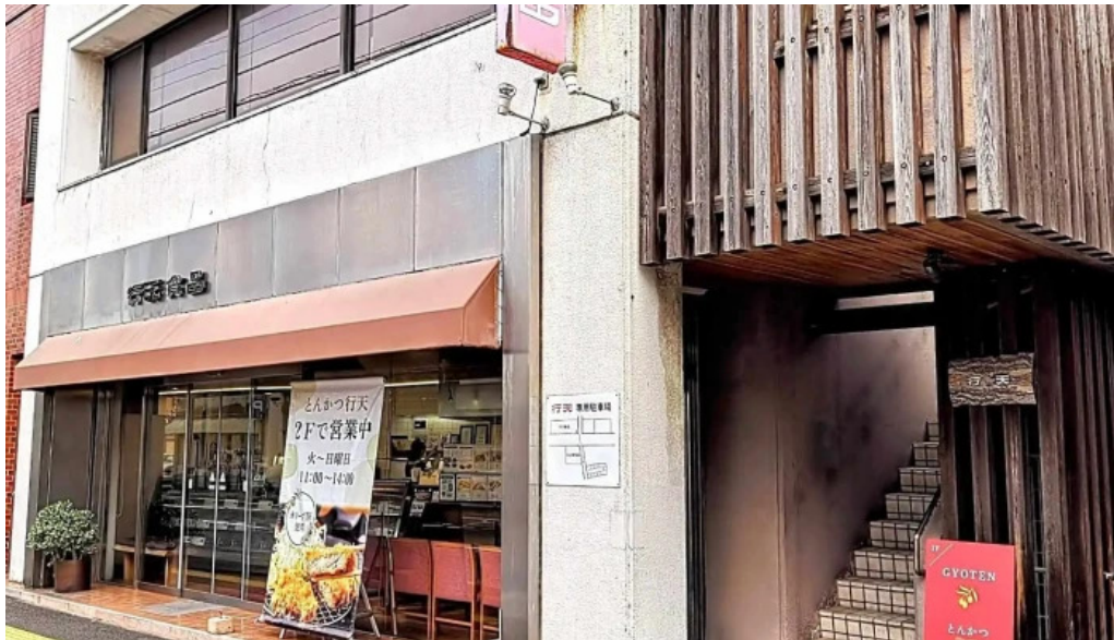
とんかつ行天 最新