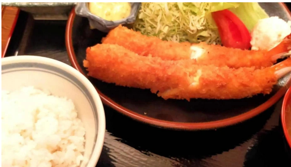
グリルほんだ どこ