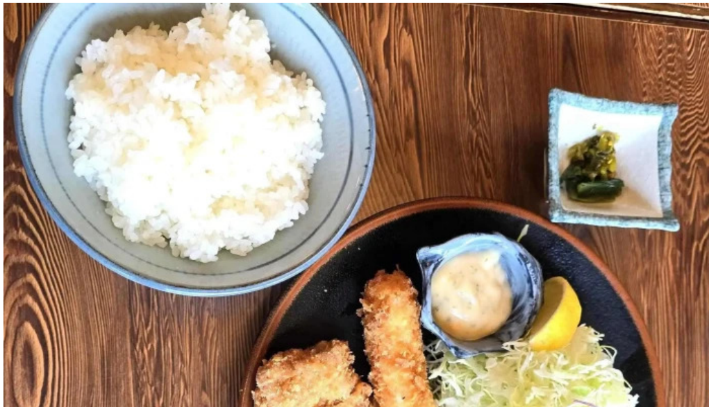
グリル ほんだ 割引