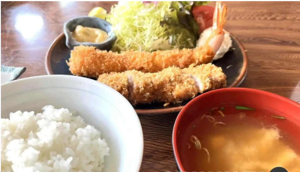
グリルほんだ スープ