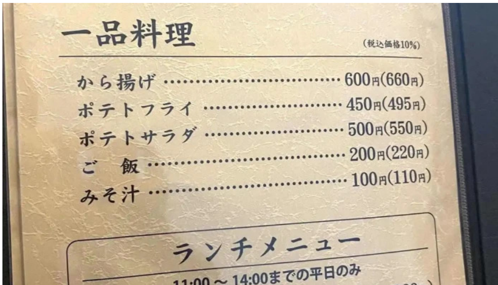
グリル ほんだ メニュー