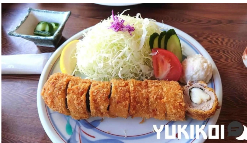
グリル ほんだ 豚カツ