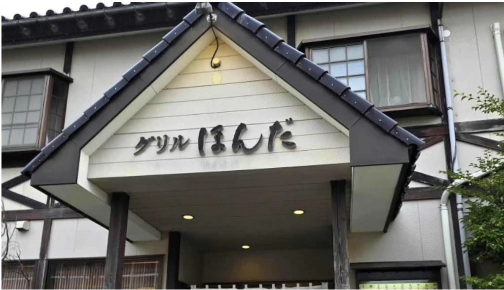
Grill Honda 行き方