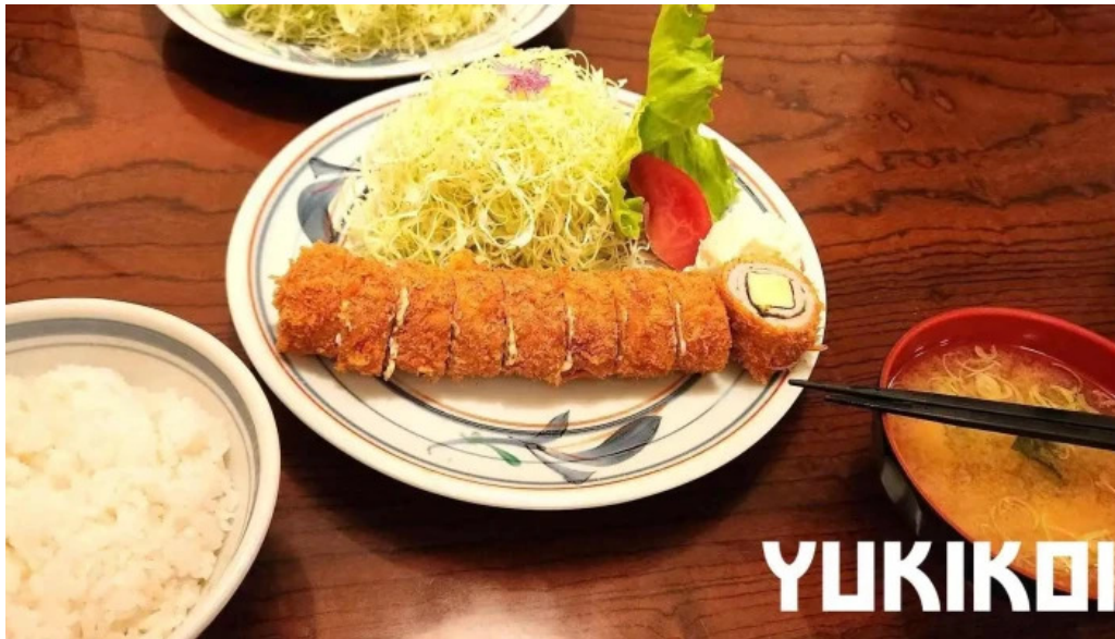
グリルほんだ 最新