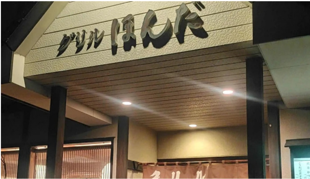
グリルほんだ プロモーション