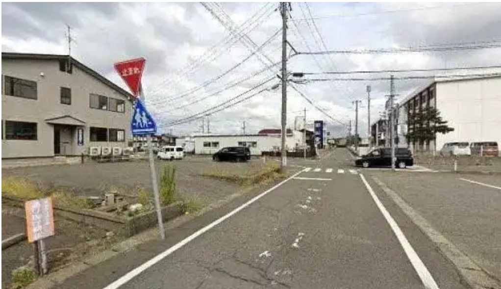
Grill Honda 柏崎市