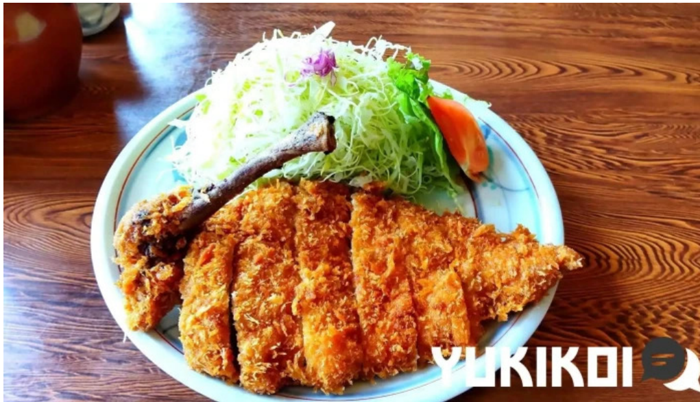
グリル ほんだ 料理飲み物