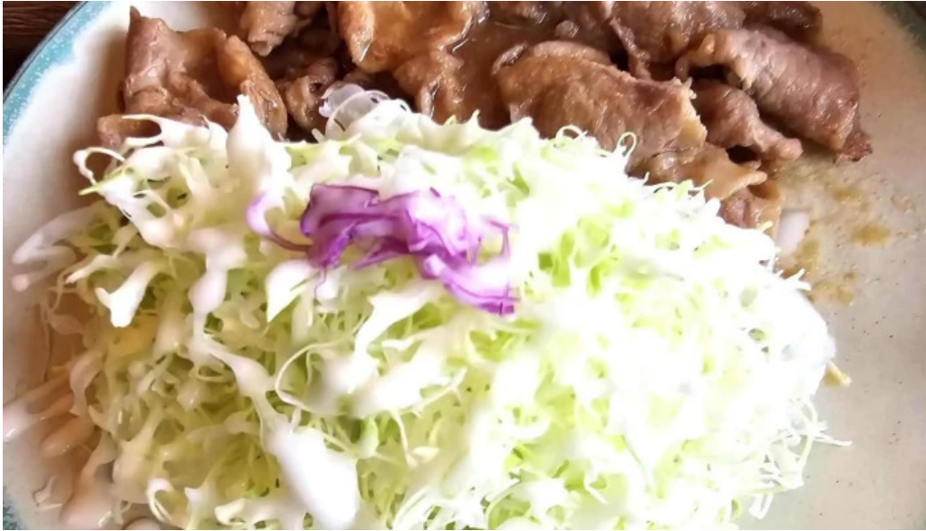
グリル ほんだ 営業時間