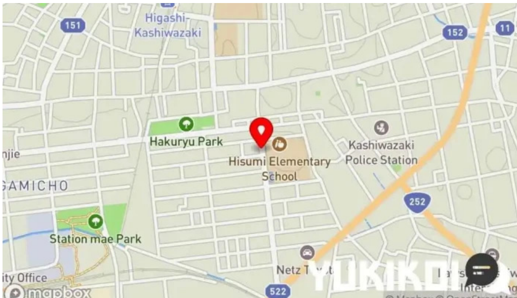
グリル ほんだ 地図