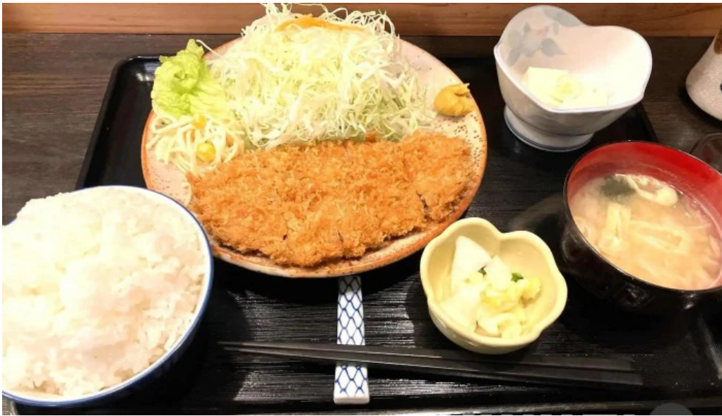
とん亭 料理飲み物