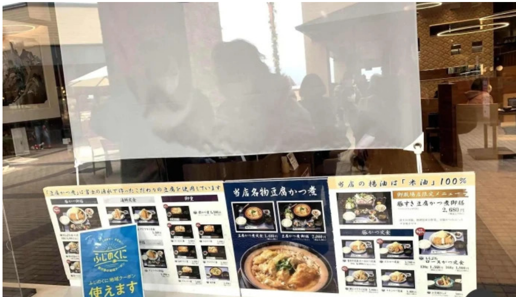
田むら銀かつ亭 御殿場プレミアムアウトレット店 メニュー