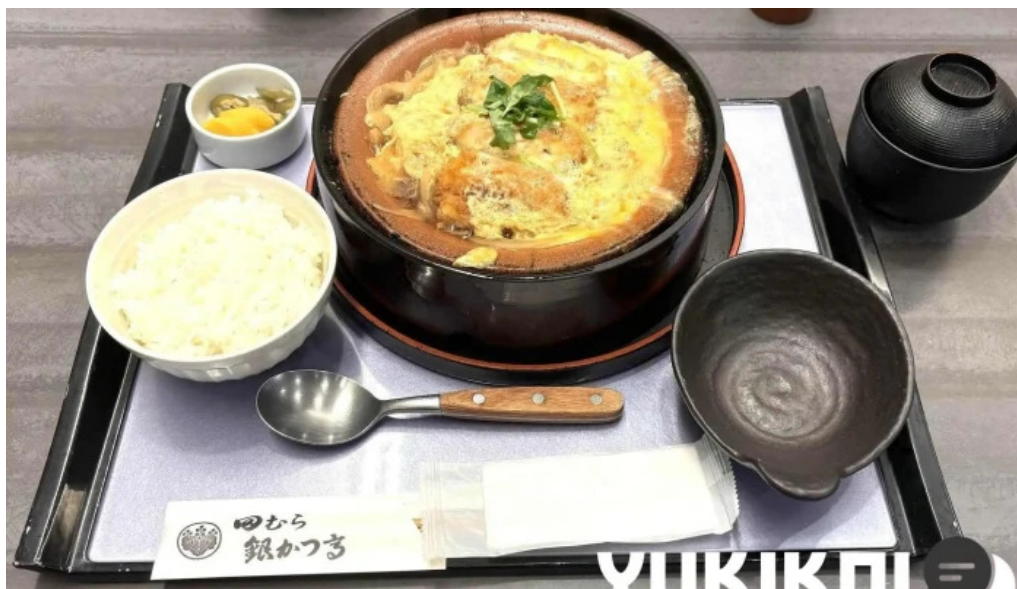
田むら銀かつ亭 御殿場プレミアムアウトレット店 麺