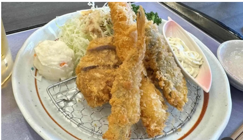
田むら銀かつ亭 御殿場プレミアムアウトレット店 エビフライ