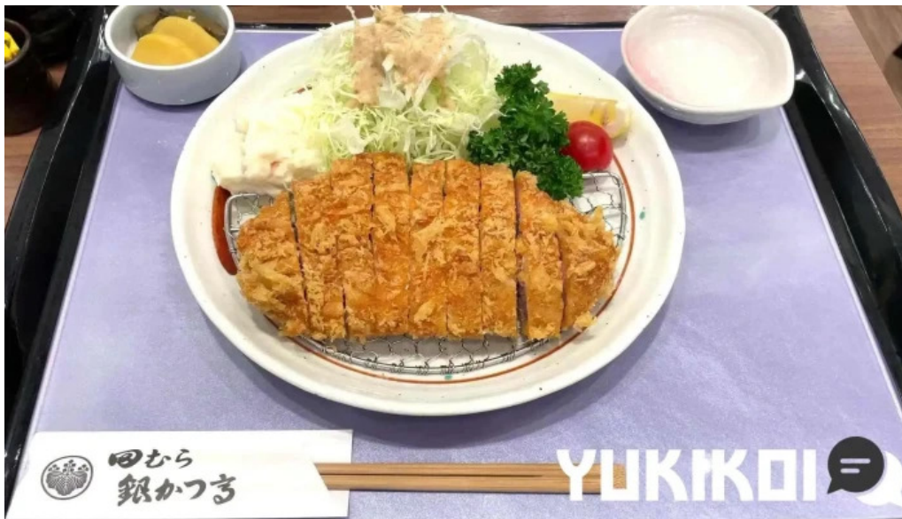
田むら銀かつ亭 御殿場プレミアムアウトレット店 豚カツ