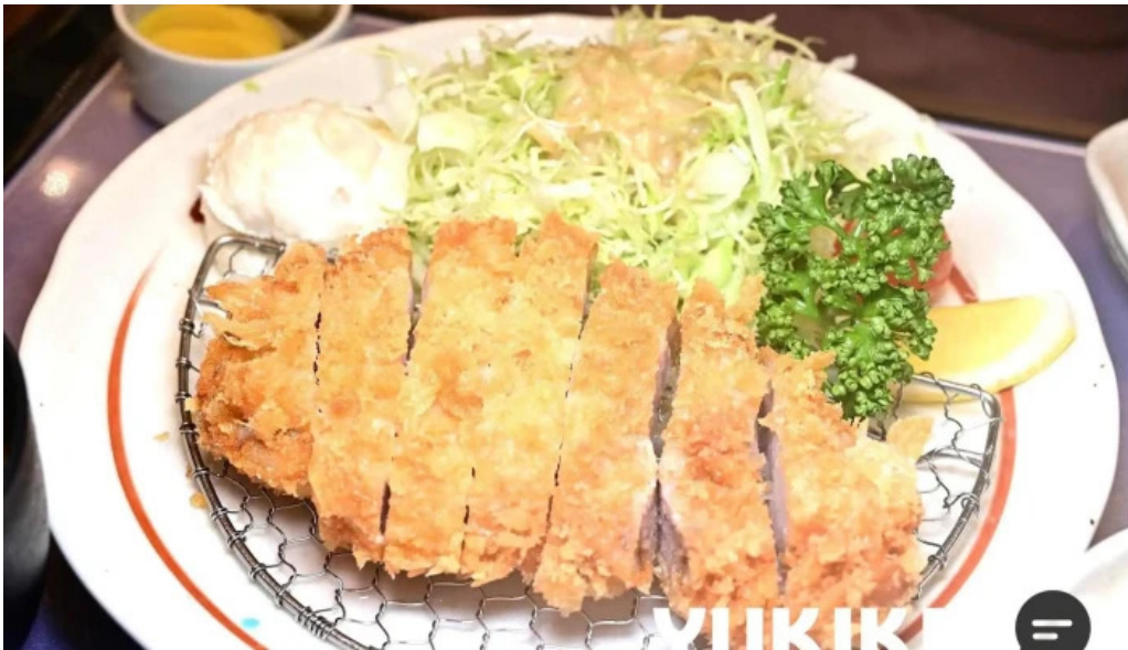
田むら銀かつ亭 御殿場プレミアムアウトレット店 料理飲み物