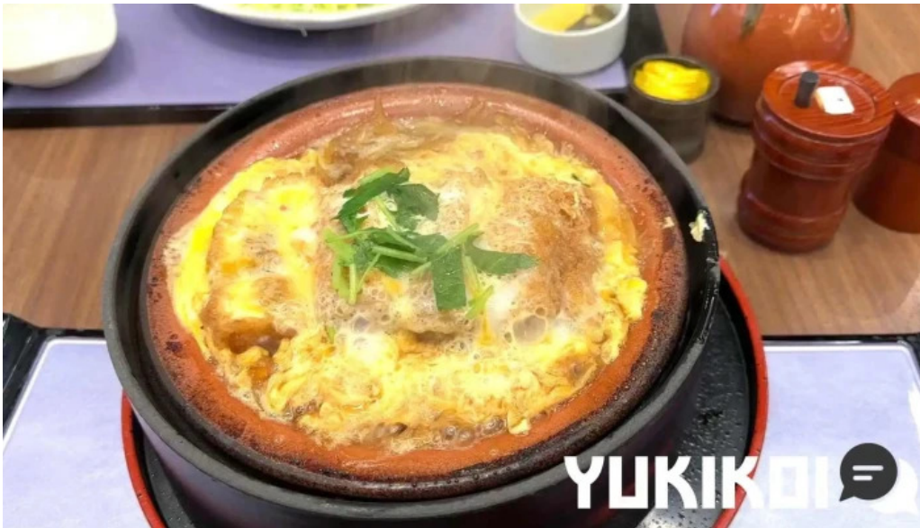
田むら銀かつ亭 御殿場プレミアムアウトレット店 動画