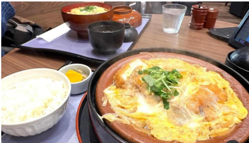
田むら銀かつ亭 御殿場プレミアムアウトレット店 火鍋