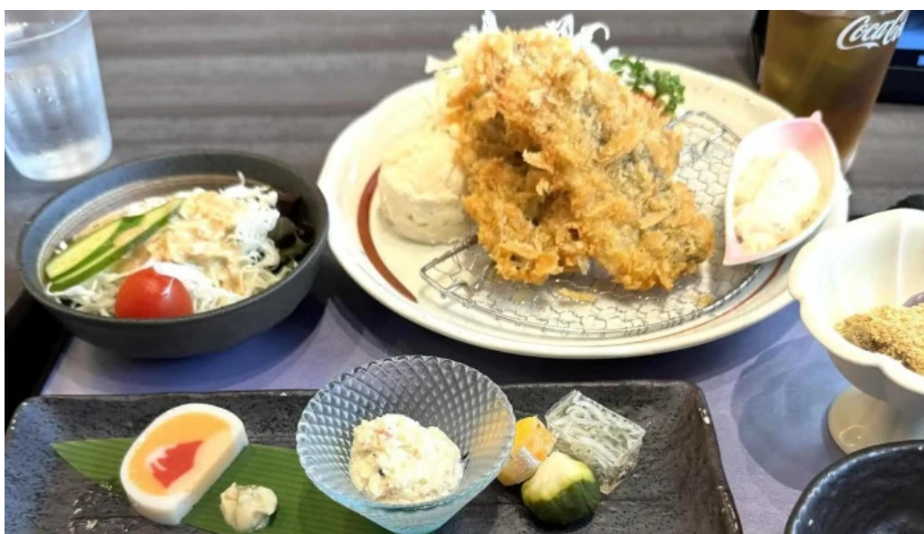
田むら銀かつ亭 御殿場プレミアムアウトレット店 ウェブサイト