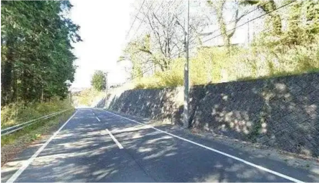
田むら銀かつ亭 御殿場プレミアムアウトレット店 御殿場市