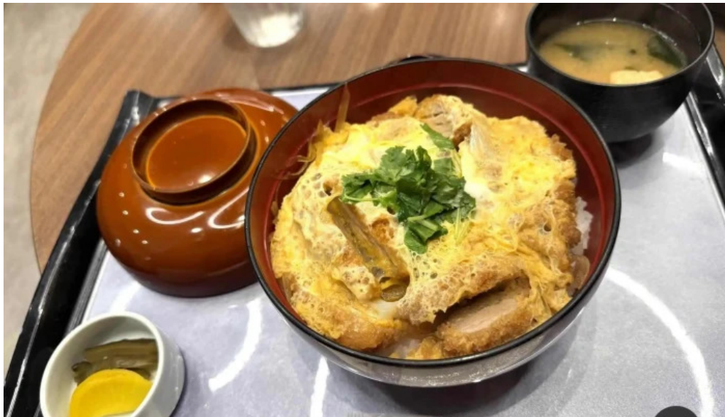
田むら銀かつ亭 御殿場プレミアムアウトレット店 カツ丼