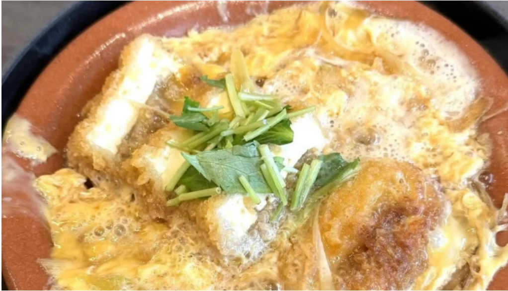
田むら銀かつ亭 御殿場プレミアムアウトレット店 営業時間