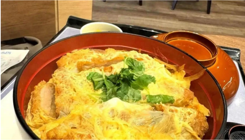
田むら銀かつ亭 御殿場プレミアムアウトレット店 最新