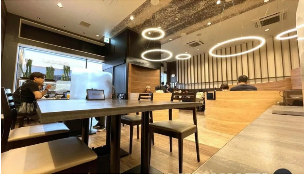
田むら銀かつ亭 御殿場プレミアムアウトレット店 雰囲気