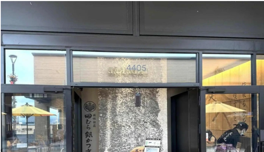
田むら銀かつ亭 御殿場プレミアムアウトレット店 近く