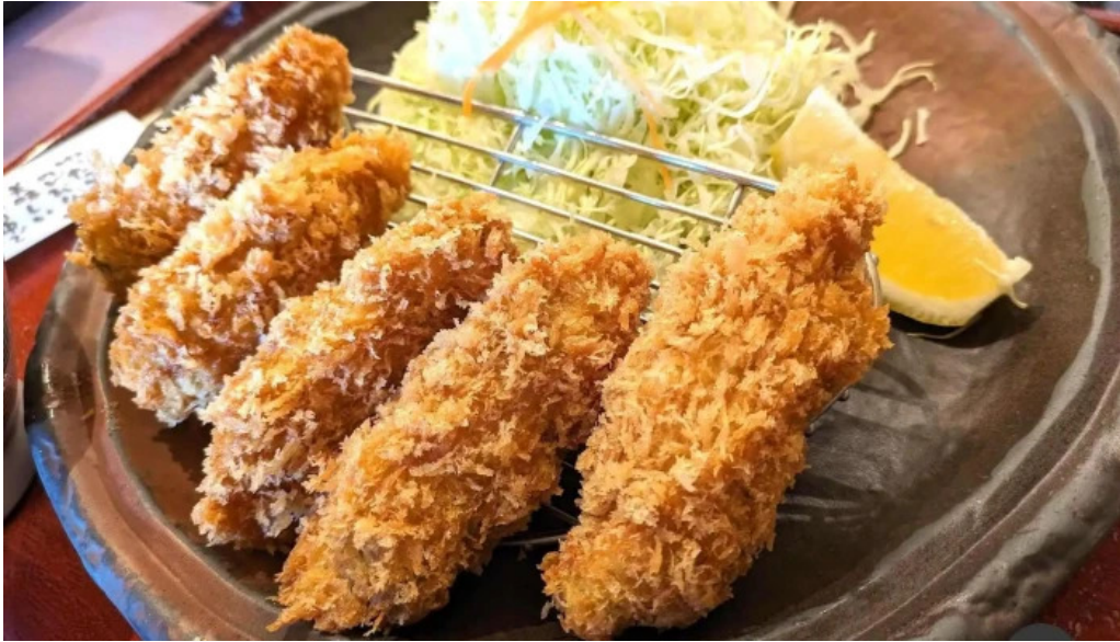
こだわりとんかつ かつ榮 御殿場店 エビフライ