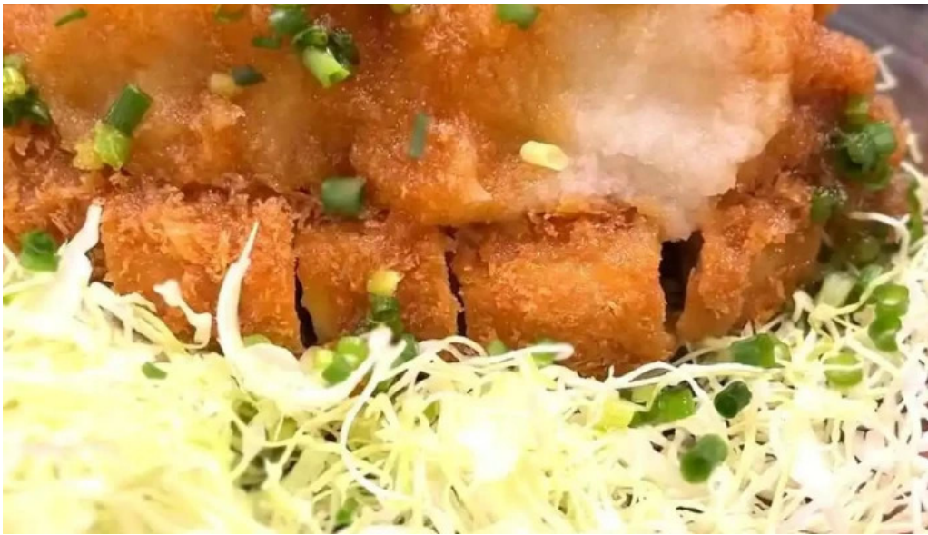
こだわりとんかつ かつ榮 御殿場店 最新