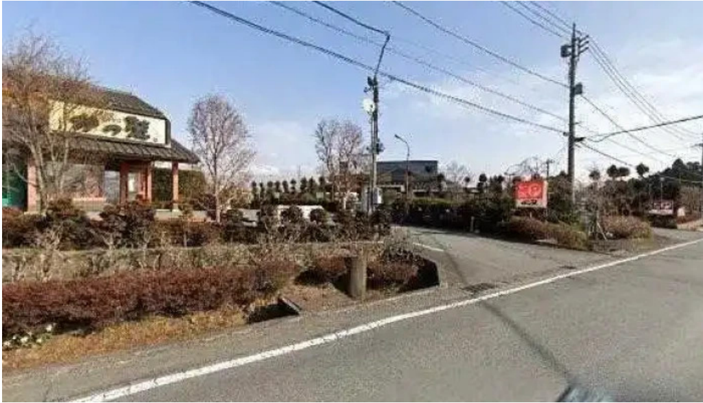
こだわりとんかつ かつ榮 御殿場店 御殿場市