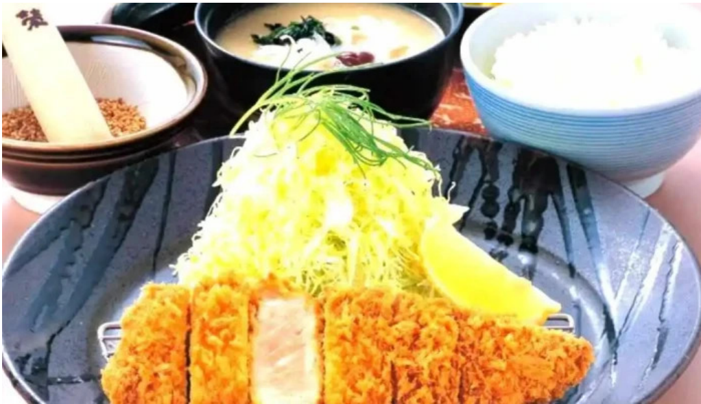
こだわりとんかつ かつ榮 御殿場店 料理飲み物