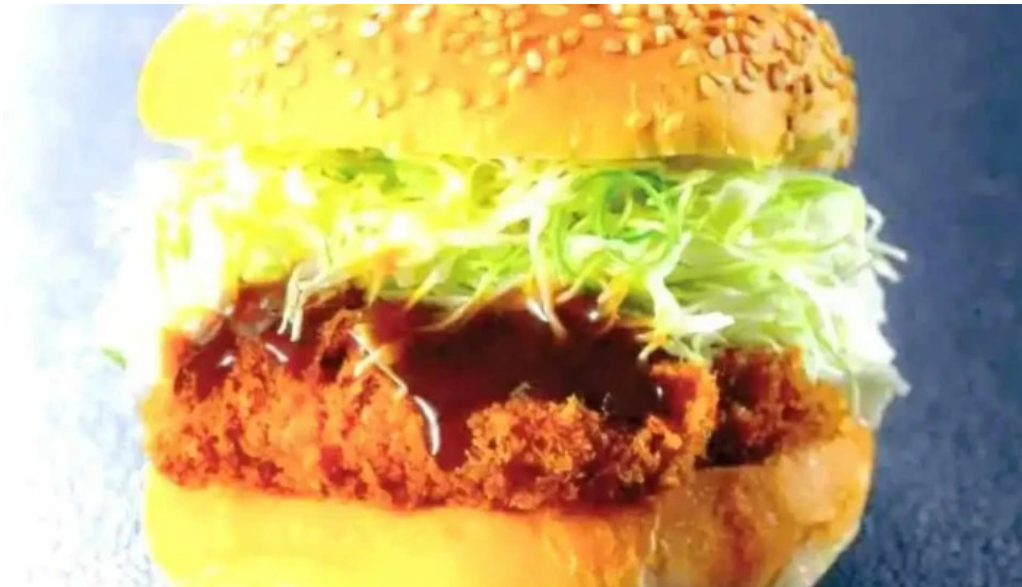
こだわりとんかつ かつ榮 御殿場店