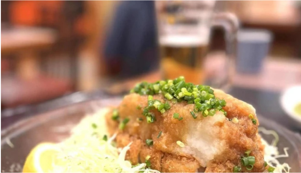
こだわりとんかつ かつ榮 御殿場店 どこ