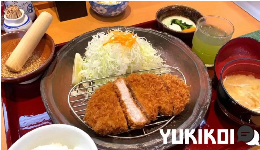
YUKIKOI こだわりとんかつ かつ榮 御殿場店 豚カツ