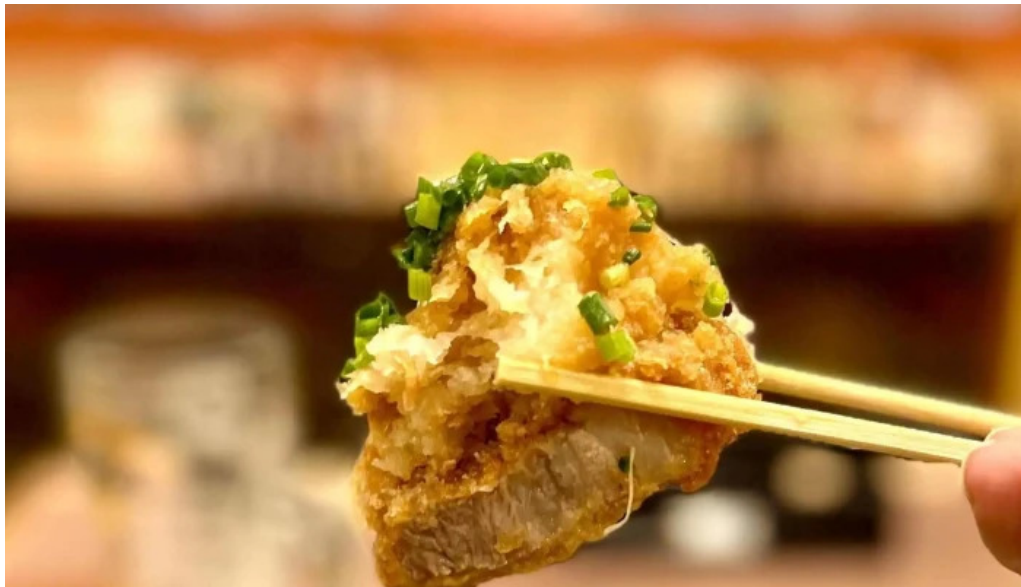
こだわりとんかつ かつ樂 御殿場店 動画