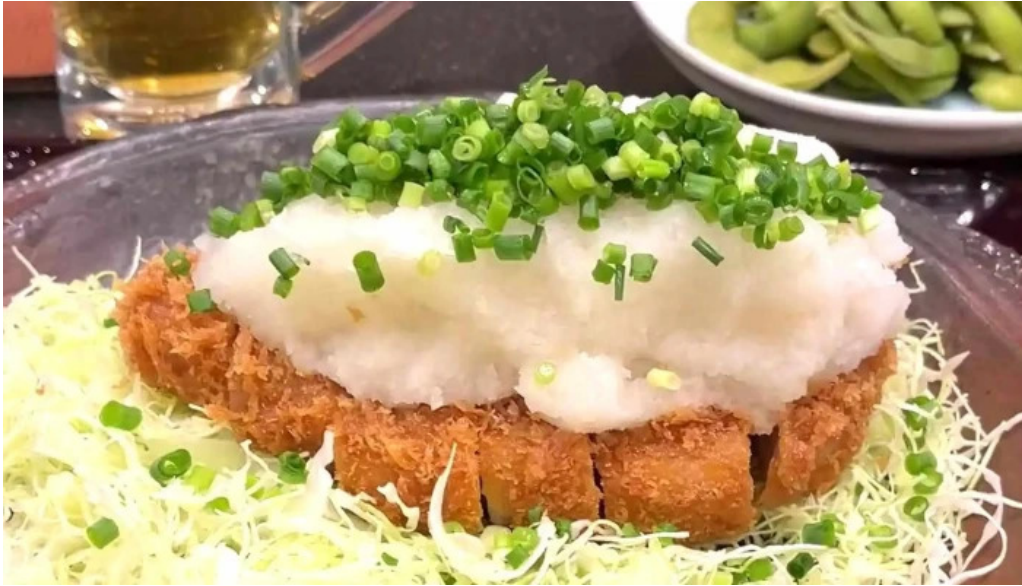
こだわりとんかつ かつ榮 御殿場店 コメント