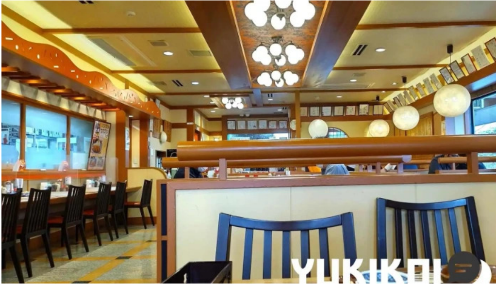
YUKIKOI こだわりとんかつ かつ榮 御殿場店 雰囲気