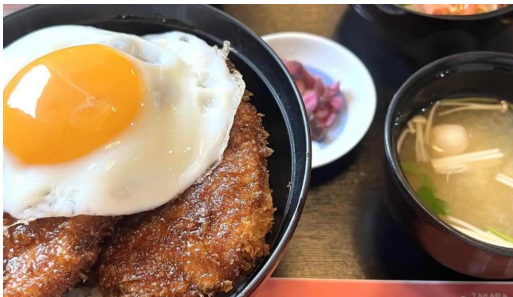
高良 ウェブサイト