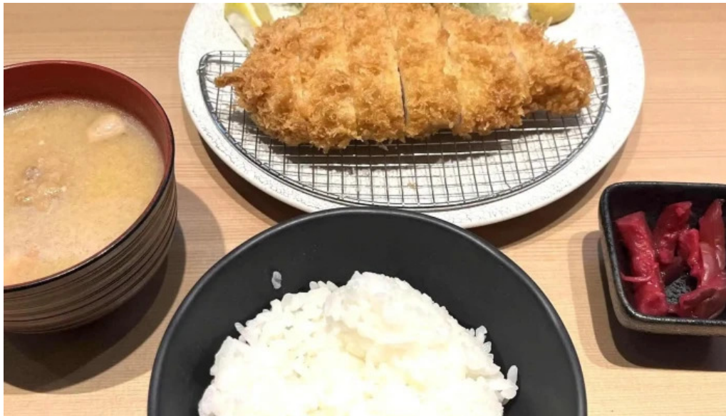
とんかつ 目黒 こがね カタログ