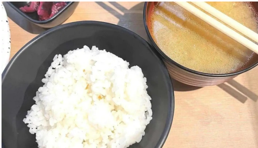
とんかつ 目黒 こがね 飯