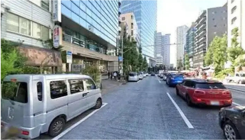
とんかつ 目黒 こがね 品川区