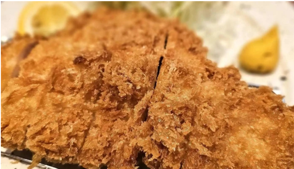
とんかつ 目黒 こがね 割引