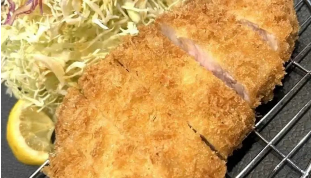
とんかつ 目黒 こがね 最新