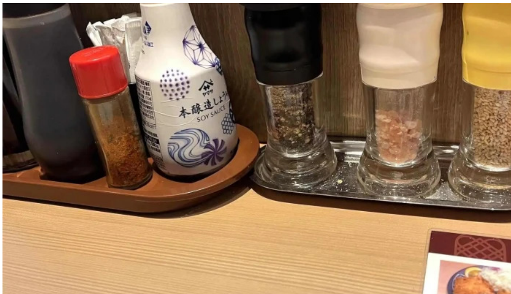
とんかつ 目黒 こがね 行き方