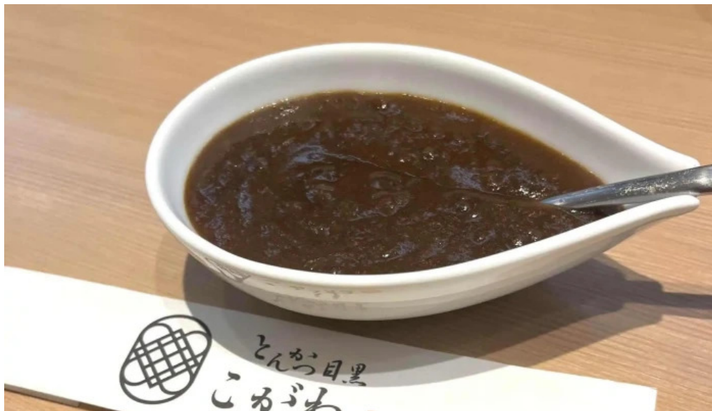
とんかつ 目黒こがね プロモーション