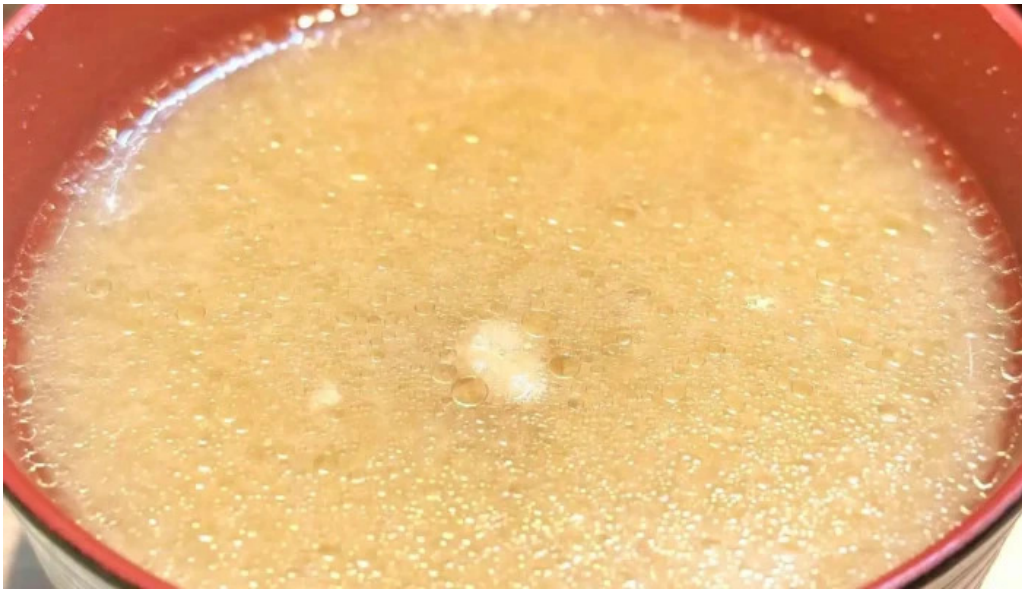
とんかつ 目黒 こがね 味噌汁