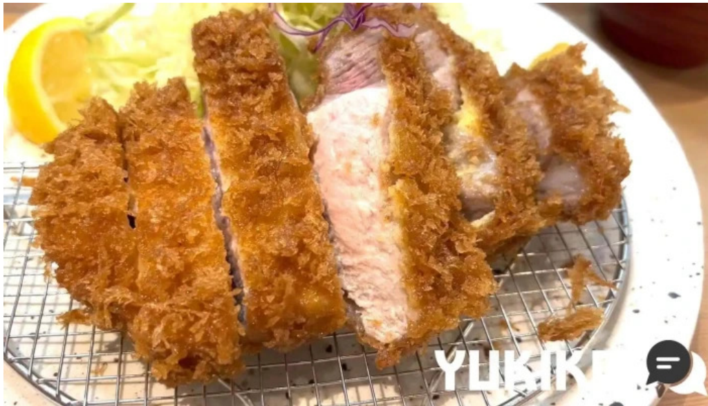
とんかつ 目黒 こがね 豚カツ