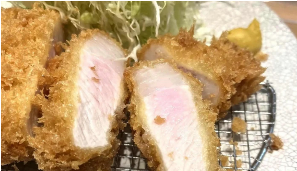
とんかつ 目黒 こがね 料金