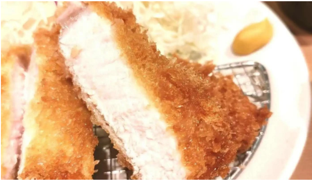
とんかつ 目黒 こがね 料理飲み物