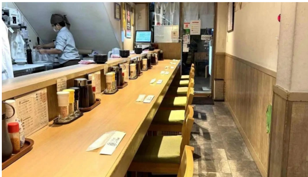
とんかつ 目黒 こがね 雰囲気