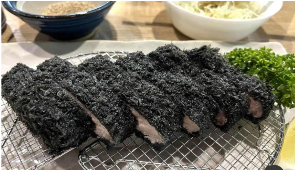
とんかつ あおい 海苔