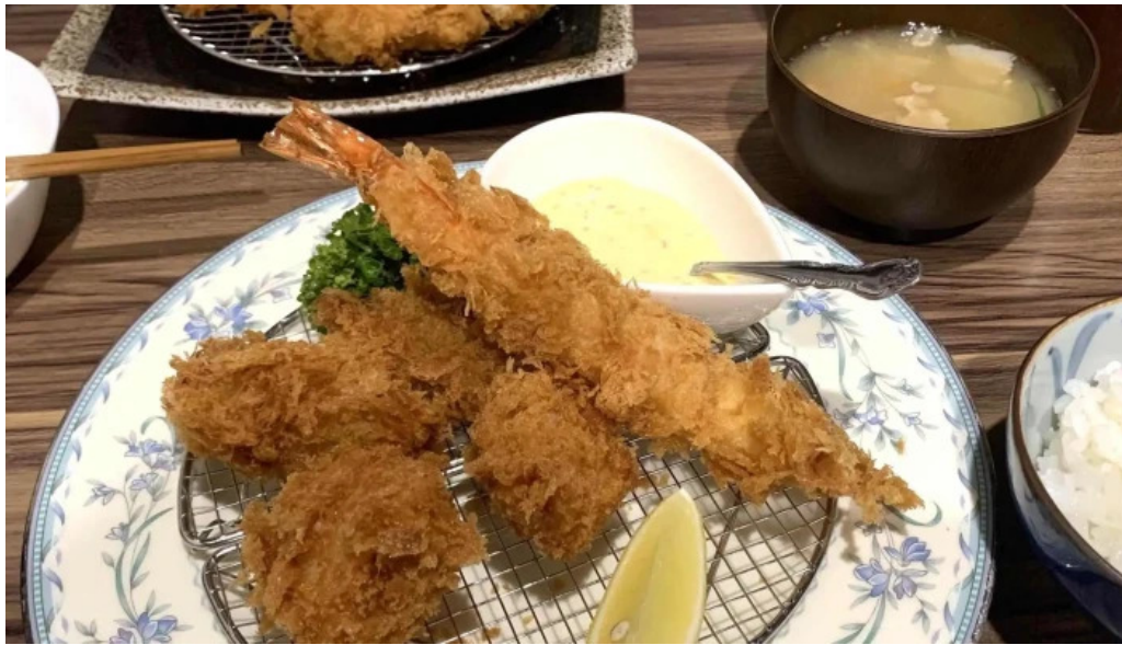
とんかつ あおい 番号