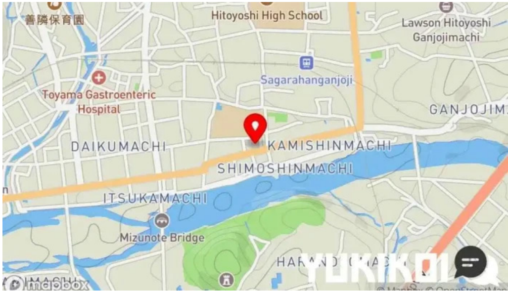
とんかつ あおい 地図