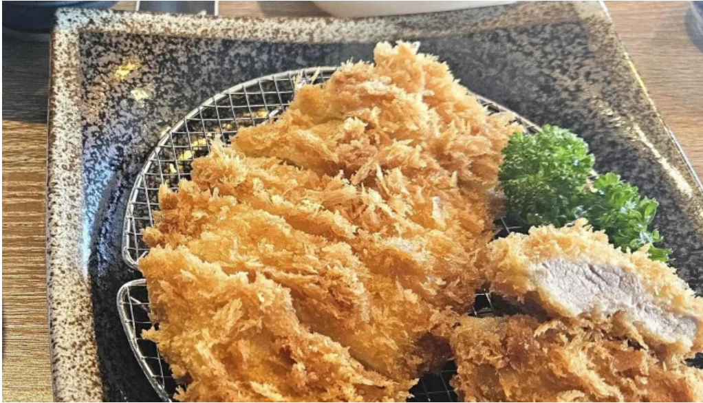
とんかつ あおい 近く