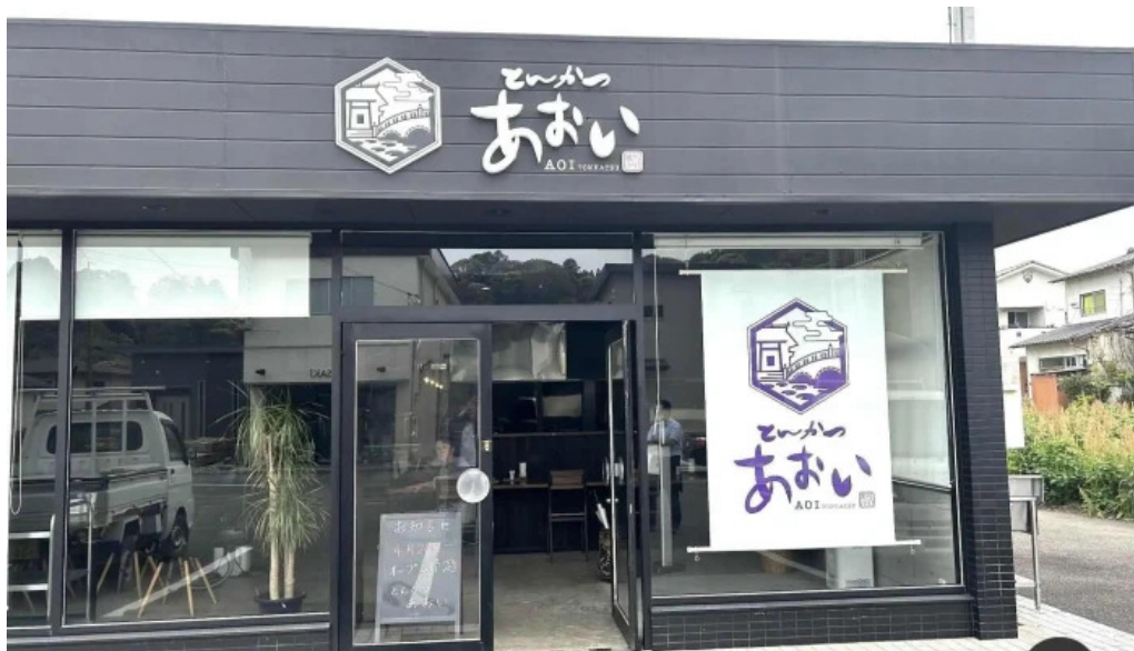
とんかつ あおい オーナー提供