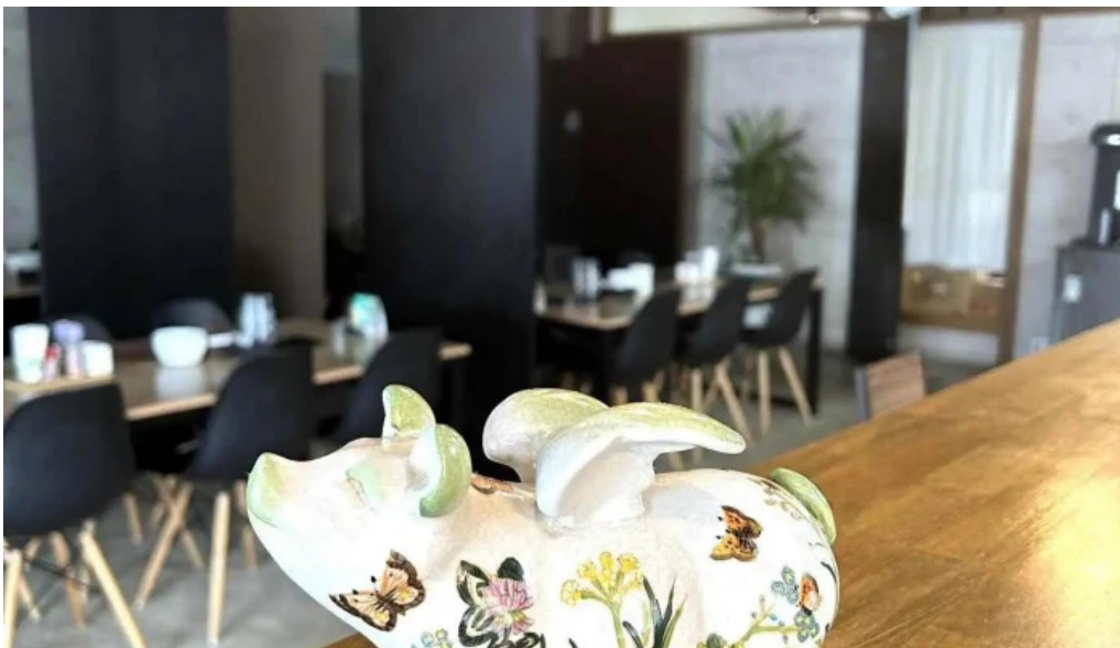
とんかつ あおい 雰囲気