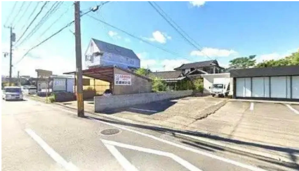
とんかつ あおい 人吉市