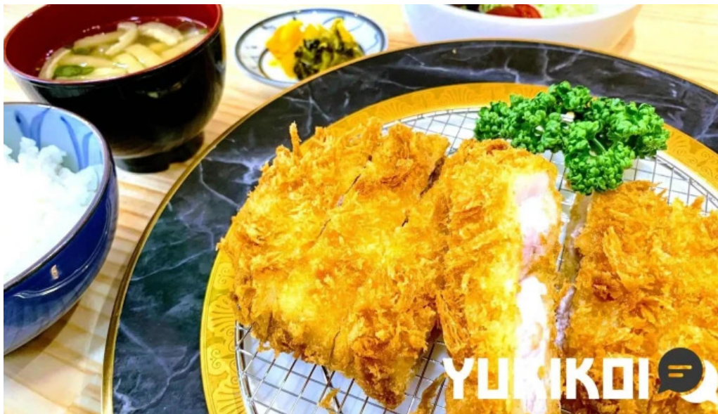
とんかつ あおい 料理飲み物