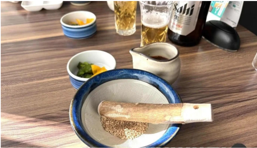
とんかつ あおい 味噌汁