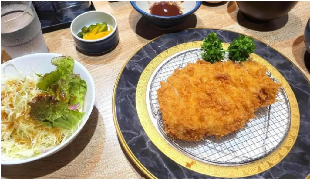
とんかつ あおい 豚カツ