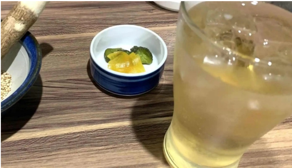
とんかつ あおい 営業中