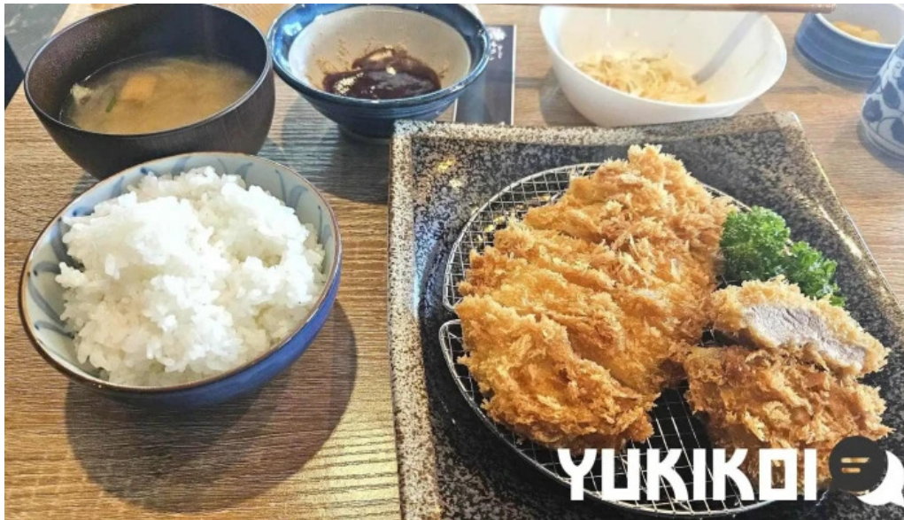
とんかつ あおい 最新