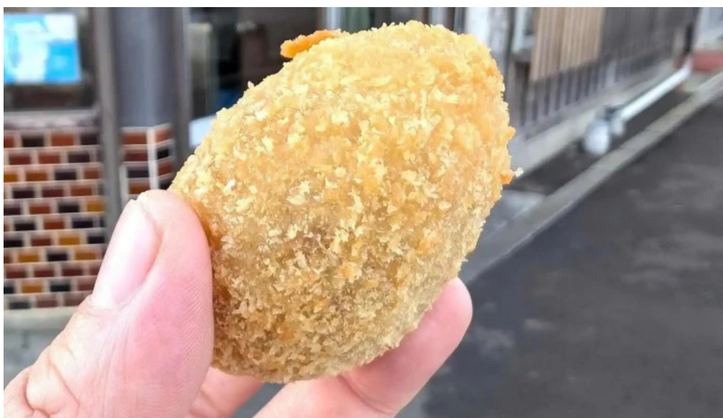
すき焼き 阿佐利本店 最新