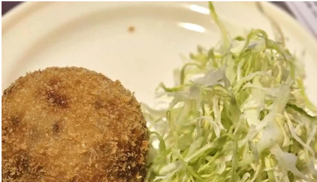
すき焼き 阿佐利本店 コロッケ