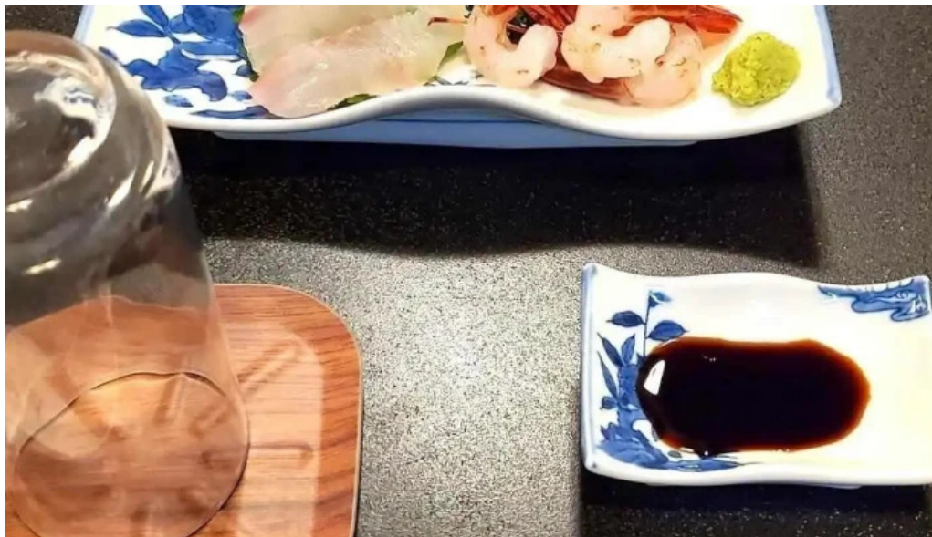
すき焼き 阿佐利本店 刺身