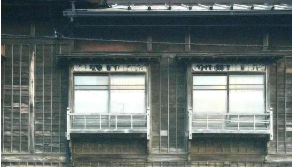
すき焼き 阿佐利本店 コメント