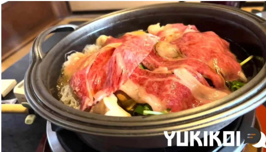
すき焼き 阿佐利本店 動画