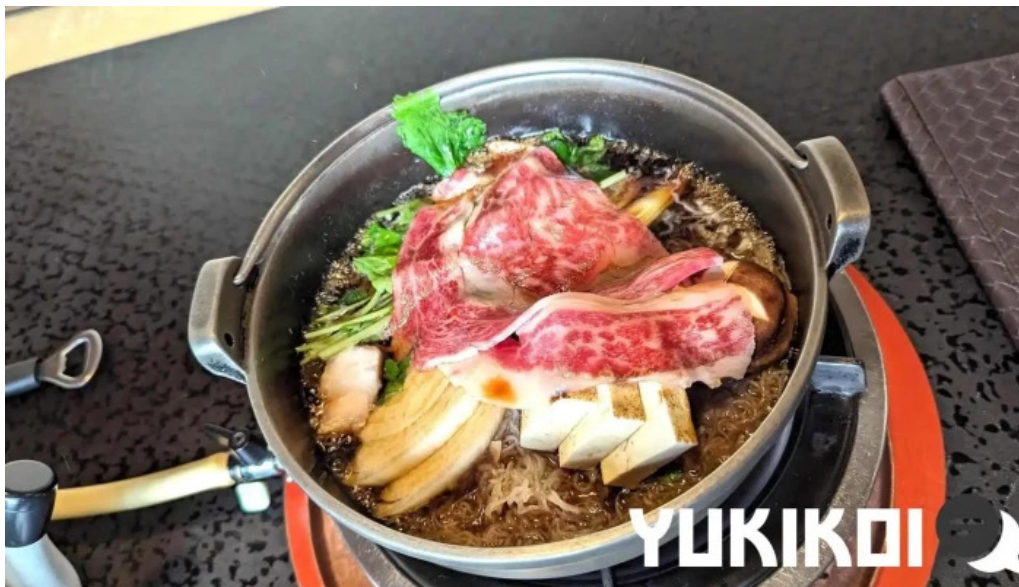
すき焼き 阿佐利本店 料理飲み物