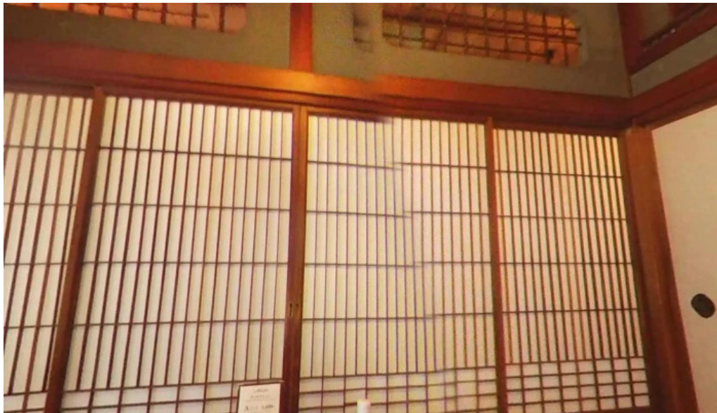
すき焼き 阿佐利本店 函館市