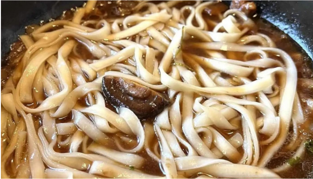
すき焼き 阿佐利本店 うどん