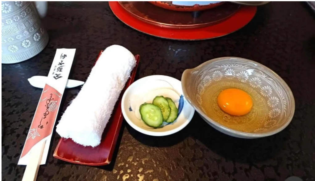
すき焼き 阿佐利本店 卵