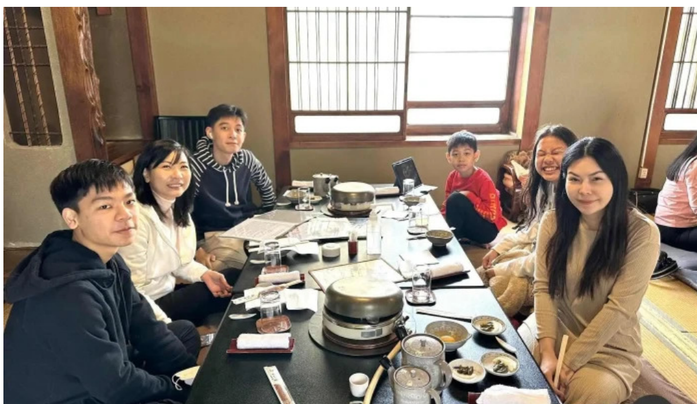
すき焼き 阿佐利本店 雰囲気