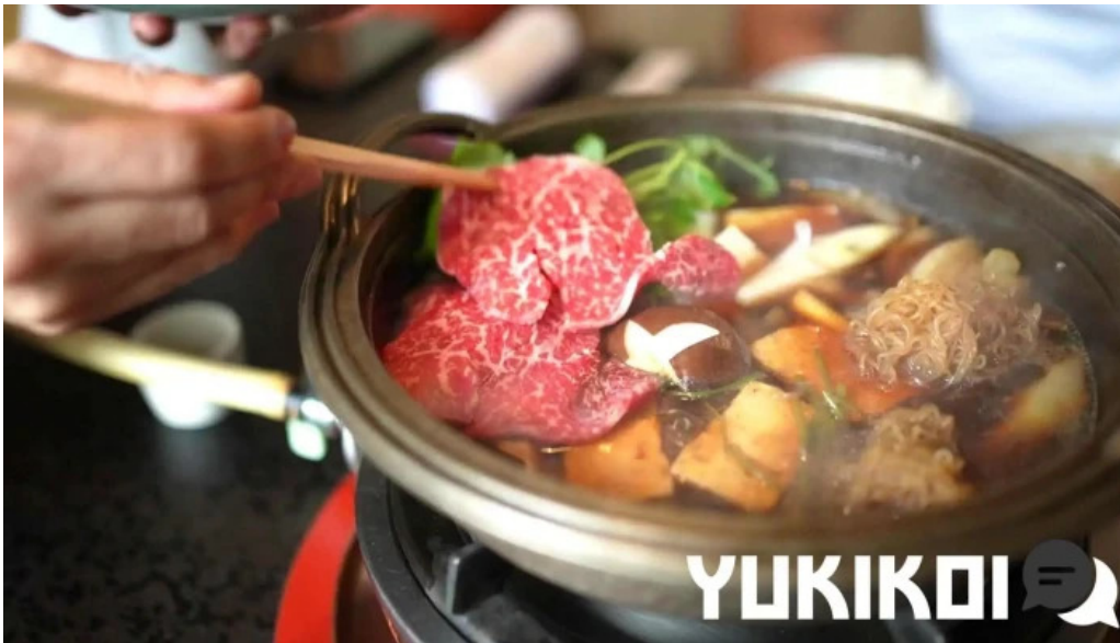
すき焼き 阿佐利本店 すき焼き