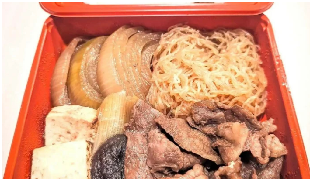
すき焼き 阿佐利本店 弁当