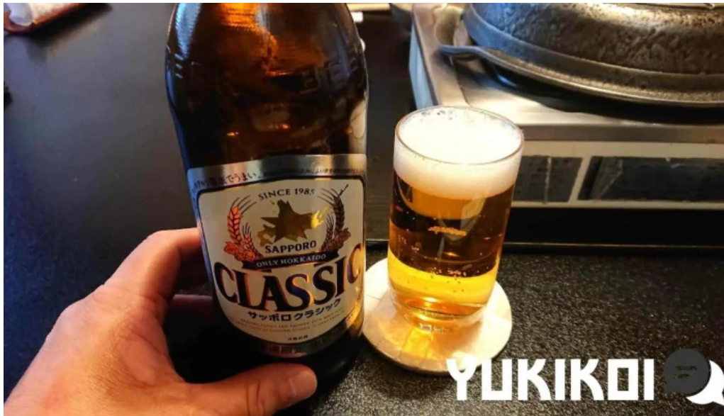
すき焼き 阿佐利本店 ビール