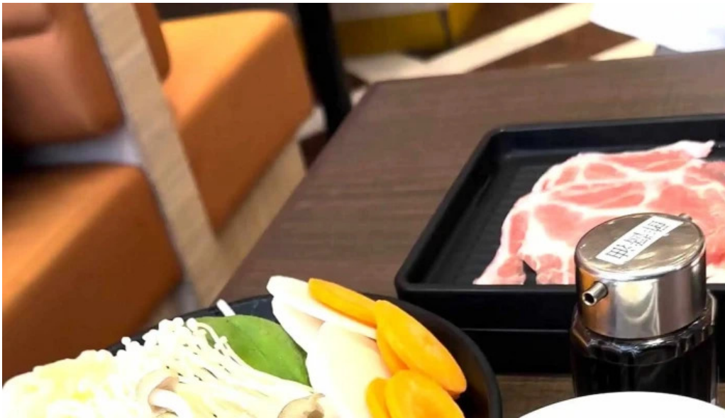
m k レストラン 伊都店 住所