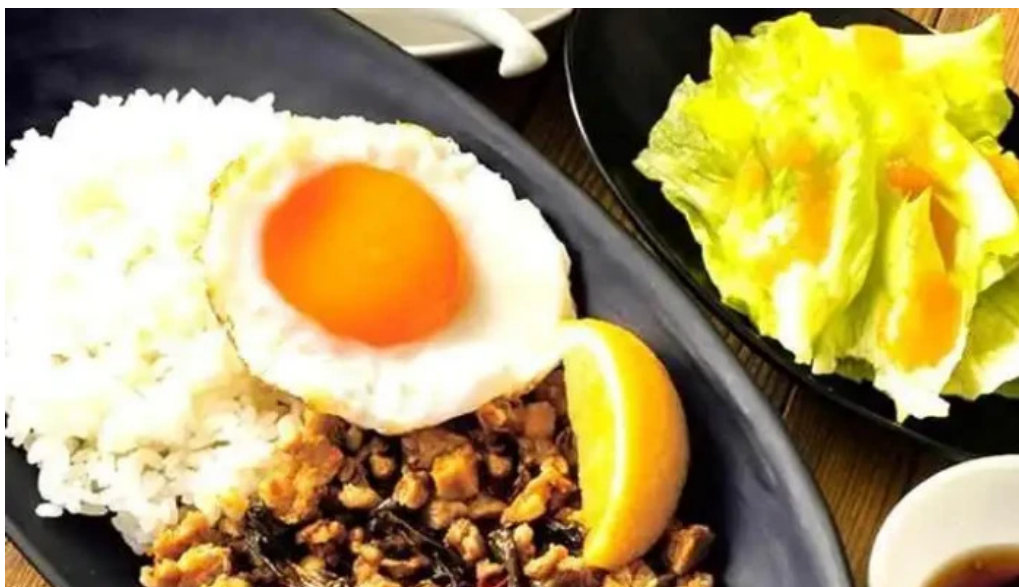
m k レストラン 伊都店 オーナー提供