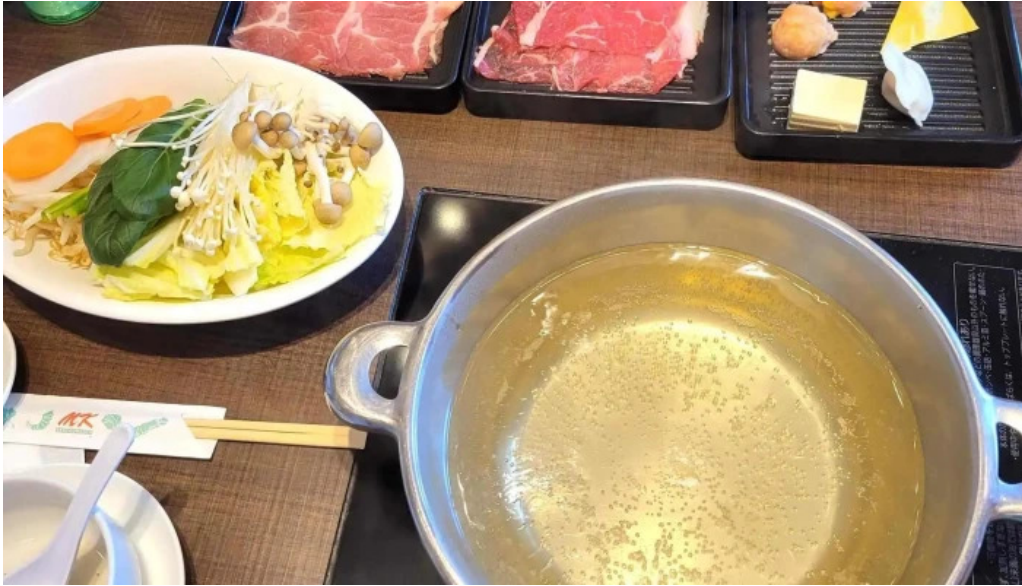
m k レストラン 伊都店 スコア