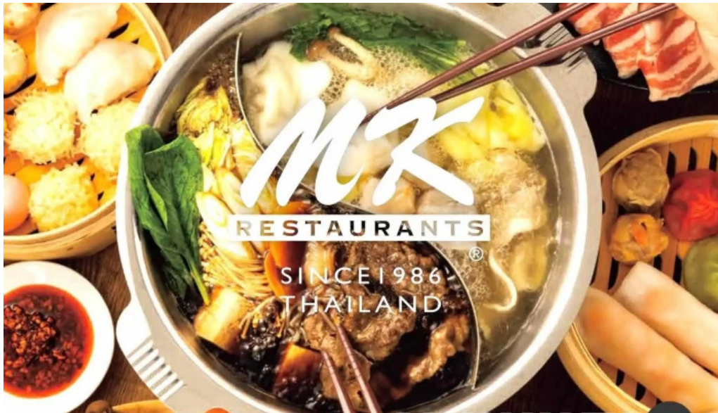
mk レストラン 伊都店 火鍋