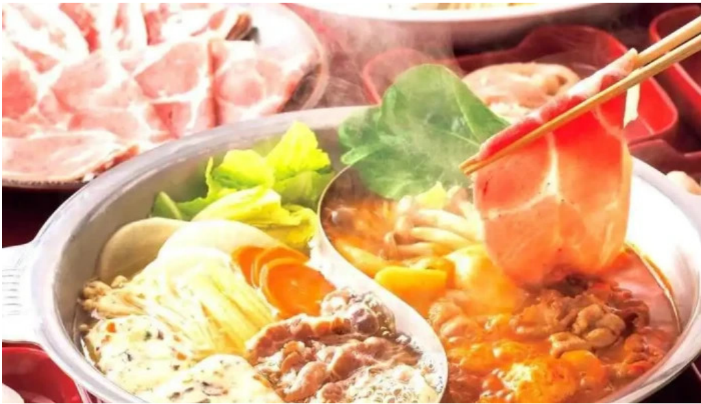
m k レストラン 伊都店 料理飲み物