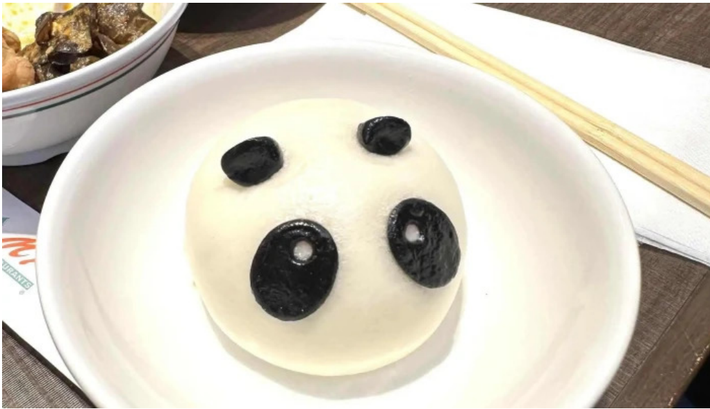
m k レストラン 伊都店 動画