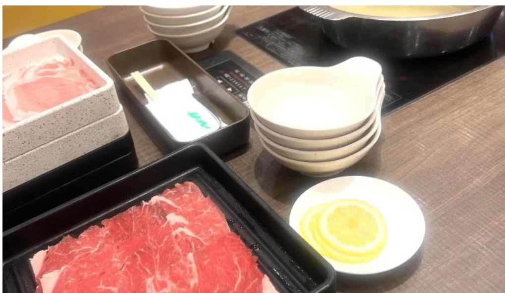
m k レストラン 伊都店 しゃぶしゃぶ