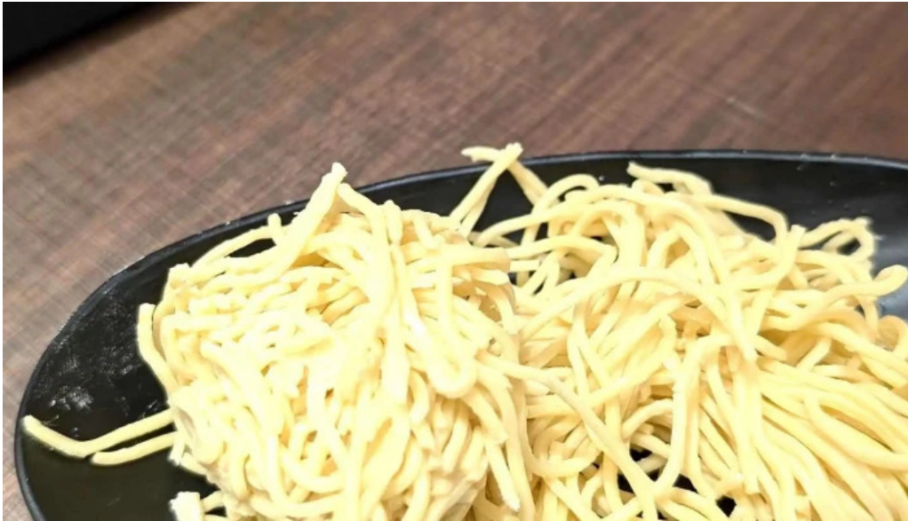
m k レストラン 伊都店 コメント