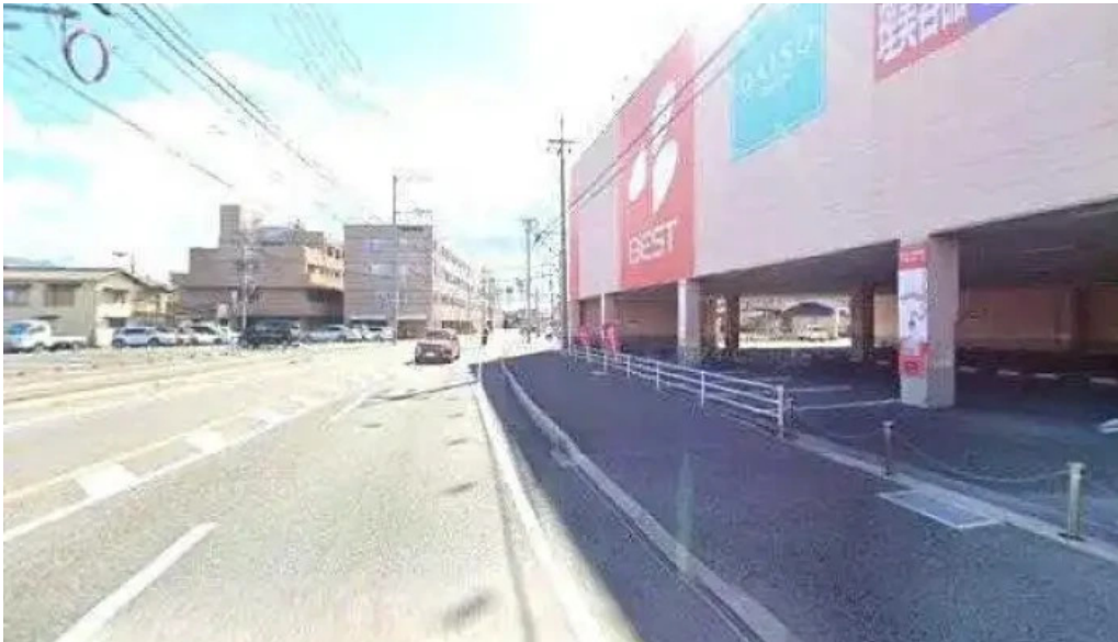
mkレストラン 伊都店 福岡市