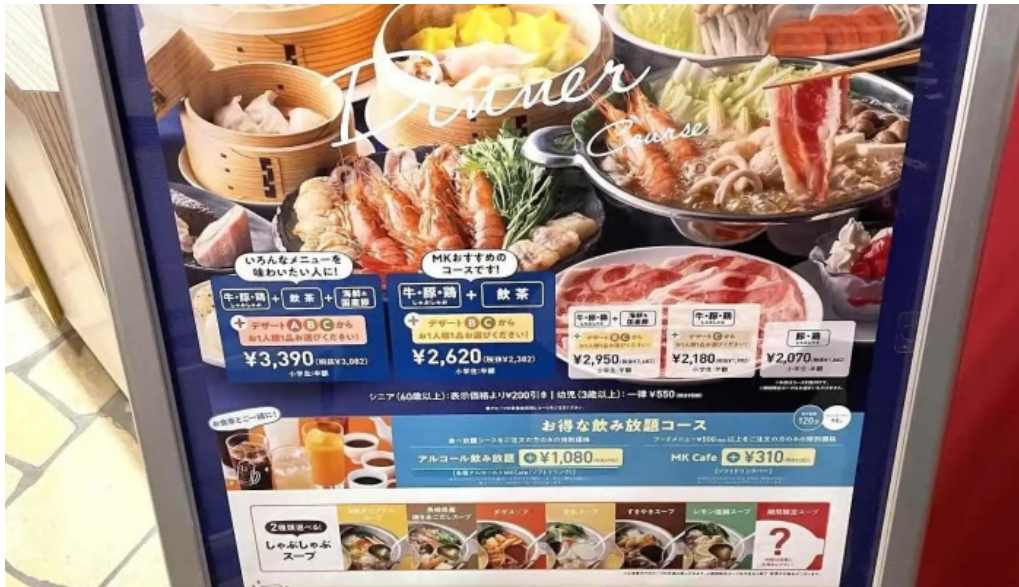
m k レストラン 伊都店 メニュー