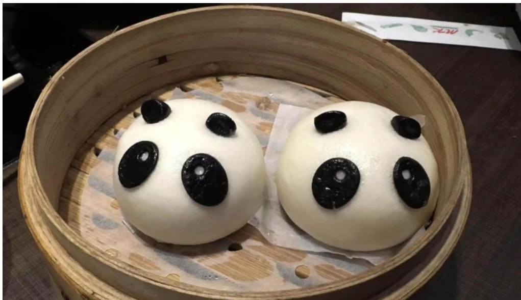
mk レストラン 伊都店 料金