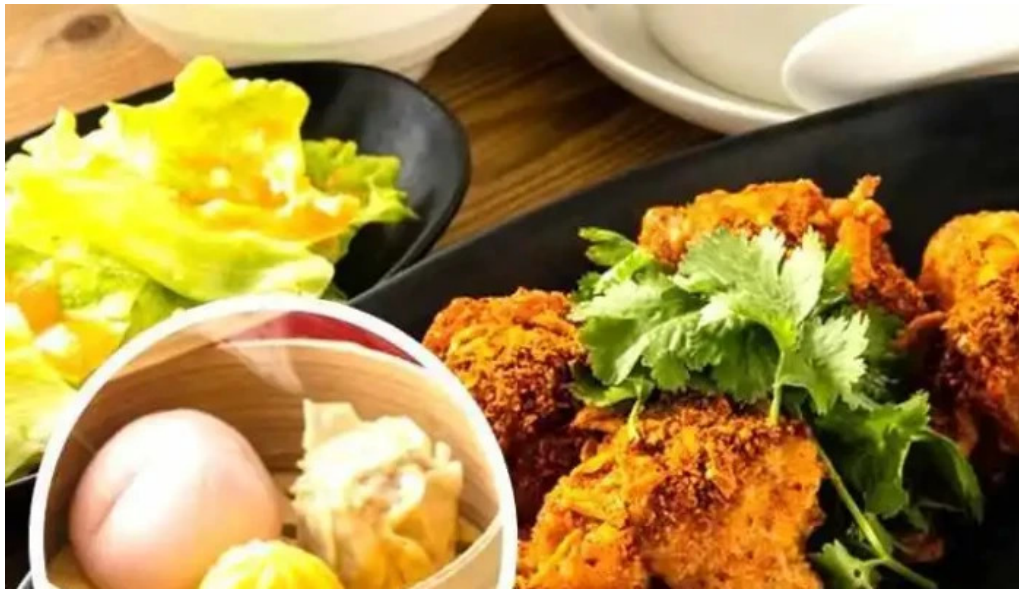
m k レストラン 伊都店 スープ