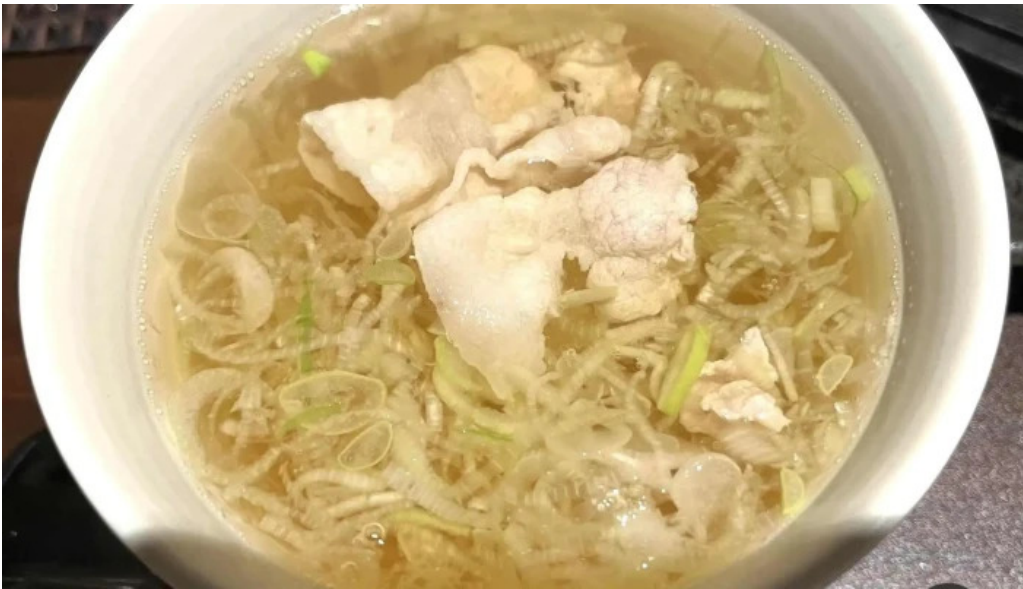
しゃぶしゃぶ翔スープ