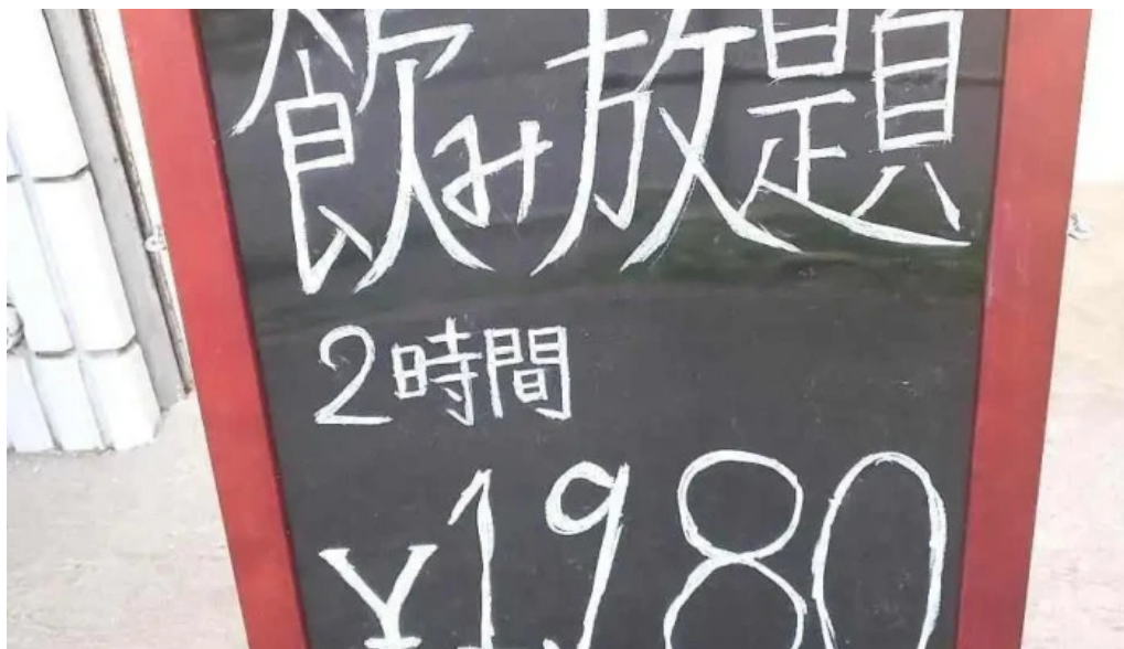
しゃぶしゃぶ 翔