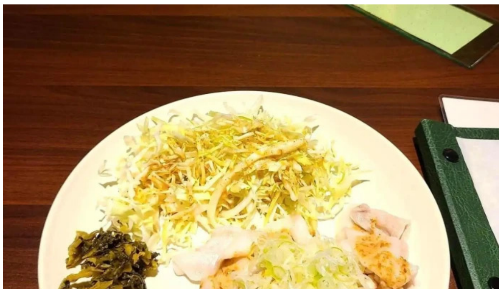
しゃぶしゃぶ翔 麺