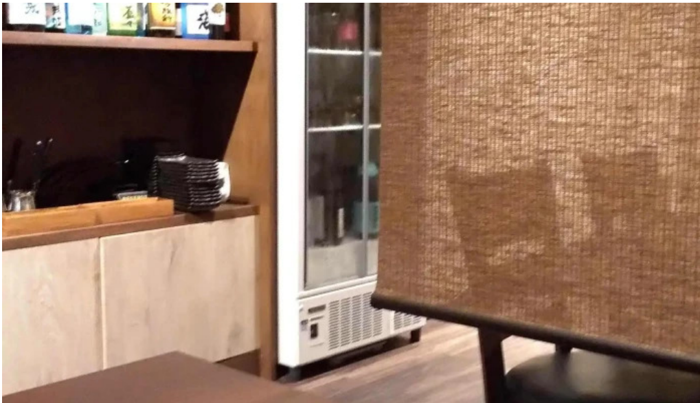
しゃぶしゃぶ 翔 instagram