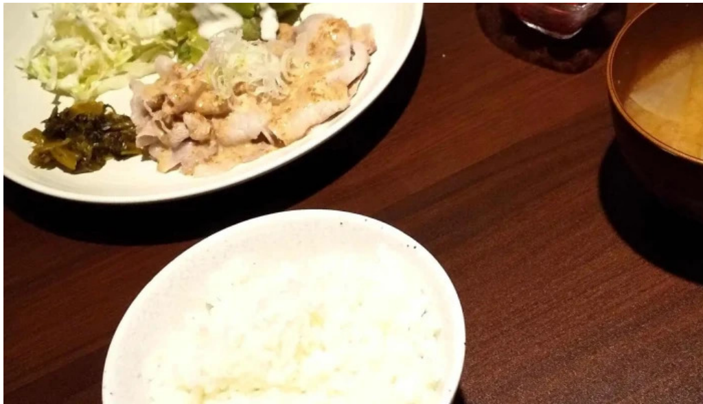
しゃぶしゃぶ 翔 どこ