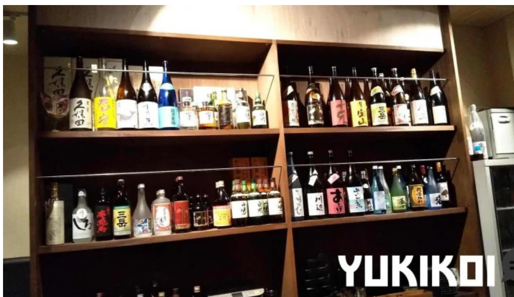
しゃぶしゃぶ 翔 雰囲気