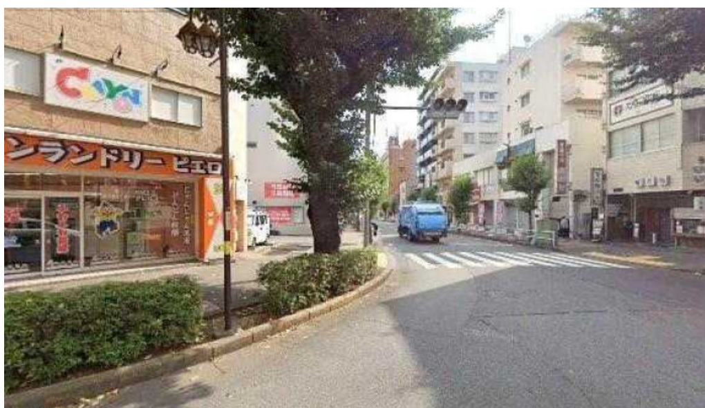
しゃぶしゃぶ 翔 東村山市