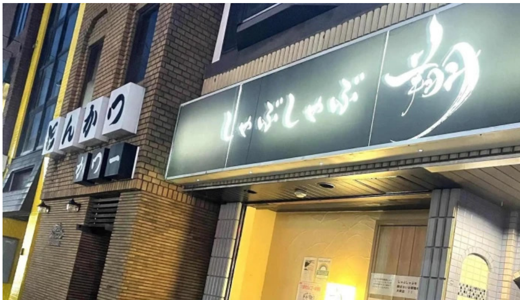
しゃぶしゃぶ 翔 割引