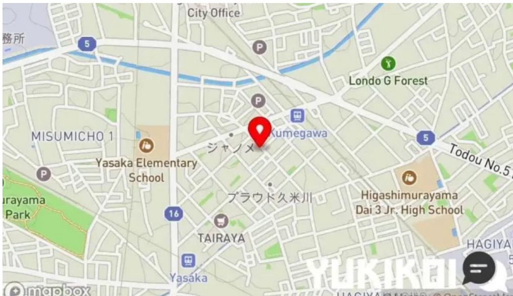
しゃぶしゃぶ 翔 地図