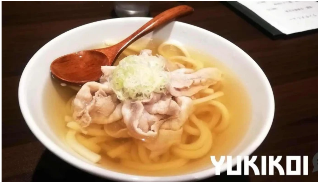
しゃぶしゃぶ 翔 料理飲み物