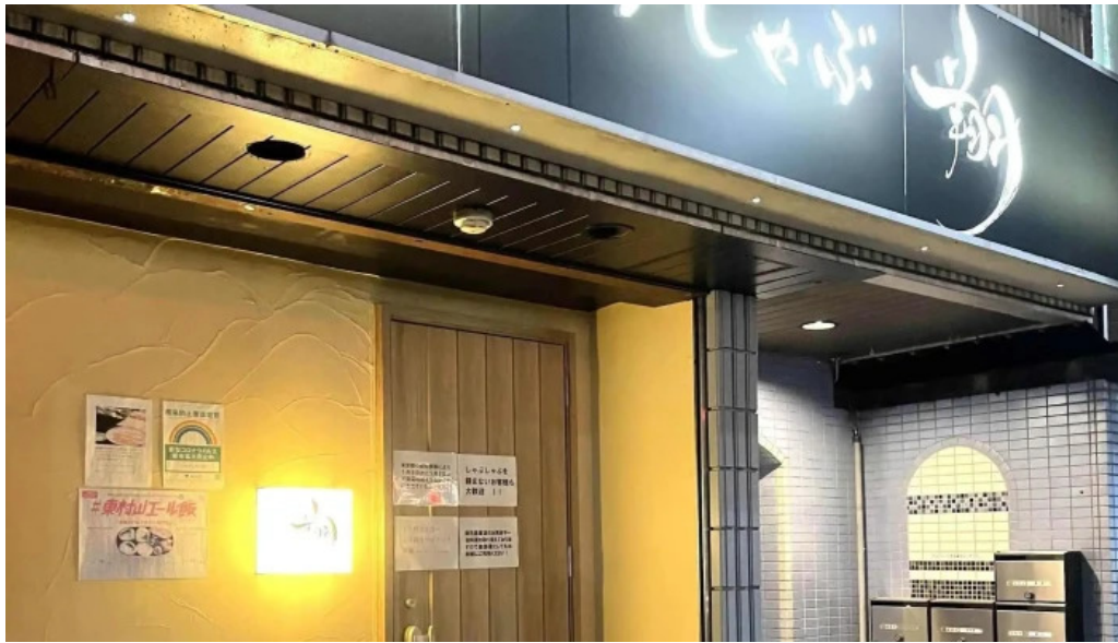
しゃぶしゃぶ 翔 ウェブサイト