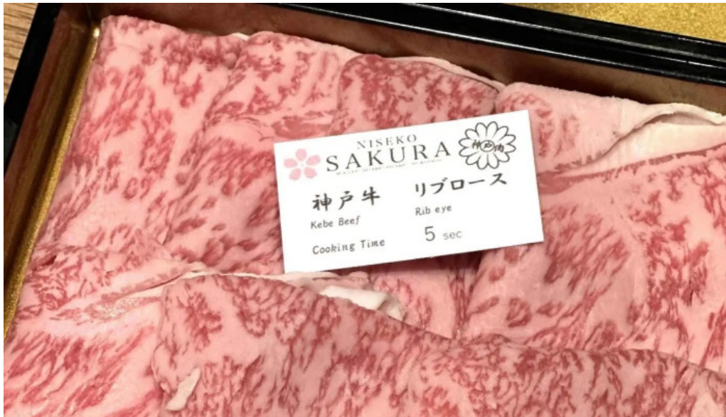
Niseko sakura ニセコ さくら 所在地