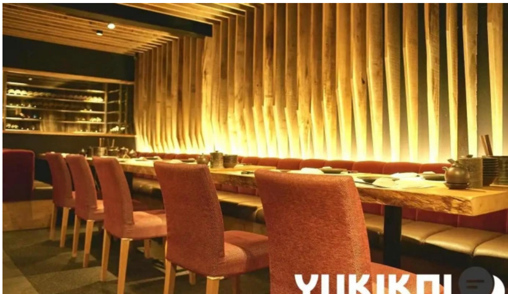
Niseko sakura ～ニセコ さくら～ 倶知安町