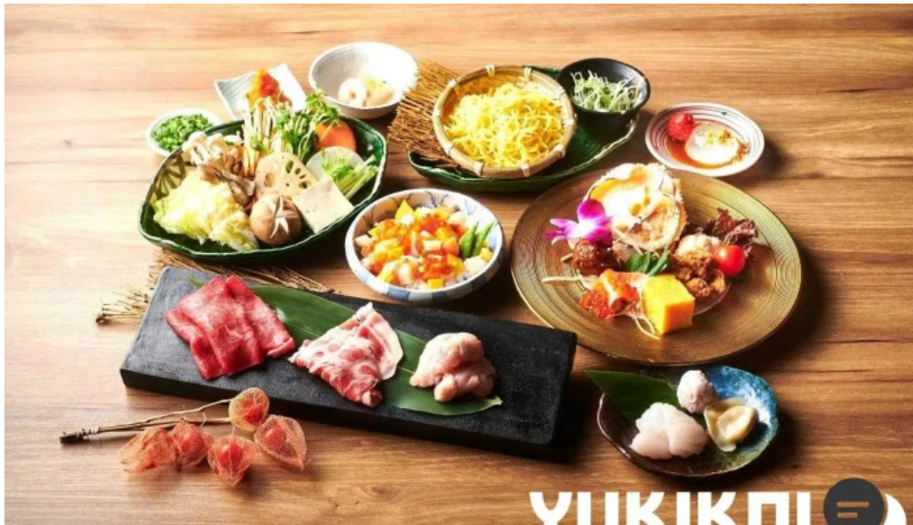
Niseko sakura ニセコ さくら 料理飲み物