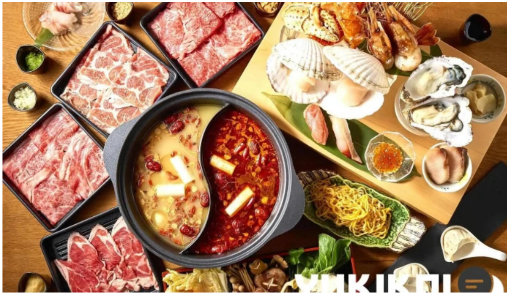
Niseko sakura ニセコ さくら 火鍋