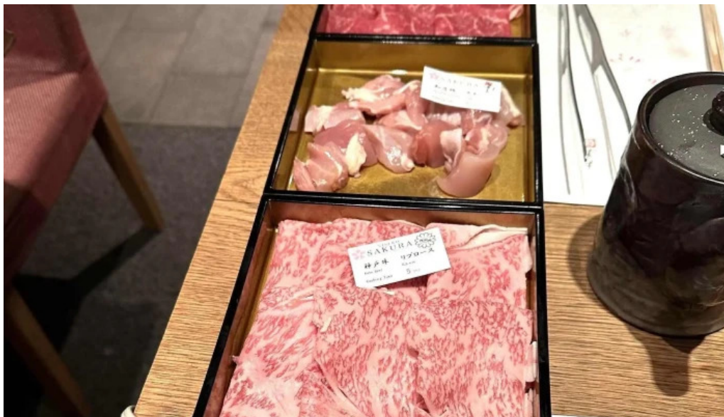
Niseko sakura ニセコ さくら エリア