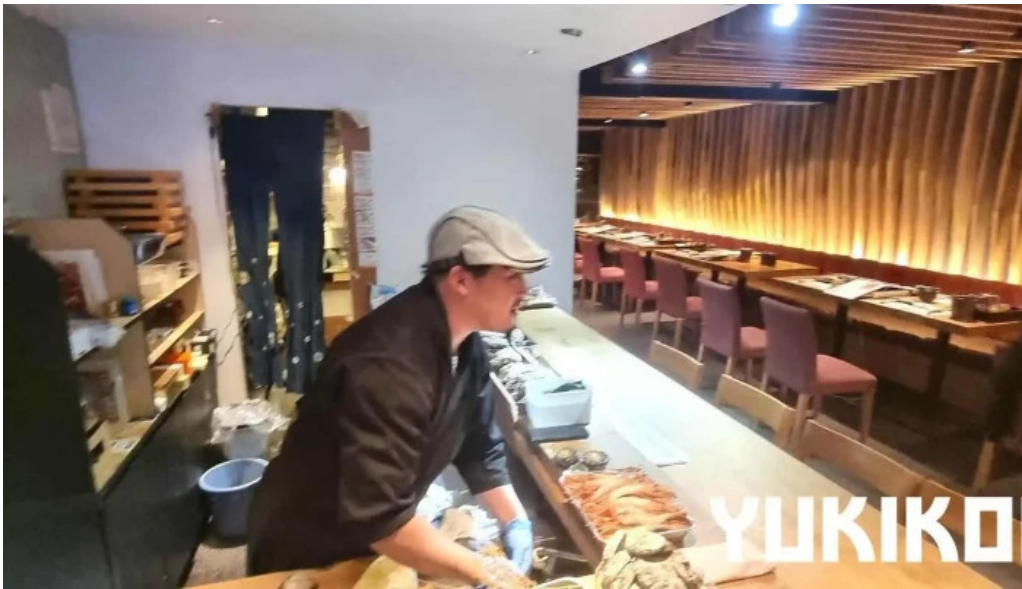
Niseko sakura ニセコ さくら 雰囲気