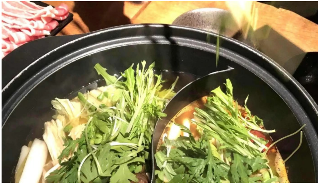
Niseko sakura ニセコ さくら カタログ