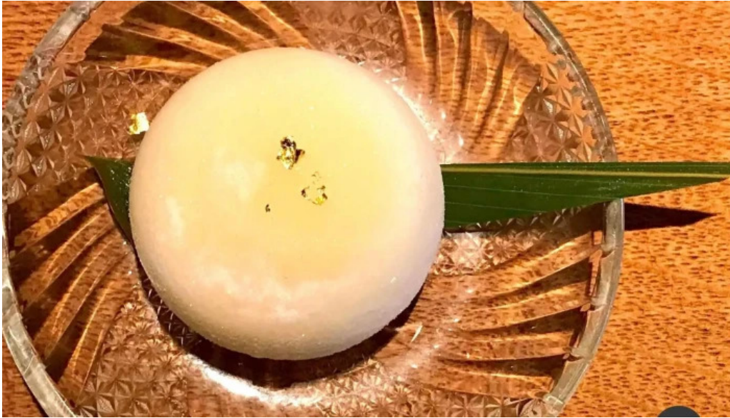
Niseko sakura ニセコ さくら 餅