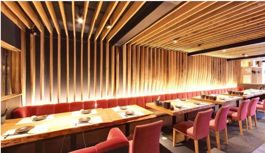
Niseko sakura ニセコ さくら 倶知安町