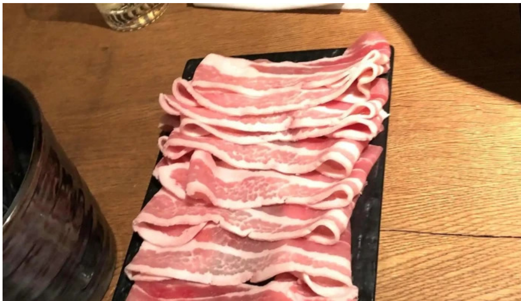
Niseko sakura ニセコ さくら 営業時間