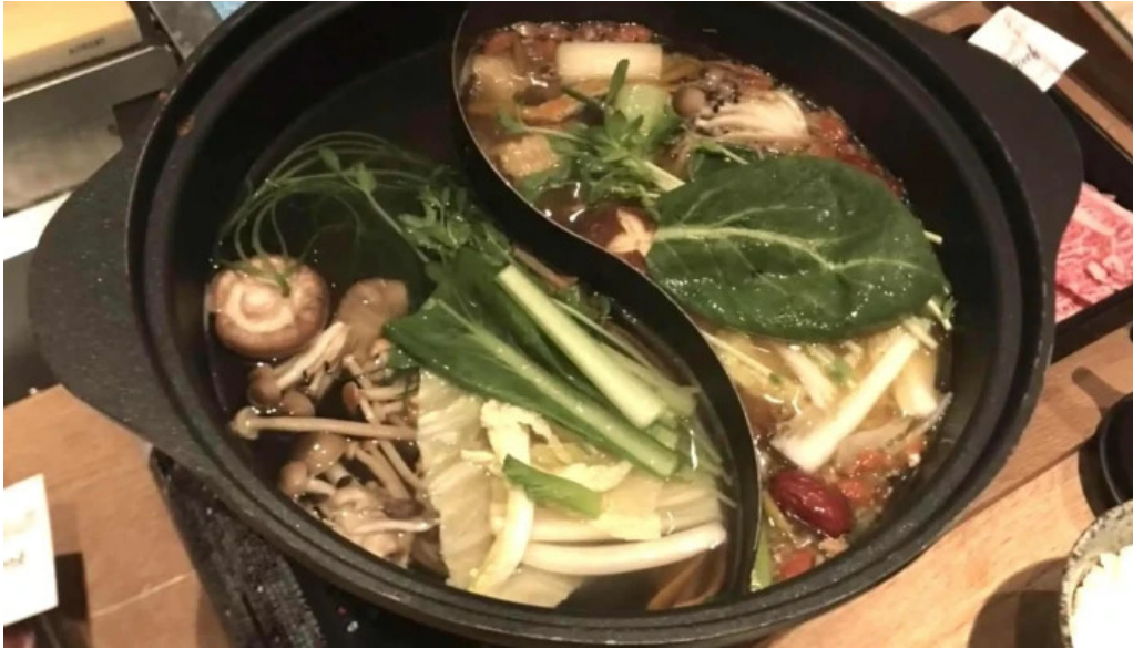
Niseko sakura ニセコ さくら 割引