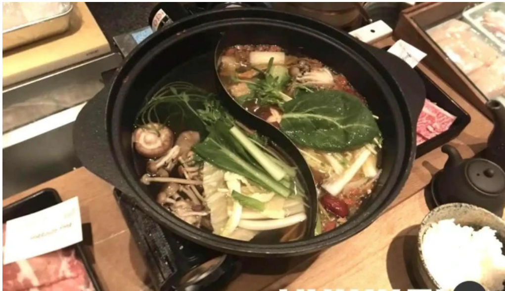
Niseko sakura ニセコ さくら 最新