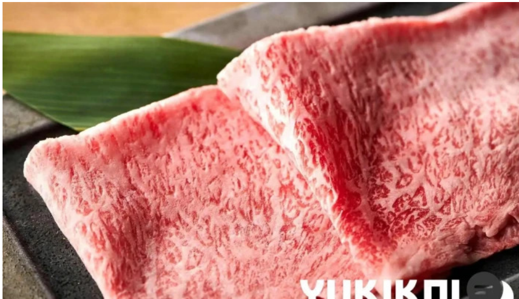
Niseko sakura ニセコ さくら