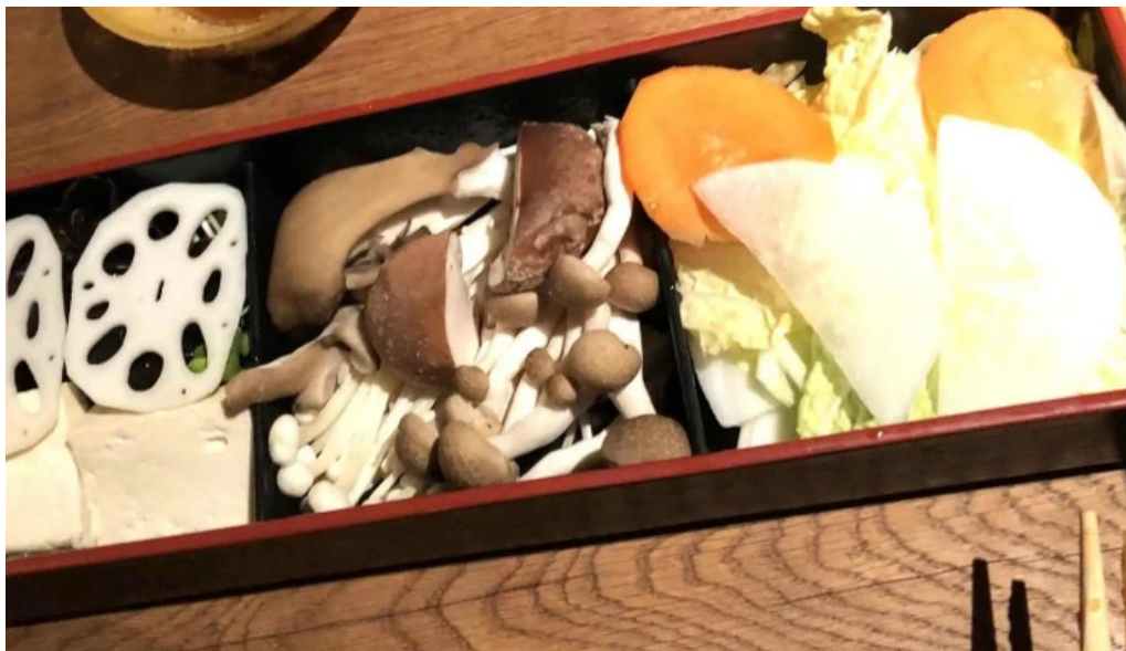
Niseko sakura ニセコ さくら プロモーション