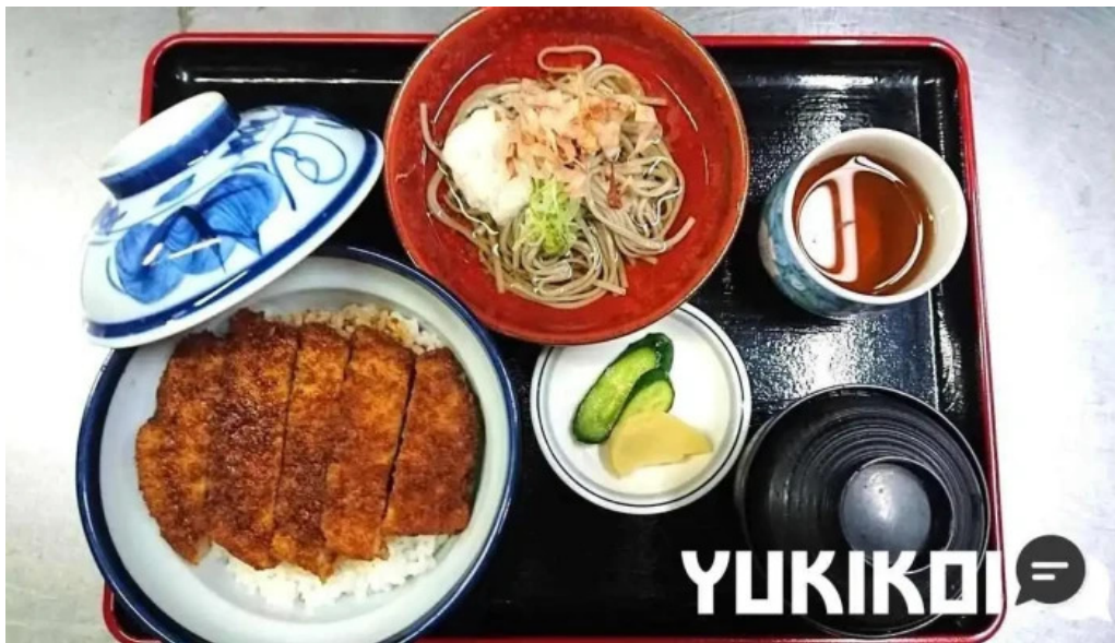
福彩り食堂 のむら屋 豚カツ