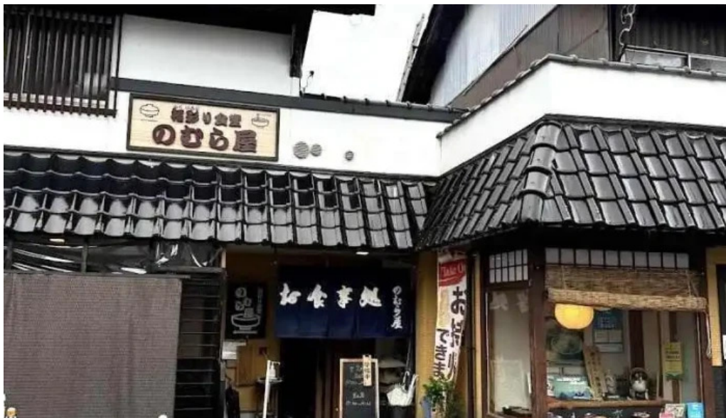
福彩り食堂 のむら屋 勝山市