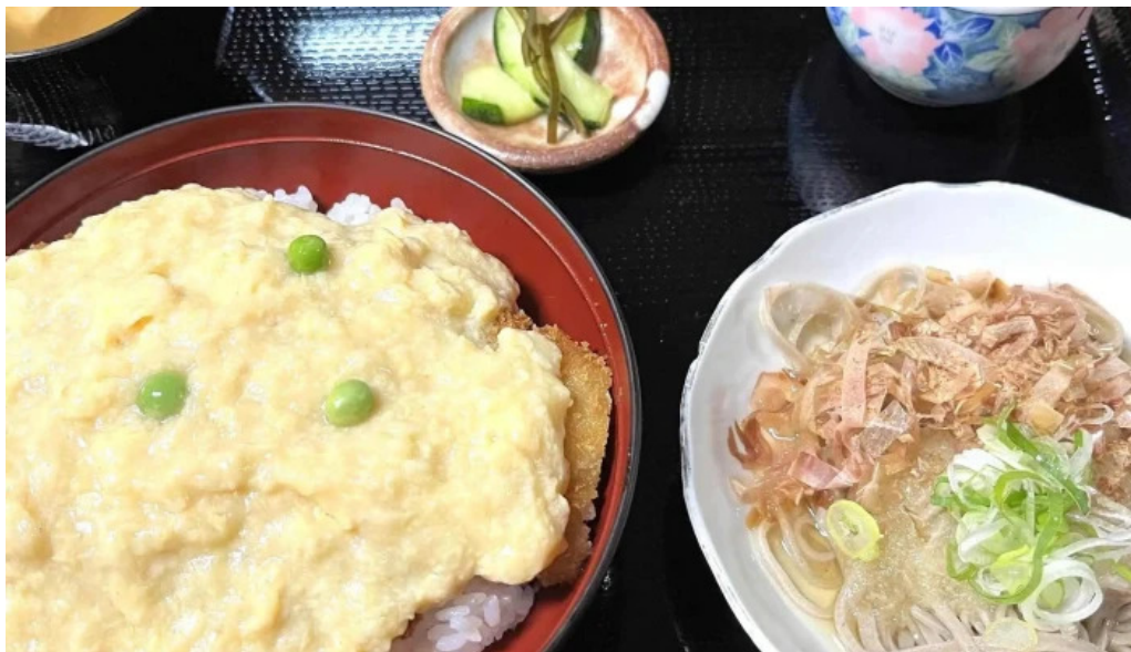
福彩り食堂 のむら屋 comentario 1