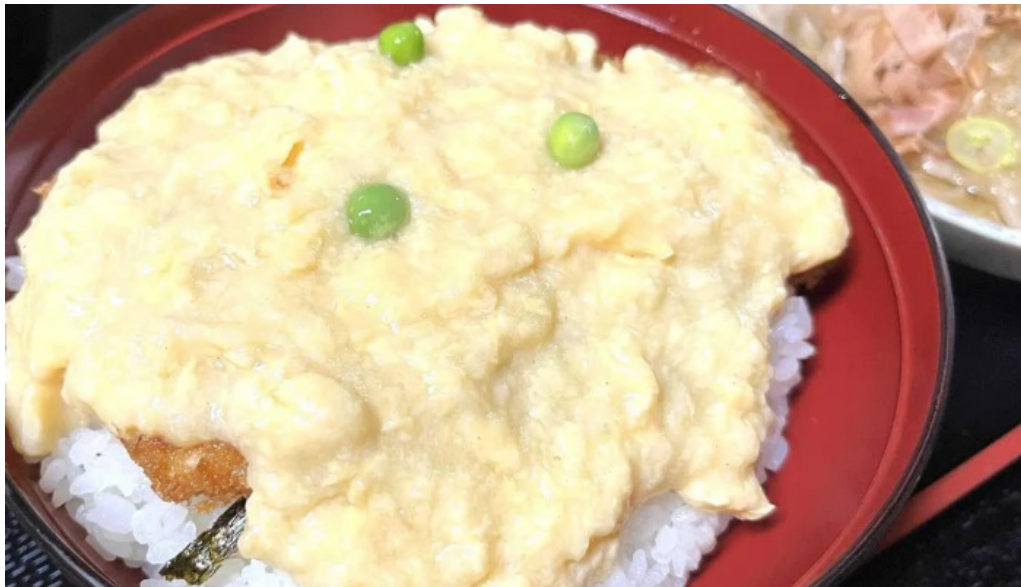
福彩り食堂 のむら屋 comentario 2