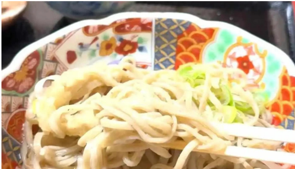
福彩り食堂 のむら屋 動画