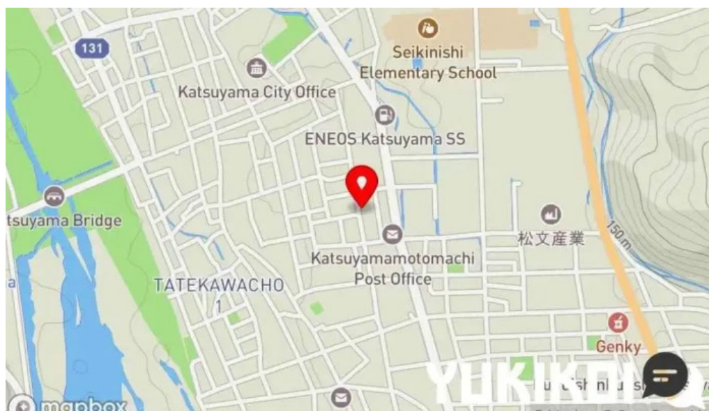
福彩り食堂 のむら屋地図