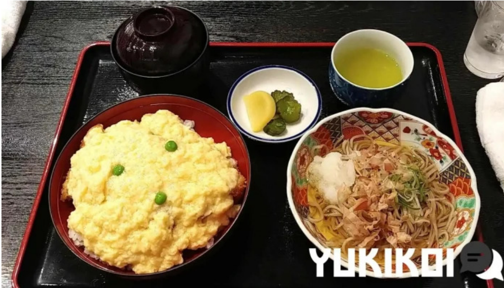
福彩り食堂 のむら屋 蕎麦