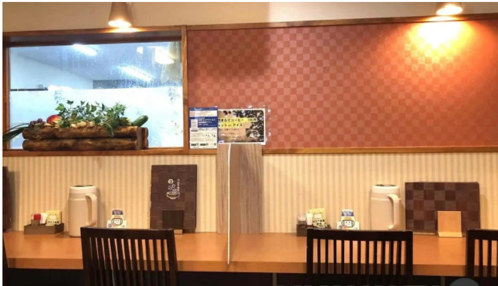
福彩り食堂 のむら屋 雰囲気