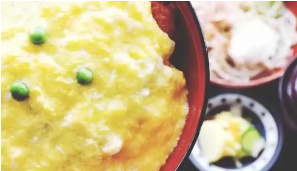
福彩り食堂 のむら屋 カツ丼