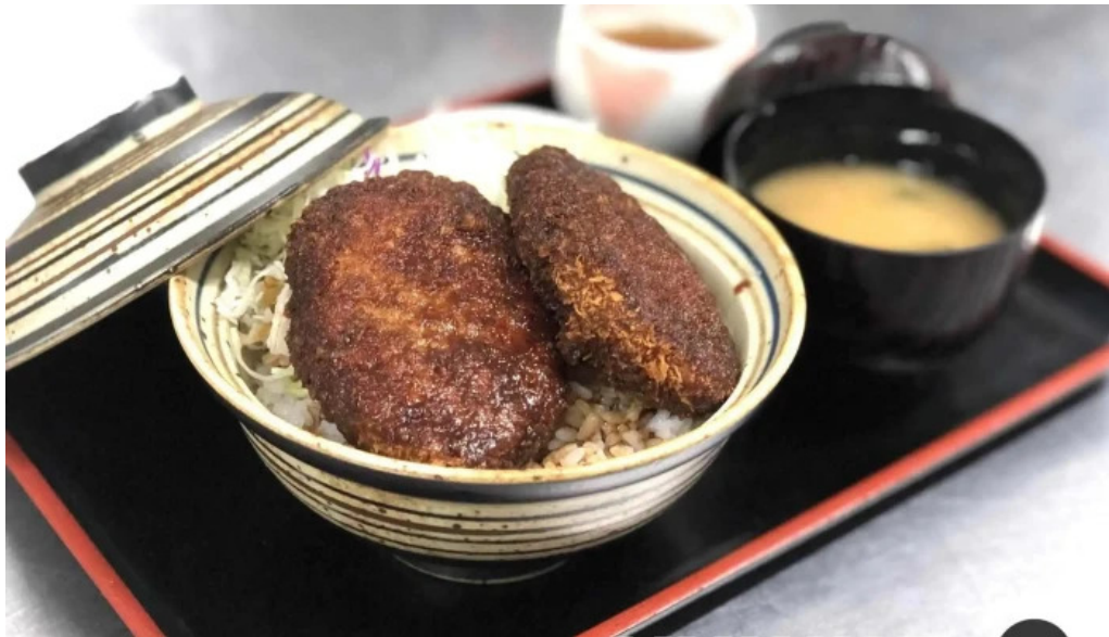
福彩り食堂 のむら屋 料理飲み物