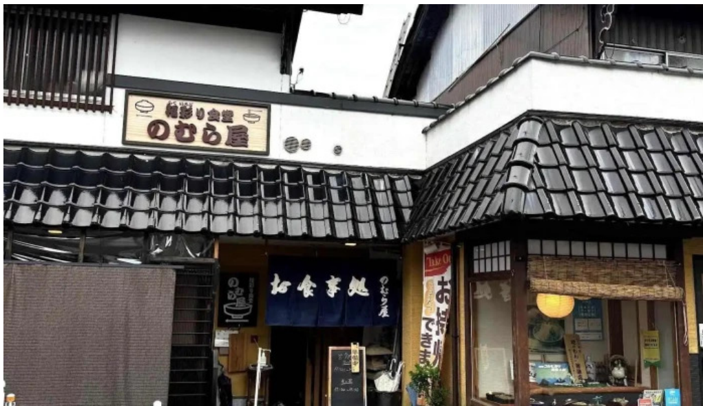
福彩り食堂 のむら屋 すべて