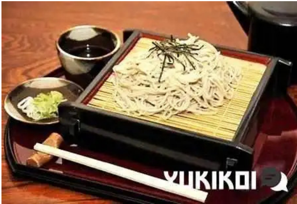
福彩り食堂 のむら屋 オーナー提供