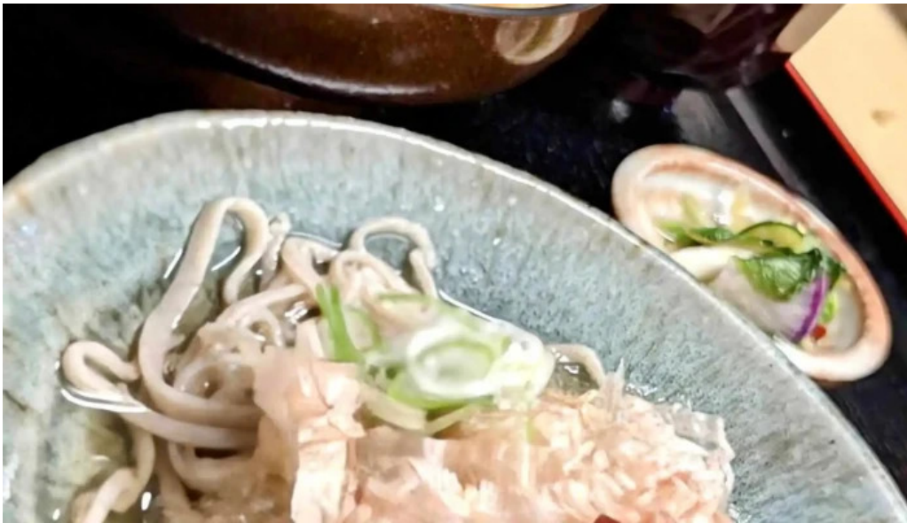
福彩り食堂 のむら屋 最新