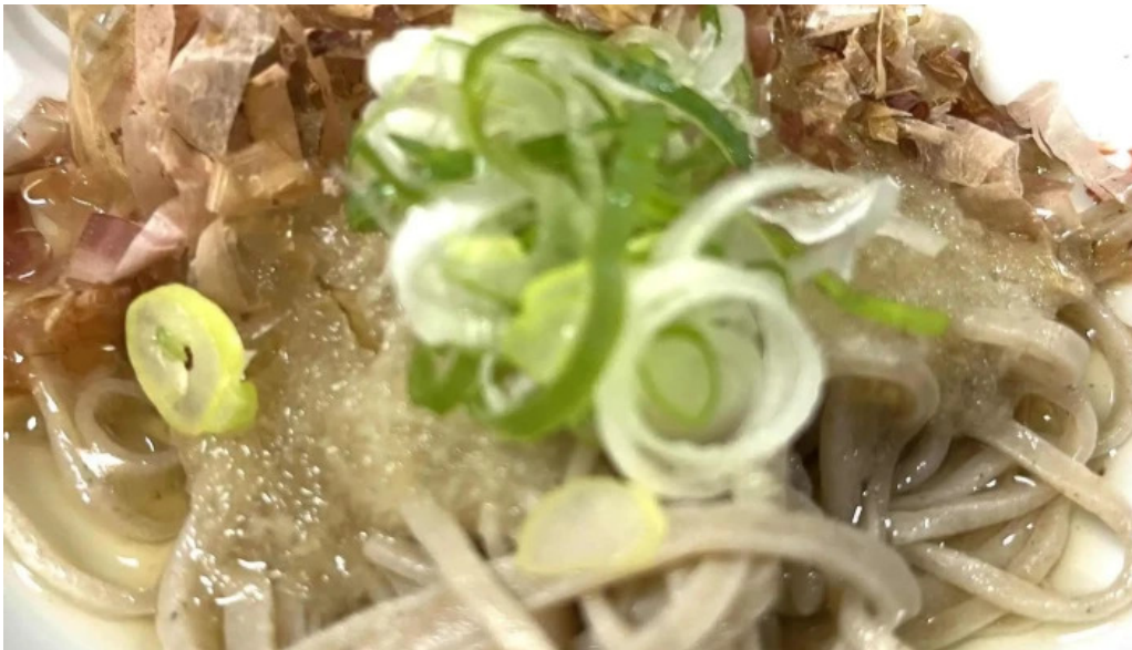
福彩り食堂 のむら屋 comentario 3