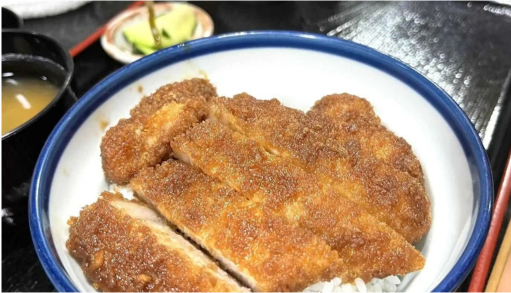
福彩り食堂 のむら屋 comentario 4