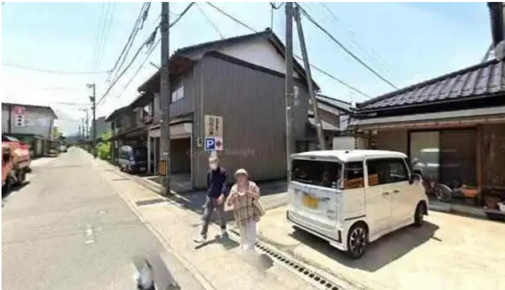
福彩り食堂 のむら屋 ストリートビューと 360 ビュー