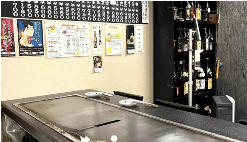
ふじおか メニュー