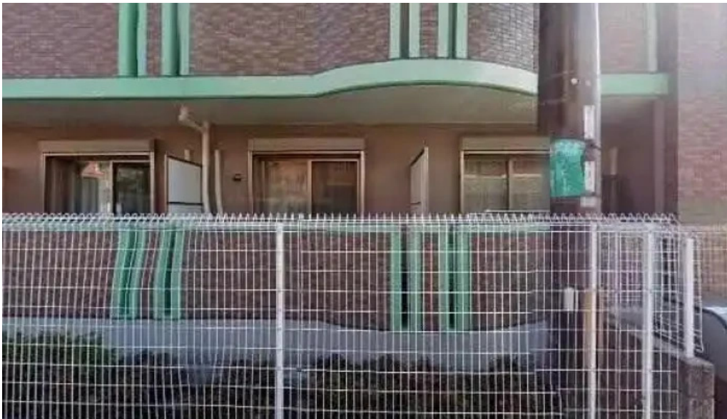
ふじおか 長岡京市