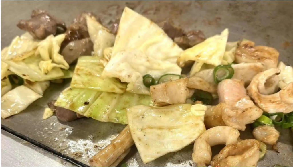
ふじおか カタログ