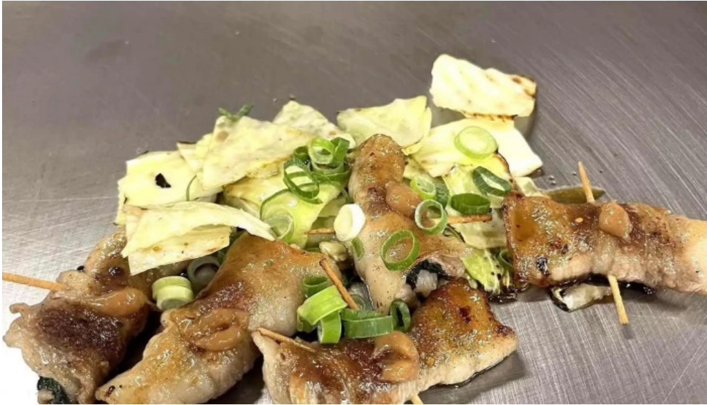
ふじおか 料理飲み物