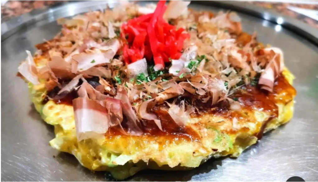
ねこや 料理飲み物