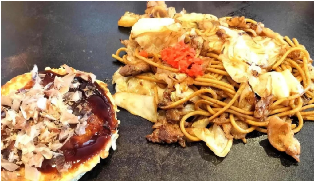
ももたろう 草津店 動画