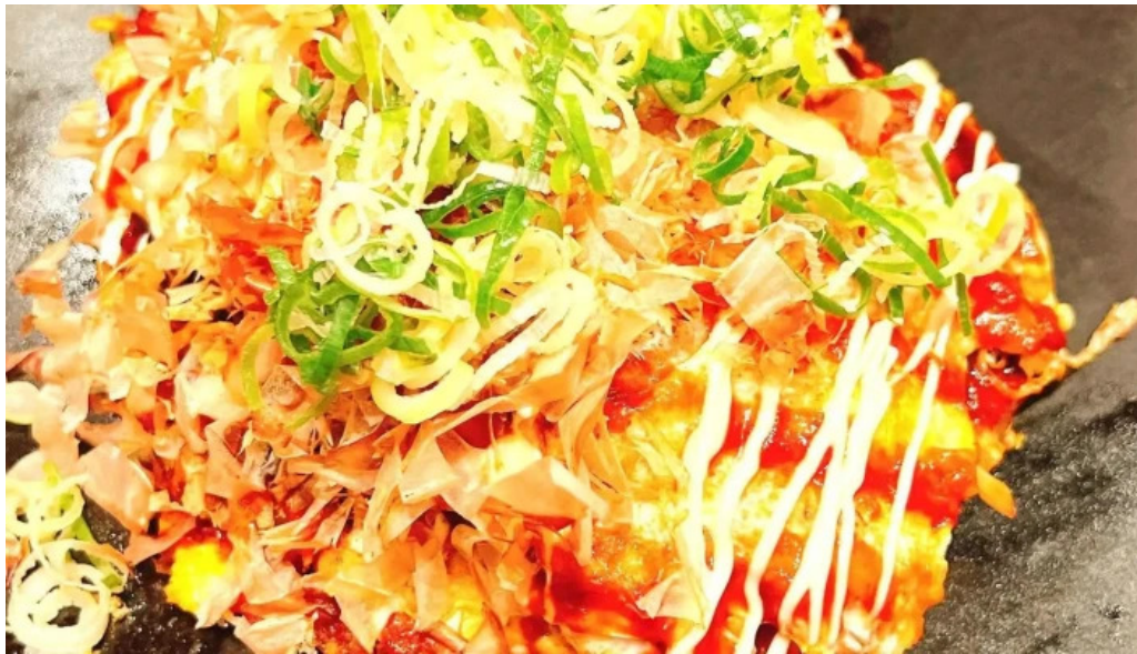
ももたろう 草津店 営業時間