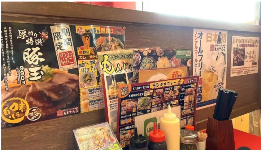
ももたろう 草津店 雰囲気