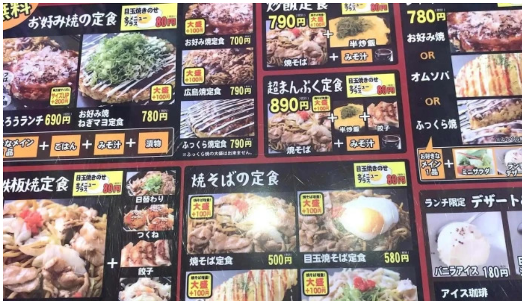
ももたろう 草津店 行き方