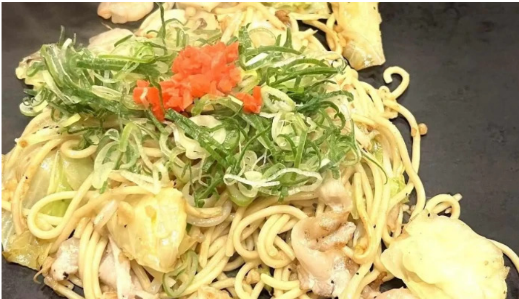
ももたろう 草津店 焼きそば