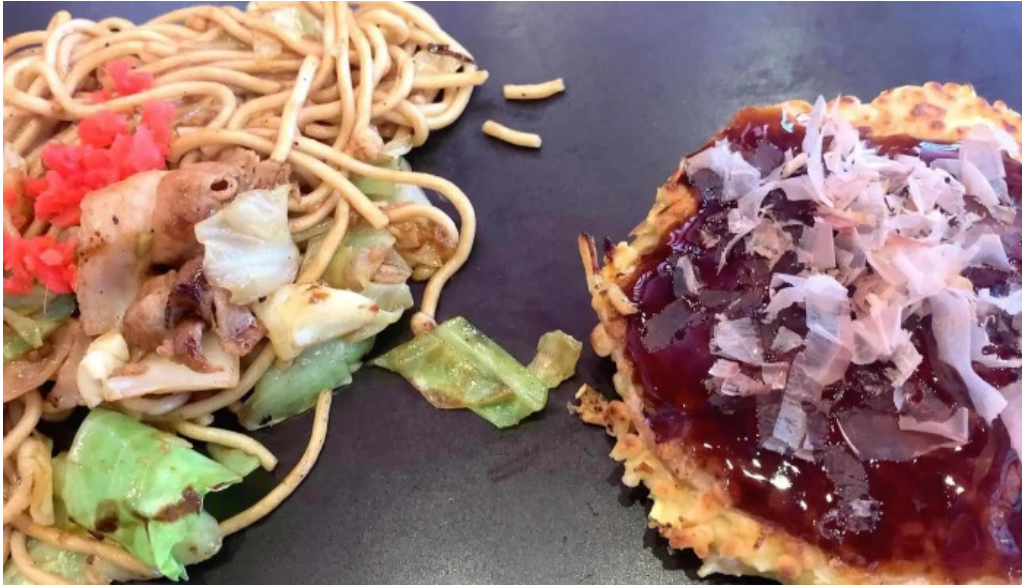
ももたろう 草津店 営業中