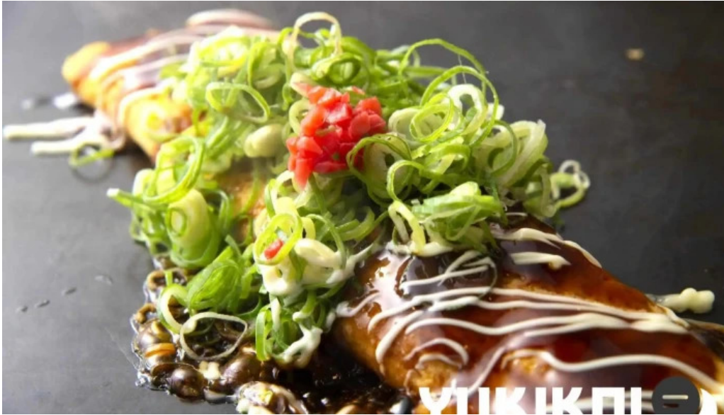
ももたろう 草津店 料理飲み物