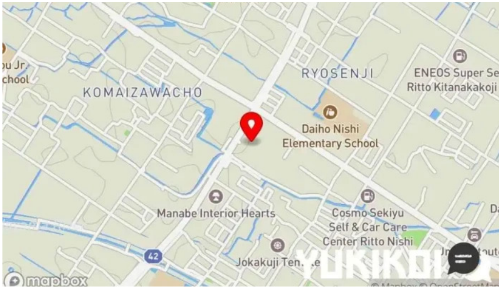
ももたろう 草津店 地図