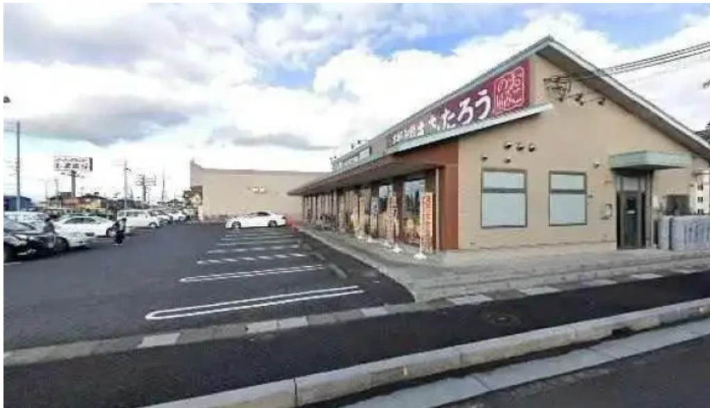
ももたろう 草津店 草津市