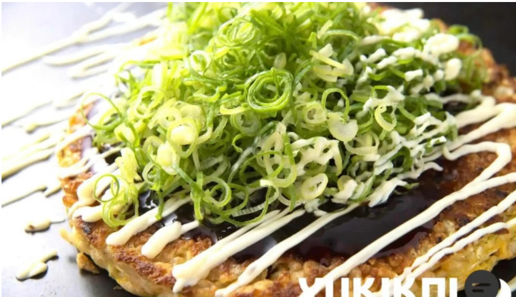
ももたろう 草津店 お好み焼き