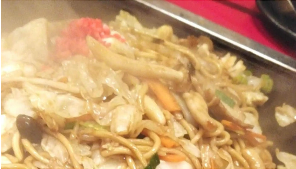
ももたろう 草津店 エリア