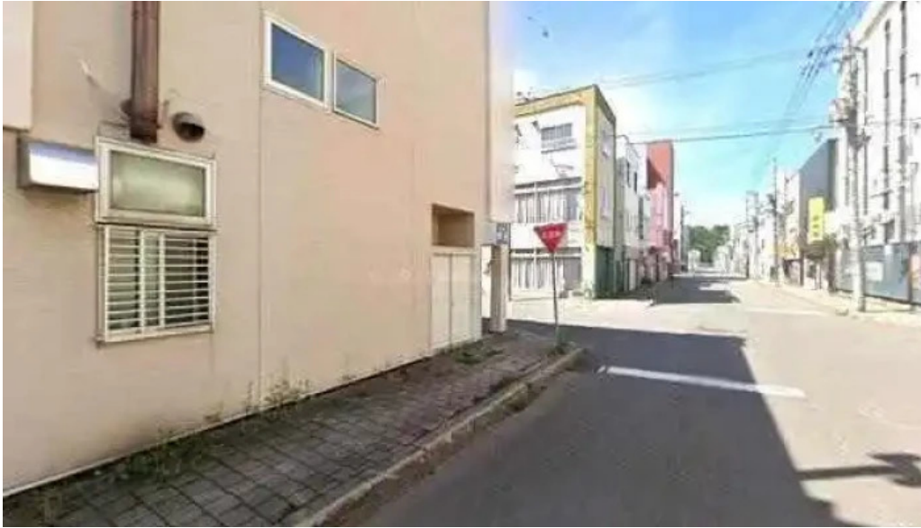
八点鐘 ストリートビューと 360 ビュー