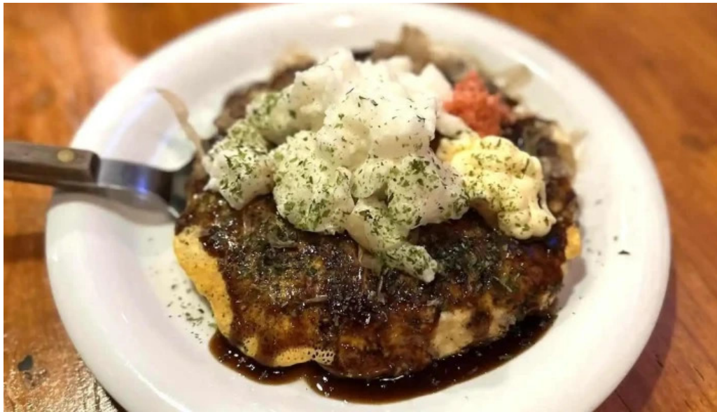
八点鐘 料理飲み物