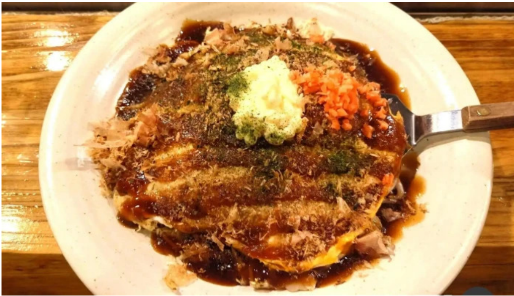
八点鐘 お好み焼き