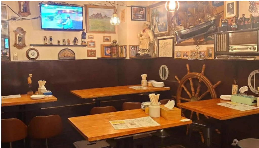
八点鐘 comentario 6