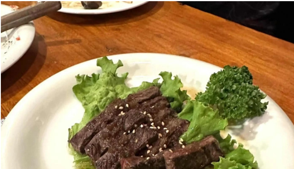
八点钟 comentario 3