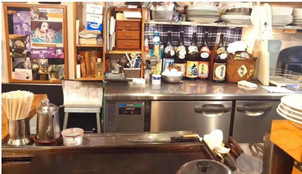
八点鐘 comentario 5