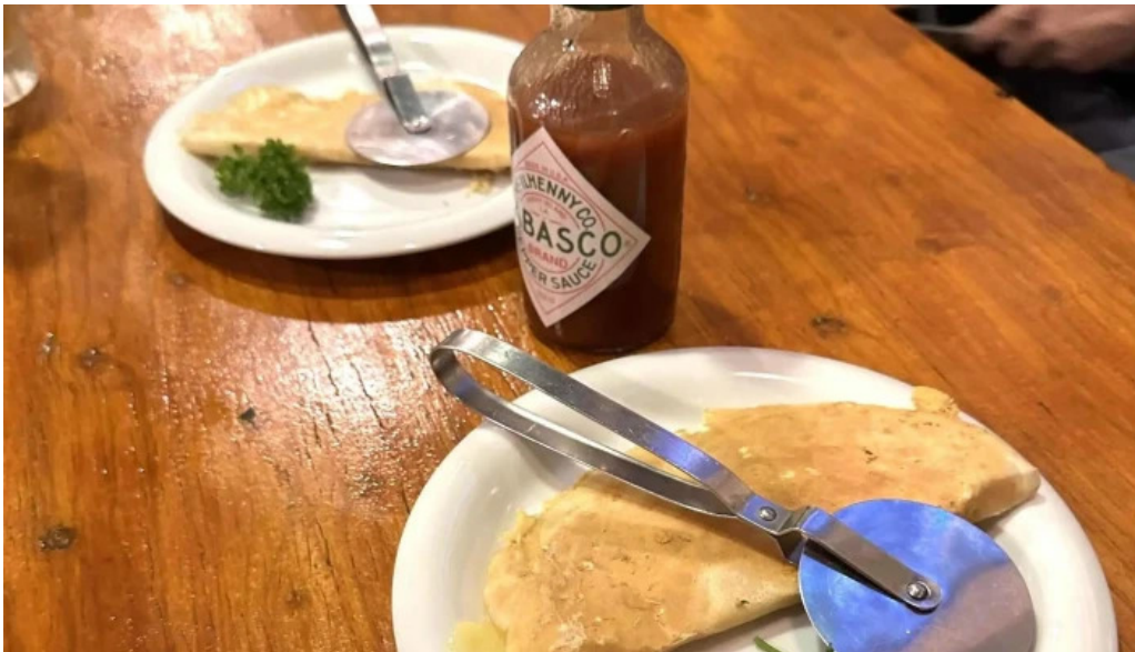
八点鐘 comentario 1