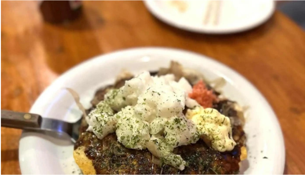
八点鐘 comentario 2