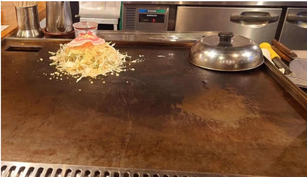
八点鐘 comentario 7