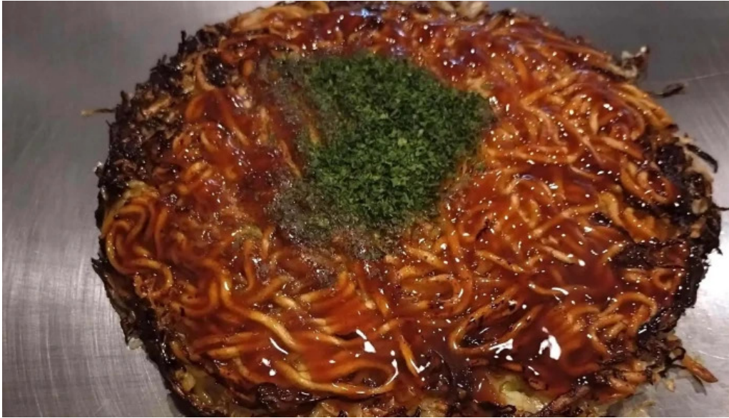
ようき屋 駅前店 comentario 2