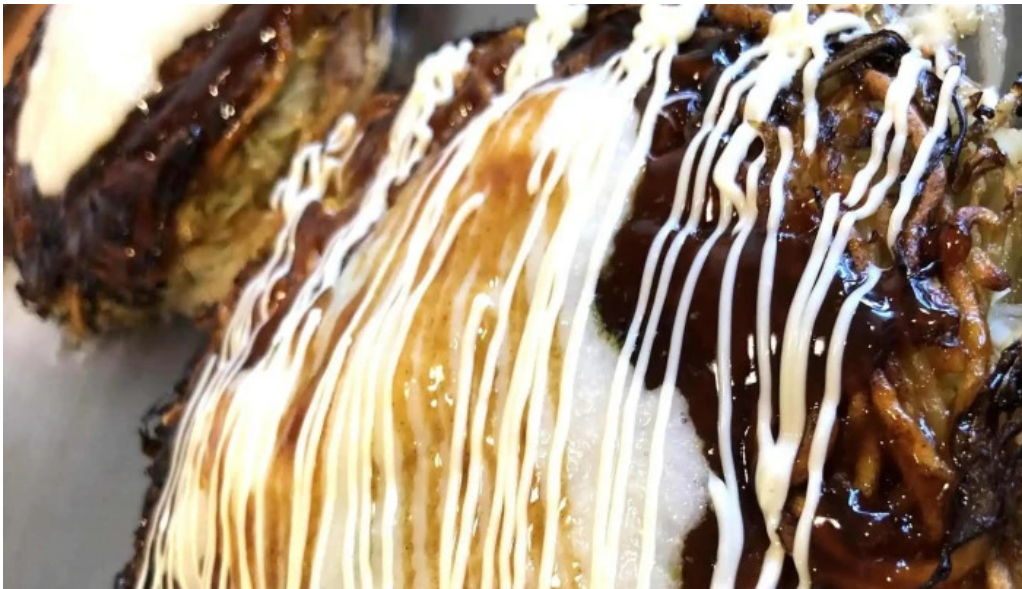
ようき屋 駅前店 comentario 5