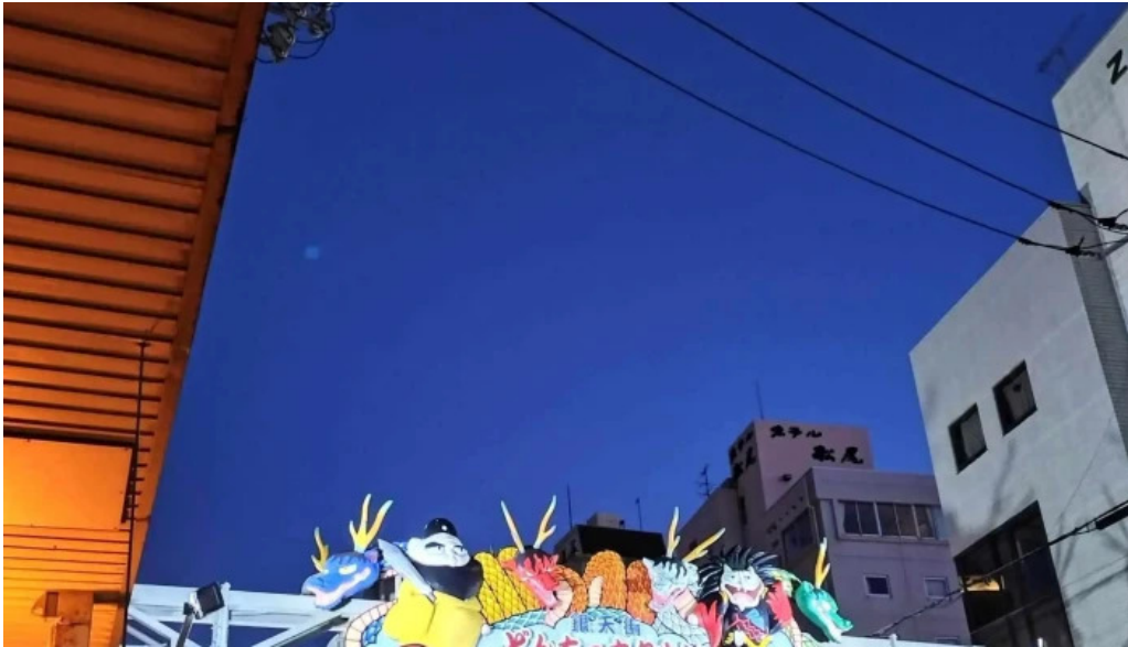
ようき屋 駅前店 comentario 1