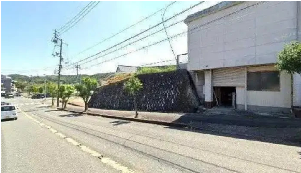
ようき屋 駅前店 ストリートビューと 360 ビュー