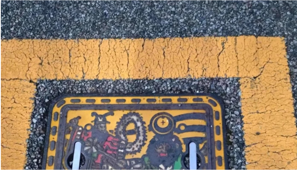
ようき屋 駅前店 comentario 4