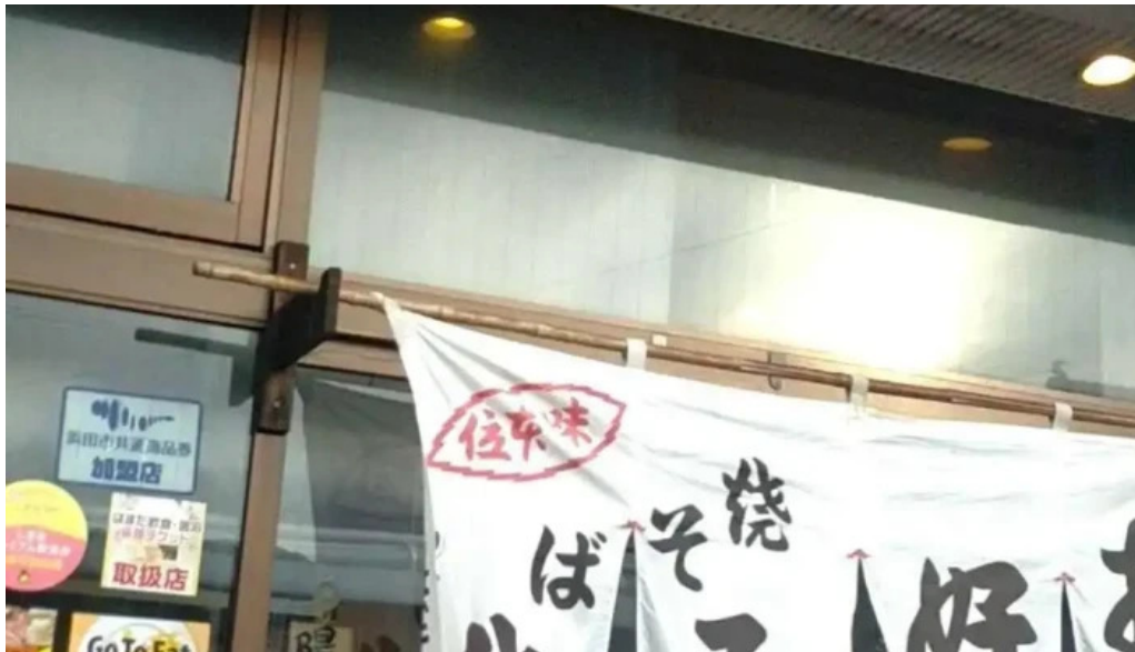
ようき屋 駅前店 動画