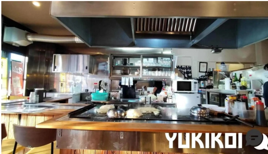
ようき屋 駅前店 雰囲気