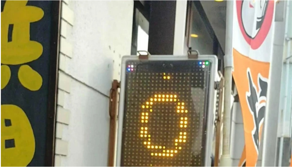
ようき屋 駅前店 comentario 6