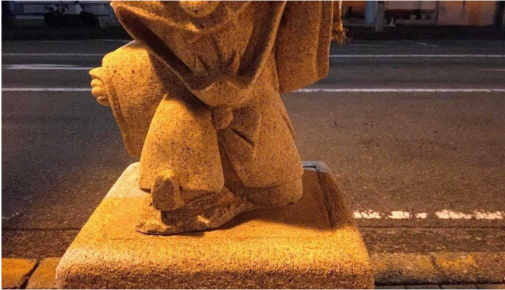
ようき屋 駅前店 最新