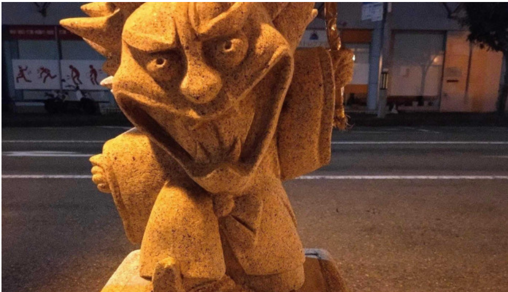
ようき屋 駅前店 comentario 3