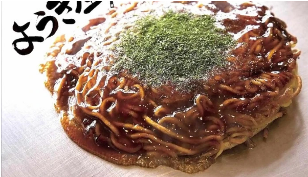
ようき屋 駅前店 料理飲み物