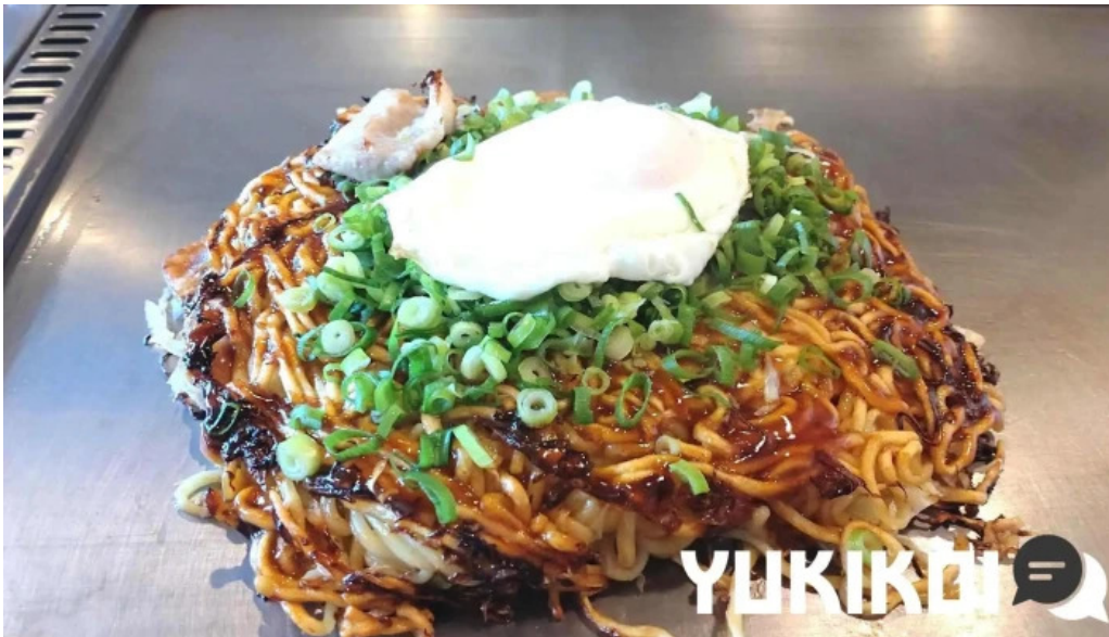
ようき屋 駅前店 お好み焼き