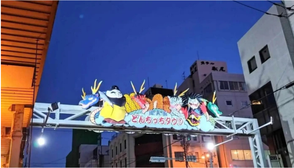
ようき屋 駅前店 すべて