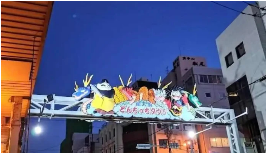
ようき屋 駅前店 浜田市