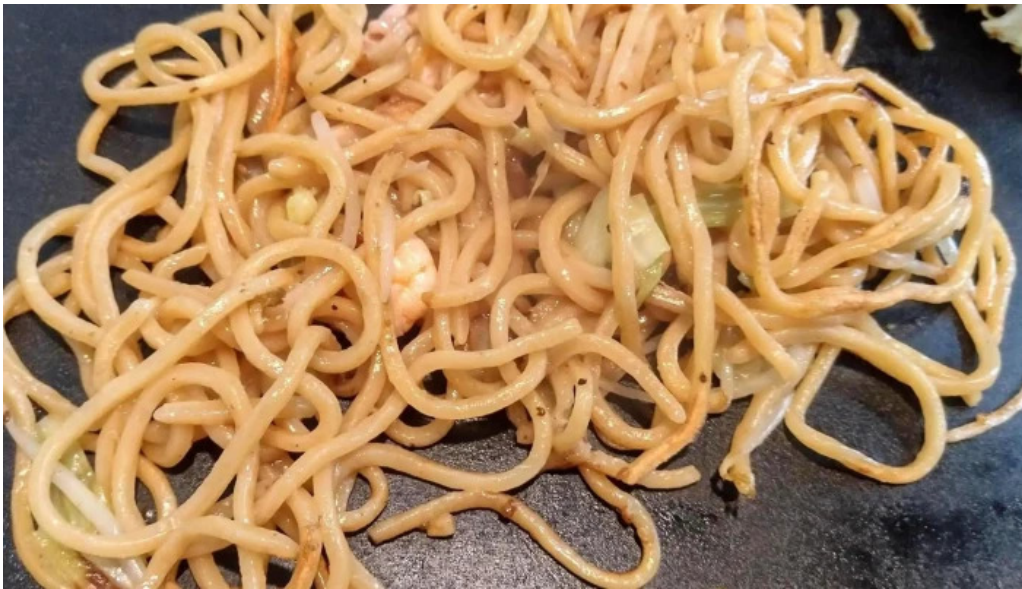
鶴橋風月 桜井店 動画