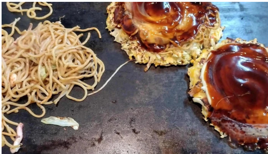
鶴橋風月 桜井店 電話