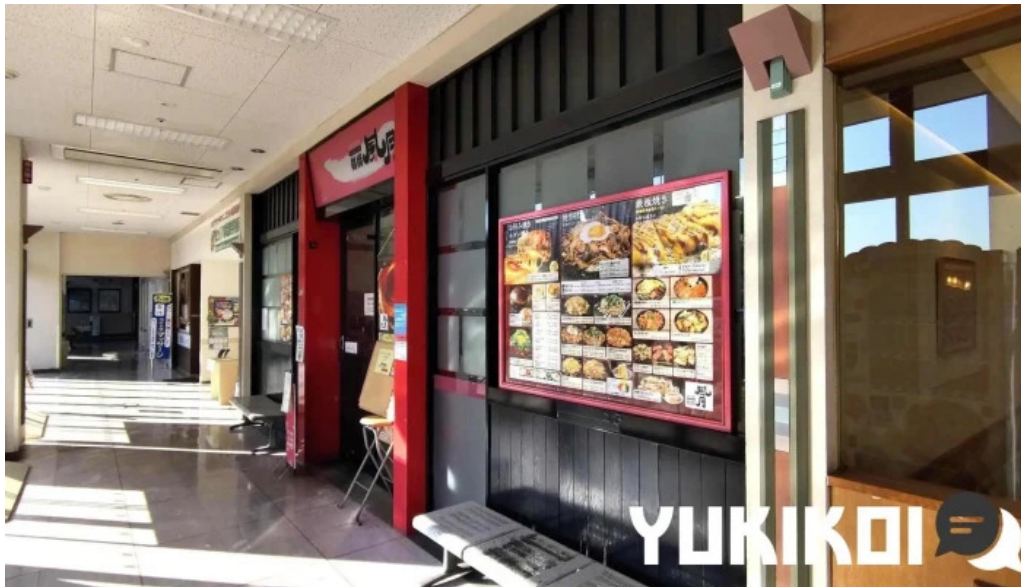
鶴橋風月 桜井店 雰囲気