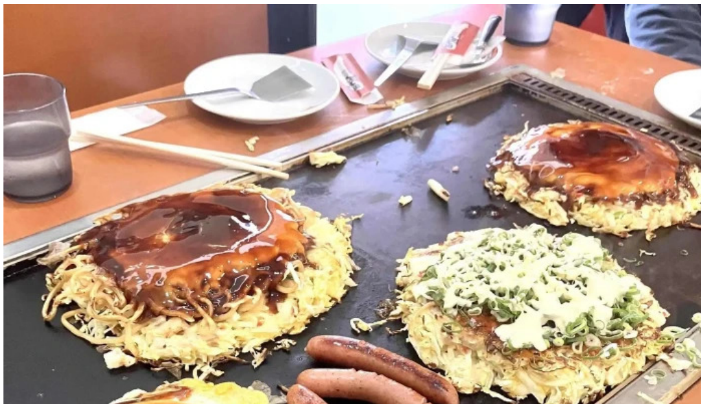
鶴橋風月 桜井店 行き方