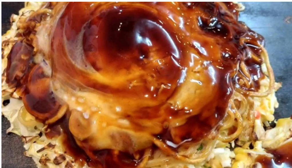
鶴橋風月 桜井店 営業中