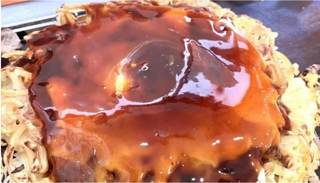
鶴橋風月 桜井店 お好み焼き