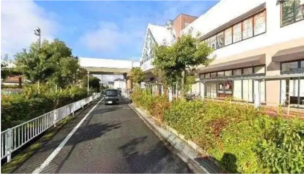
鶴橋風月 桜井店 桜井市