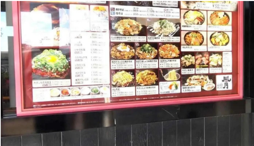
鶴橋風月 桜井店 メニュー