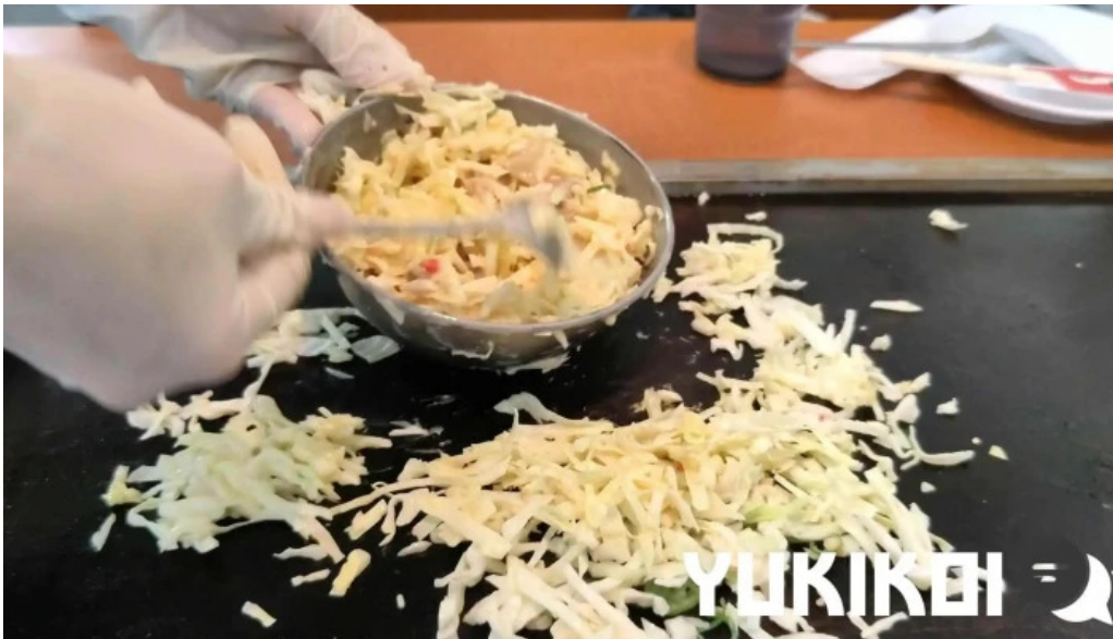
鶴橋風月 桜井店 料理飲み物