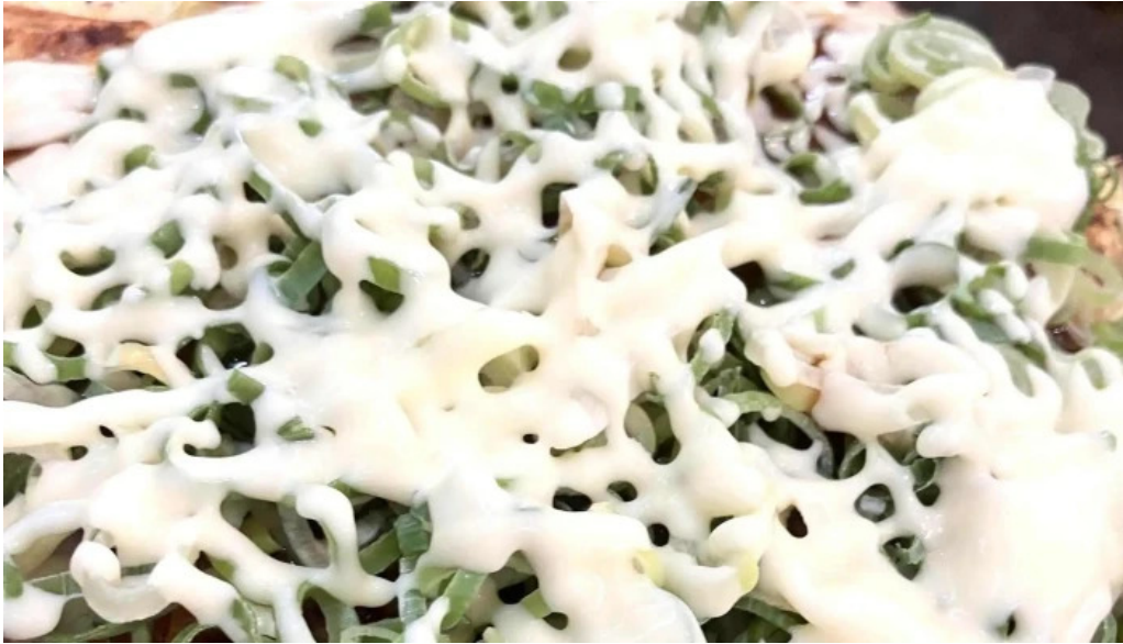
鶴橋風月 桜井店 住所