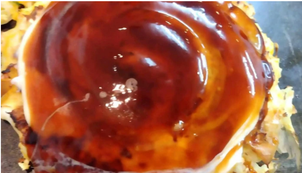
鶴橋風月 桜井店 エリア