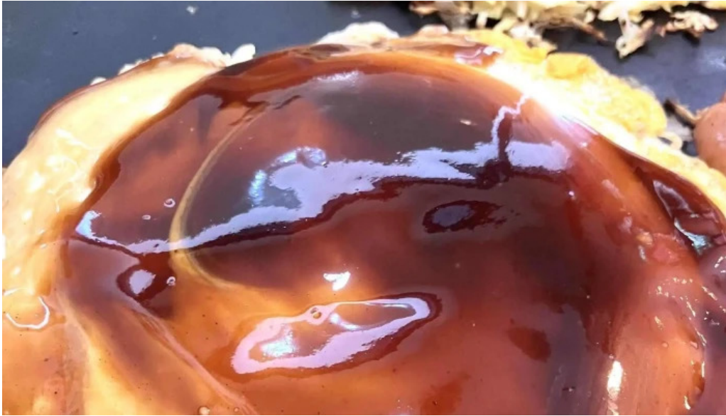
鶴橋風月 桜井店 スコア