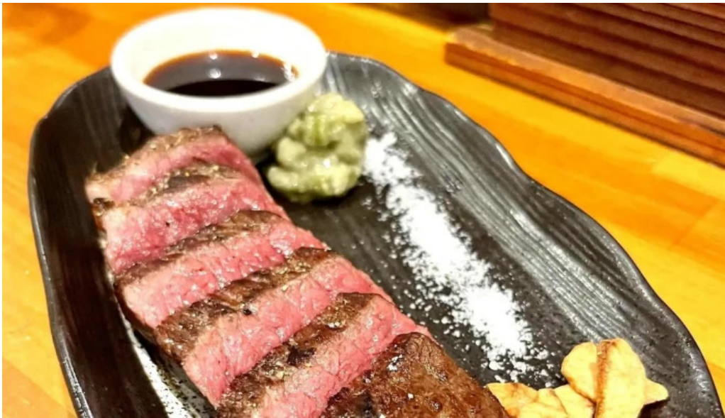
鉄板焼酒場 はふう どこ