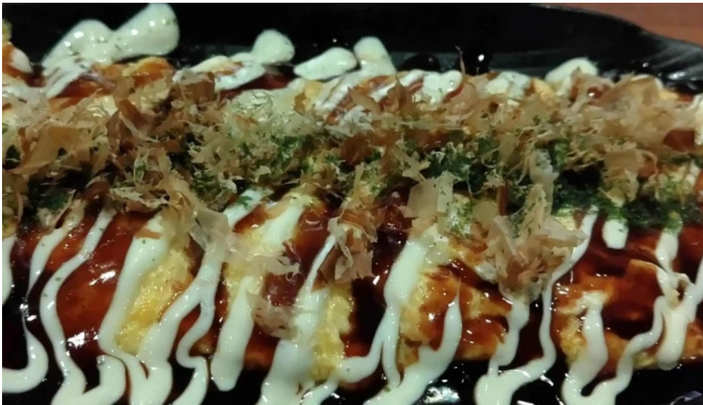
鉄板焼酒場 はふう 住所