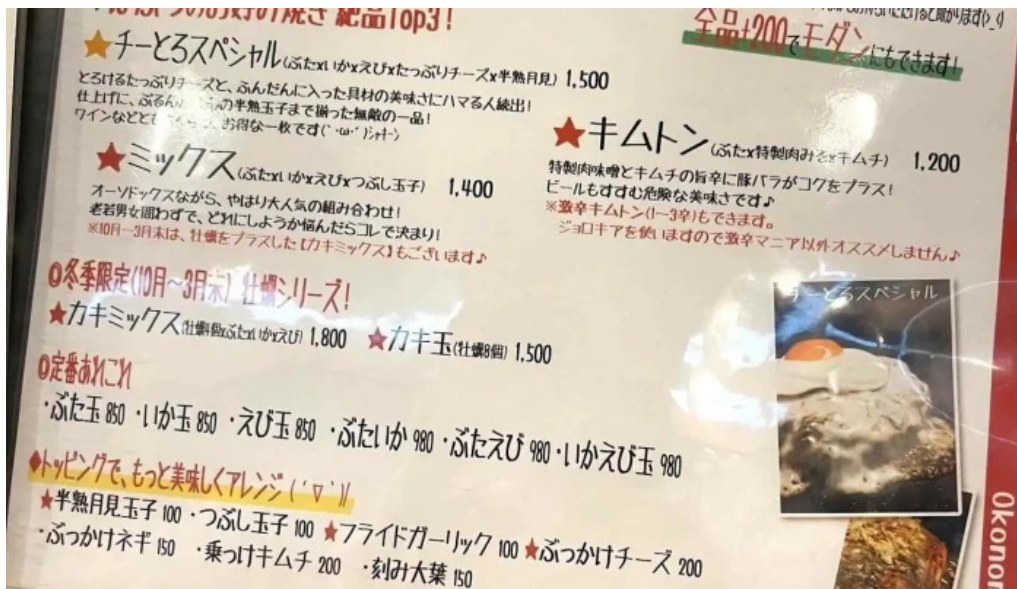
鉄板焼酒場 はふう メニュー