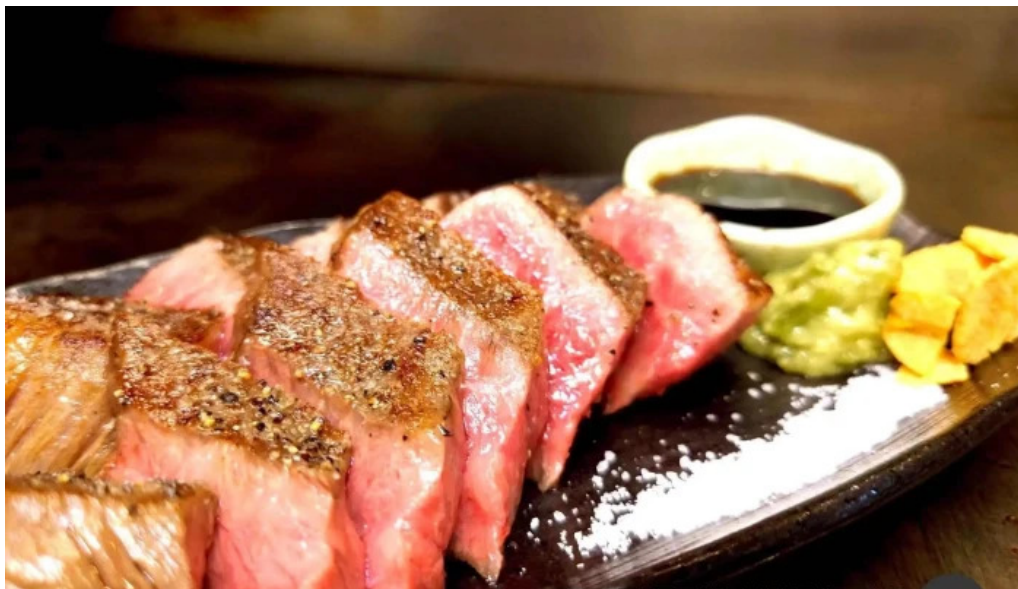
鉄板焼酒場 はふう オーナー提供