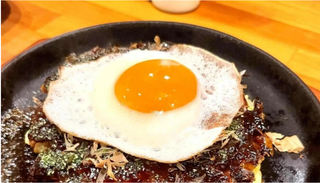
鉄板焼酒場 はふう エリア