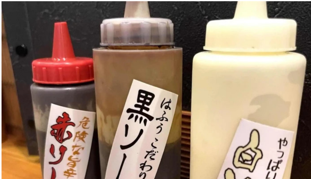
鉄板焼酒場 はふう instagram