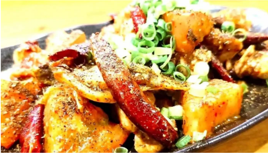
鉄板焼酒場 はふう 料理飲み物