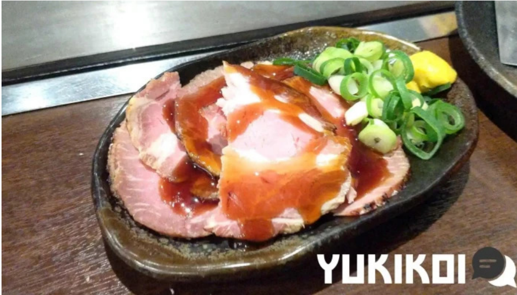
鉄板焼酒場 はふう 動画