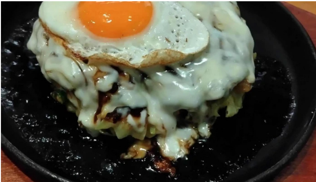
鉄板焼酒場 はふう 営業時間