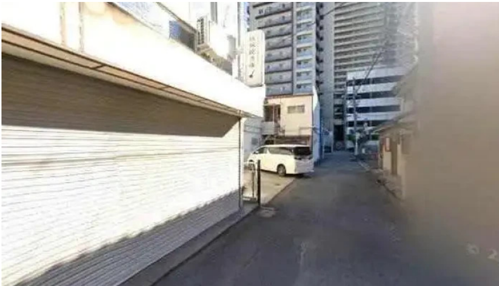
鉄板焼酒場 はふう 寝屋川市