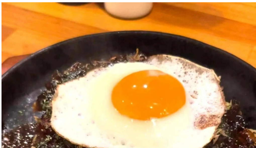
鉄板焼酒場 はふう 電話