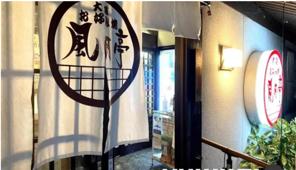
大阪風月亭 坂井市