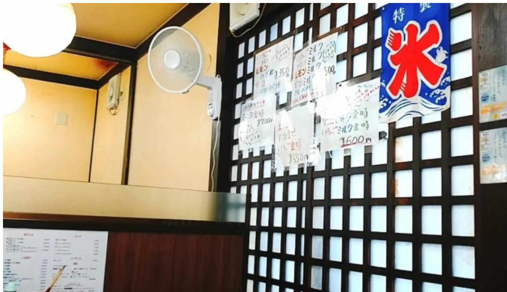
大阪風月亭 comentario 5