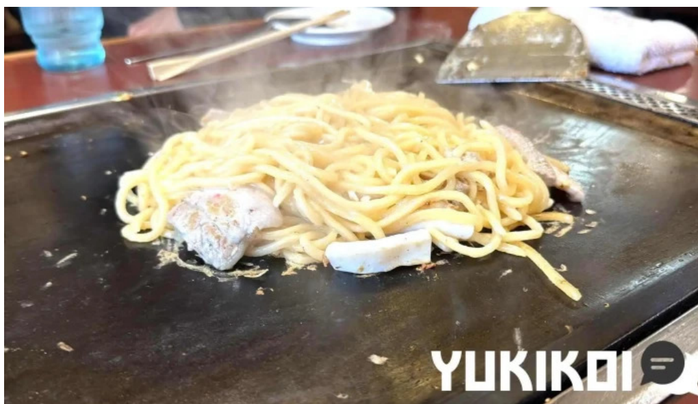
大阪風月亭 焼きそば