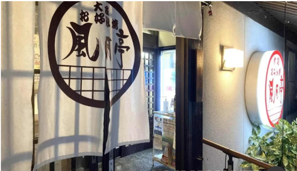
大阪風月亭 すべて