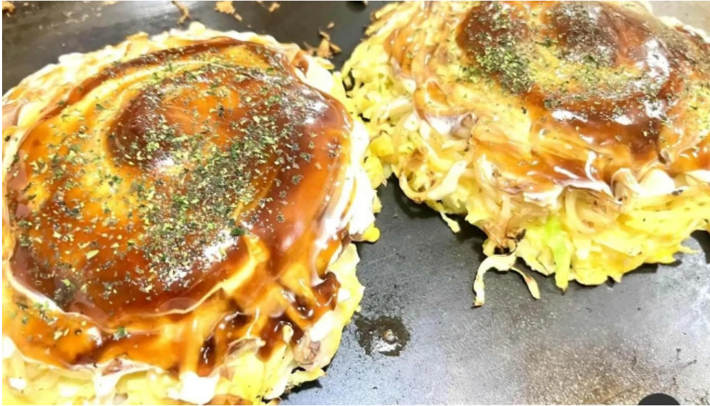
大阪風月亭 料理飲み物