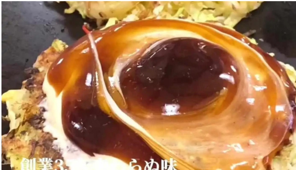
大阪風月亭 お好み焼き