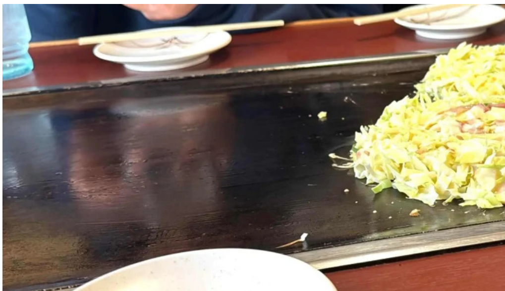
大阪風月亭 comentario 2