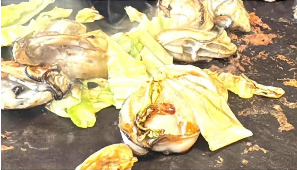
大阪風月亭 comentario 4