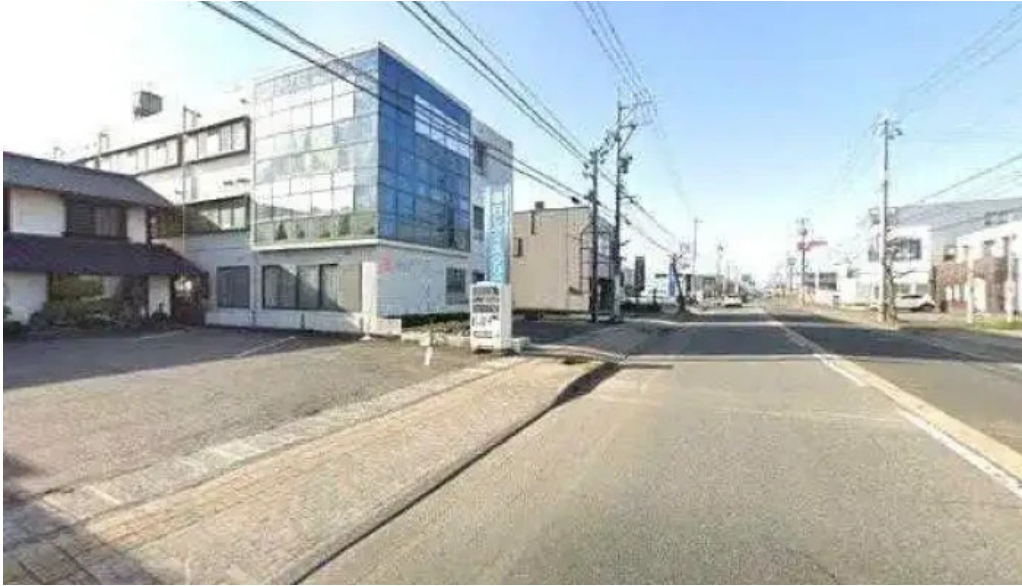
大阪風月亭 ストリートビューと 360 ビュー