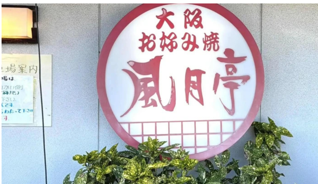
大阪風月亭 comentario 1