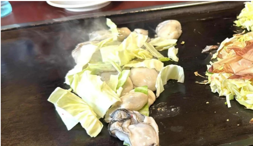
大阪風月亭 comentario 3