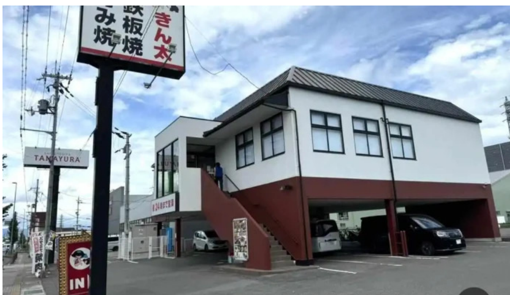
お好み焼・鉄板焼 きん太 赤池店 京都市