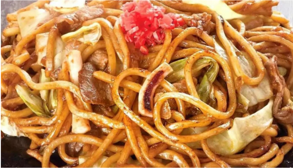
お好み焼鉄板焼 きん太 赤池店 焼きそば