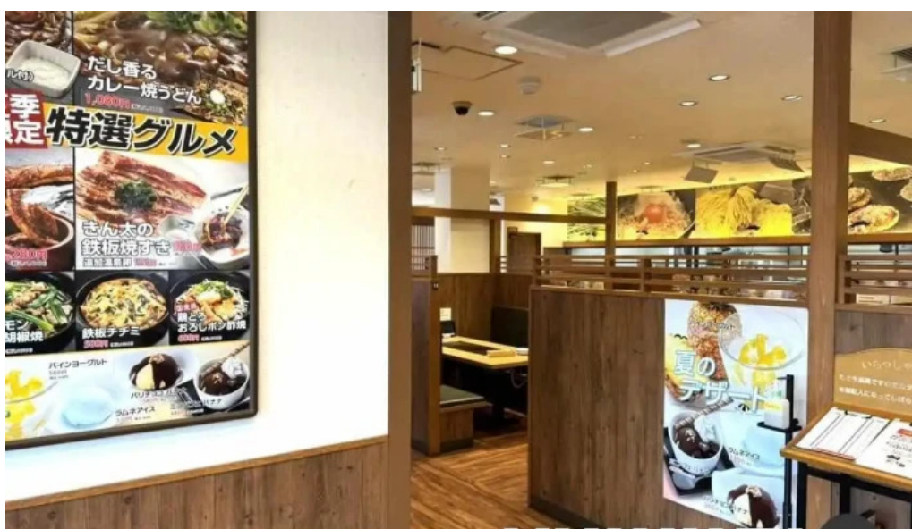
お好み焼鉄板焼 きん太 赤池店 雰囲気