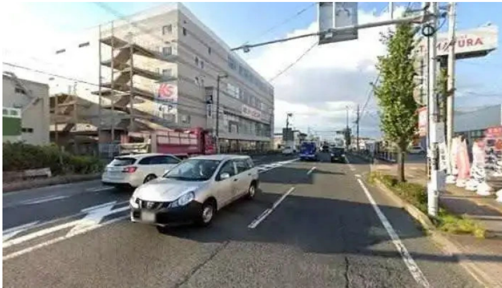
お好み焼鉄板焼 きん太 赤池店 京都市