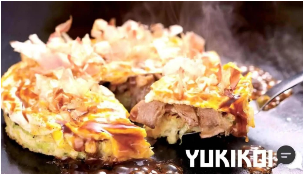
お好み焼鉄板焼 きん太 赤池店 料理飲み物