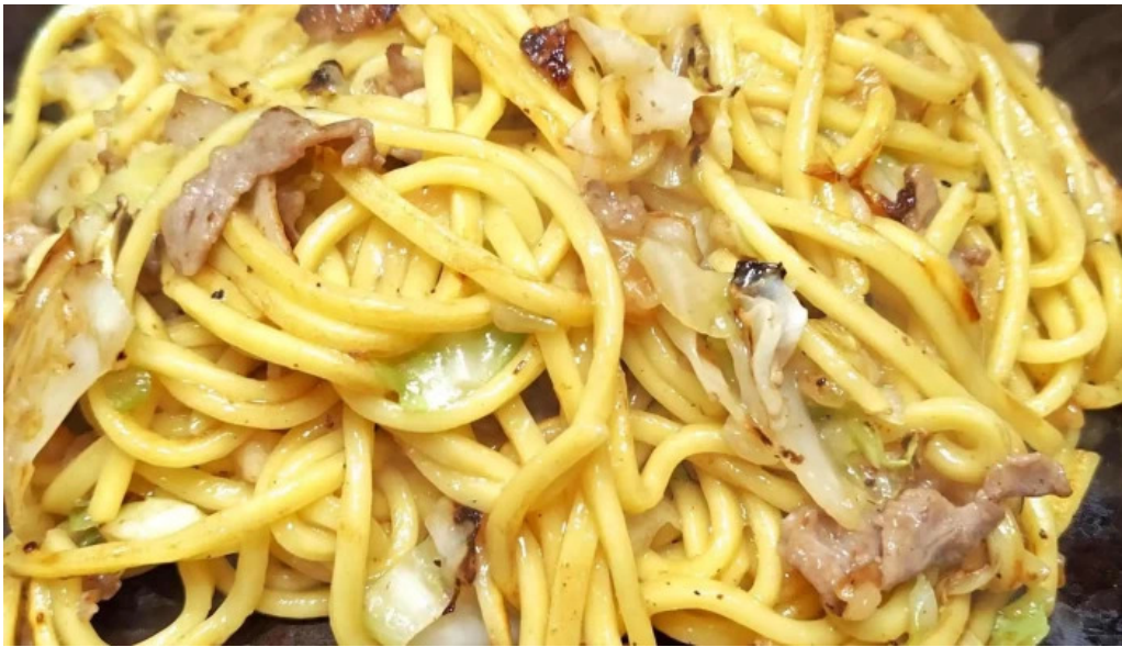
お好み焼鉄板焼 きん太 赤池店 プロモーション