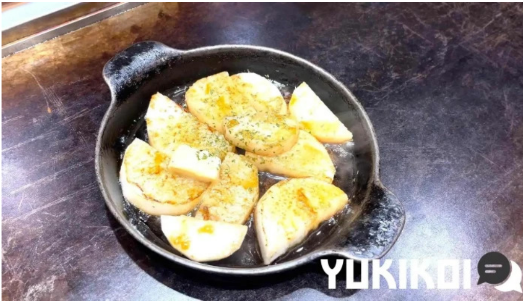
お好み焼鉄板焼 きん太 赤池店 イタヤガイ科