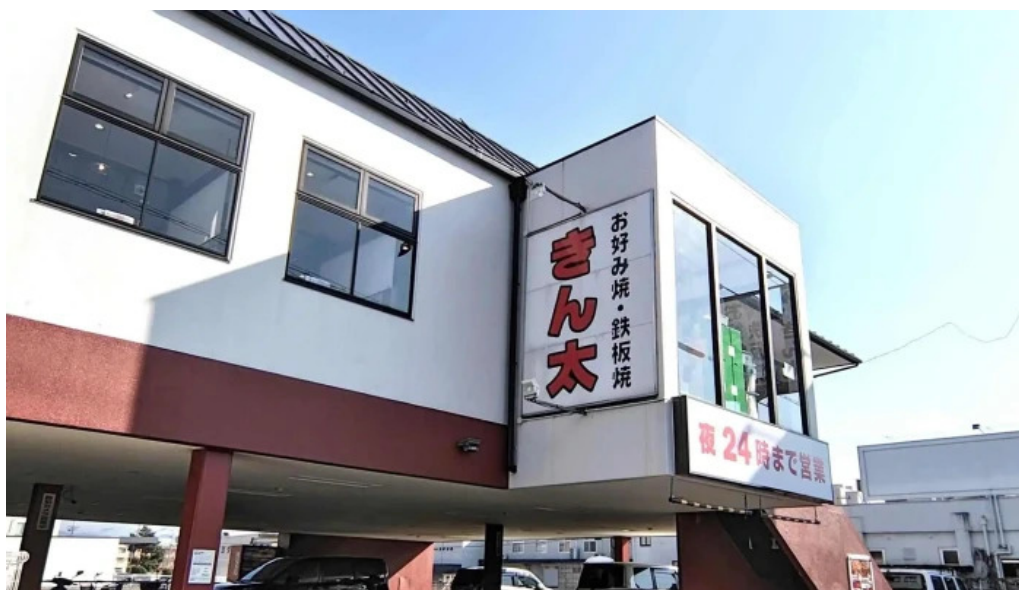
お好み焼鉄板焼 きん太 赤池店 電話