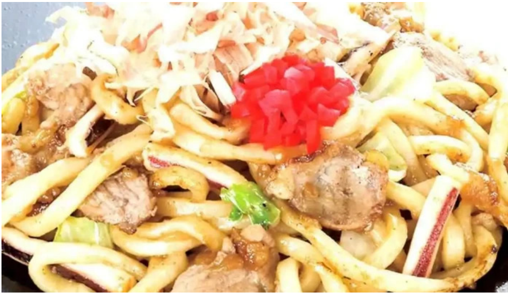
お好み焼鉄板焼 きん太 赤池店