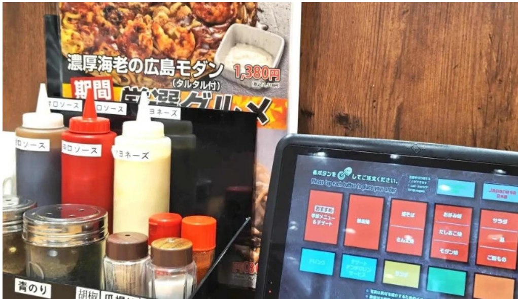
お好み焼鉄板焼 きん太 赤池店 口コミ