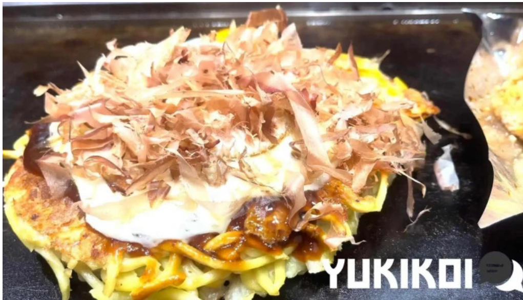
お好み焼鉄板焼 きん太 赤池店 動画