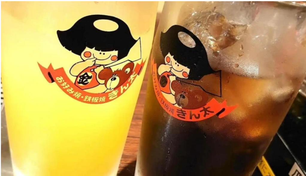
お好み焼鉄板焼 きん太 赤池店 ビール