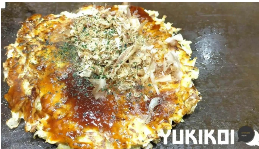
お好み焼鉄板焼 きん太 赤池店 お好み焼き