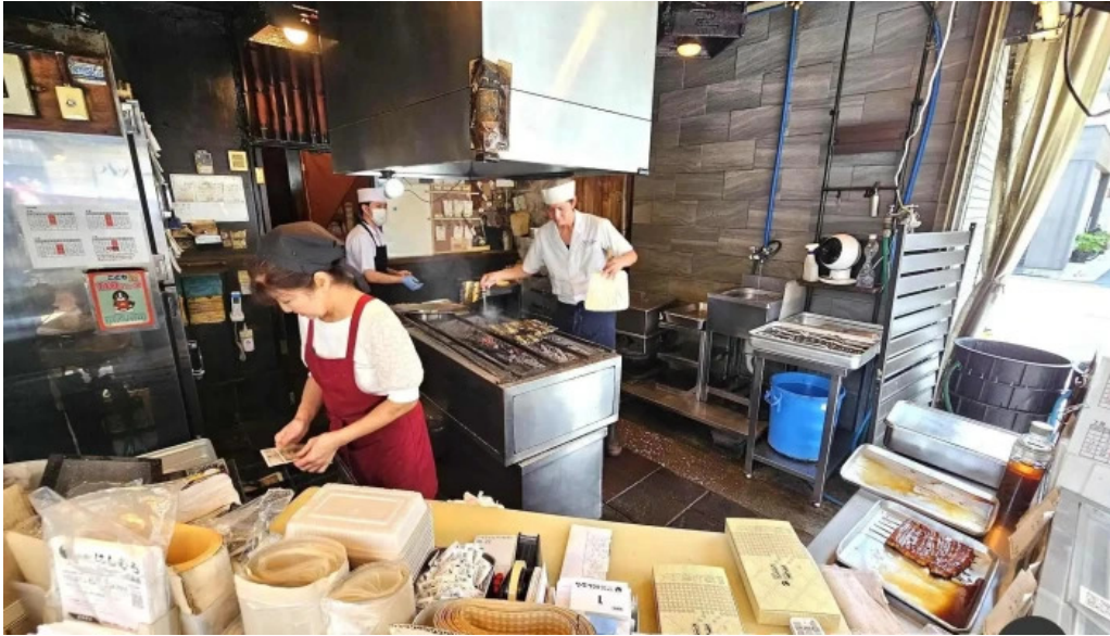
八つ目やしむら 目黒店 雰囲気