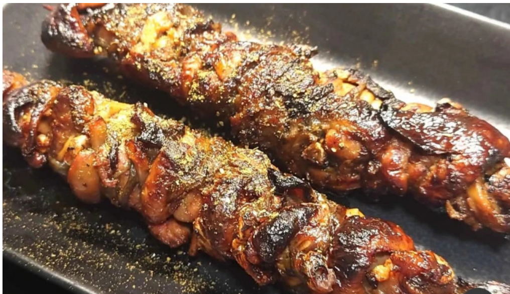
八つ目や にしむら 目黒店 料理飲み物