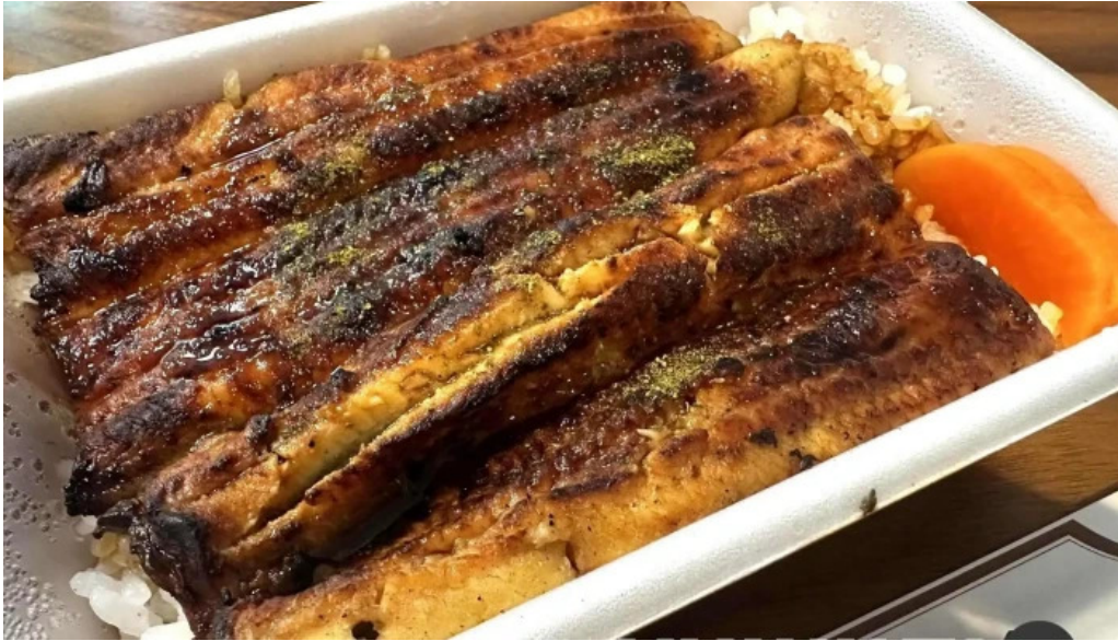
八つ目や にしむら 目黒店 ウナギ