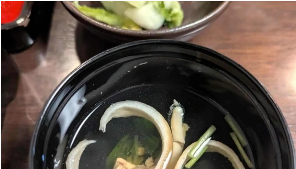
八つ目や にしむら 目黒店 最新