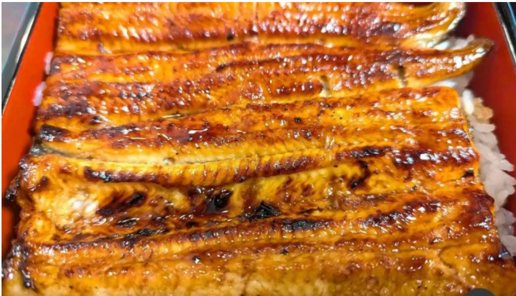
八つ目や にしむら 目黒店 シーフード