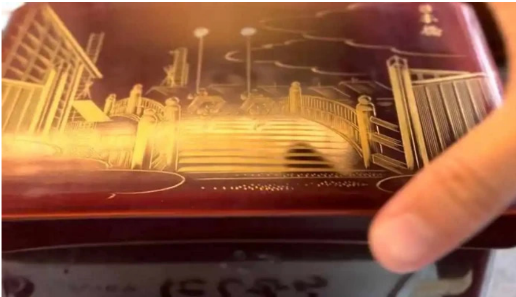
八つ目や にしむら 目黒店 動画