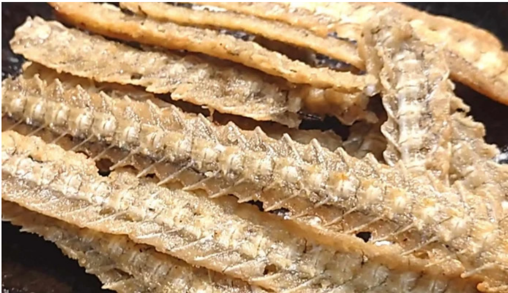
八つ目や にしむら 目黒店 電話