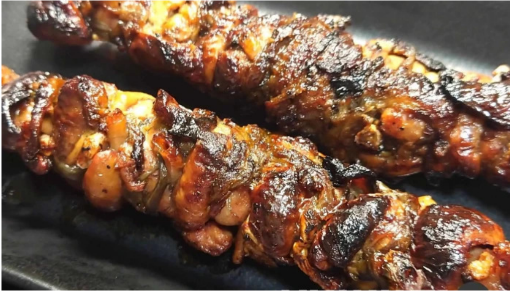
八つ目や にしむら 目黒店 焼き鳥