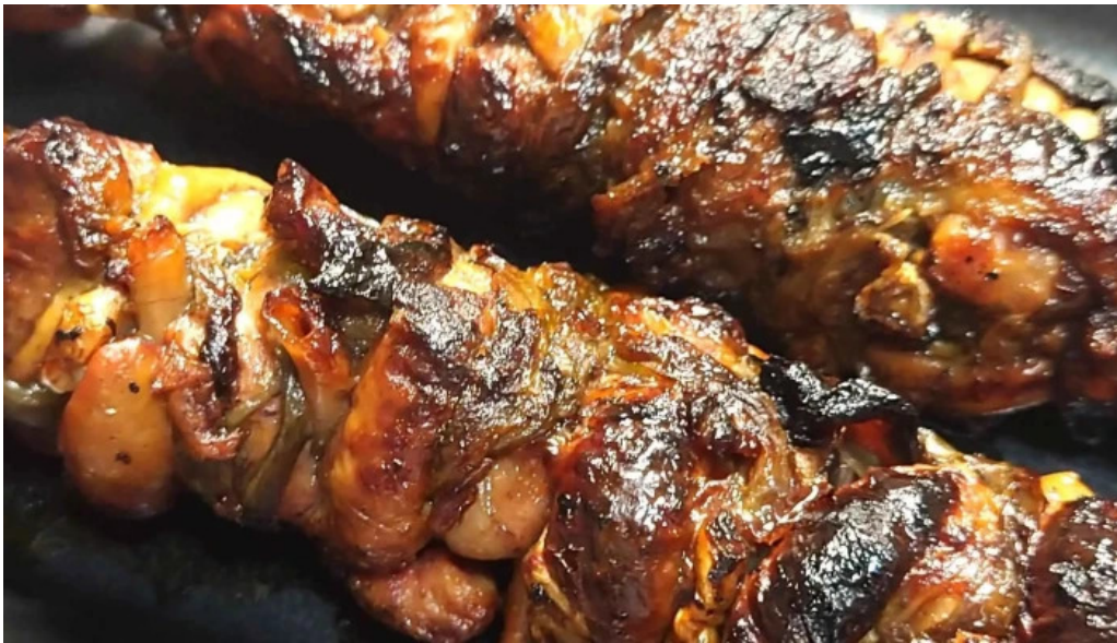
八つ目や にしむら 目黒店 どこ