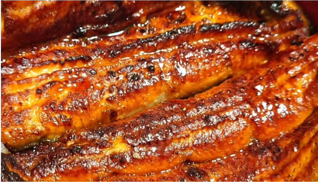
八つ目や にしむら 目黒店 スコア