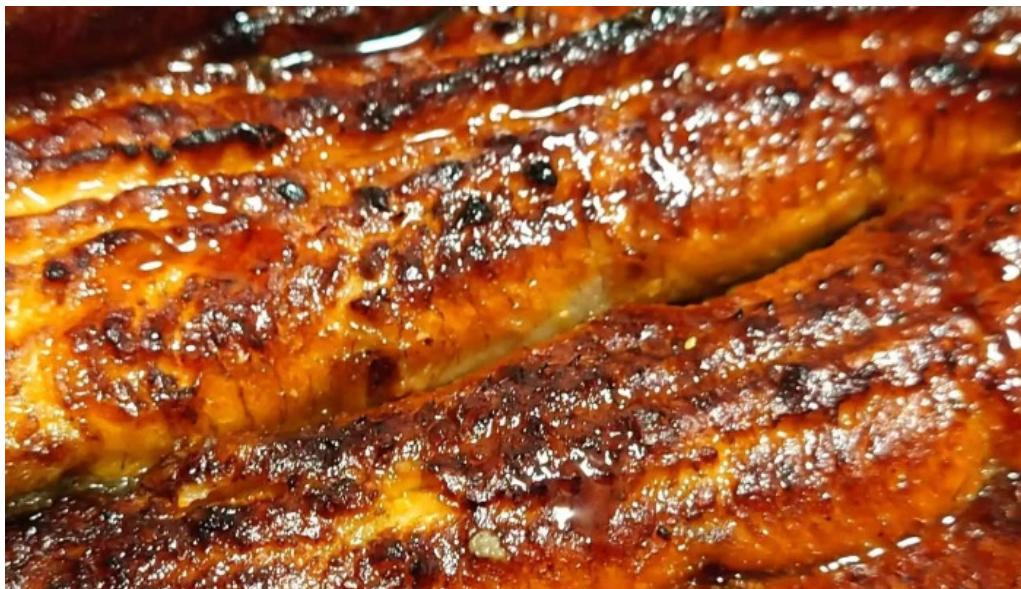
八つ目やにしむら 目黒店 口コミ