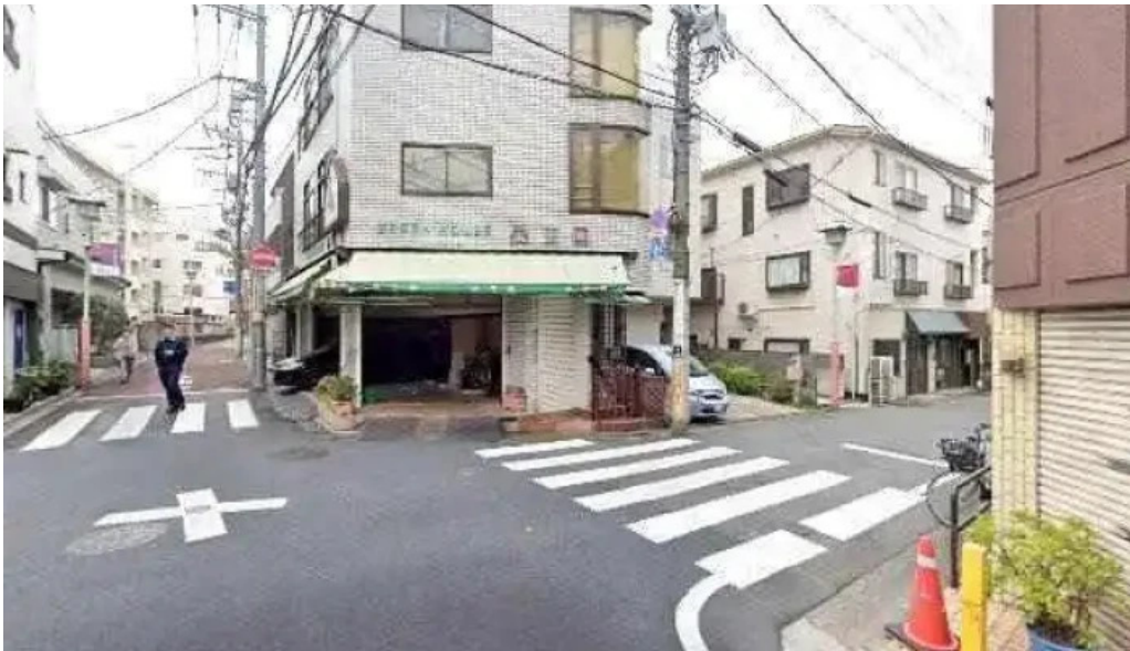
八つ目やしむら 目黒店 目黒区