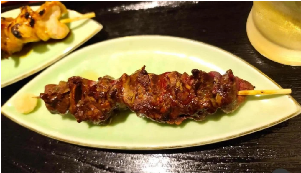
うなぎと食事処 めぐろ大黒屋 料理飲み物