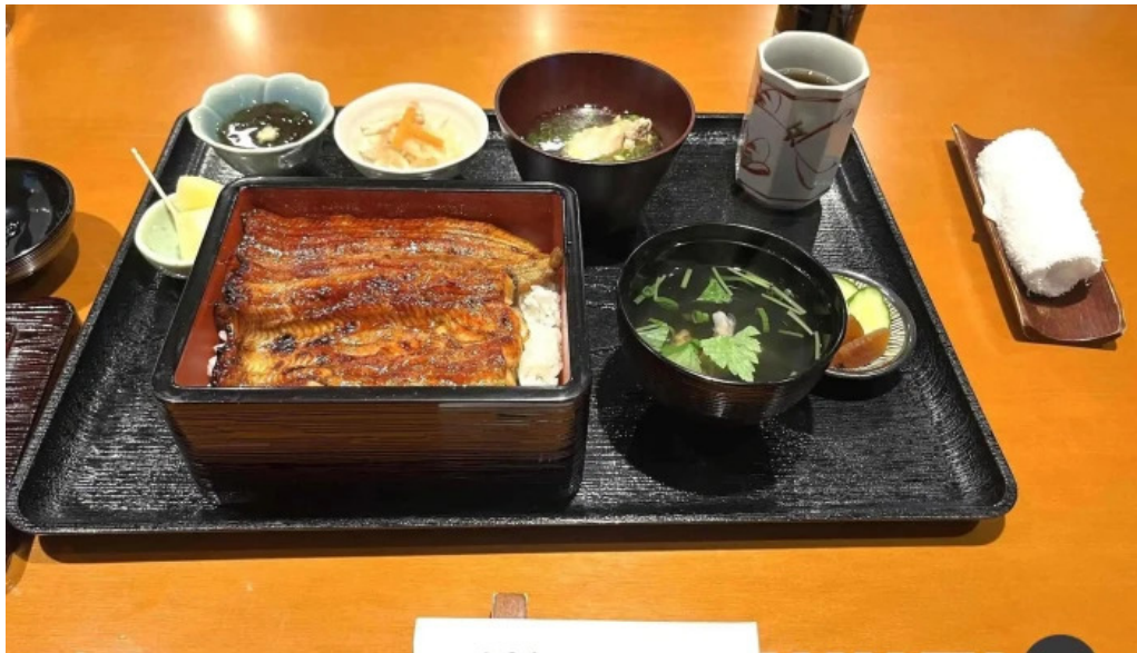
うなぎと食事処 めぐろ大黒屋 最新