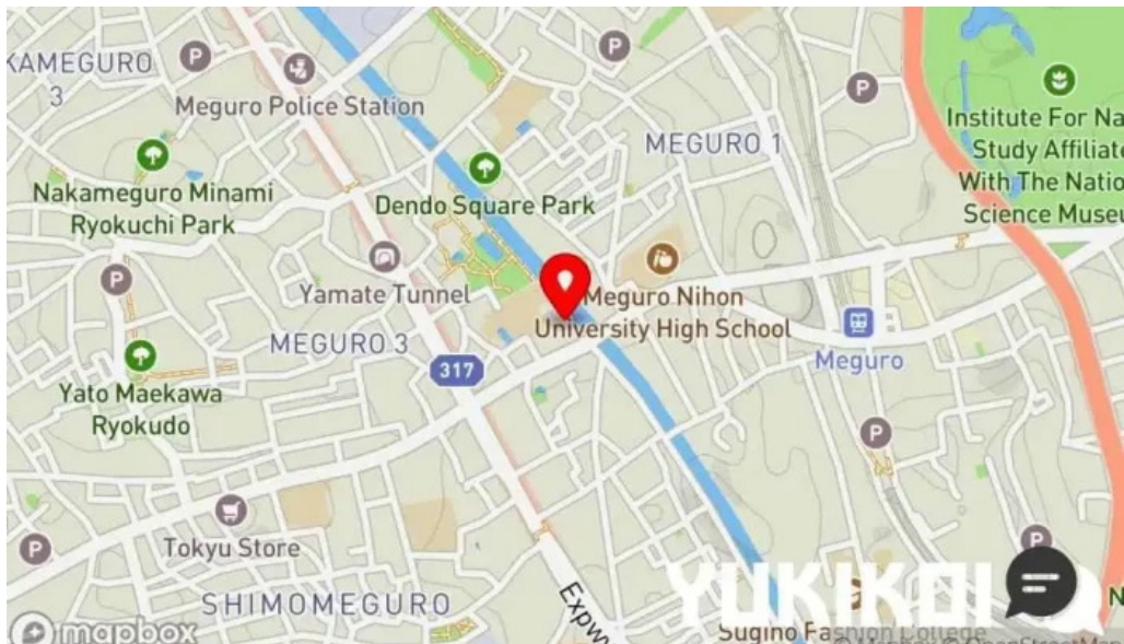
うなぎと食事処めぐろ大黒屋 地図