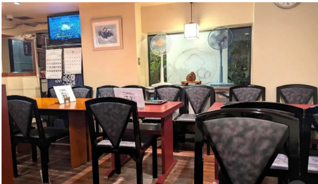
うなぎと食事処 めぐる大黒屋 雰囲気