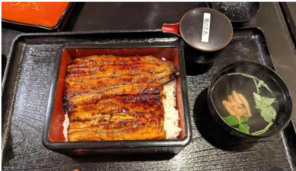
うなぎと食事処 めぐろ大黒屋 ウナギ