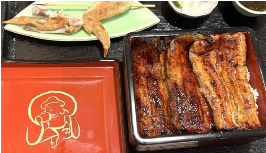
うなぎと食事処 めぐろ大黒屋 コメント