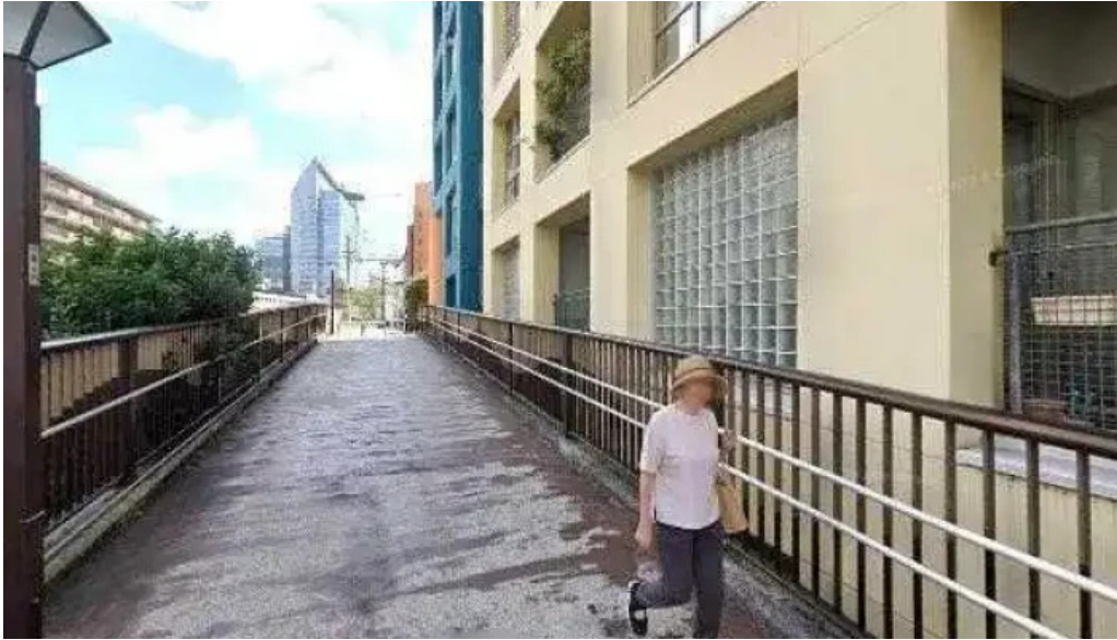
うなぎと食事処 めぐる大黒屋 目黒区