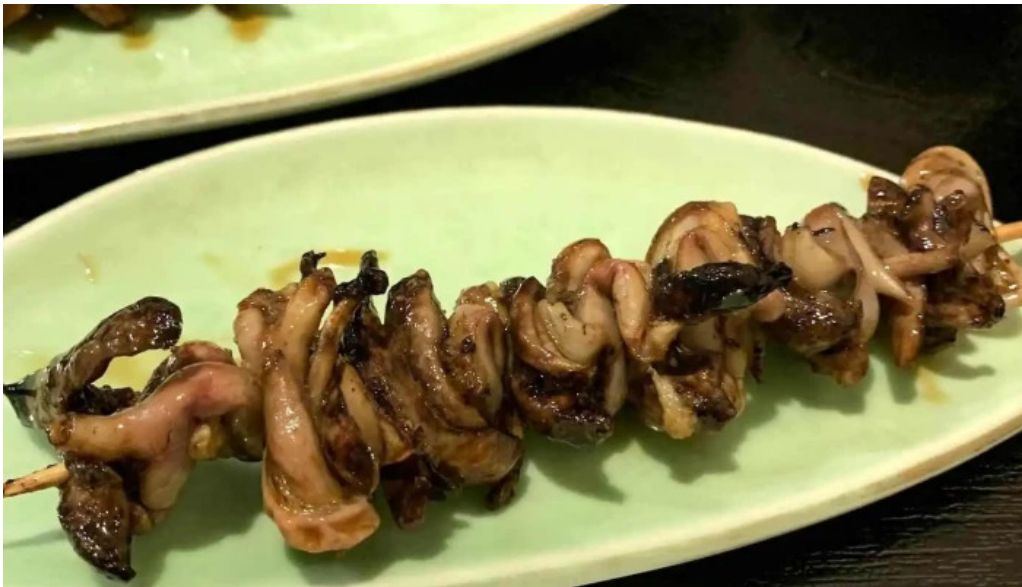
うなぎと食事処 めぐる大黒屋 焼き鳥