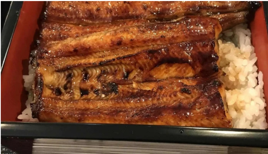
うなぎと食事処 めぐろ大黒屋 シーフード