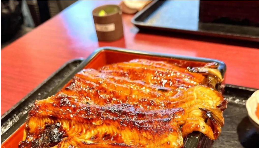
うなぎと食事処めぐろ大黒屋 instagram