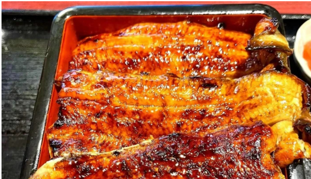
うなぎと食事処めぐろ大黒屋 動画