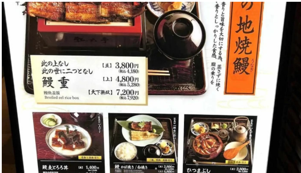
瓢六亭 御殿場プレミアムアウトレット メニュー