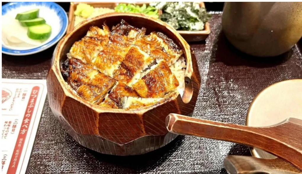
瓢六亭 御殿場プレミアムアウトレット プロモーション