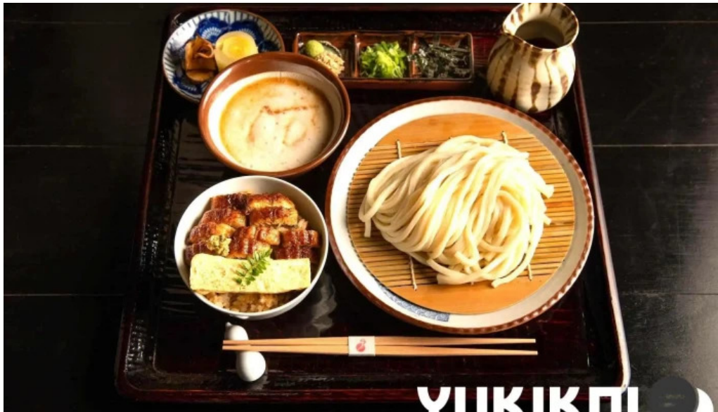
瓢六亭 御殿場プレミアムアウトレット