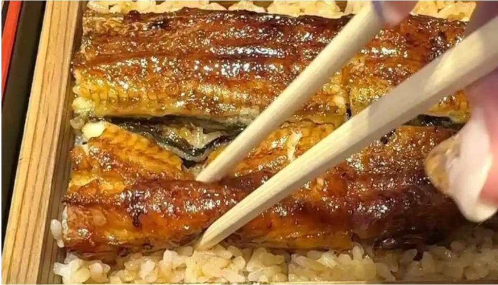
瓢六亭 御殿場プレミアムアウトレット 動画