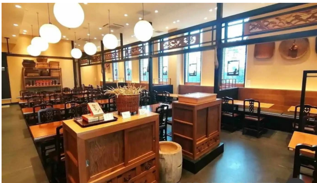
瓢六亭 御殿場プレミアム・アウトレット 御殿場市