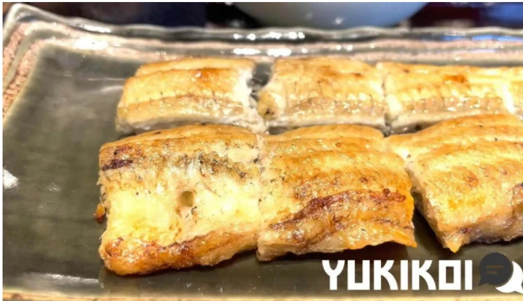
瓢六亭 御殿場プレミアムアウトレット ウナギ