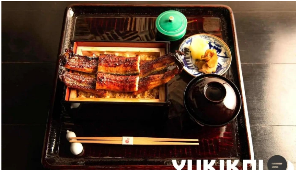
瓢六亭 御殿場プレミアムアウトレット 料理飲み物