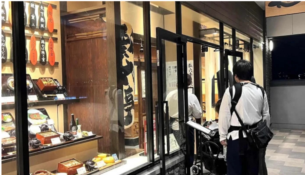
瓢六亭 御殿場プレミアムアウトレット どころ