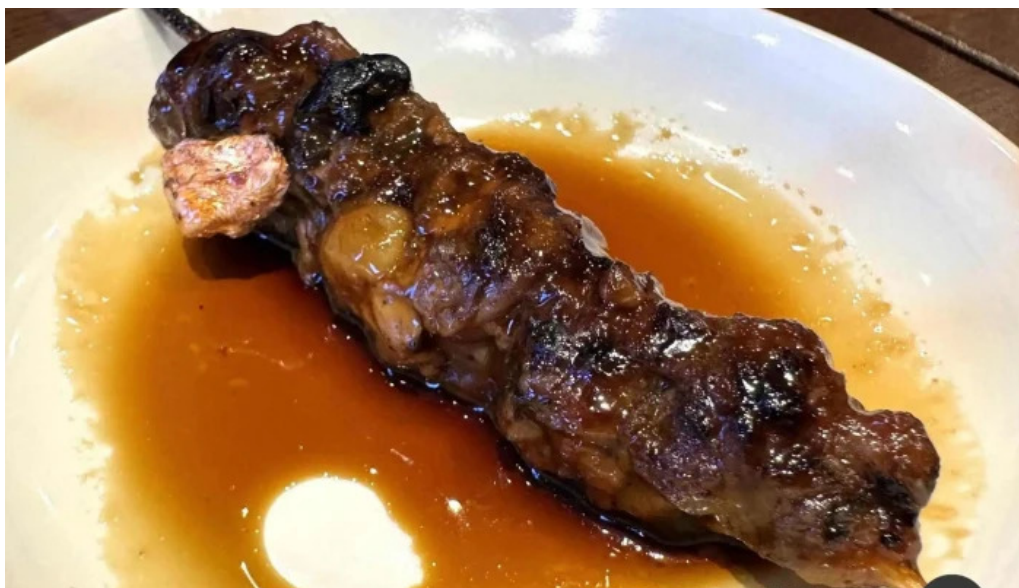
瓢六亭 御殿場プレミアムアウトレット 焼き鳥