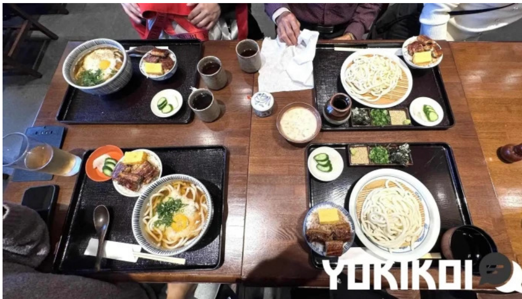
瓢六亭 御殿場プレミアムアウトレット うどん