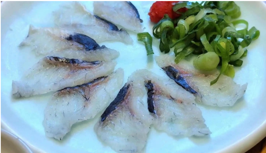
瓢六亭 御殿場プレミアムアウトレット 刺身