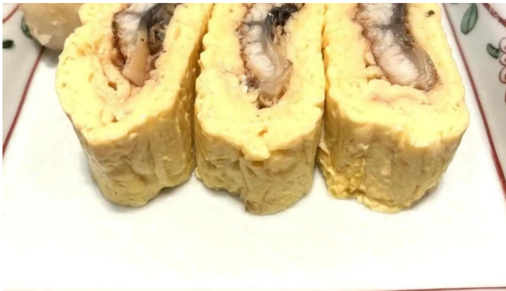
瓢六亭 御殿場プレミアムアウトレット 卵焼き