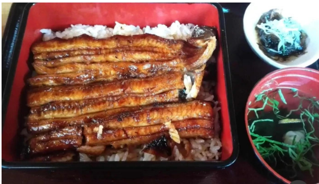
うなぎ和光 ウナギ