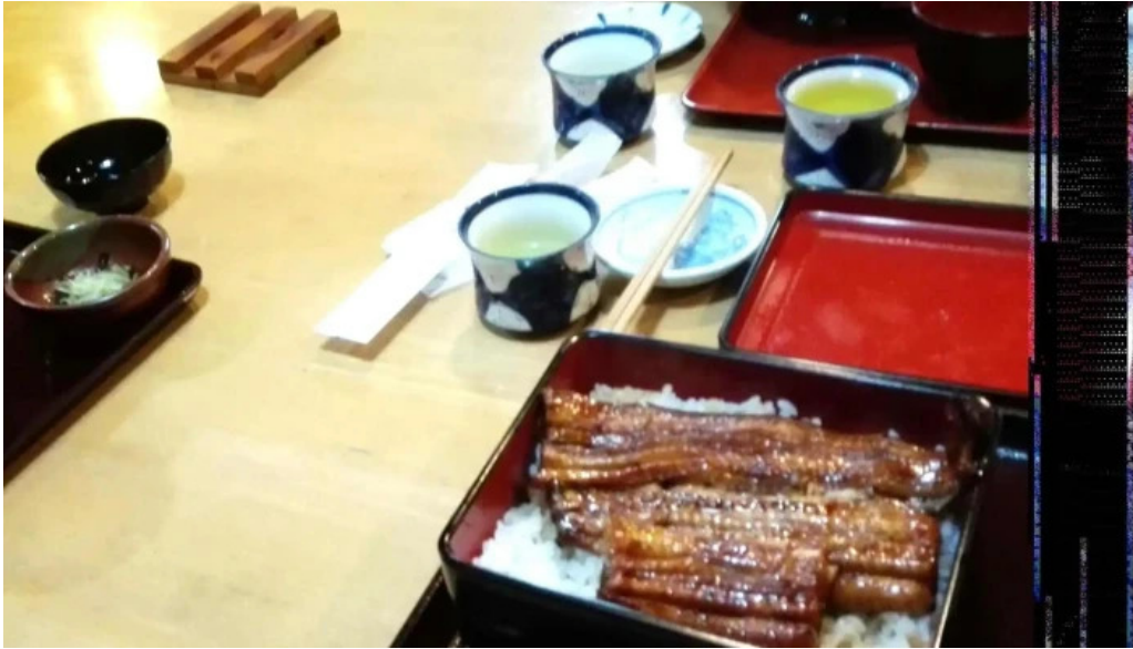
うなぎ和光 営業中