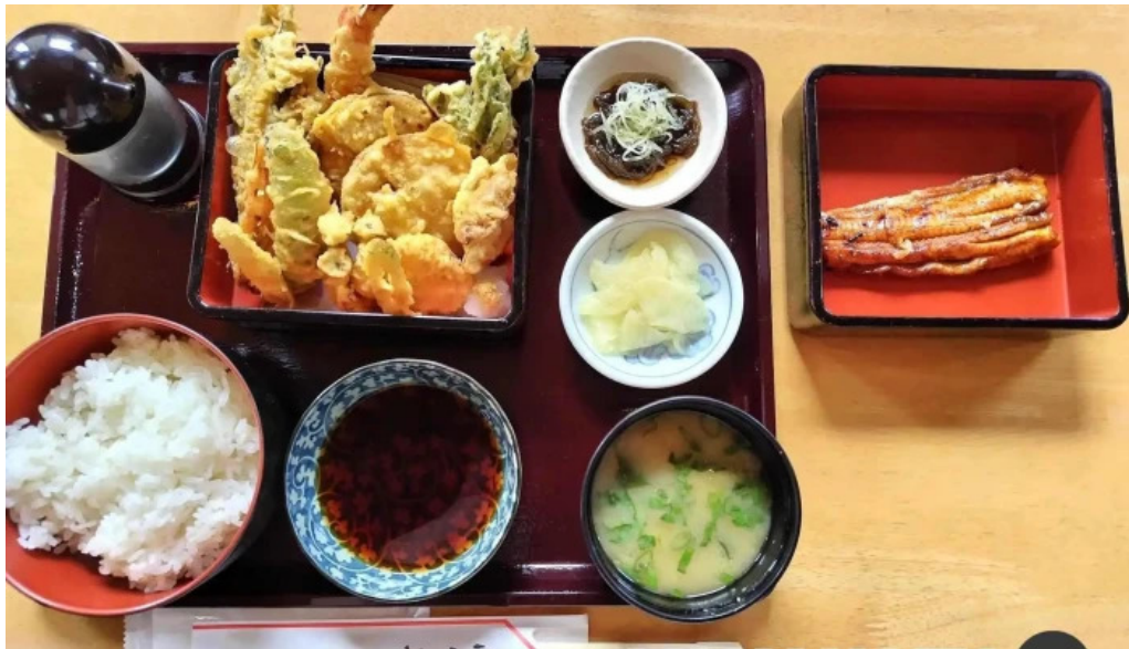
うなぎ和光 天ぷら