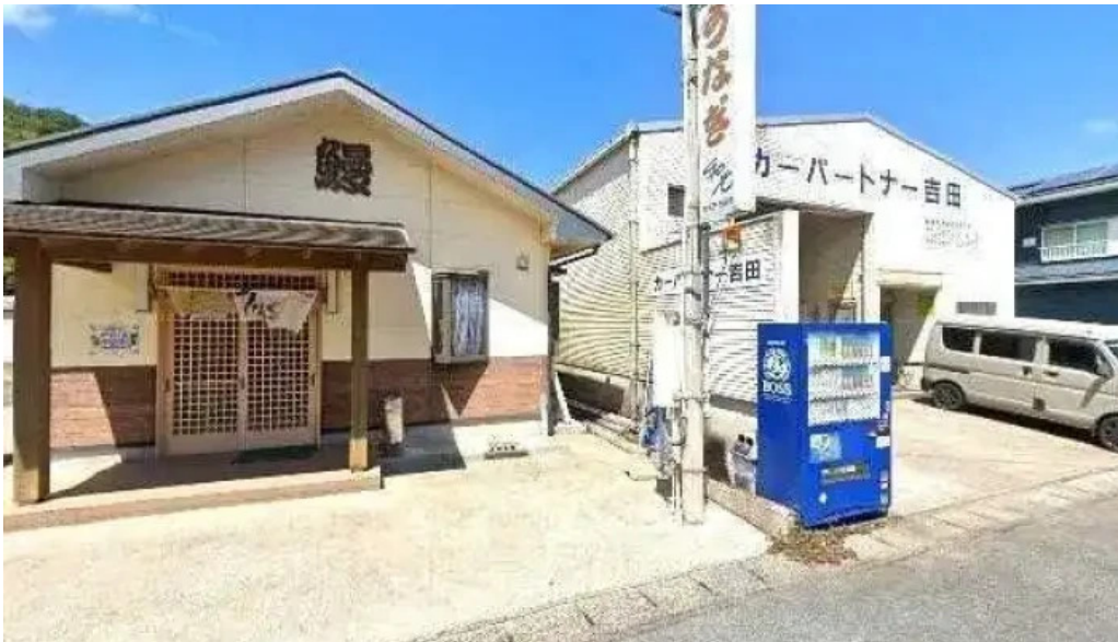
うなぎ和光 奄美市