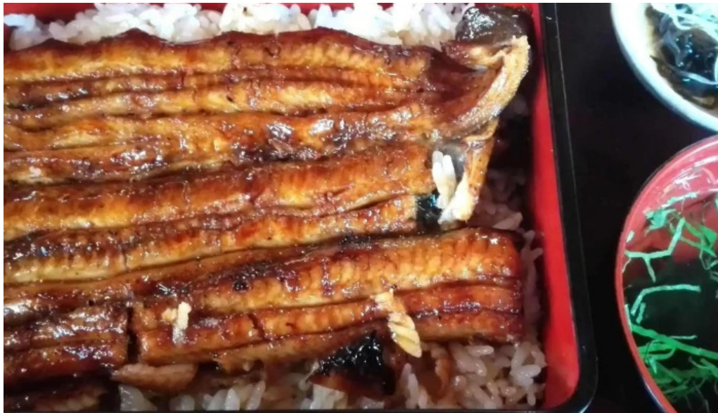
うなぎ和光 エリア