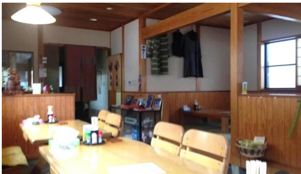
うなぎ和光 雰囲気