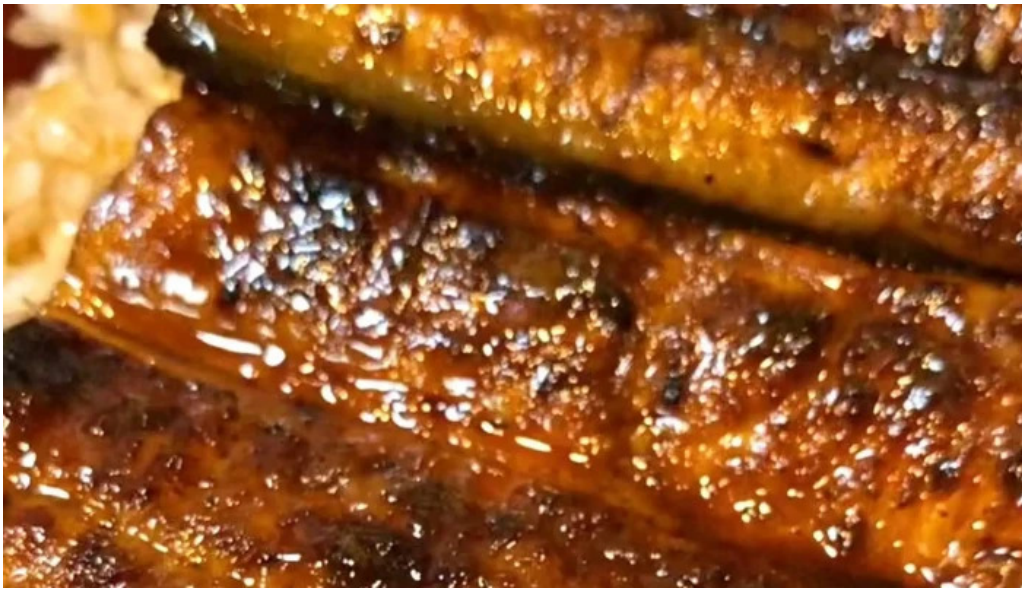
うなぎ和光 所在地