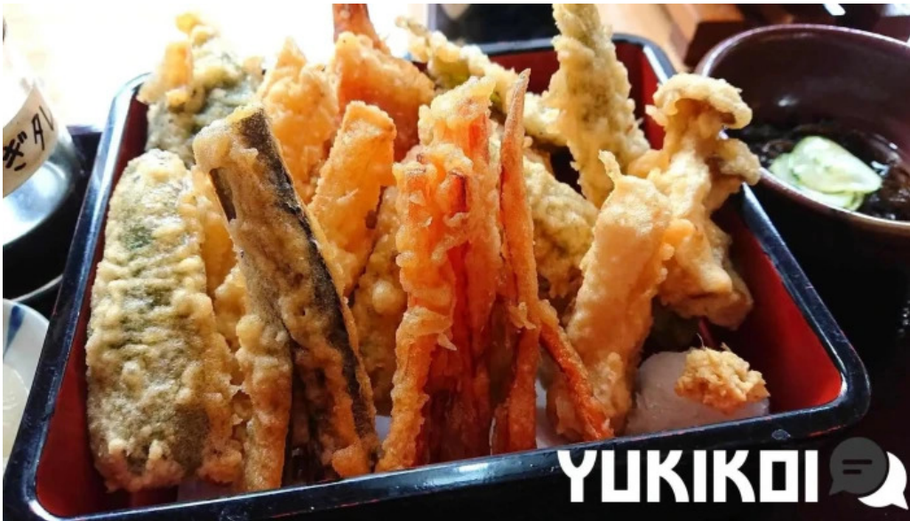
うなぎ和光 料理飲み物