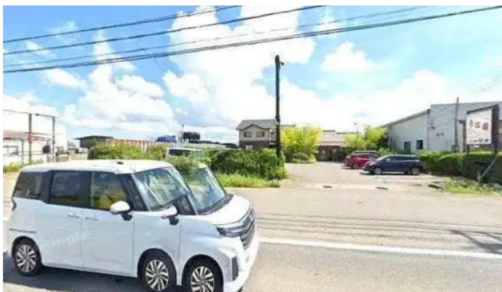
うな雄 ストリートビューと 360 ビュー