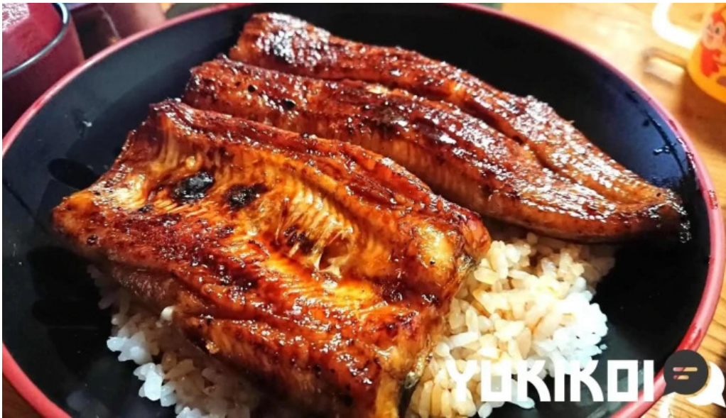
うな雄 料理飲み物