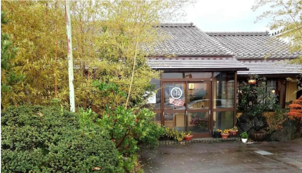
うな雄 comentario 1