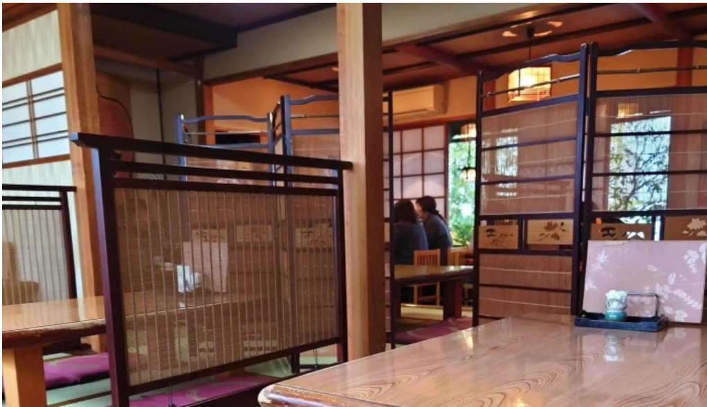
うな雄 comentario 2