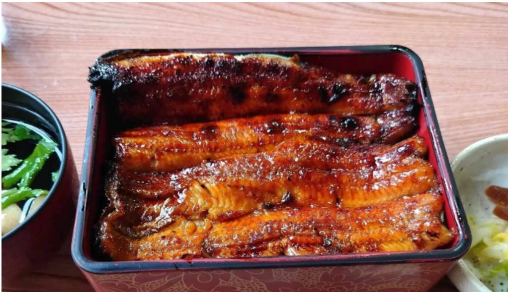
うな雄 comentario 4