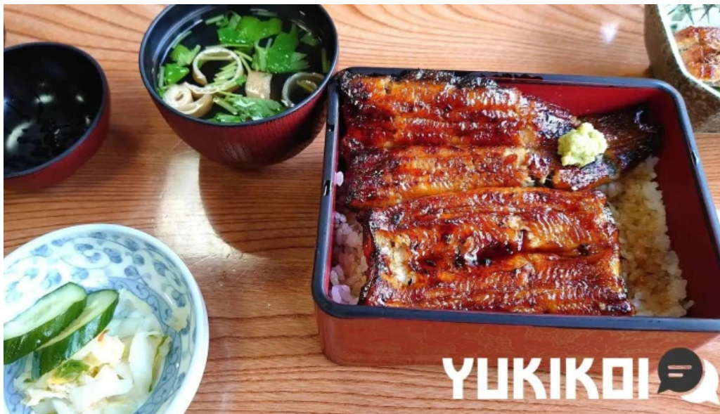
うな雄 シーフード