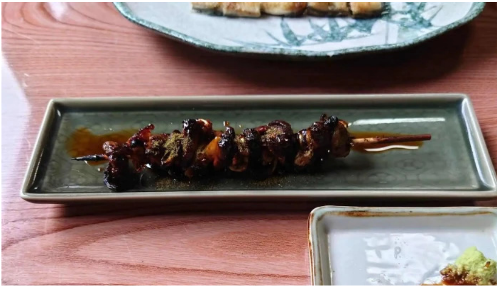
うな雄 comentario 3