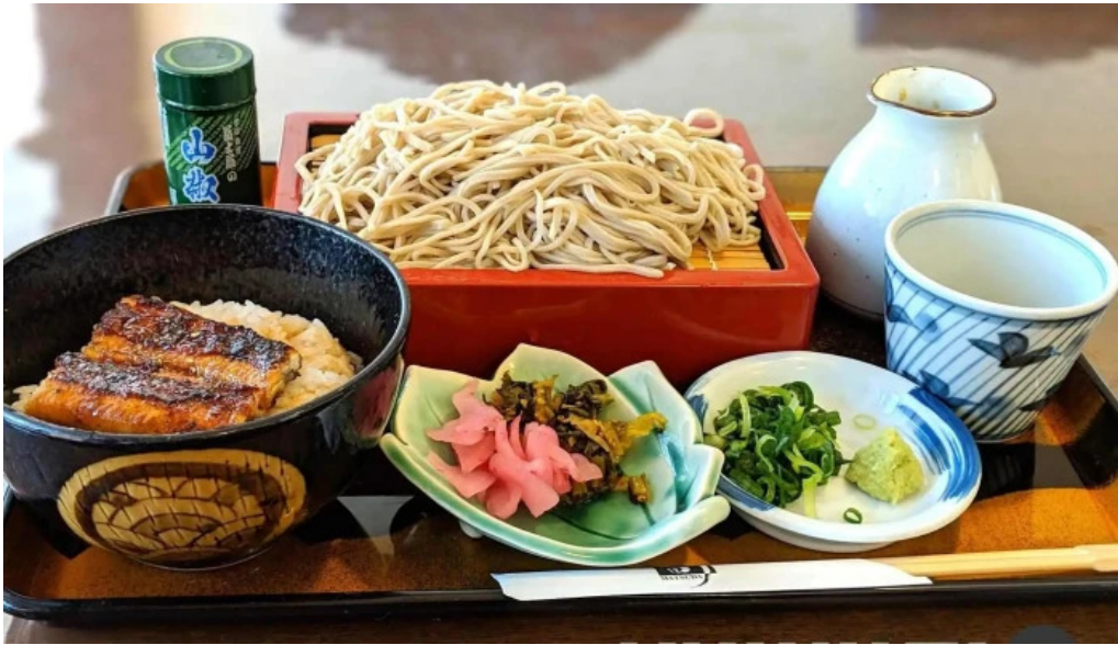
松田うなぎ屋 蕎麦