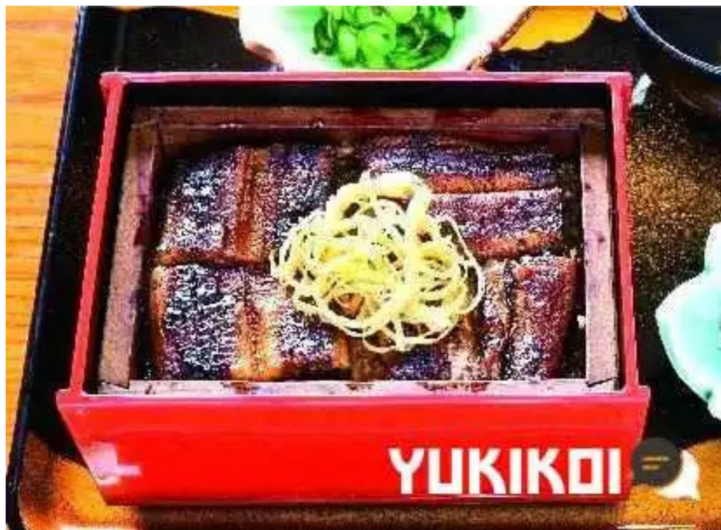
松田うなぎ屋 オーナー提供