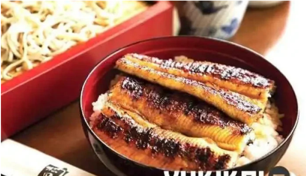
松田うなぎ屋 料理飲み物