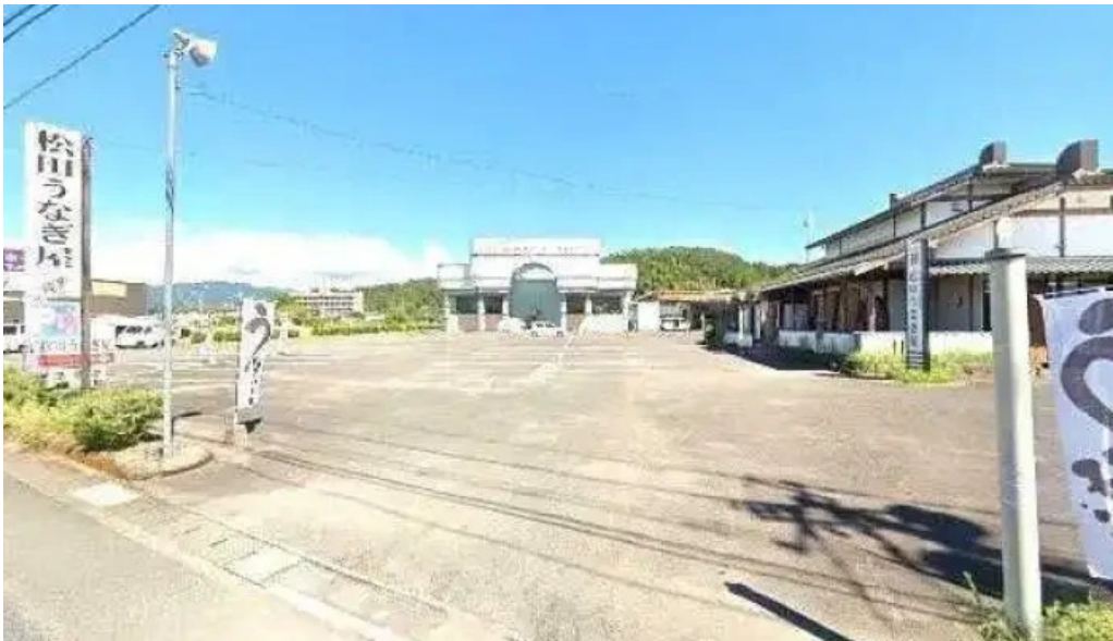
松田うなぎ屋 人吉市