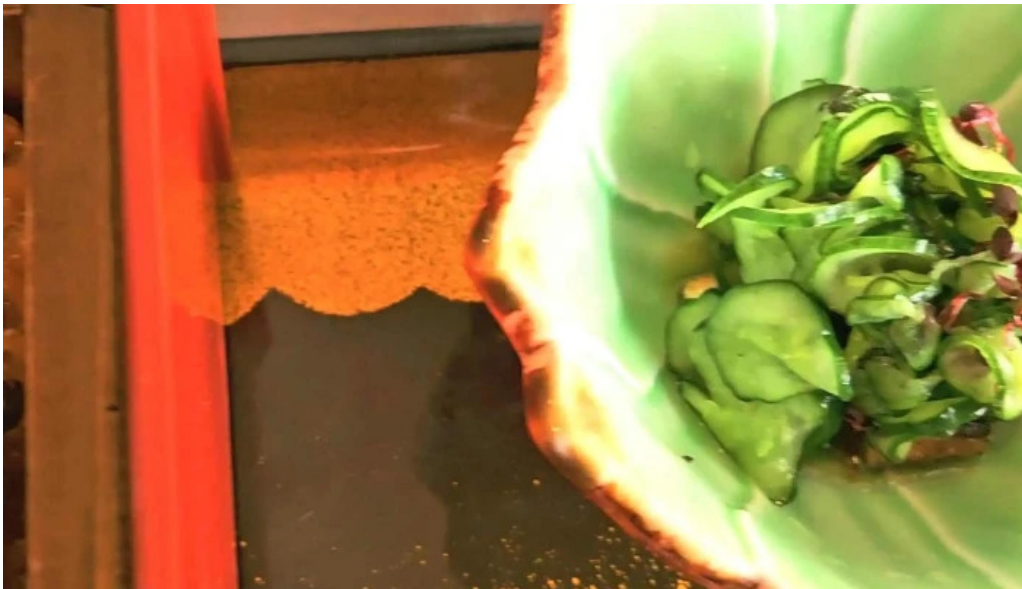
松田うなぎ屋 割引