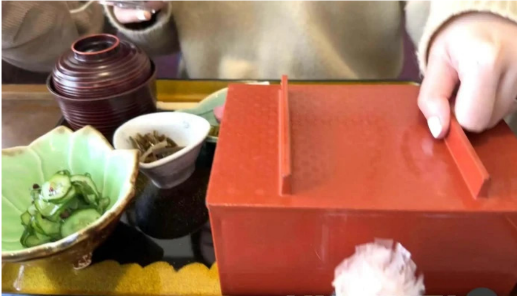
松田うなぎ屋 ウナギ