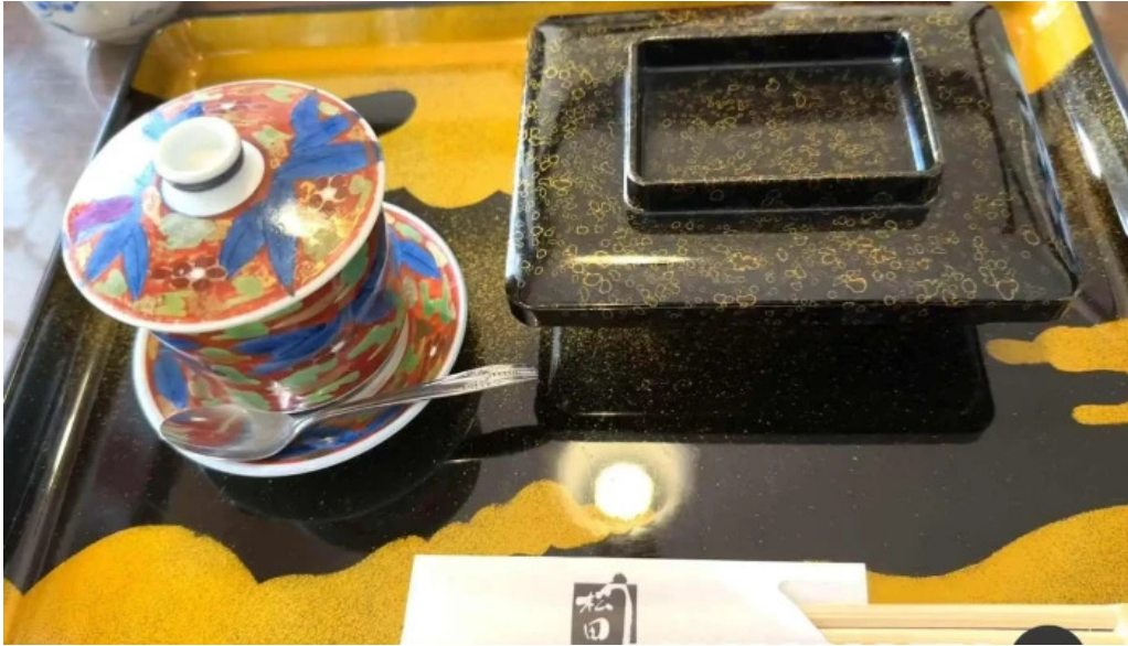
松田うなぎ屋 動画