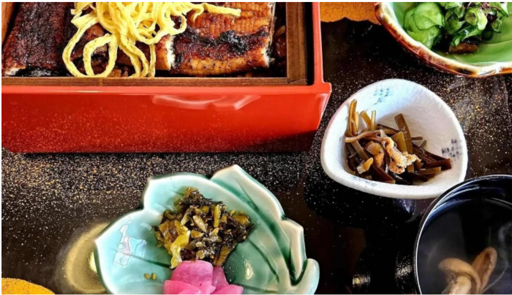
松田うなぎ屋 写真