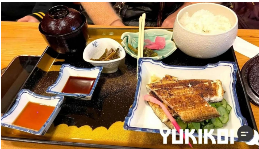
松田うなぎ屋 最新