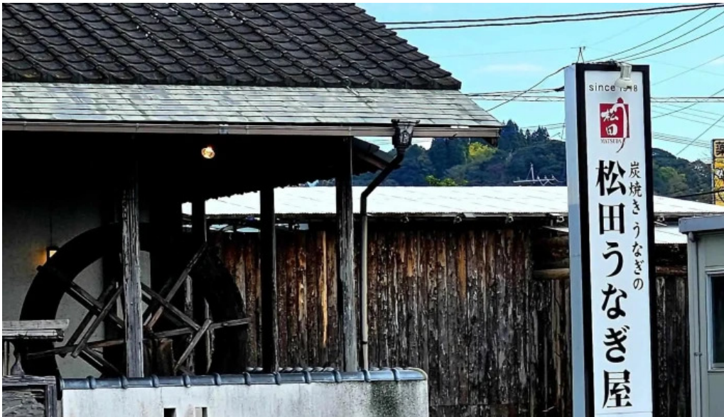
松田うなぎ屋 所在地