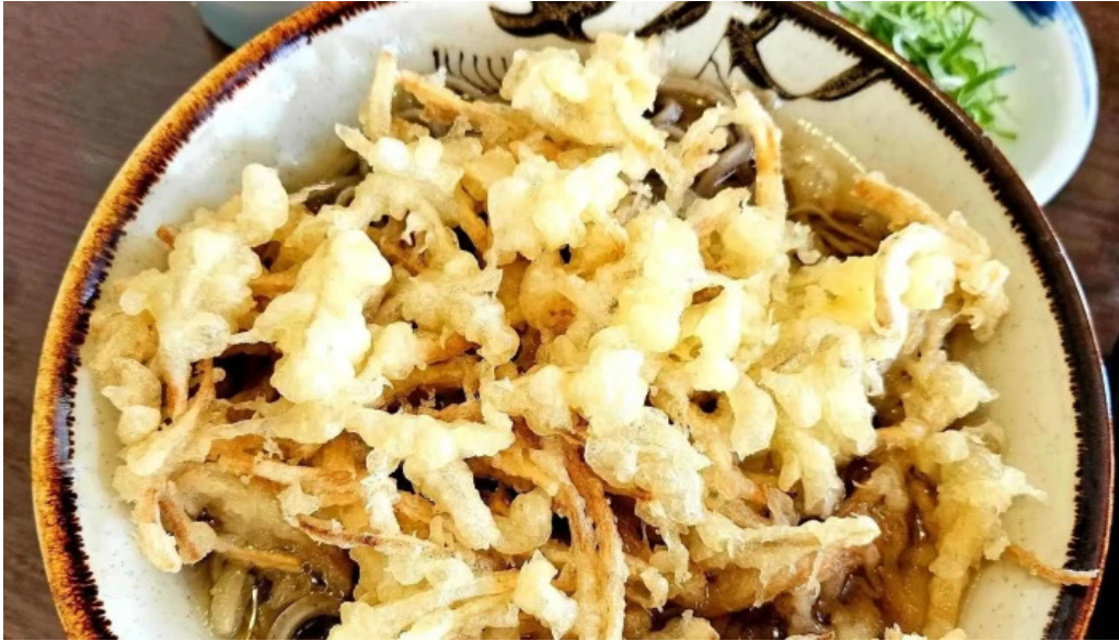
松田うなぎ屋 料金