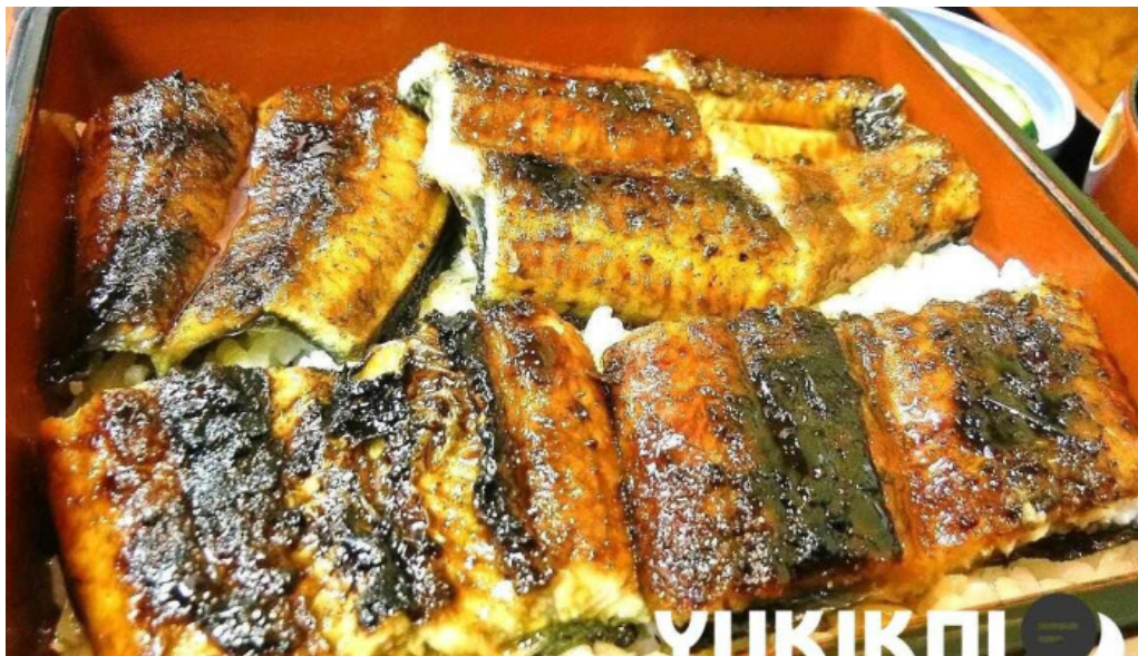
しらいしうなぎ屋 料理飲み物