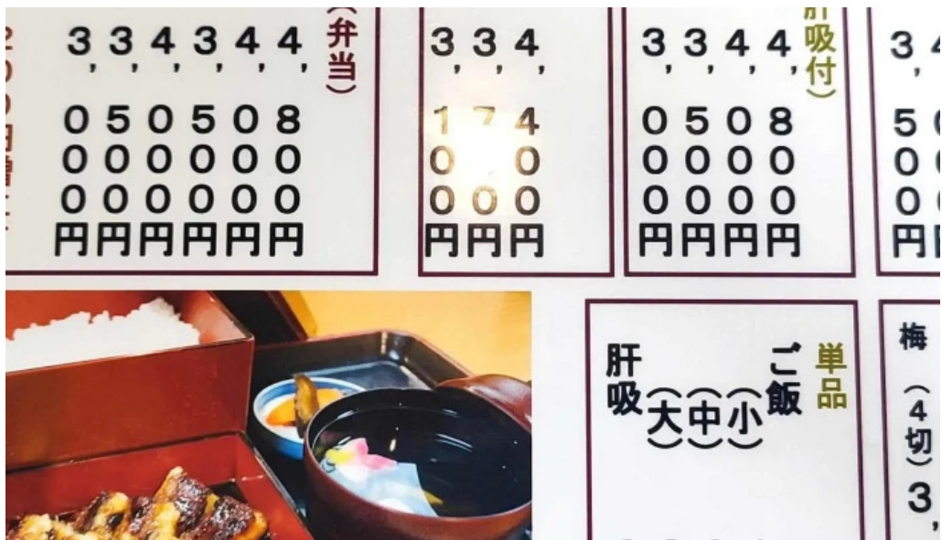
しらいしうなぎ屋 近く