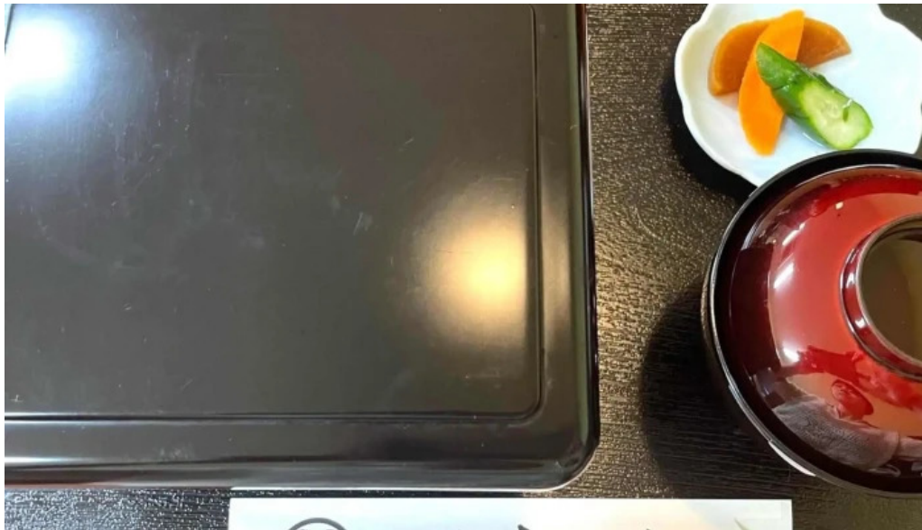
しらいしうなぎ屋 ウェブサイト