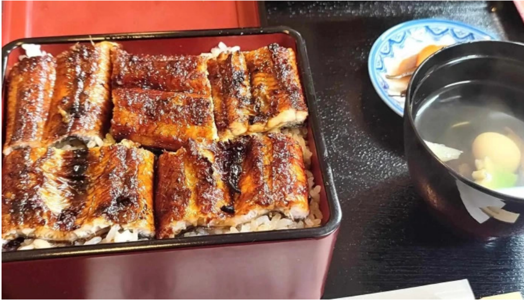
しらいしうなぎ屋 営業時間