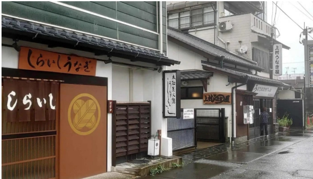
しらいうなぎ屋 プロモーション