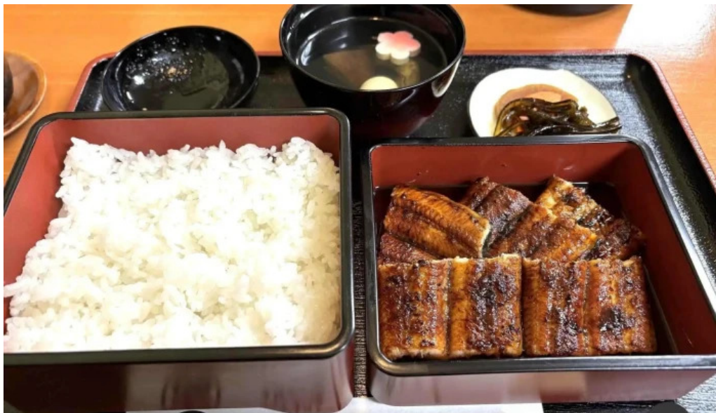
しらいうなぎ屋 ウナギ