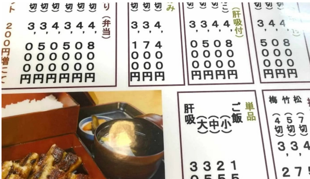
しらいしうなぎ屋 instagram