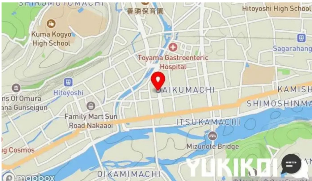
しらいしうなぎ屋 地図