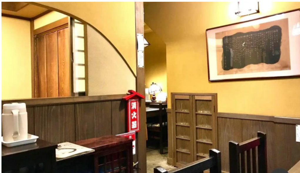
しらいしうなぎ屋 雰囲気