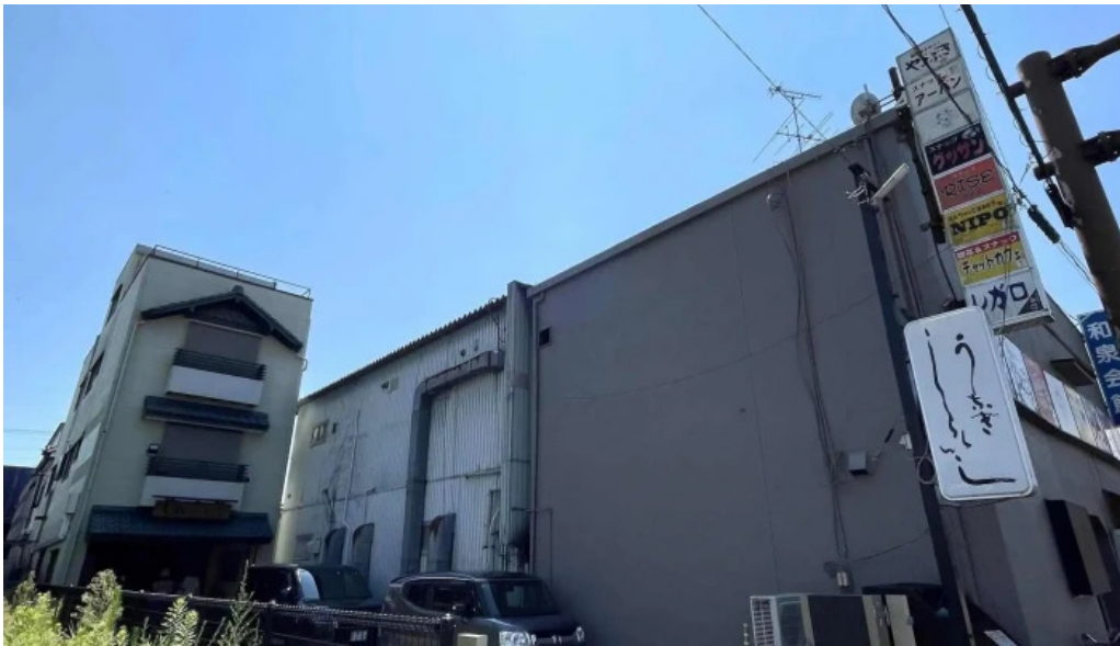
しらいしうなぎ屋 口コミ