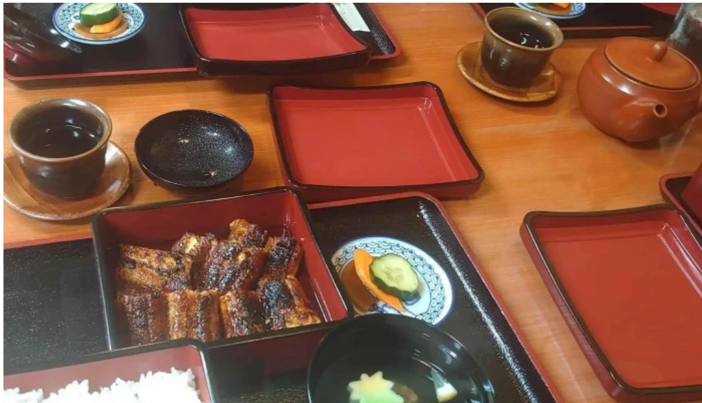
しらいしうなぎ屋 番号