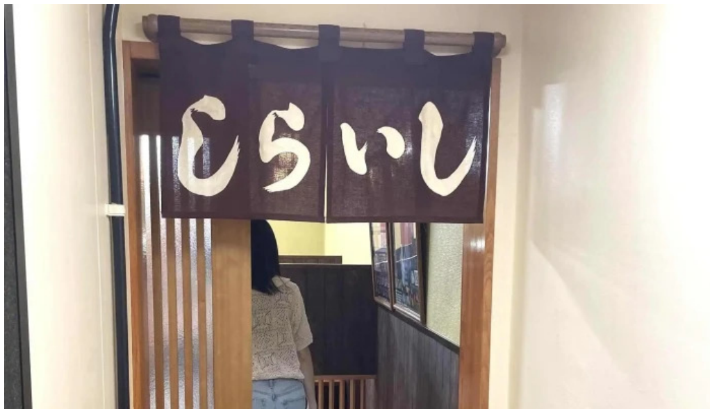
しらいしうなぎ屋 行き方