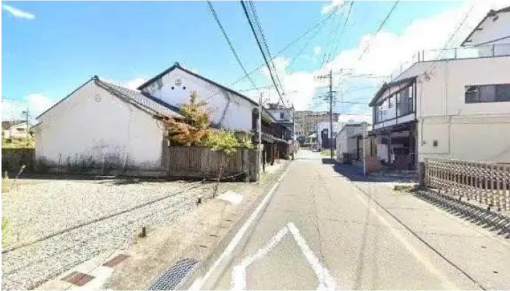
しらいしうなぎ屋 人吉市