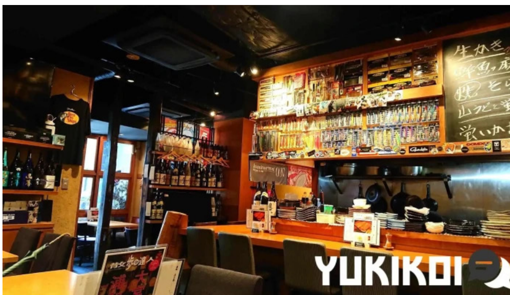
うなぎ瀧澤 雰囲気