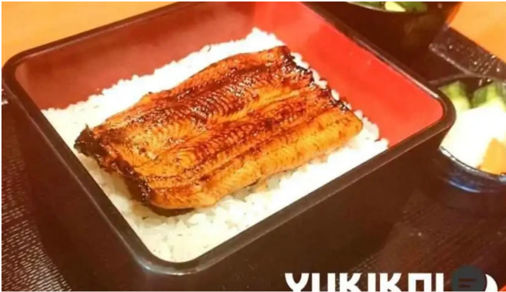
うなぎ瀧澤 ウナギ