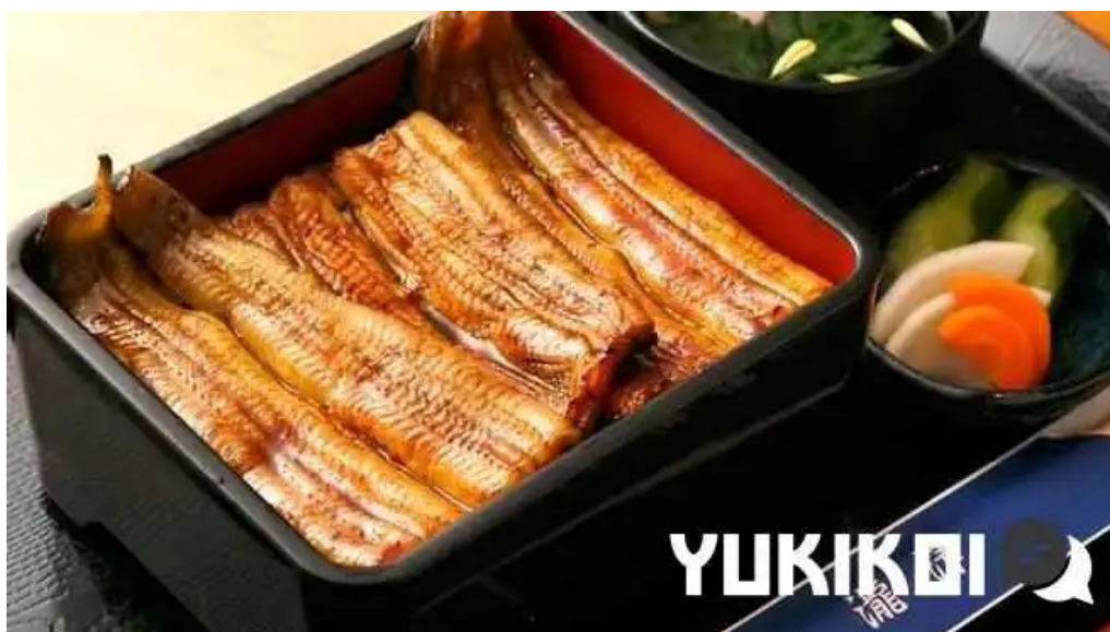
うなぎ瀧澤 料理飲み物