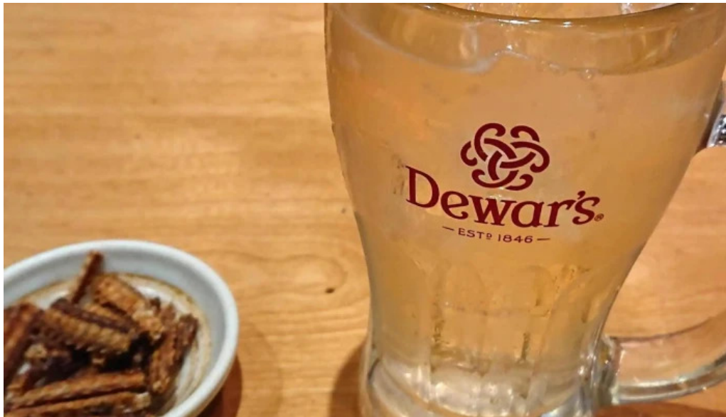
うなぎ瀧澤 行き方