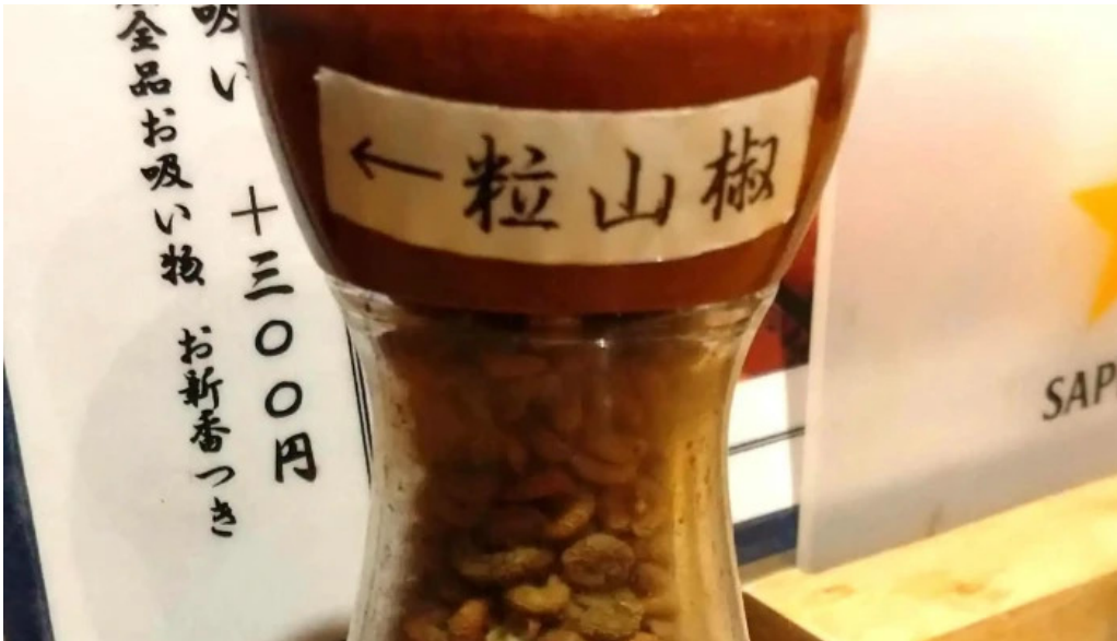
うなぎ瀧澤 スコア