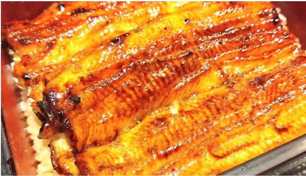
うなぎ瀧澤 プロモーション