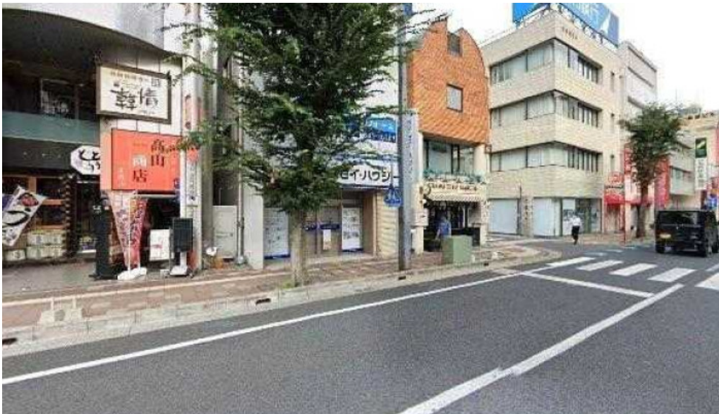
うなぎ瀧澤 さいたま市