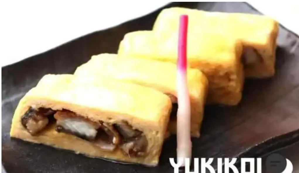
うなぎ処 古賀 卵焼き