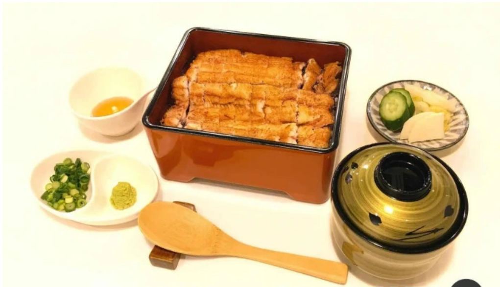
うなぎ処 古賀 オーナー提供