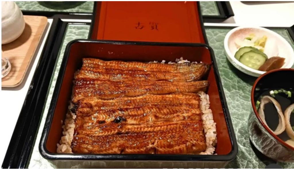
うなぎ処 古賀 最新