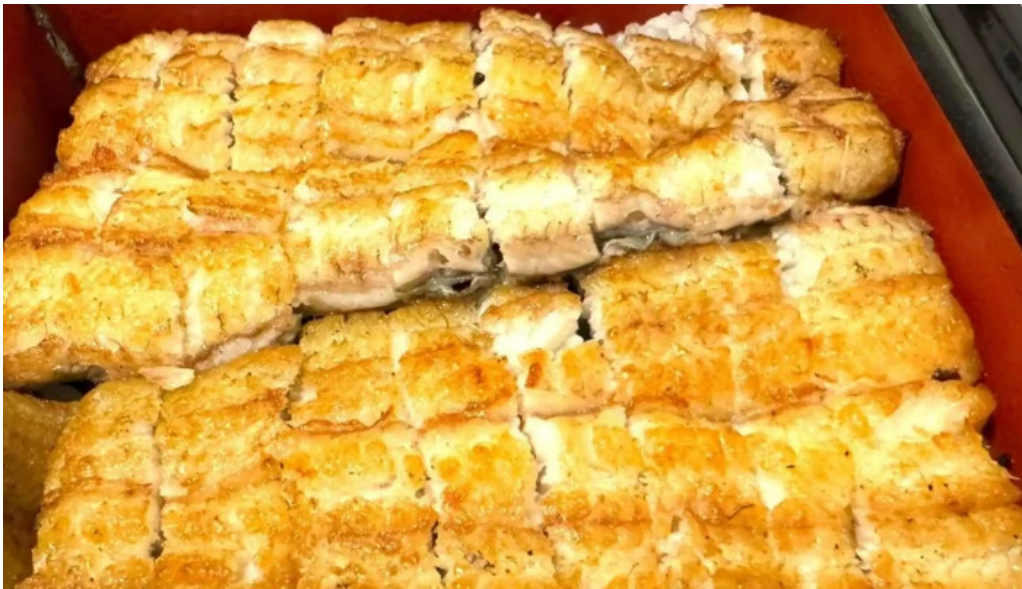
うなぎ処 古賀 口コミ