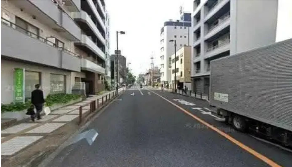
うなぎ処 古賀 さいたま市