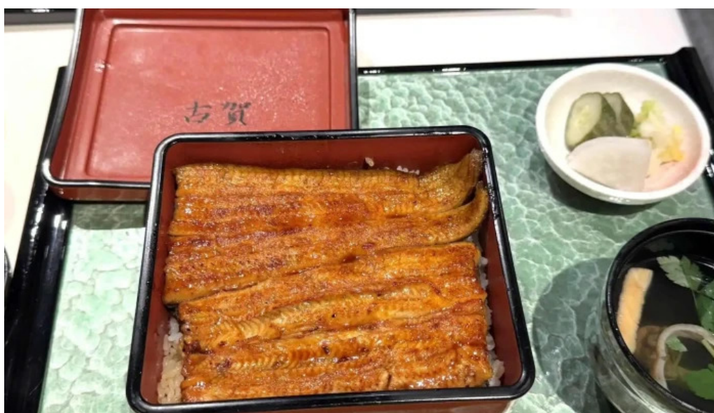
うなぎ処 古賀 近く