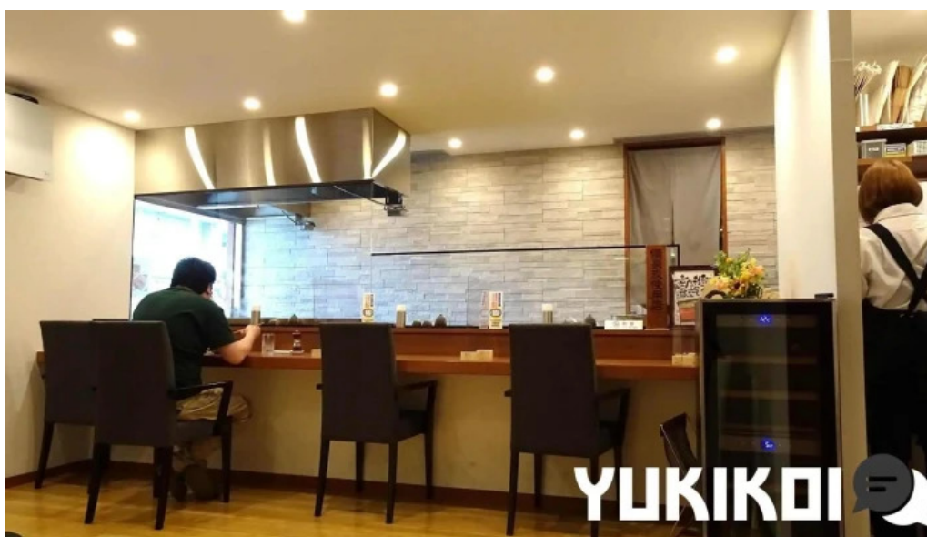
うなぎ処 古賀 雰囲気