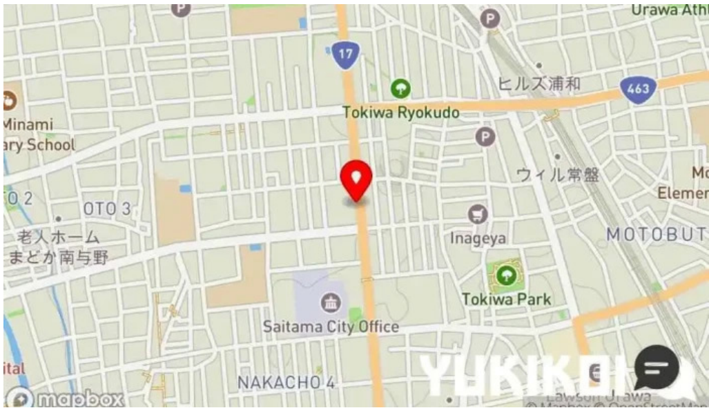
うなぎ処 古賀 地図