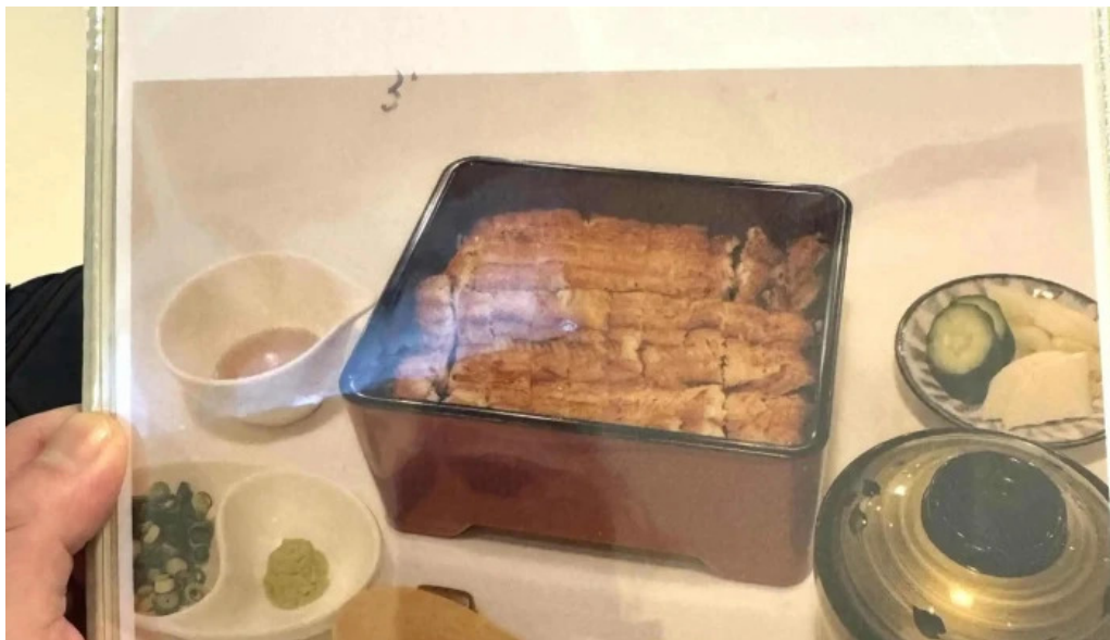
うなぎ処 古賀 住所