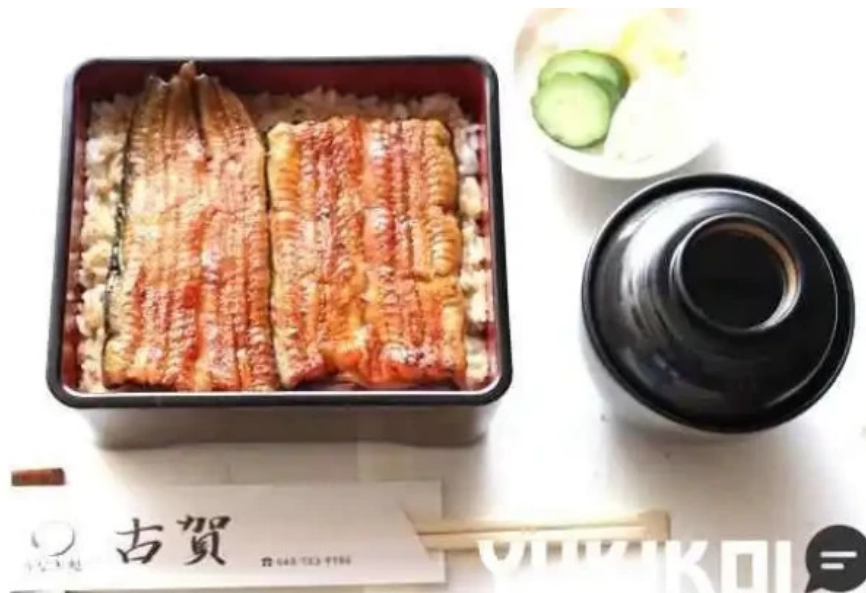
うなぎ処 古賀 ウナギ