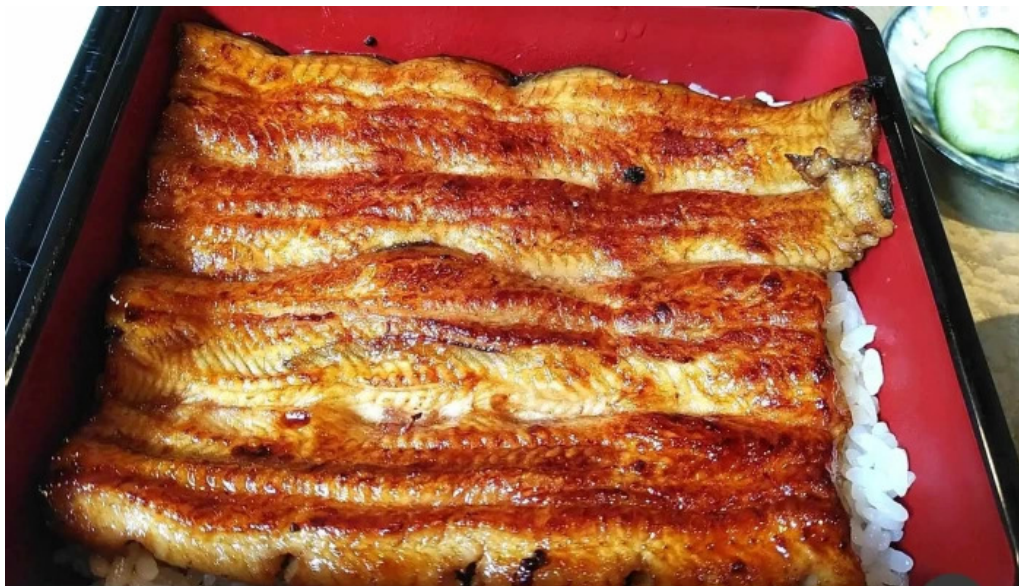
うなぎ処 古賀 シーフード