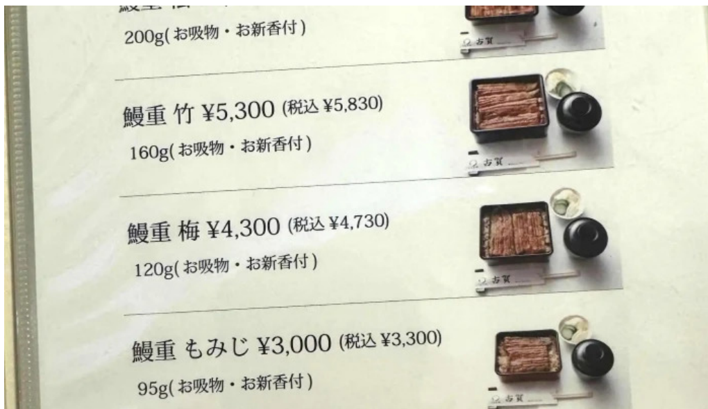
うなぎ処 古賀 行き方