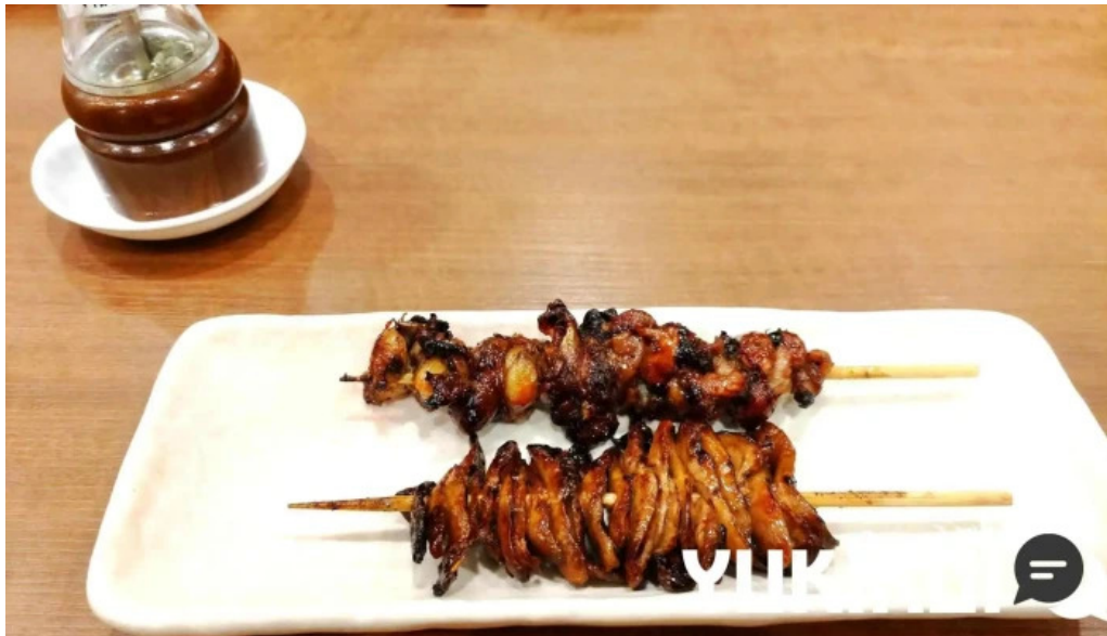
うなぎ処 古賀 焼き鳥