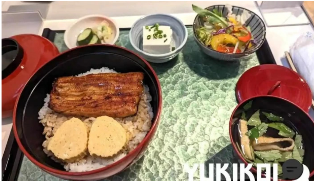
うなぎ処 古賀 料理飲み物