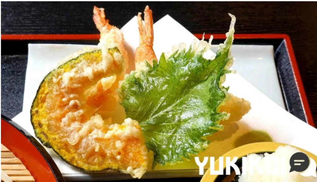
うどん専科 麦の香り 天ぷら