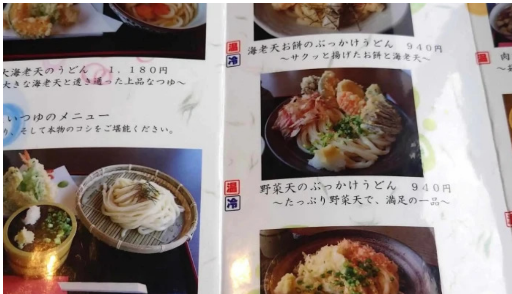
うどん専科 麦の香り カタログ