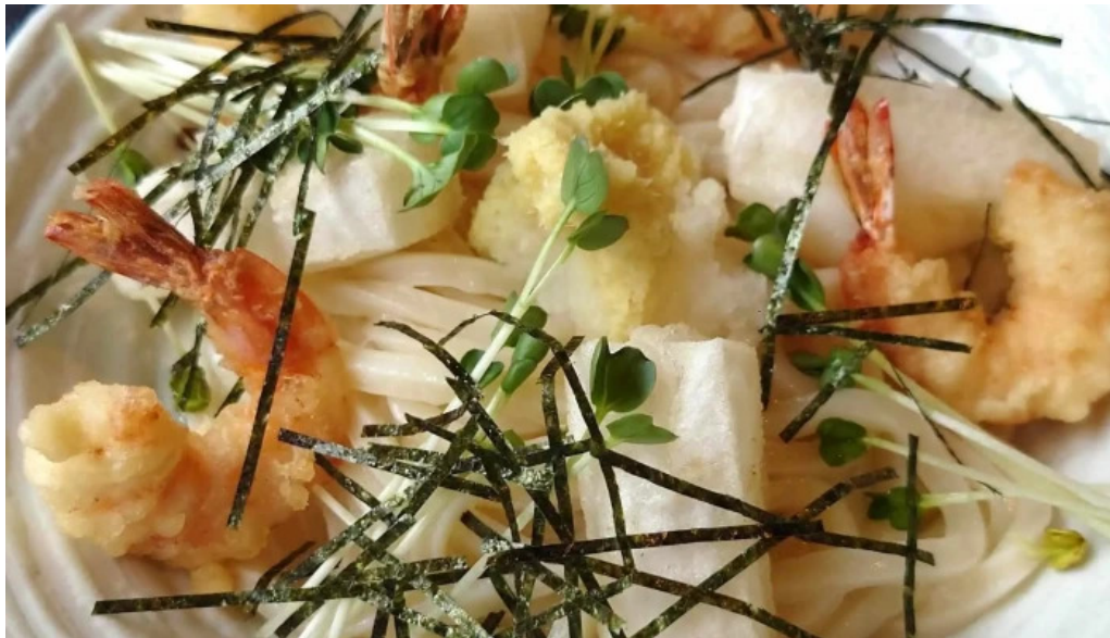
うどん専科 麦の香り どこ