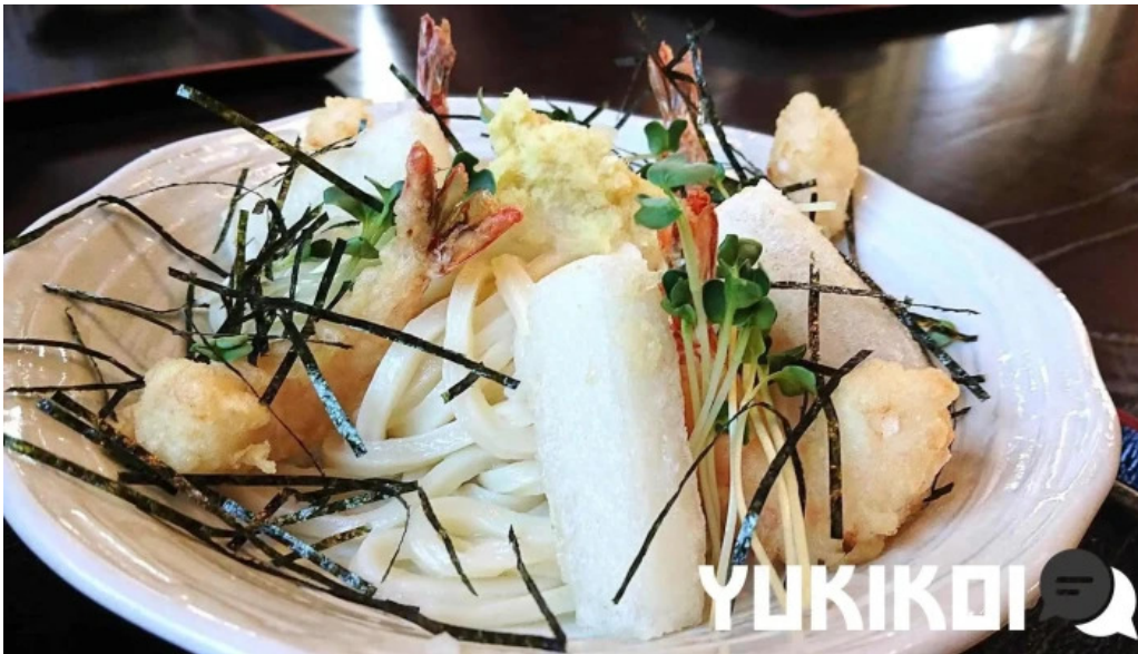
うどん専科 麦の香り 料理飲み物