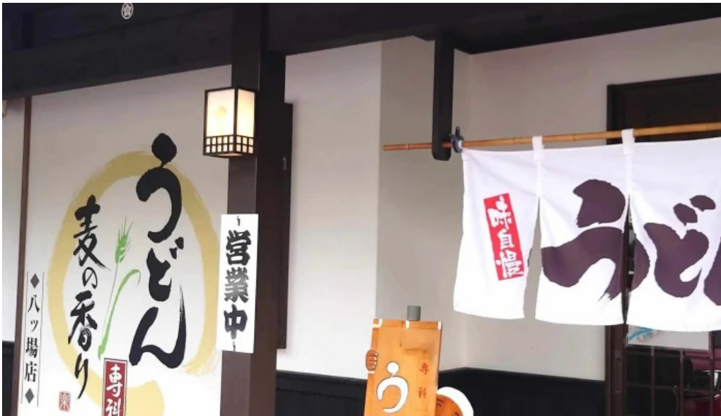
うどん専科 麦の香り 割引