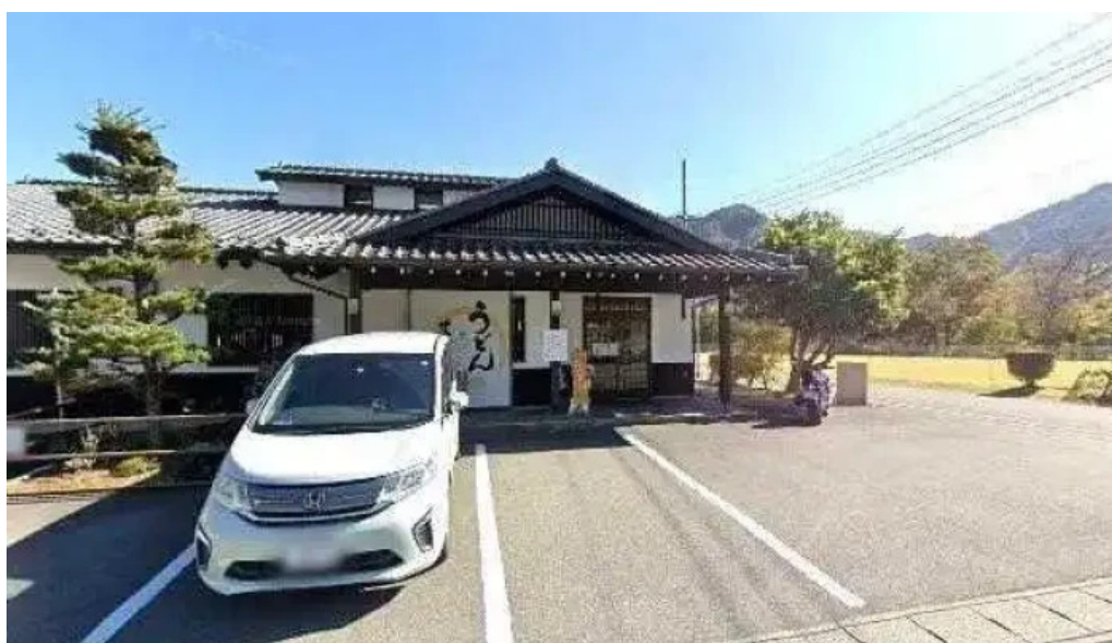
うどん専科 麦の香り 長野原町