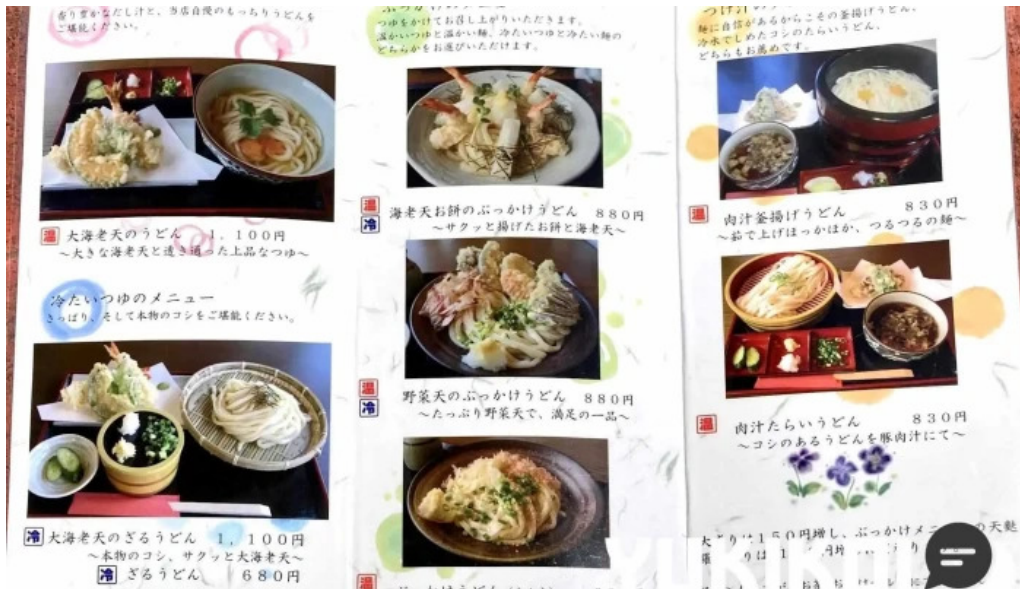
うどん専科 麦の香り メニュー