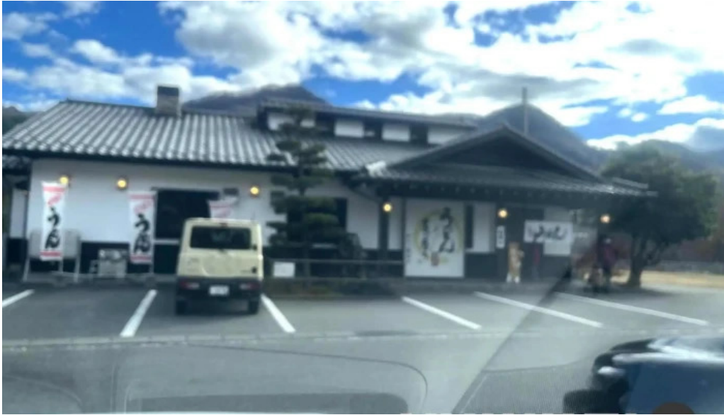
うどん専科 麦の香り 最新