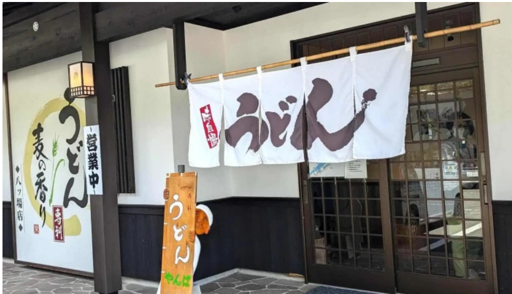
うどん専科 麦の香り 営業中