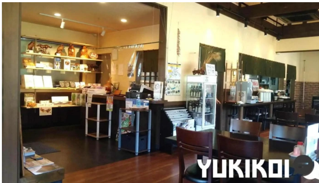
うどん専科 麦の香り 霧田気