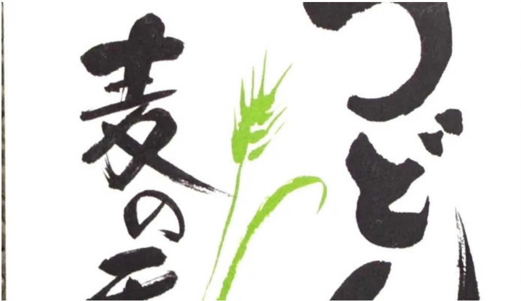
うどん専科 麦の香り 動画