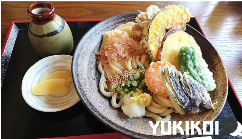
うどん専科 麦の香り うどん