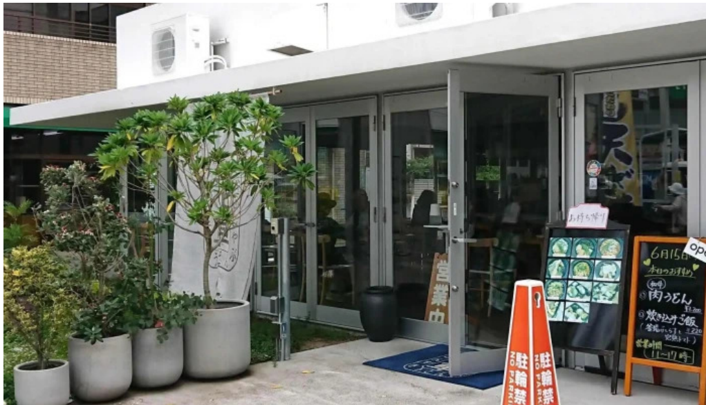
花車 ウェブサイト