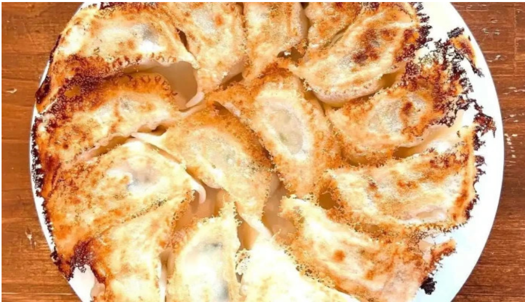
餃子の大英 料理飲み物