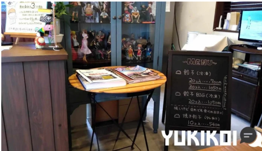
餃子の大英 雰囲気