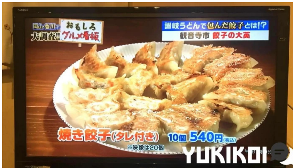
餃子の大英