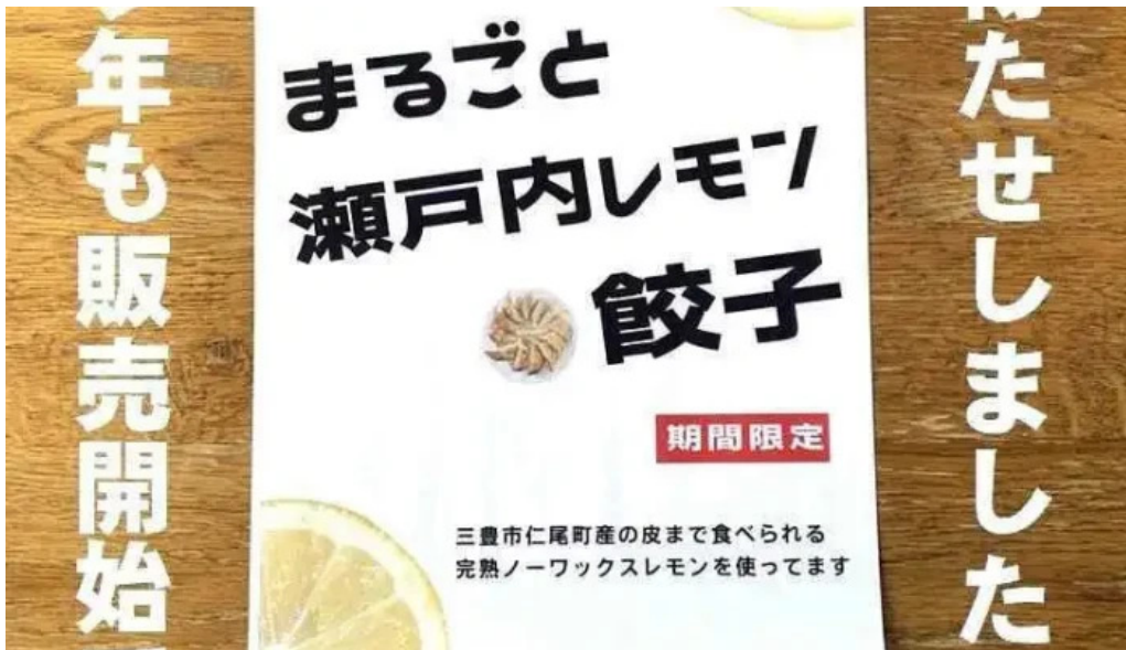
餃子の大英 メニュー