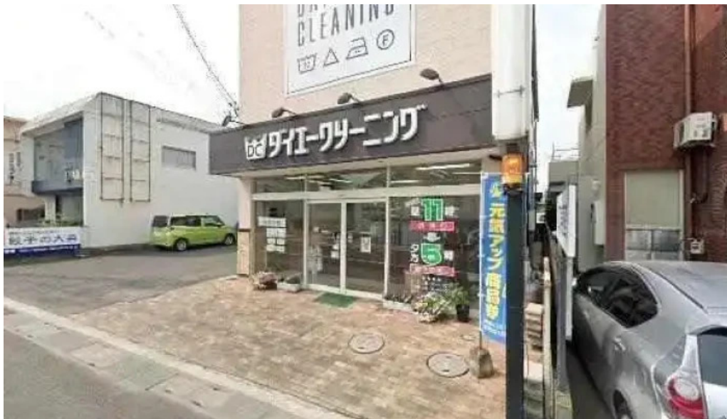
餃子の大英 観音寺市