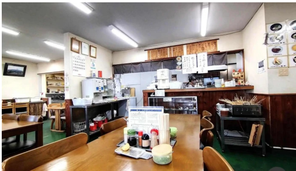
瀬戸うどん 霧田気