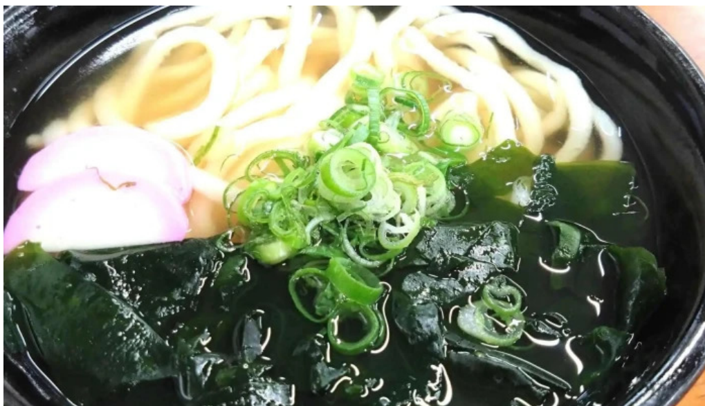
瀬戸うどん どころ