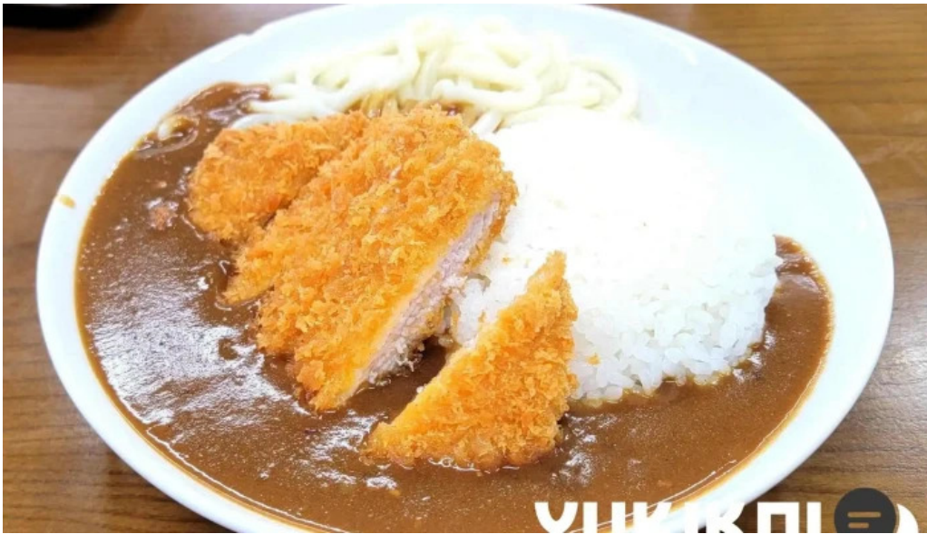
瀬戸うどん 豚カツ