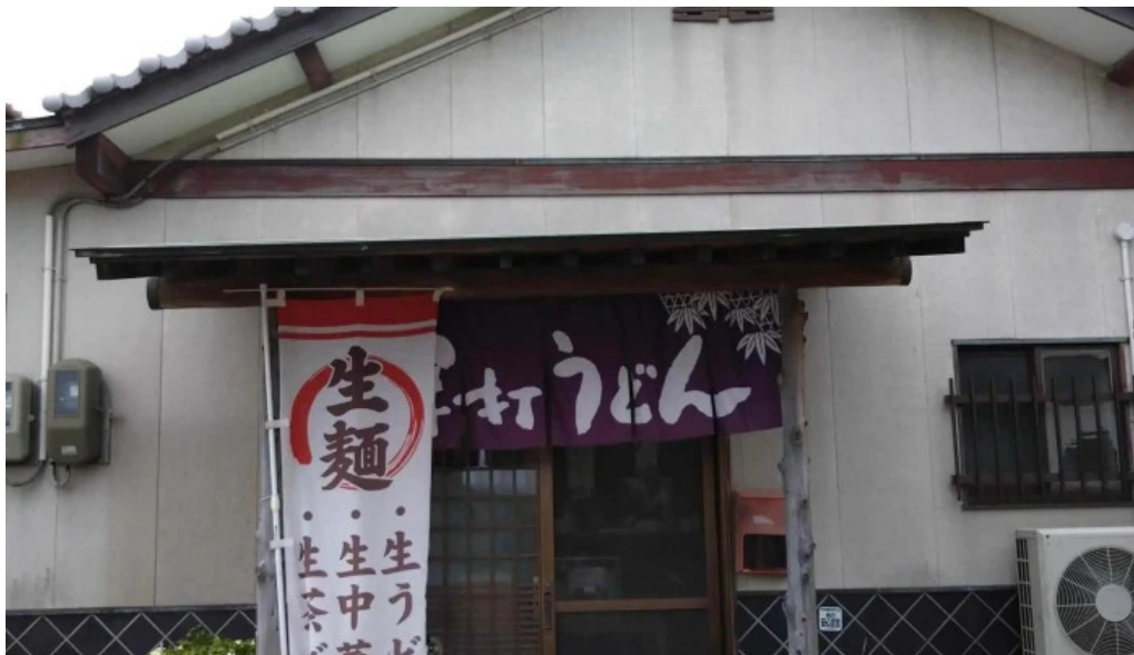
瀬戸うどん ウェブサイト