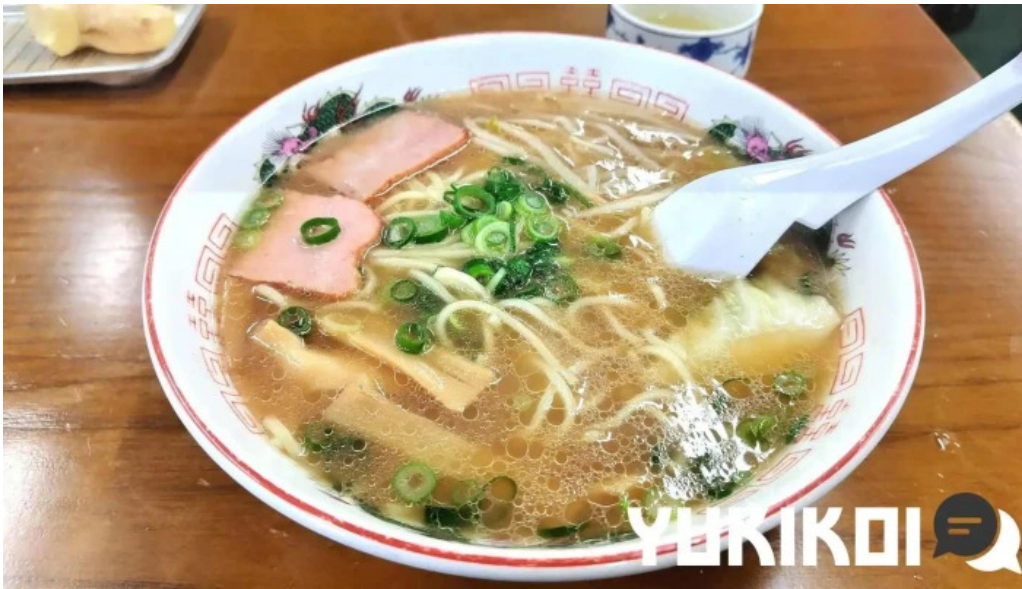
瀬戸うどん 料理飲み物