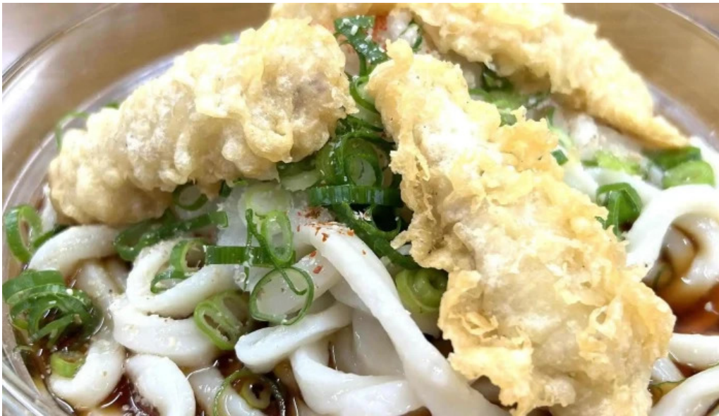
瀬戸うどん 営業時間