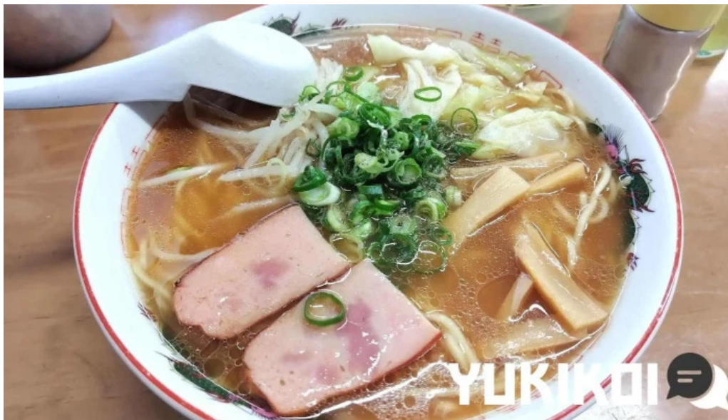
瀬戸うどん ラーメン