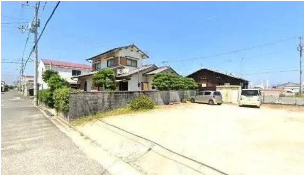
瀬戸うどん 観音寺市