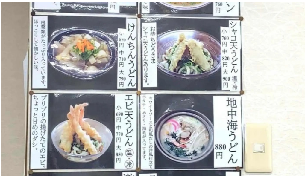
瀬戸うどんメニュー