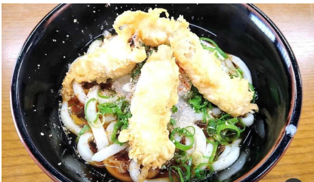
瀬戸うどん うどん