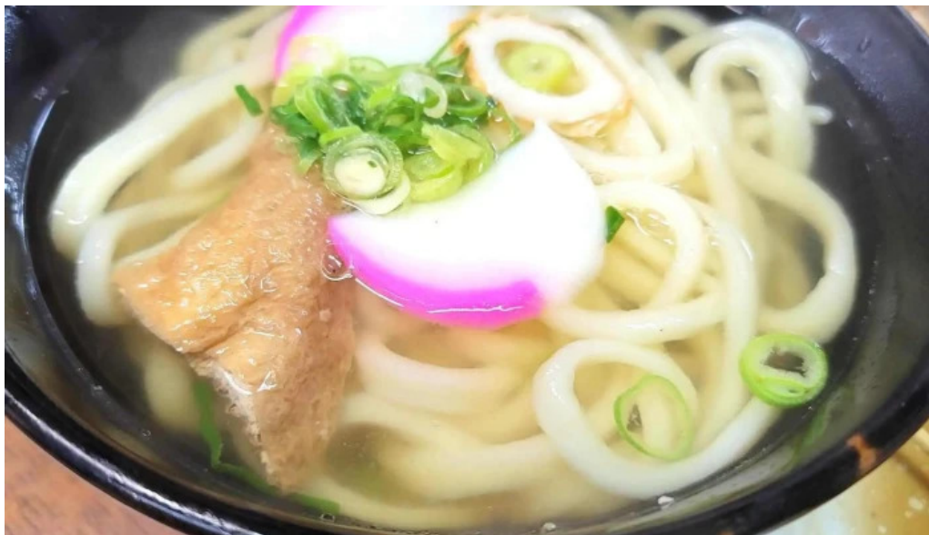
手打ちうどん かじまや うどん