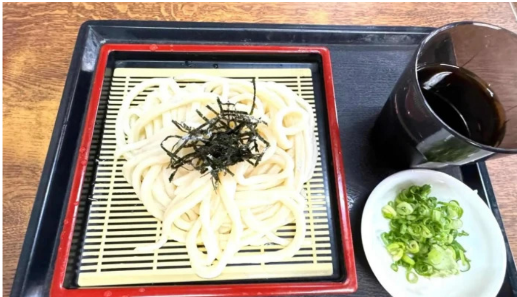
手打ちうどん かじまや ウェブサイト