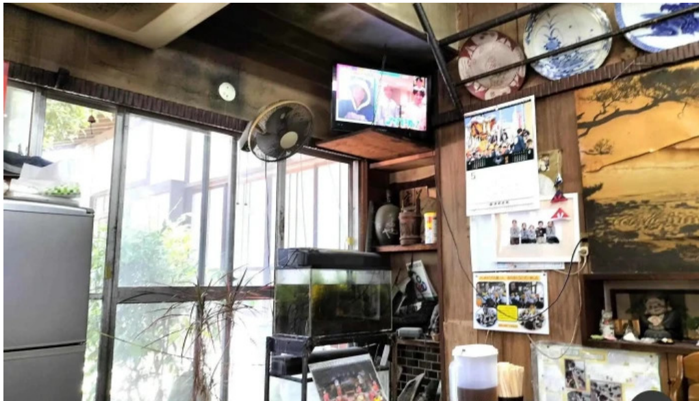
手打ちうどん かじまや 雰囲気