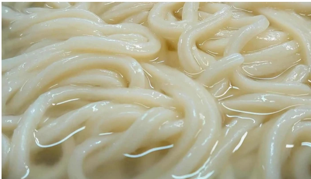
手打ちうどん かじまや エリア