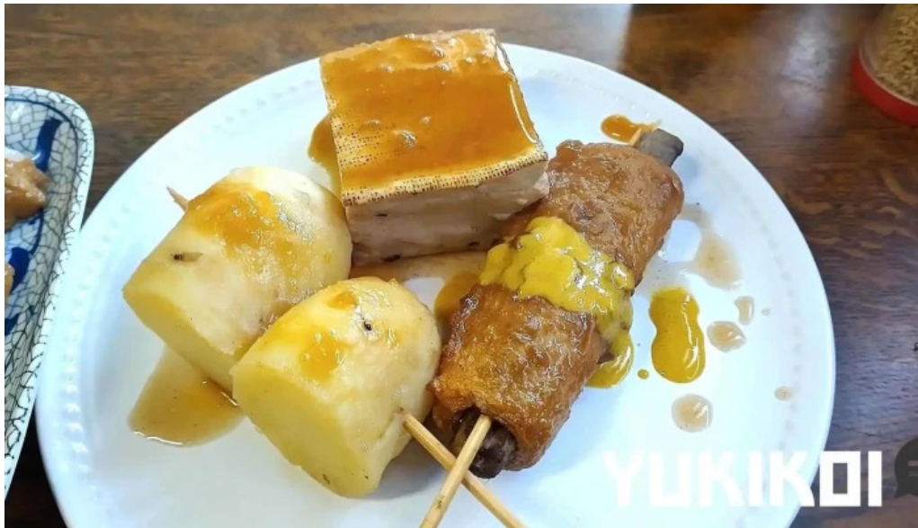
手打ちうどん かじまや 料理飲み物