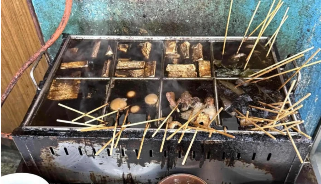
手打ちうどん かじまや 近く