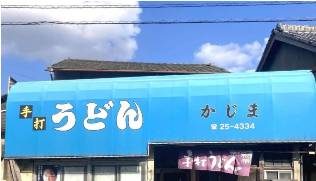
手打ちうどん かじまや 動画