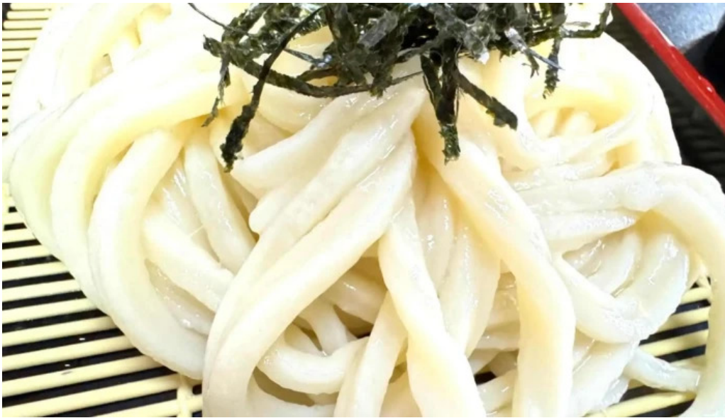
手打ちうどん かじまや 営業時間