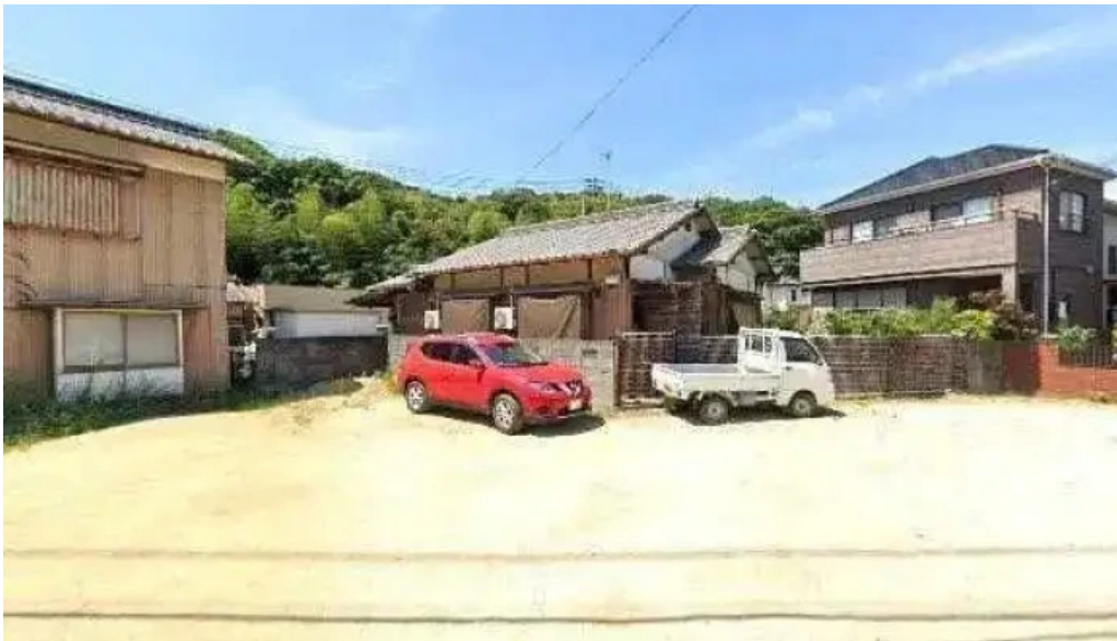
手打ちうどん かじまや 観音寺市