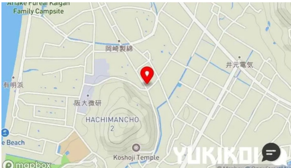
手打ちうどん かじまや 地図