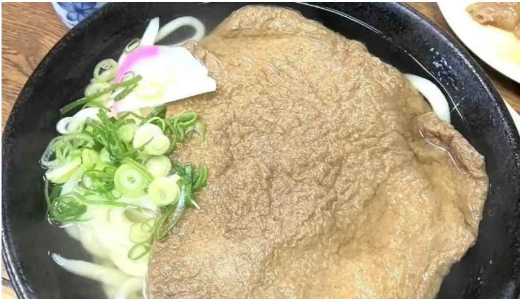
手打ちうどん かじまや 最新