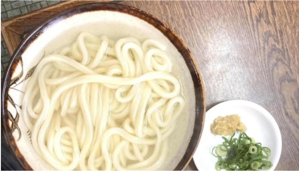
手打ちうどん かじまや 行き方