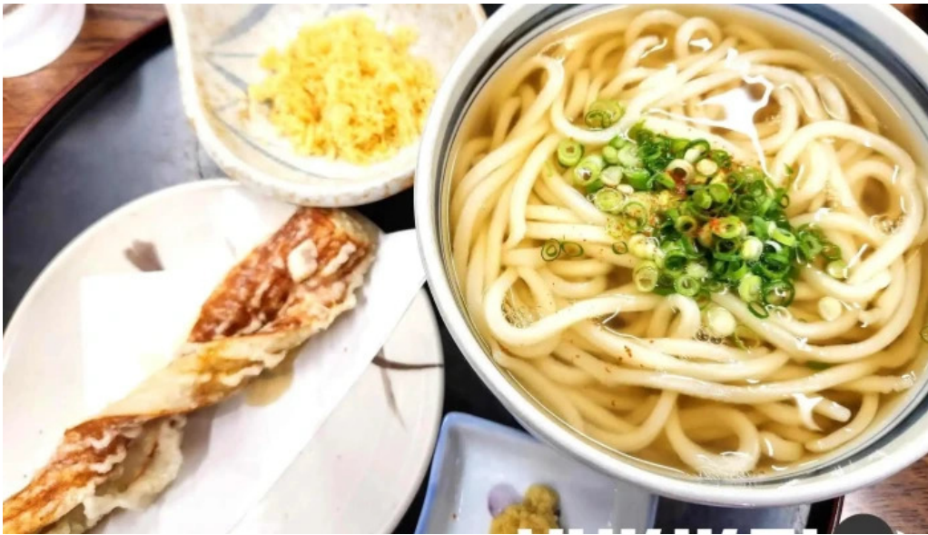
うどん好き 料理飲み物