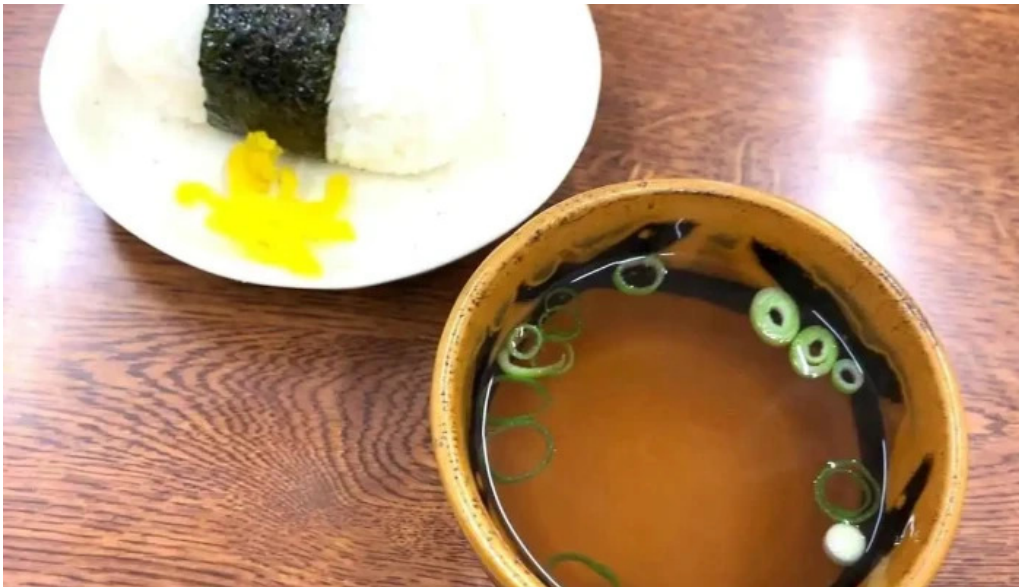
うどん好き おにぎり