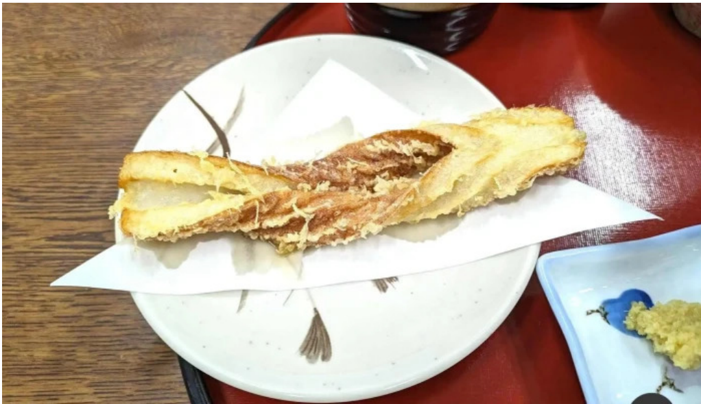
うどん好き 天ぷら