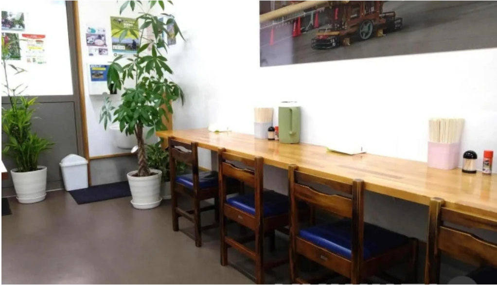
うどん好き 霧田気