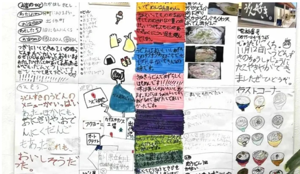
うどん好きメニュー