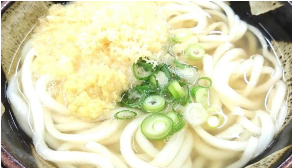
うどん好き 営業時間