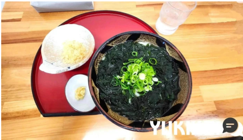
うどん好き ワカメ