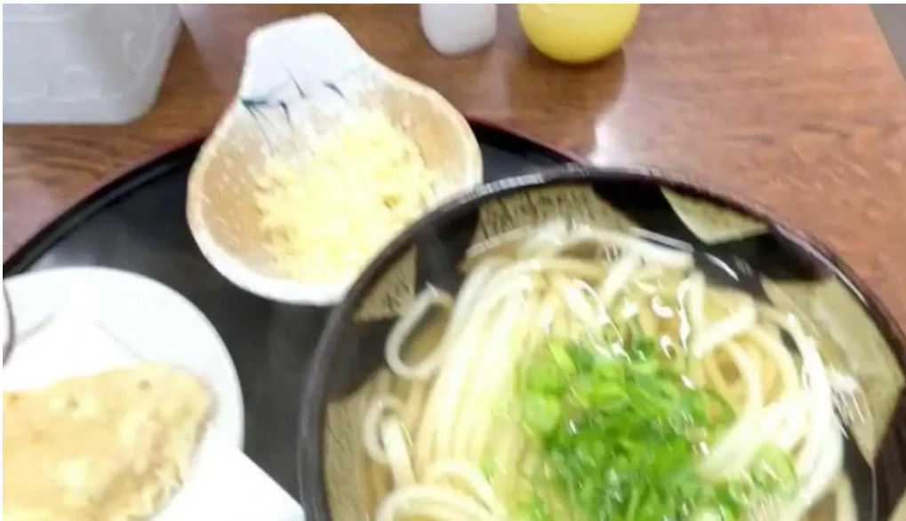
うどん好き うどん