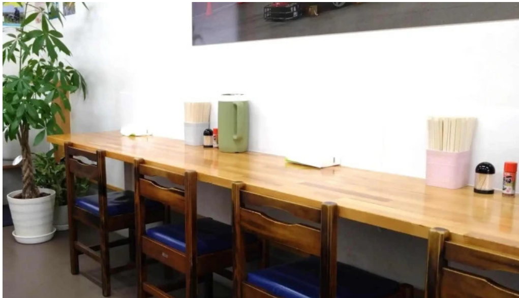
うどん好き エリア