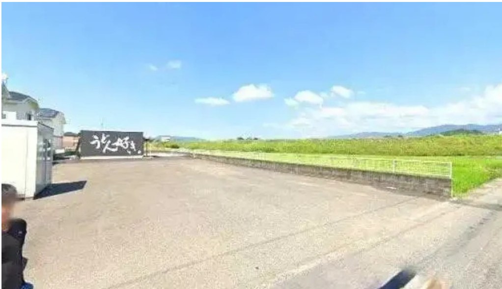
うどん好き 観音寺市