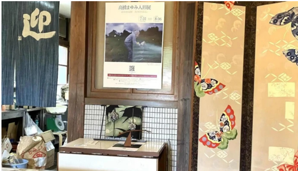
善長庵 comentario 2