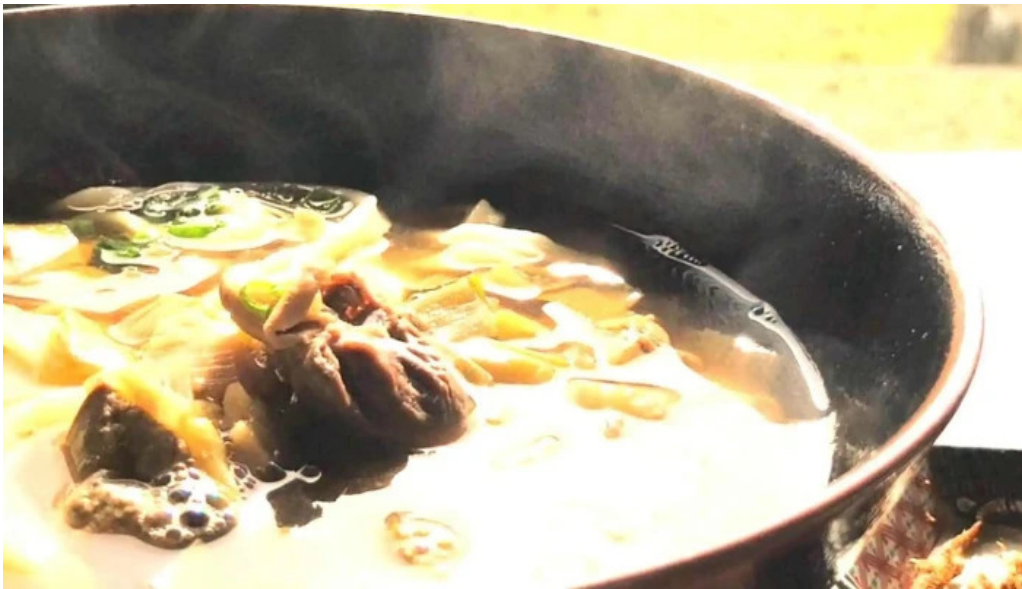
善長庵 comentario 5