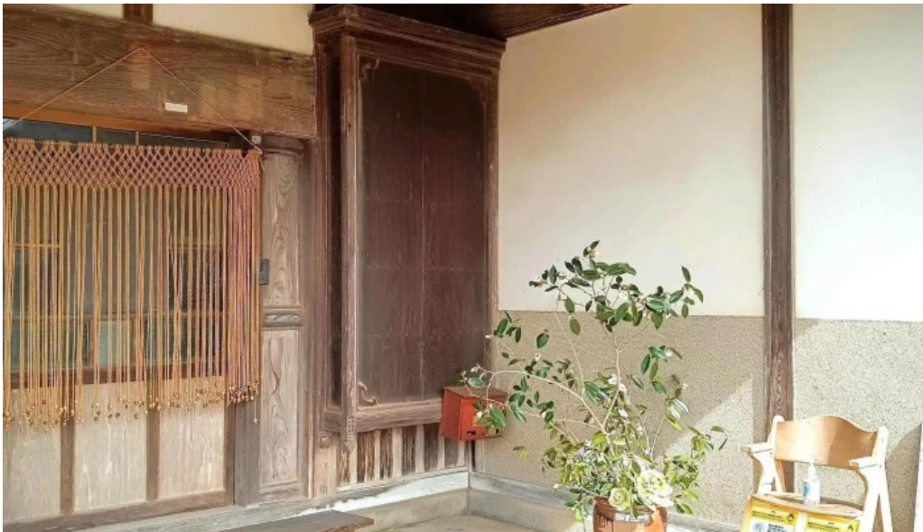
善長庵 comentario 7