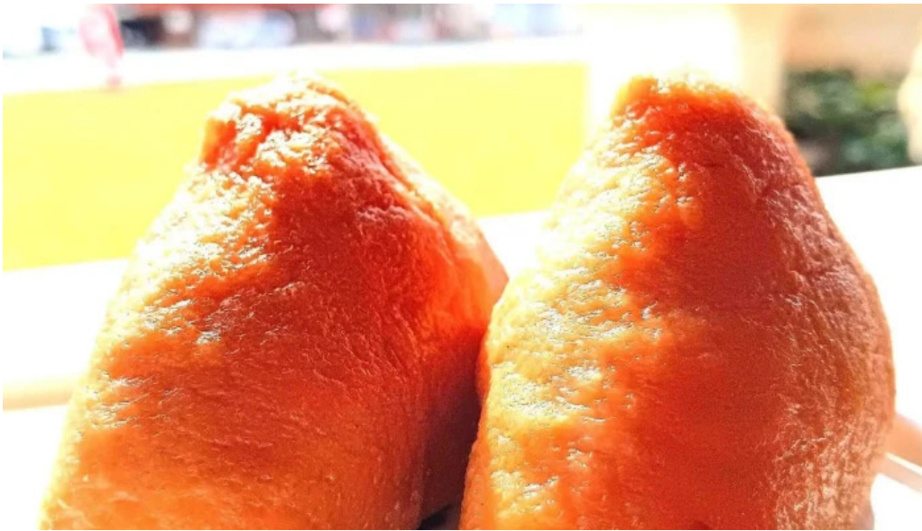
善長庵 comentario 4