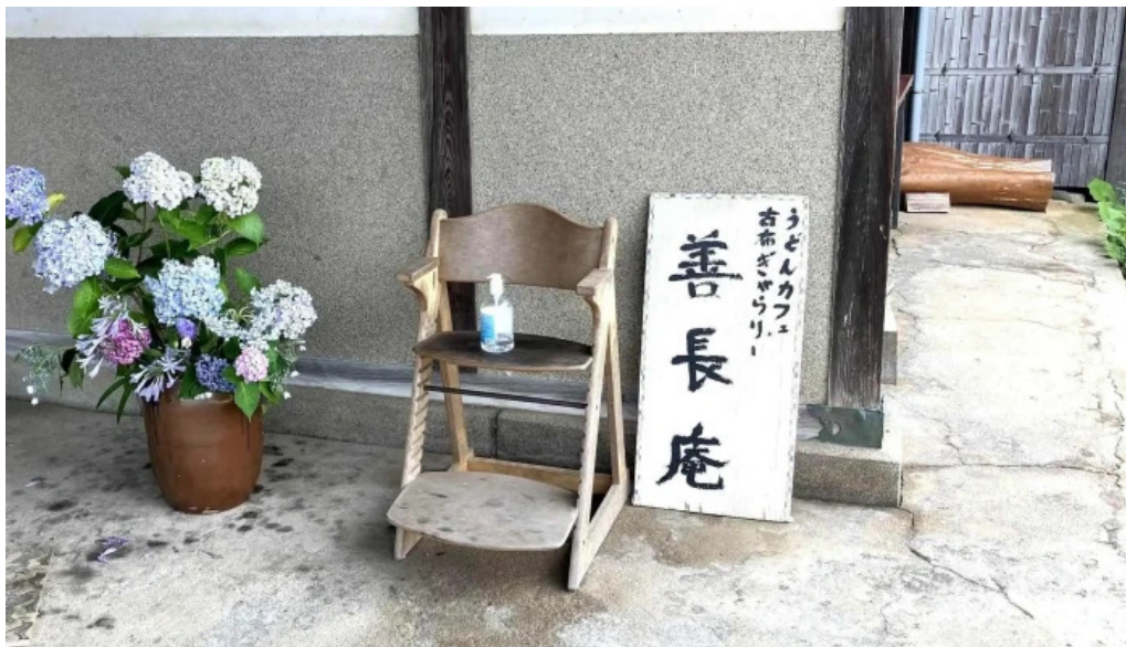
善長庵 comentario 1