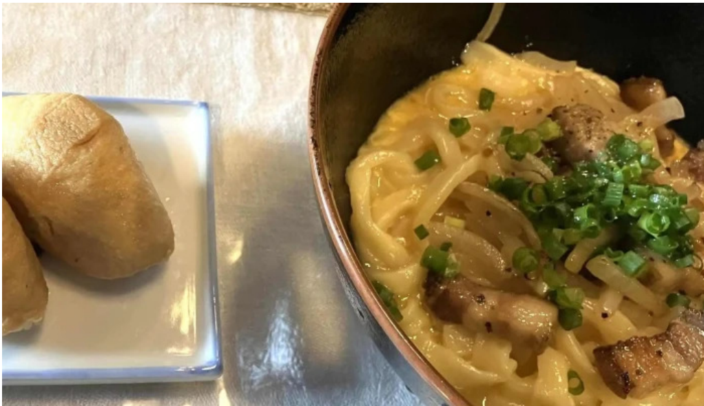
善長庵 comentario 3