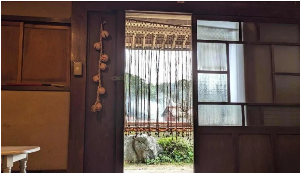
善長庵 comentario 9