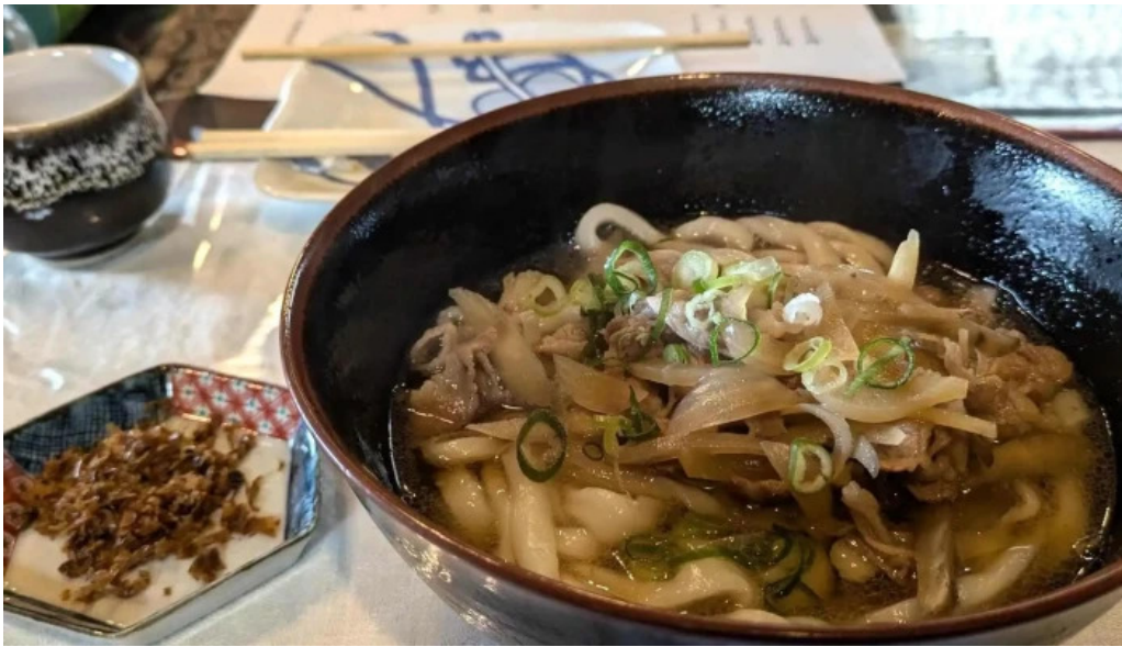
善長庵 comentario 8