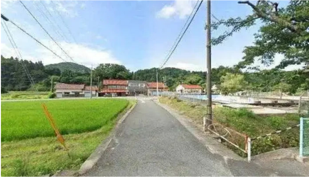
善長庵 ストリートビューと 360 ビュー