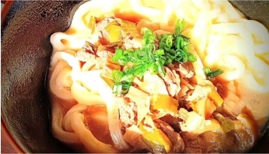
善長庵 comentario 6