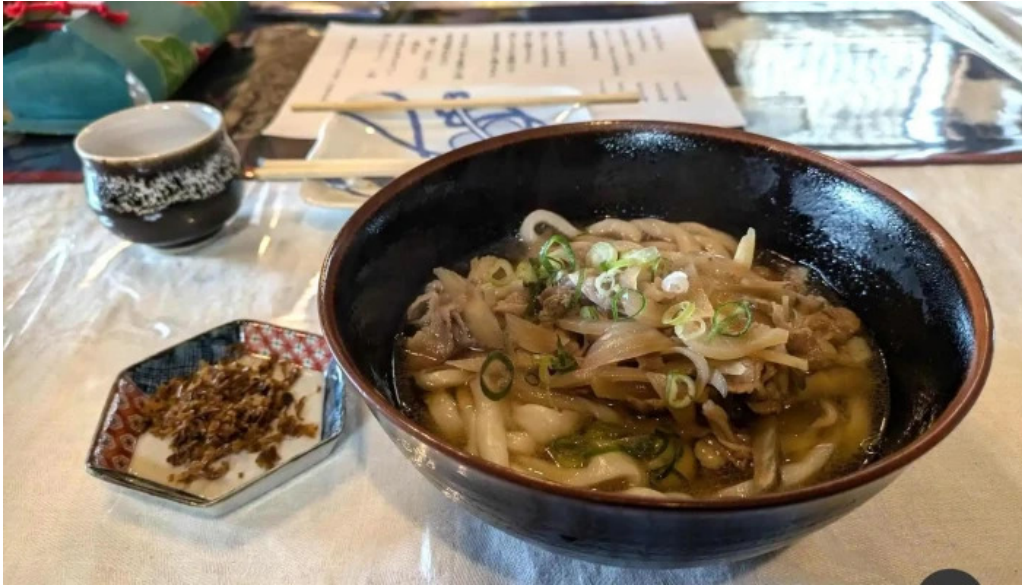
善長庵 料理飲み物