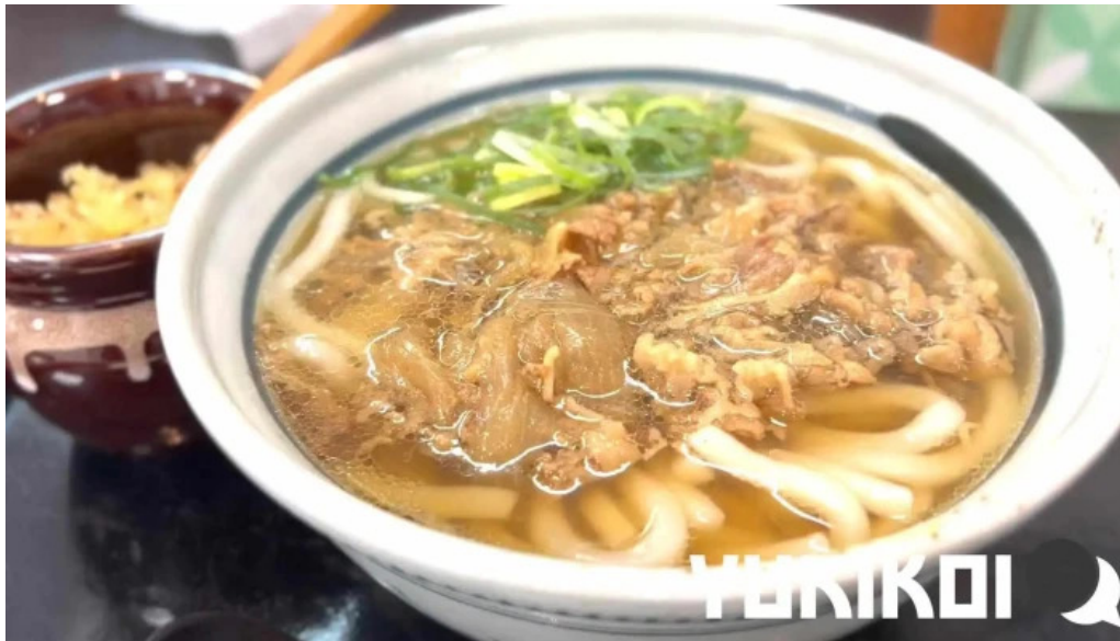
枚方市 うどんそば たなかや うどん