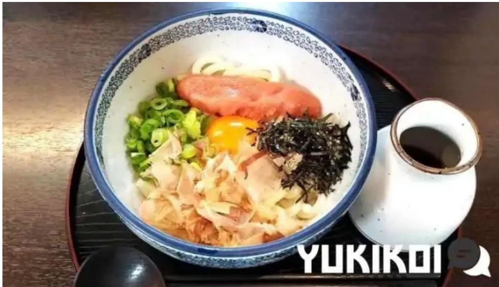
枚方市 うどんそば たなかや 料理飲み物