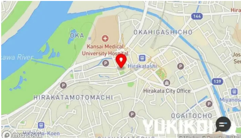
枚方市 うどんそば たなかや 地図