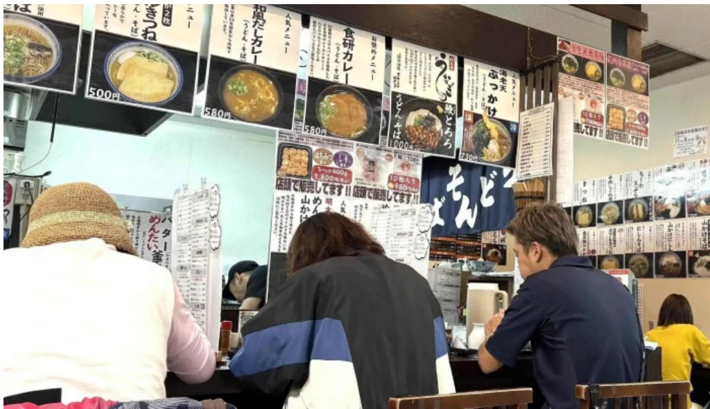
枚方市 うどんそば たなかや 営業中