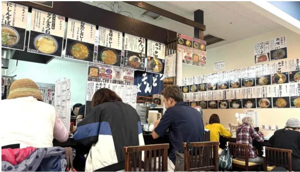
枚方市 うどんそば たなかや 雰囲気