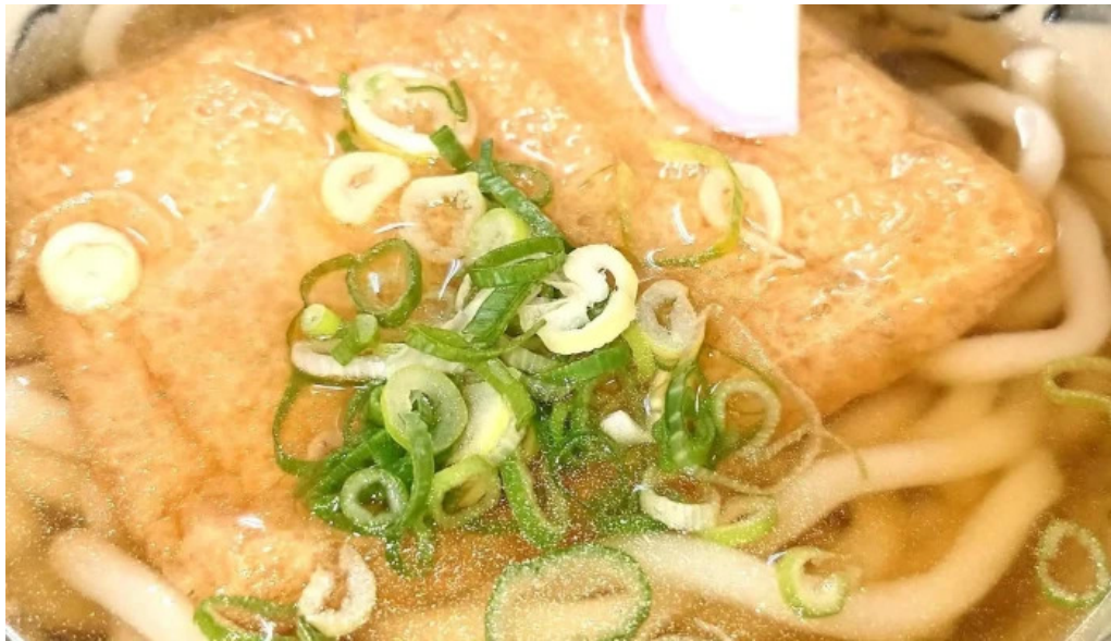
枚方市 うどんそば たなかや 所在地