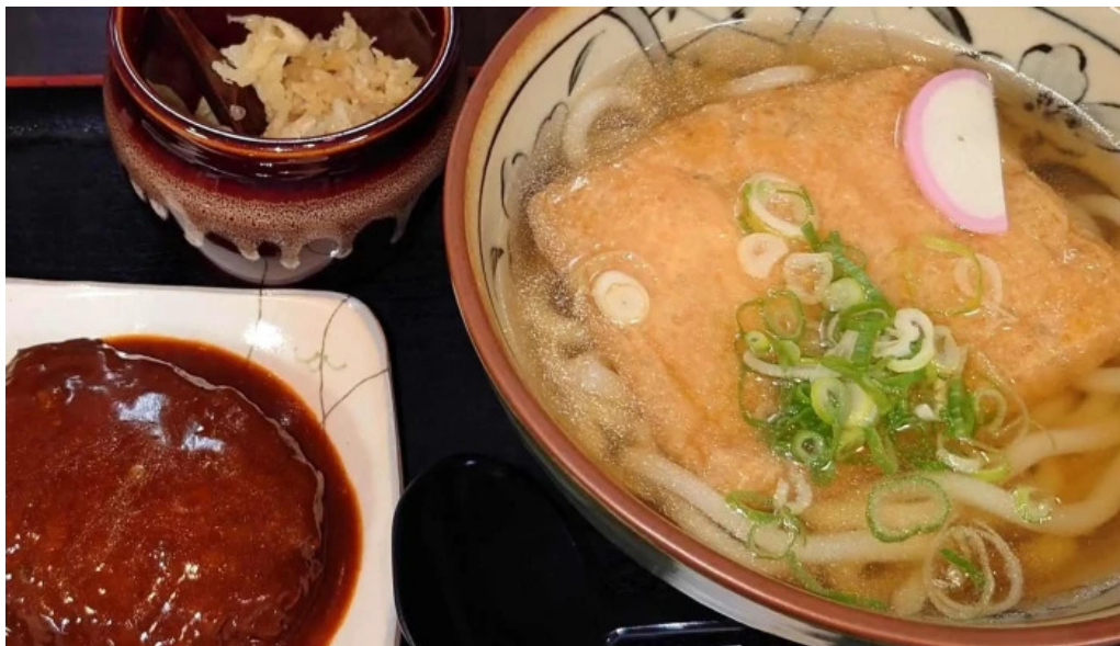
枚方市 うどんそば たなかや instagram