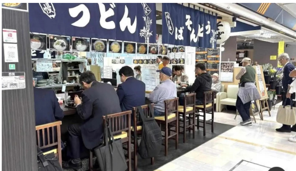
枚方市 うどん・そば たなかや 枚方市