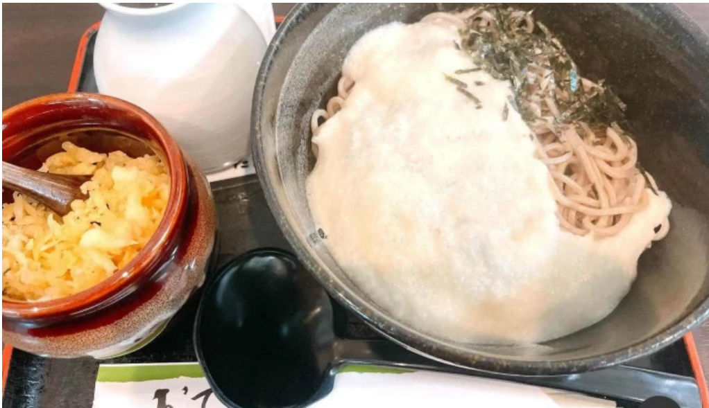
枚方市 うどんそば たなかや 最新