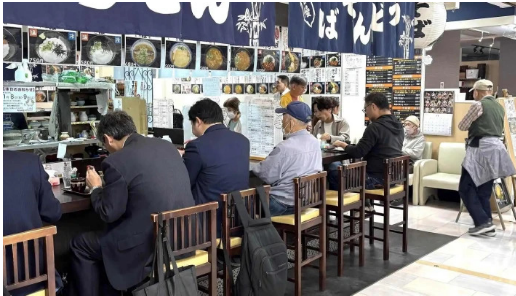
枚方市 うどんそば たなかや 行き方