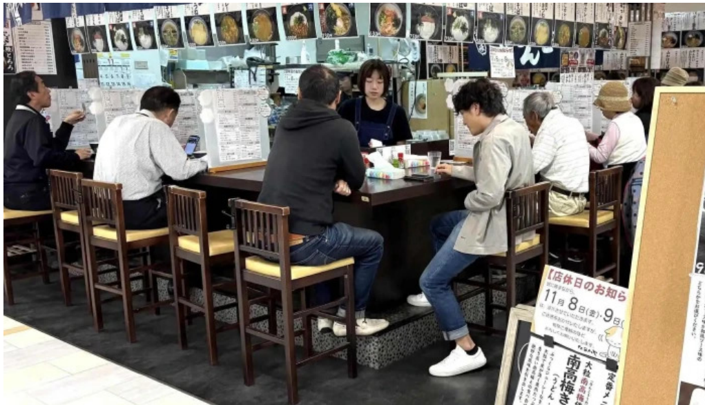
枚方市 うどんそば たなかや 動画