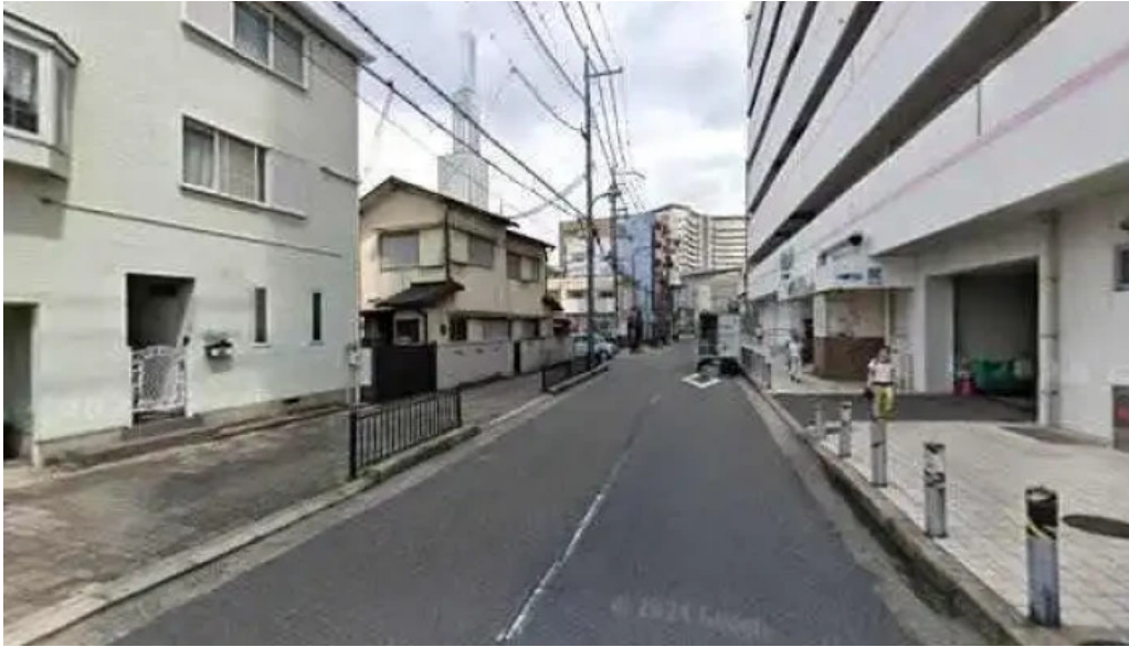
枚方市 うどんそば たなかや 枚方市