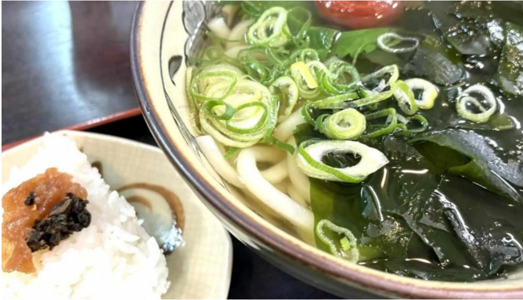
枚方市 うどんそば たなかや スコア