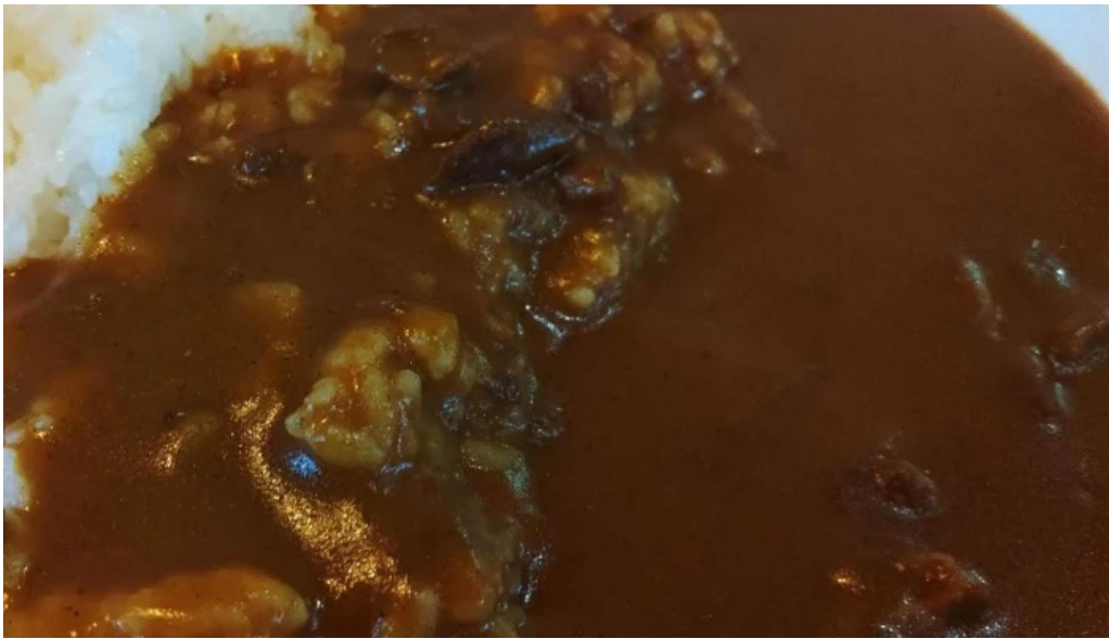
安兵衛うどん 所在地