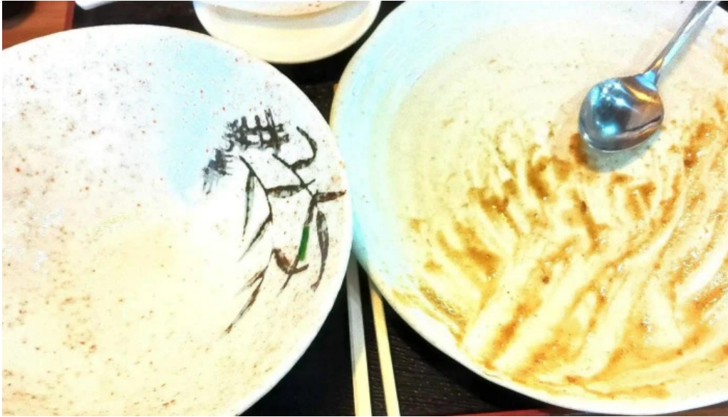
安兵衛うどん 営業時間