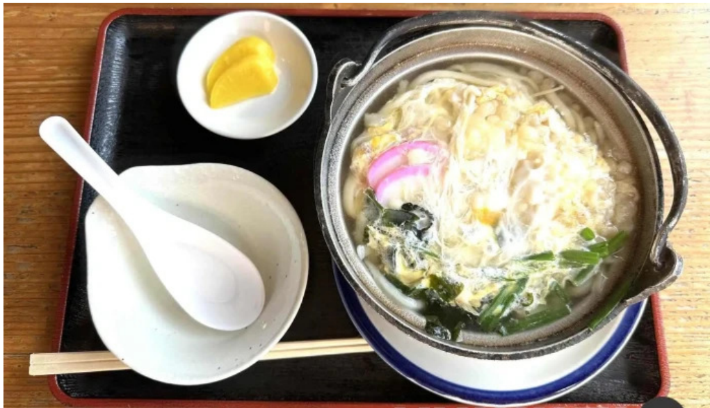
安兵衛うどん うどん