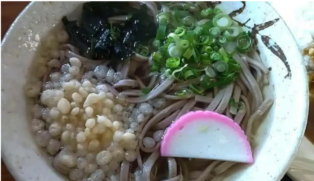
安兵衛うどん 動画