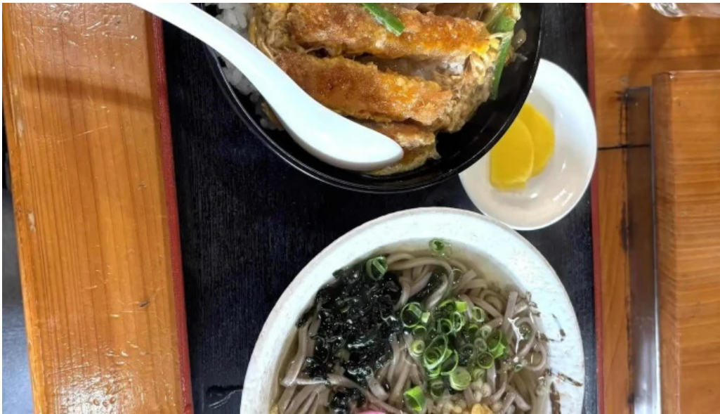
安兵衛うどん 最新