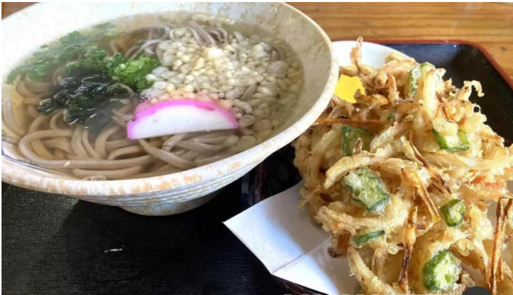
安兵衛うどん 料理飲み物