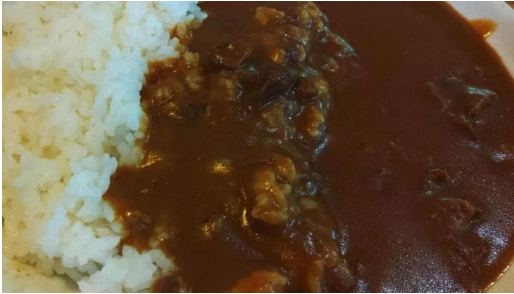
安兵衛うどん プロモーション