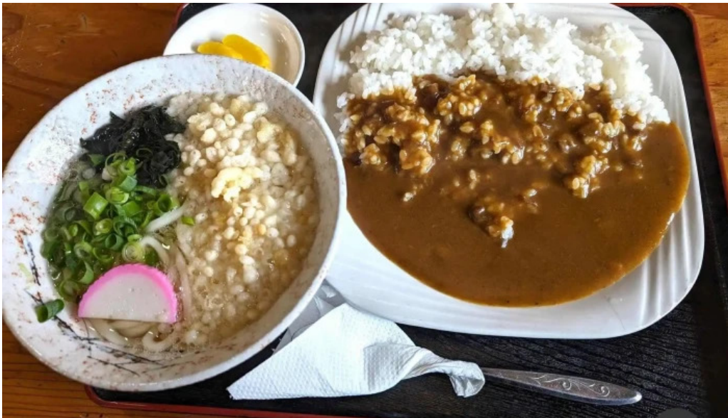
安兵衛うどん カレー