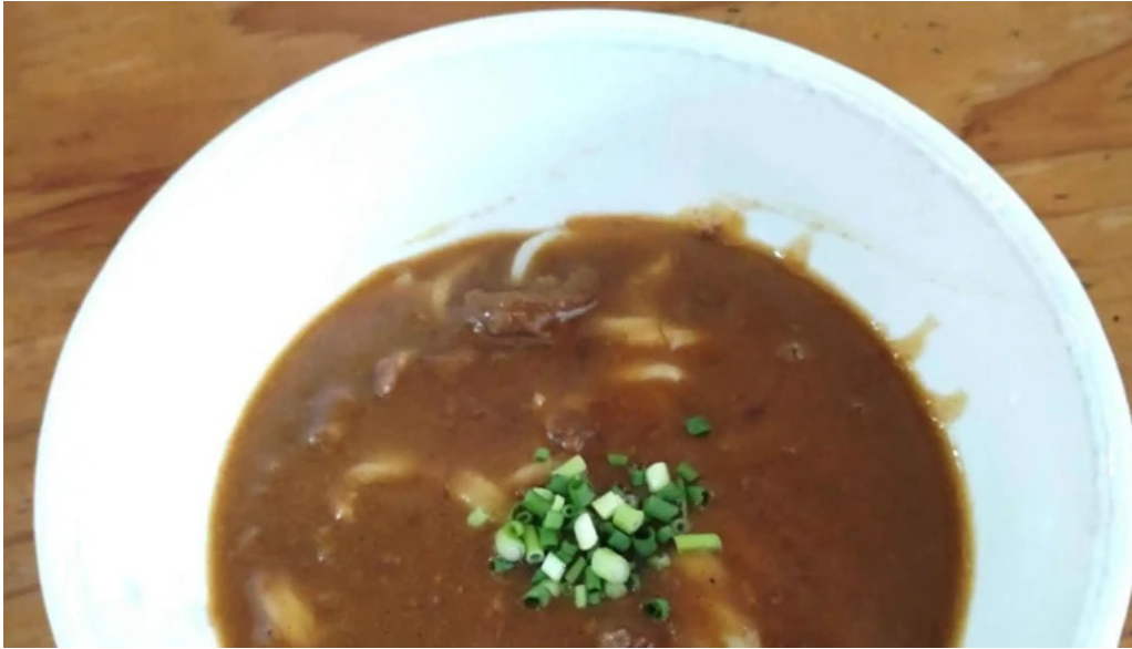
安兵衛うどん 住所