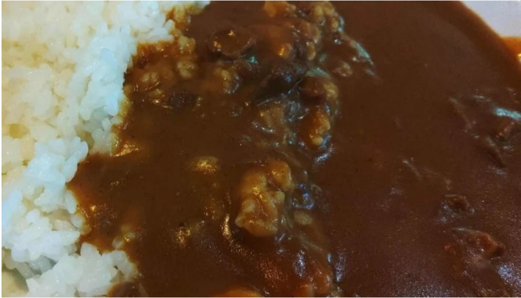
安兵衛うどん 近く