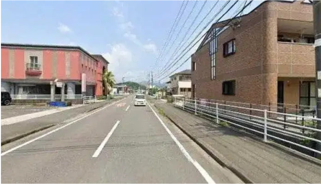
安兵衛うどん 日南市