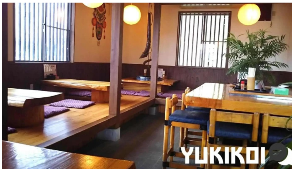
安兵衛うどん 霧団気