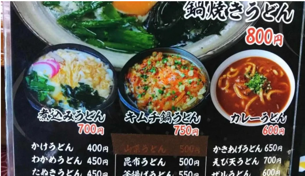
安兵衛うどん メニュー