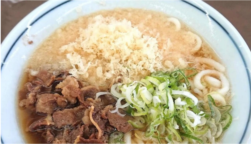
ゆんぼうどん コメント