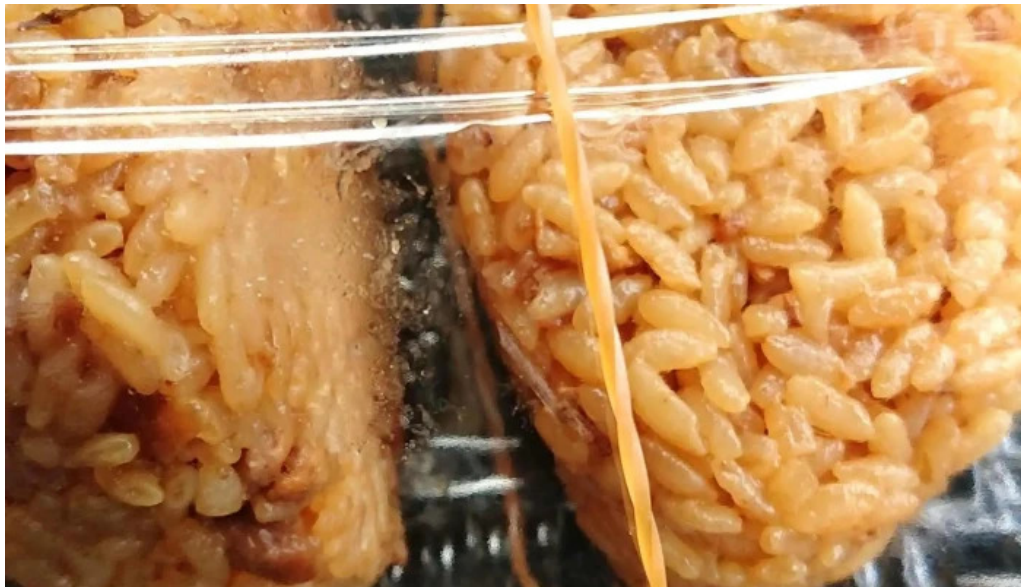
ゆんぼうどん 口コミ