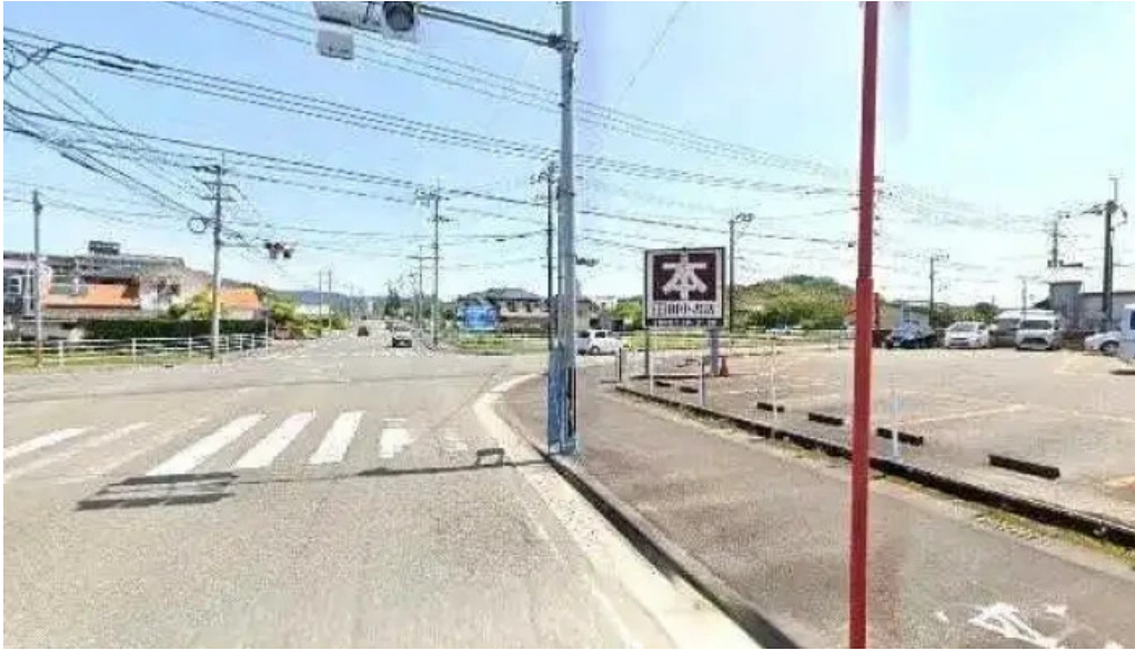
ゆんぼうどん 日南市