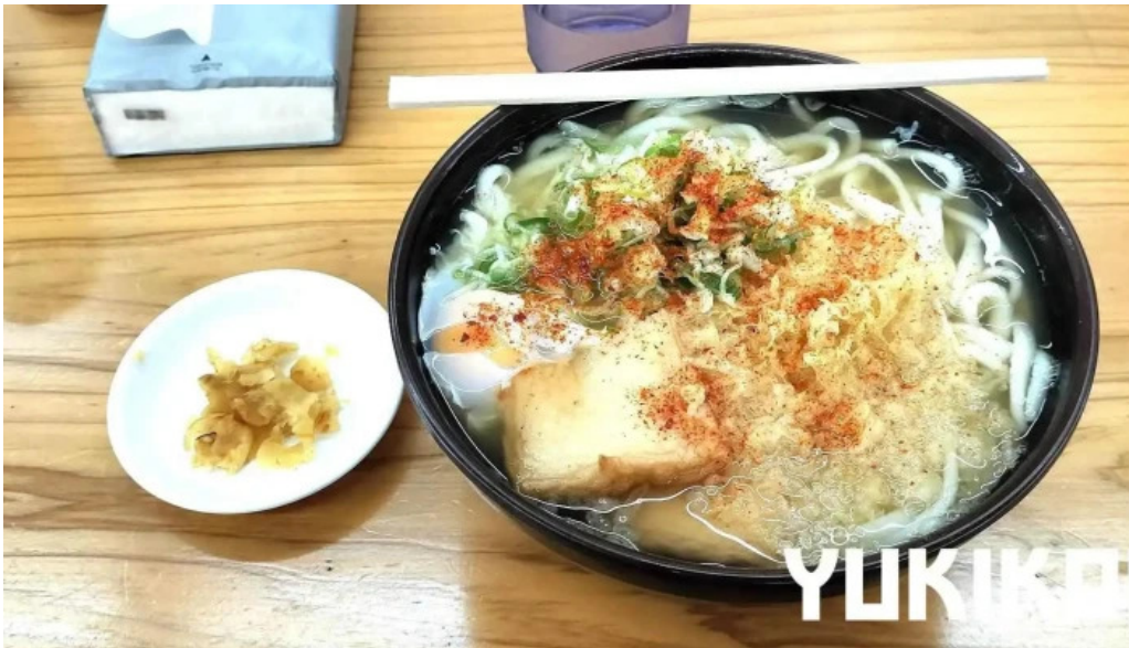
ゆんぼうどん 料理飲み物