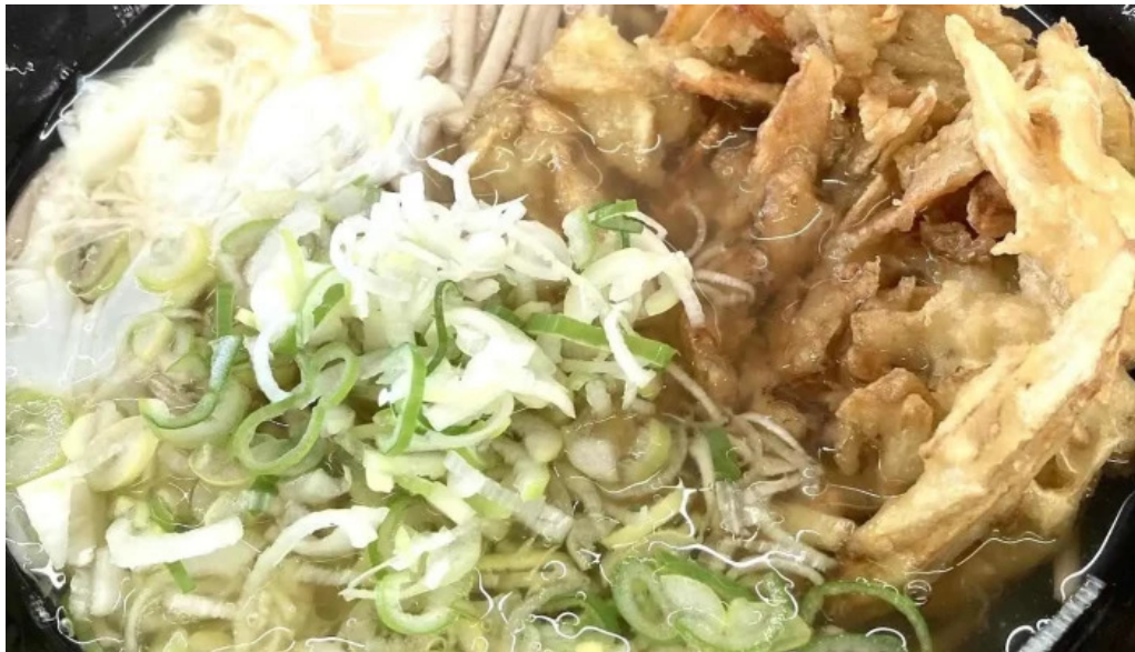
ゆんぼううどん 蕎麦