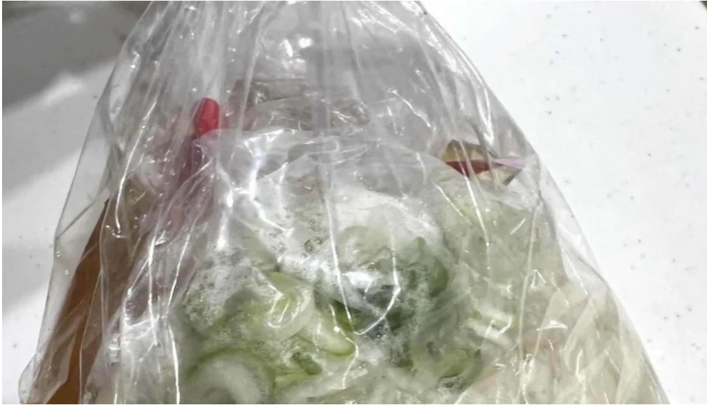
ゆんぼうどん 動画