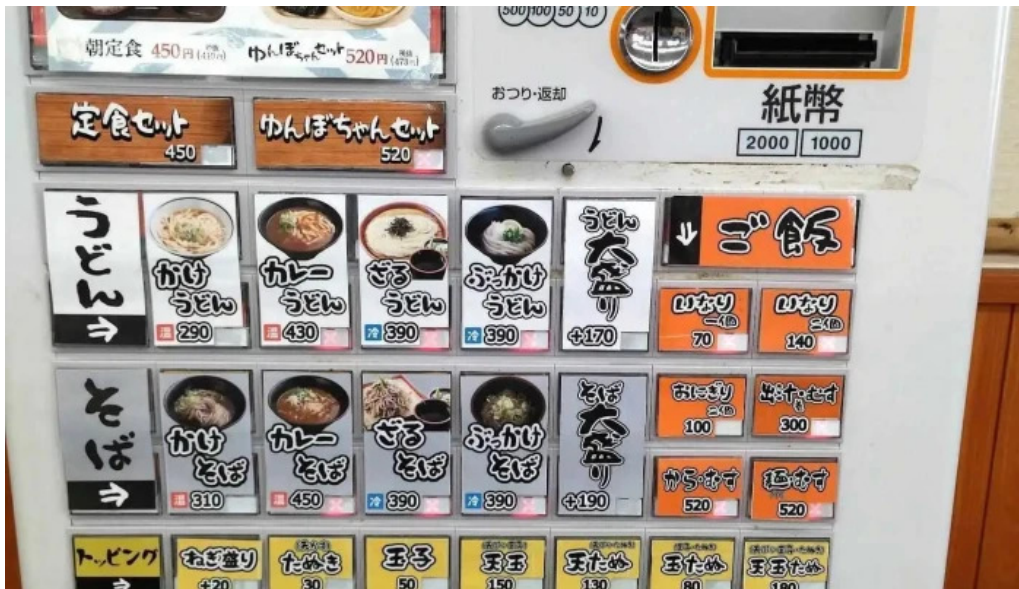
ゆんぼうどんメニュー