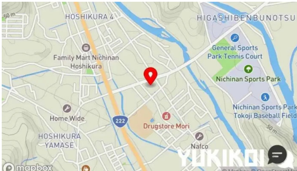
ゆんぼうどん 地図