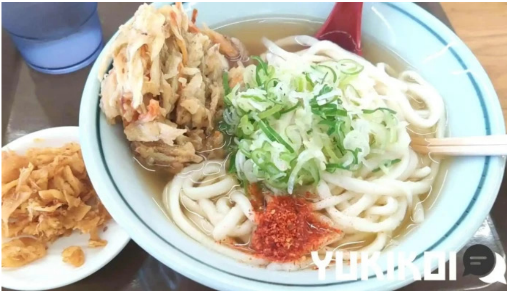
ゆんぼうどん うどん