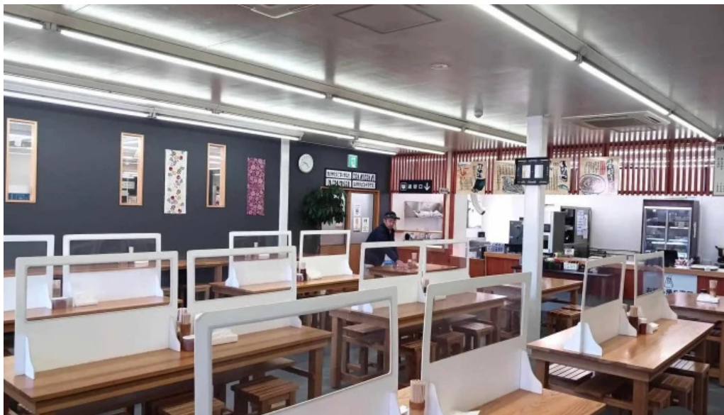
ゆんぼうどん 雰囲気