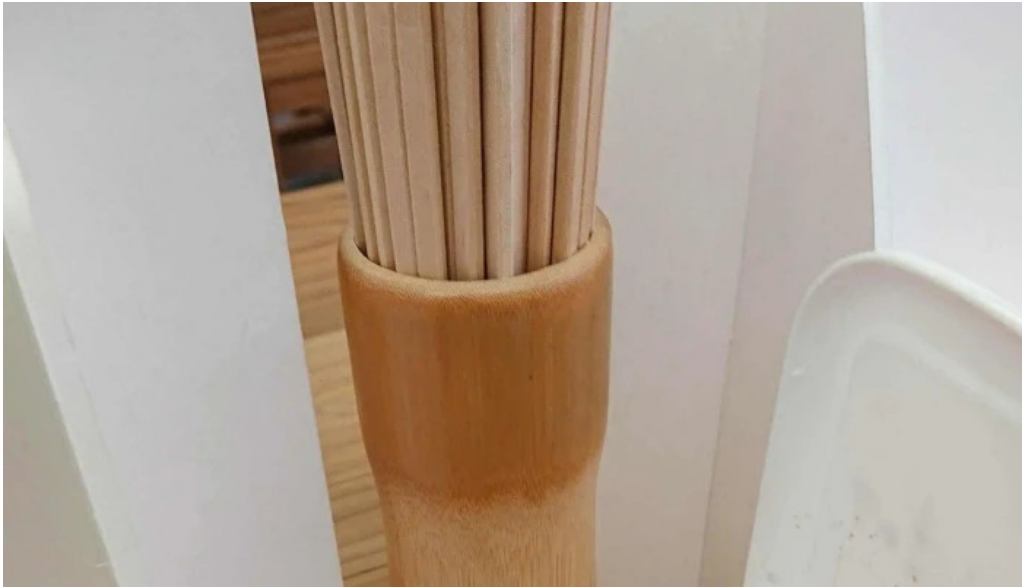
ゆんぼうどん 写真