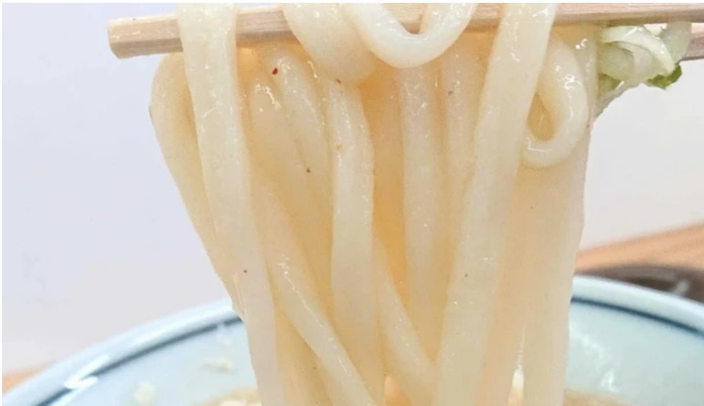
ゆんぼうどん スコア