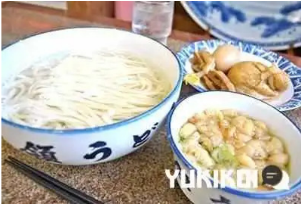
天領うどん 昭和町店 オーナー提供