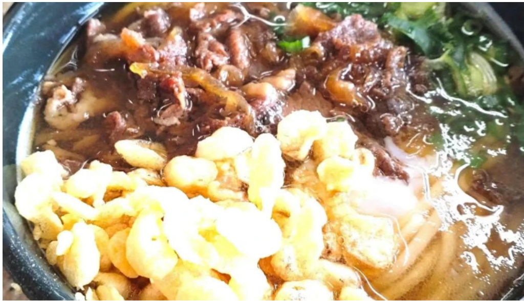
天領うどん 昭和町店 行き方