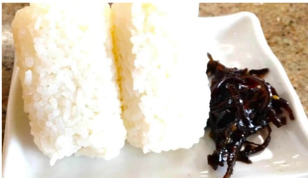
天領うどん 昭和町店 電話