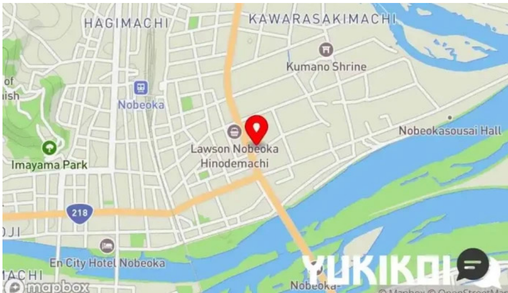
天領うどん 昭和町店 地図