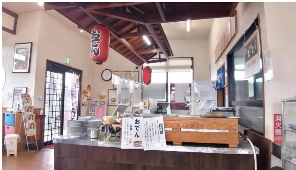
天領うどん 昭和町店 雰囲気