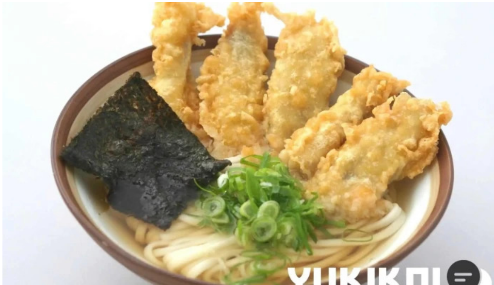
天領うどん 昭和町店 うどん