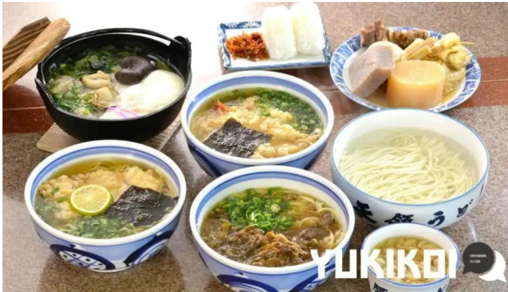
天領うどん 昭和町店 料理飲み物