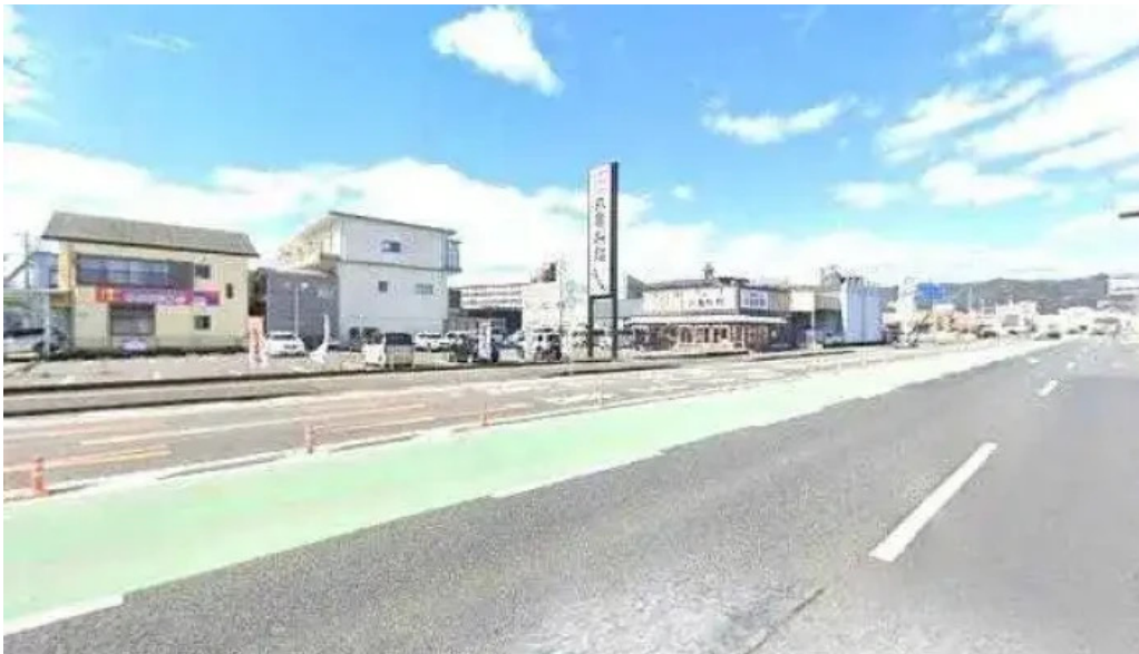
天領うどん 昭和町店 延岡市