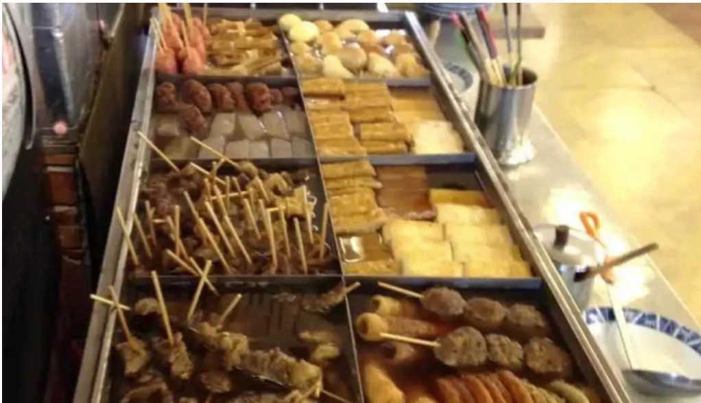
天領うどん 昭和町店 おでん