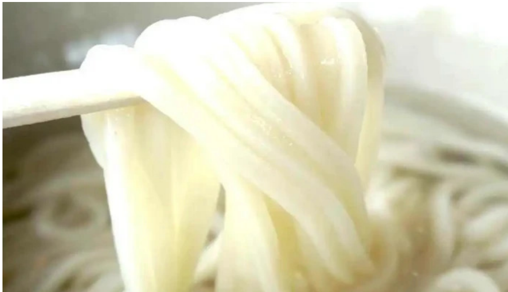
天領うどん 昭和町店 動画