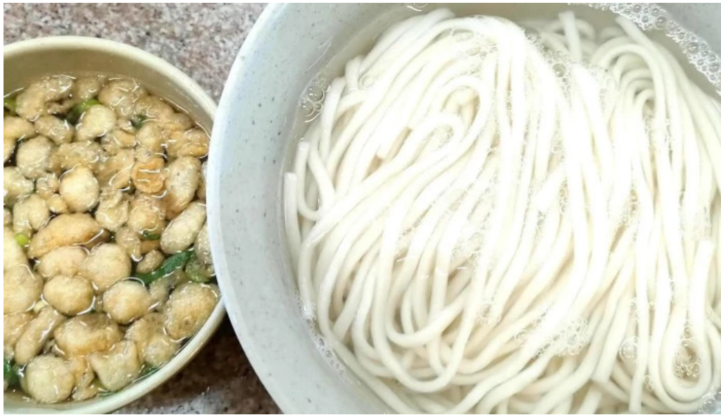
天領うどん 昭和町店 コメント