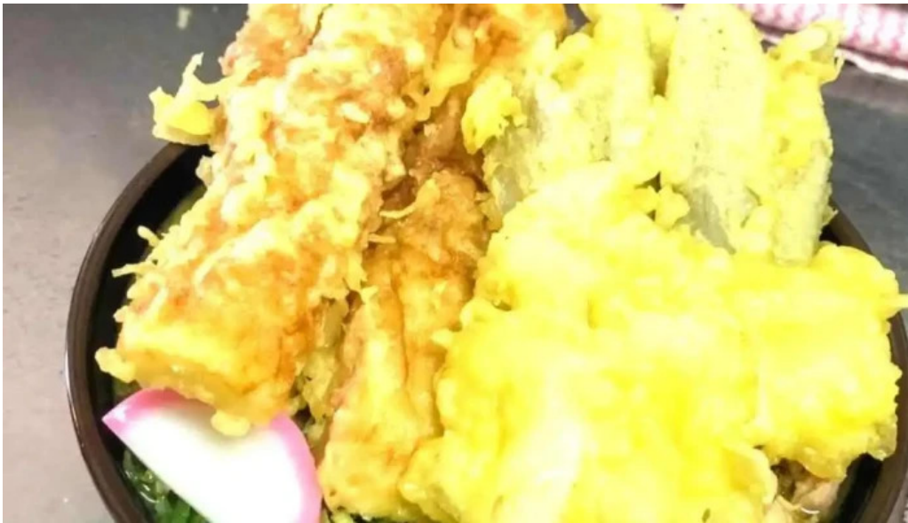
かどや 料理飲み物